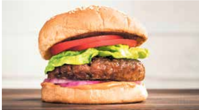
Sembla una hamburguesa de carn, però no ho és.

Fa pocs anys ningú sabia què coi era el tofu, el seitan o el tempeh, ni hi havia 'llets' vegetals, i ara en trobem a tots els supermercats; ens haguéssim fet un fart de riure si ens haguessin dit que una hamburguesa pot ser de llegums i verdures, i les prestatgeries també en són plenes.