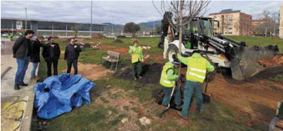
Aquests dies els alumnes estan plantant 25 arbres al voltant de l'Skate Park.