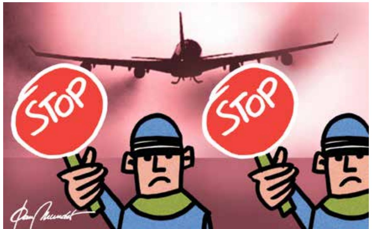
© i els avions, pegatines. || JOAN MUNDET

La ZBE ha enfrontat els que ho veuen desmesurat i als que volen anar més lluny