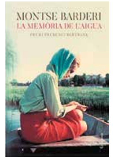
Portada del llibre.

És la història de tres generacions de dones: la Clemència, nascuda a Bellparatge a finals del segle XIX; la seva filla Rosalia, que viurà tot el procés d'industrialització, i la Núria, neta de la Clemència, que lluitarà per tenir la formació, la llibertat sexual i l'amor que no van tenir mai la mare ni l'àvia. La misèria, el maltractament, la incomunicació i la discriminació marquen les vides d'aquestes dones a Catalunya més pobra. +