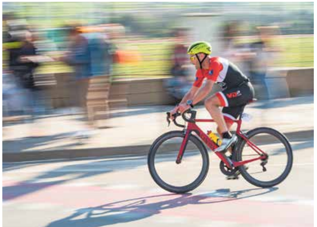
Un dels participants durant la cursa en bicicleta que va ocupar part de la Ronda Tolosa i de Llevant.