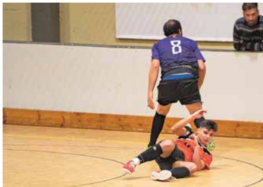
L'FS Castellar va caure contra un rival directe en la lluita per la salvació.

Pavelló Dani Pedrosa 10:30 benjamí A - UEH Barberà 11:45 aleví - UE Horta 13:00 júnior - Vilassar HC