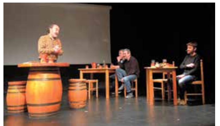
Un moment de l'acte 'De vins i de mots' amb David Vila a la dreta.

L'acte 'De vins i de mots' organitzat dissabte passat per Castellar per les Llibertats va rebre una molt bona acollida de públic a l'Ateneu. El plat fort va ser la presència de l'escriptor i rapsode David Vila i Ros, que va fer amb bon humor una passejada pel món del vi i dels contes. Vila i Ros també va aprofitar l'acte per presentar el seu darrer llibre La revolta de Cramòvia i altres contes , molts d'ells microcontes. + || REDACCIÓ