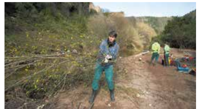
Alumnes de l'institut Les Garberes treballant a l'entorn del riu.

fluvials; visita de les obres realitzades i petits treballs de bioenginyeria. Per a l'activitat, cal portar botes, guants i avituallament personal. Les inscripcions per prendre part en aquesta jornada participativa i divulgativa es poden fer al SAC, a la plaça d'El Mirador presencialment o trucant al telèfon 93 714 40 40 fins aquest mateix divendres. El viver es troba en els camps del Mas Olivet, a Sant Feliu del Racó, a la carretera BV-1249, a 300 metres del pont de Turell. + || REDACCIÓ