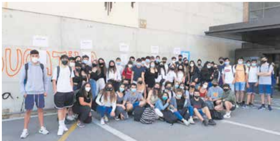
L'alumnat de l'Institut Castellar al segon dia de proves abans d'entrar a la Sala de Graus de l'Escola d'Enginyeria.