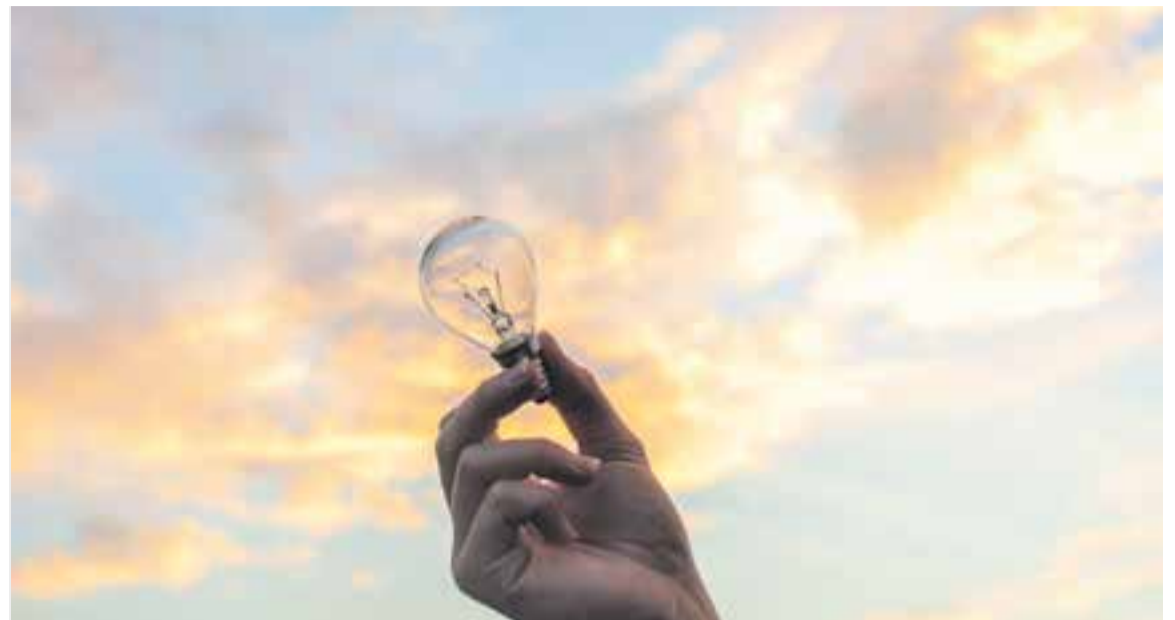
La nova factura elèctrica va entrar en vigor l'1 de juny.

Val a dir que, per a bona part de la ciutadania, és difícil reformular les rutines diàries, i el preu a l'alça en horari de màxima activitat pot representar un escull important, sobretot en casos de pobresa energètica. L'associació de defensa dels consumidors FACUA alerta que el rebut es podria disparar amb una pujada interanual