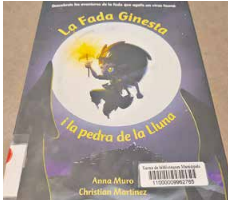
'La fada Ginesta i la pedra de la Lluna', d'Anna Muro. || M. ANTÚNEZ

Aquesta immersió en la natura pot ajudar a pal·liar altres problemes de salut associats al sedentarisme, a l'estrès o a l'addició a les noves tecnologies que tan està augmentant entre els