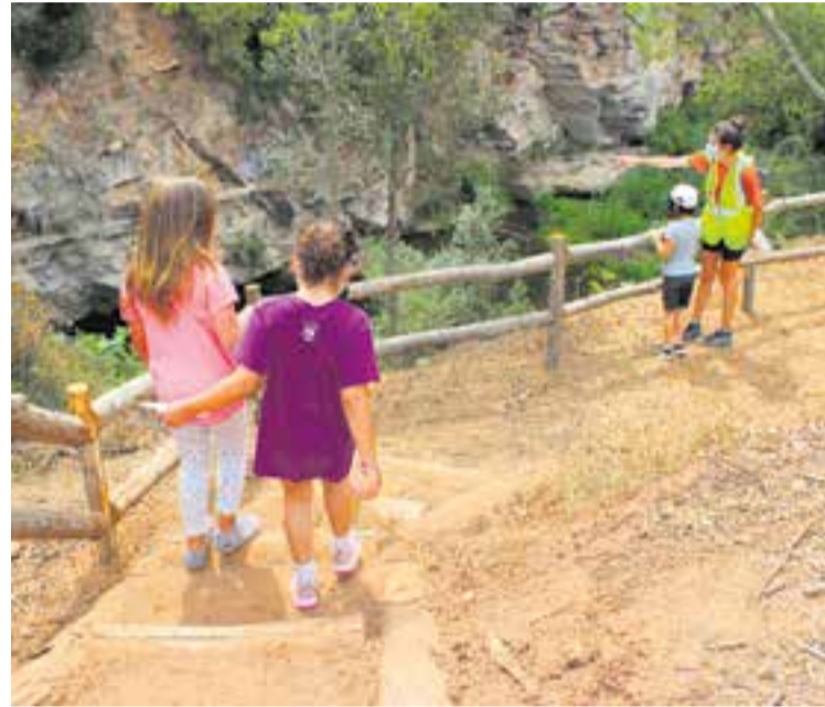
Mirador cap als gorgs del riu Ripoll, un dels indrets de l'itinerari.

Les famílies van poder gaudir d'un itinerari que recorre el riu Ripoll