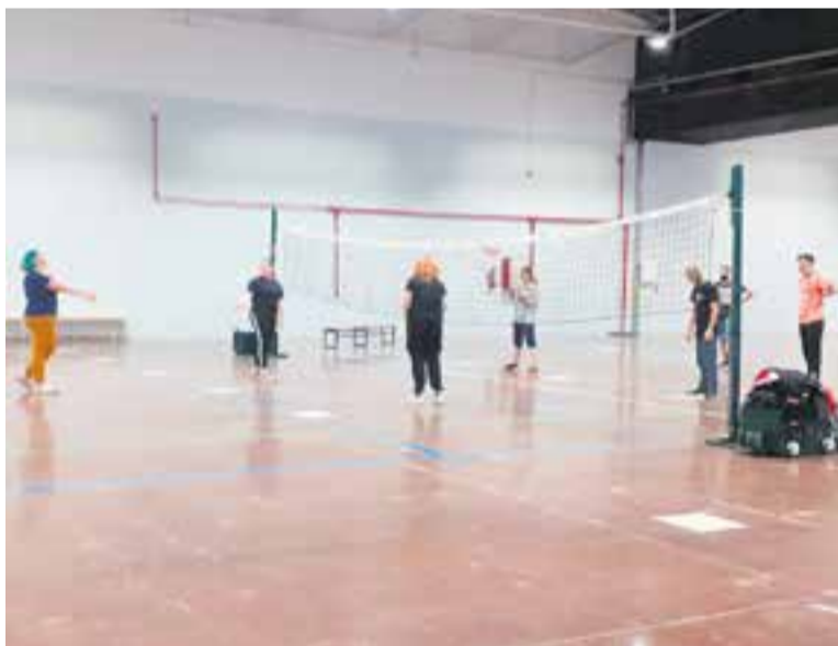
Nois fent activitat esportiva al Pati Obert de l'Espai Tolrà el cap de setmana.