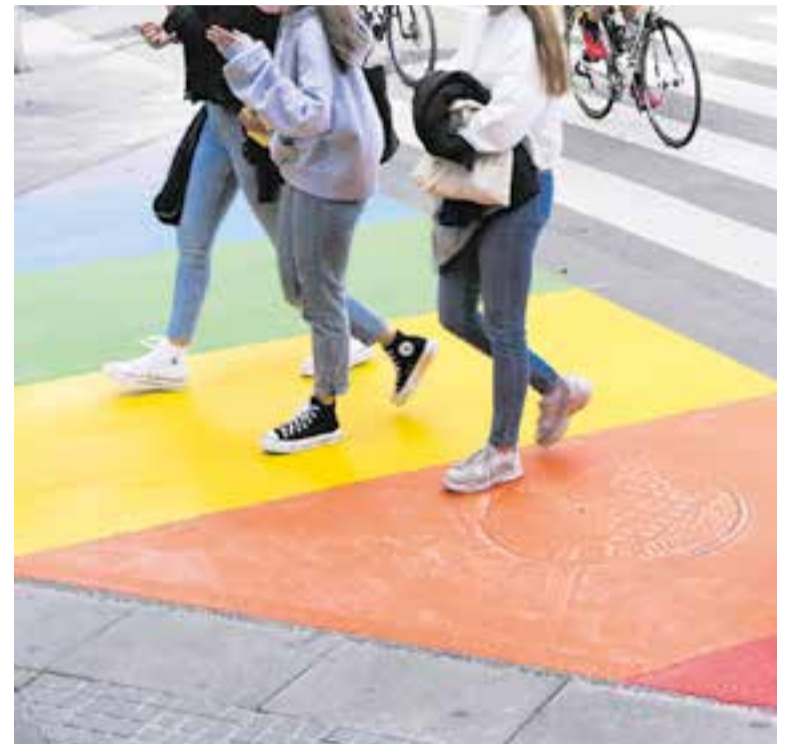
‘Omplim Castellar de Colors’ és el lema per commemorar el 28 de juny a la vila

Finalment, des de les regidories d'Educació i LGTBIQ+ s'ha tirat endavant una iniciativa que consistirà en la dinamització de diferents grups escolars dels centres castellarenques que pintaran diversos bancs de places del municipi i faran un treball educatiu que posarà èmfasi en el significat de la bandera LGTBI i la identificació dels conceptes bàsics d'aquest col·lectiu. Totes les activitats són gratuïtes. ✦