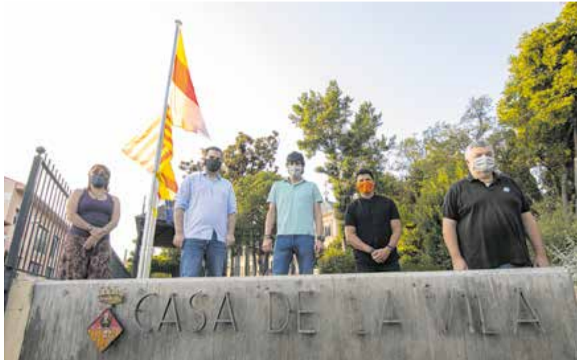
Una imatge d'arxiu dels cinc portaveus municipals d'aquest mandat després del darrer ple que es va fer presencial, fa un any.

4. "Quan les coses no estiguin tan superadades a la situació sanitària, creiem que encara es podran desenvolupar més projectes vinculats a l'ampliació de recursos d'inversió social, solidaritat, transició ecològica, accessibilitat i activitat econòmica. Són les nostres grans