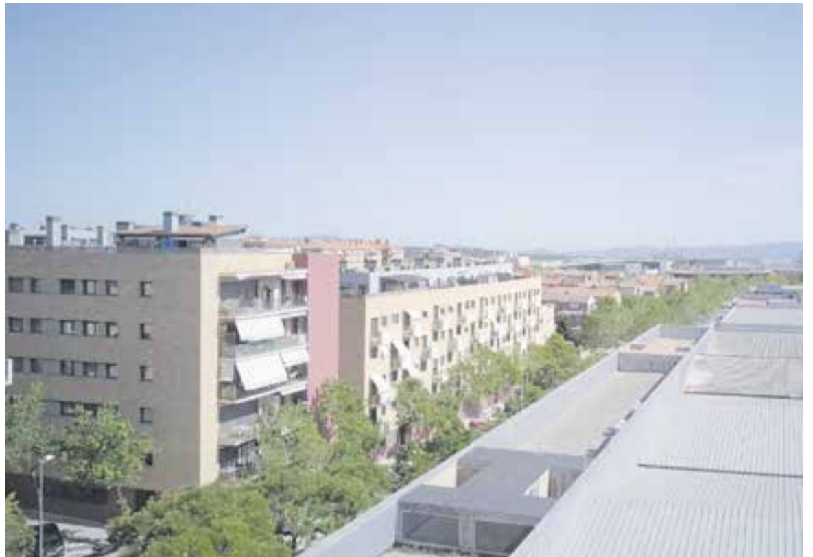
Una vista aèria de la coberta de l'Espai Tolrà on s'instal·laran 360 mòduls fotovoltaics en 600 m 2 de superfície.

A l'Espai Tolrà, primer es retirarà el fibrociment i es renovarà la teulada. Després, s'hi instal·laran 360 mòduls fotovoltaics en 600 m 2 de superfície que faran possible la