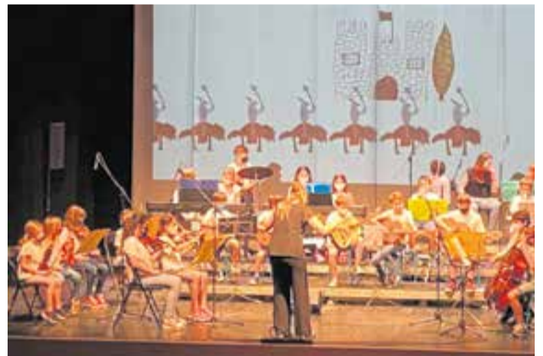
Actuació de l'Orquestra Infantil de l'Artcàdia. || ACCIÓ MUSICAL CASTELLAR

Serà un concert obert a tota la ciutadania i en què diverses formacions modernes mostraran part del seu repertori. En aquest sentit, des dels més joves fins als adults d'Acció Musical interpretaran temes variats per fer passar una bona estona en un entorn molt bonic a les portes de l'estiu d'aquest 2021. +