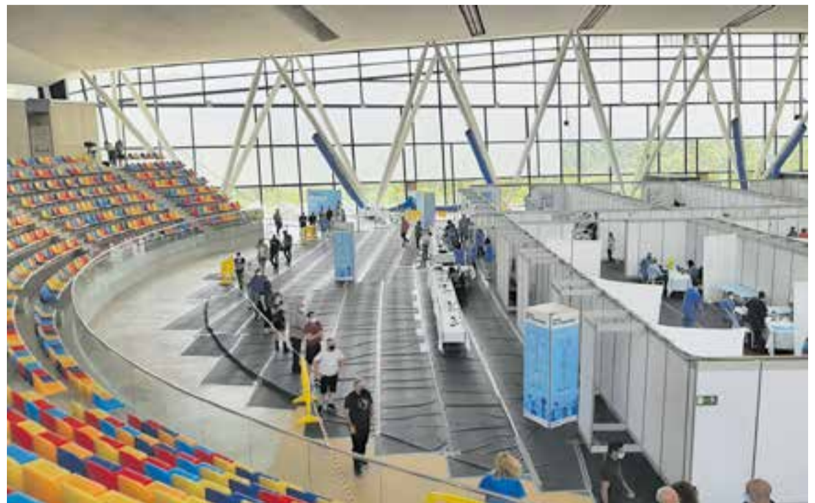
Cua a l'interior de la pista coberta d'atletisme de Sabadell, el punt de vacunació més gran de la regió sanitària de Castellar.