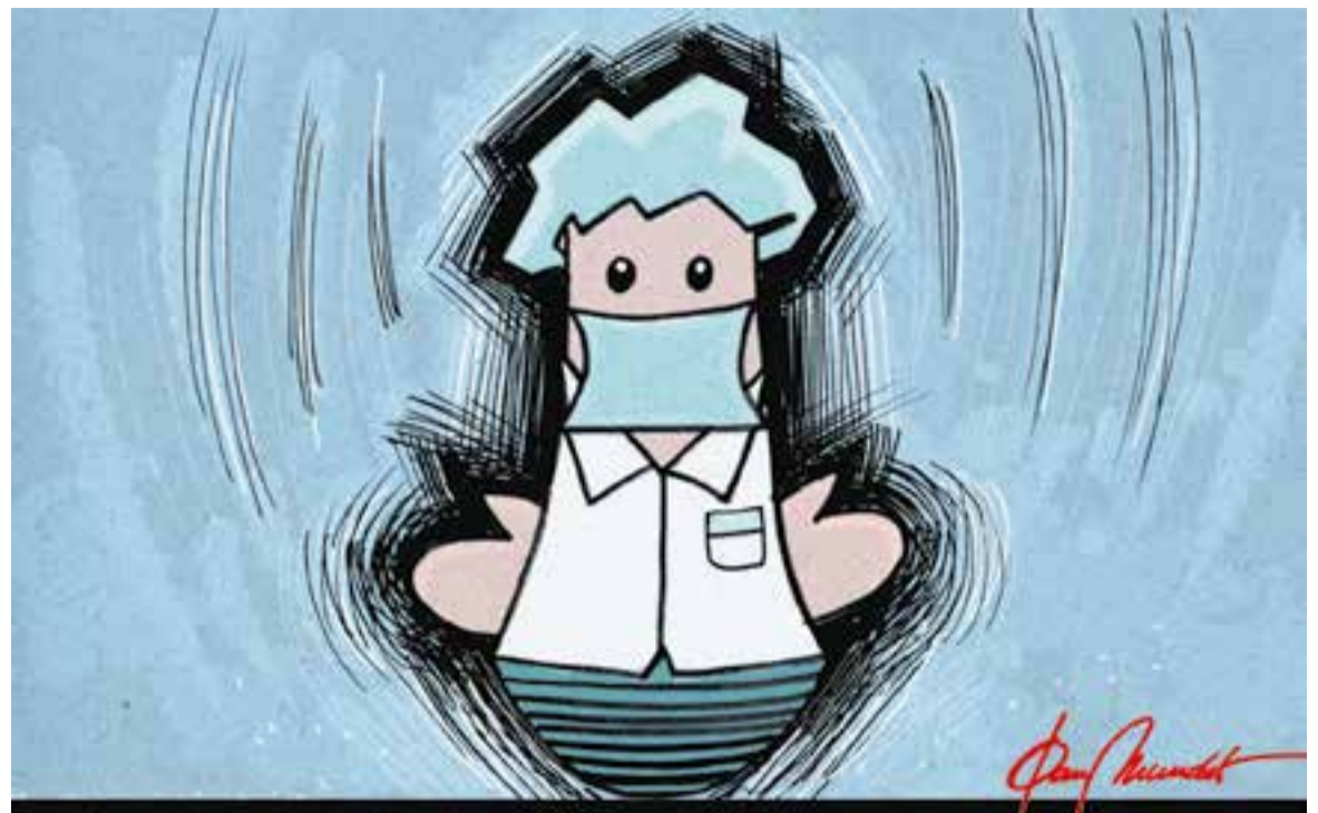
© Saltamartí sanitari. | JOAN MUNDET

“La frustració és alta quan dones el cent per cent i escoltes o llegeixes paraules desafortunades”