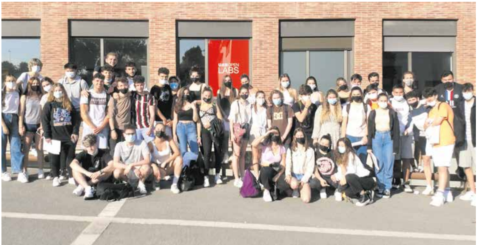
El gruix dels alumnes de l'Institut Puig de la Creu en una foto de grup feta dimecres davant de l'escola d'enginyeria de la UAB on han fet la selectivitat.

Tres alumnes de l'Institut Castellar no van poder començar les proves dimarts per estar confinades