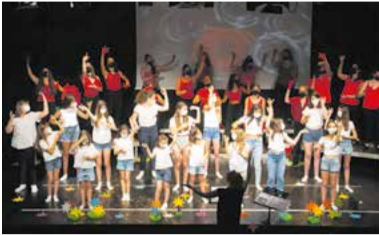
Espectacle 'Escolta les estrelles' inspirat en 'El Petit Príncep'. || MIQUEL MORILLO

Sumant les tres funcions que s'havien programat, més de 180 persones van poder gaudir de la