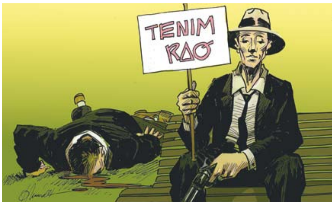
© I si cal. || JOAN MUNDET

En contraposició hi ha les espècies que destaquen per la seva actitud social, que gairebé perden la condició d'individu per esdevenir una peça que no té sentit sense les altres i que només tenen consciència de grup. Per conèixer més detalls d'aquestes espècies es pot recórrer a les mateixes fonts documentals indicades abans. I després hi ha els humans. Els humans són difícils de classificar; bé, podríem dir que són inclassificables. Teòricament són una espècie que s'organitza en estructures socials