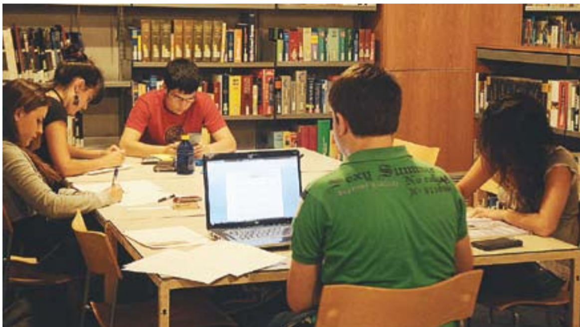
Els usuaris aprofiten el servei de wifi que ofereix la sala d'estudi per descarregar-se arxius mentre estudien.

⊙ Cada dia, unes 35 persones fan servir la sala d'estudi que ofereix la Biblioteca