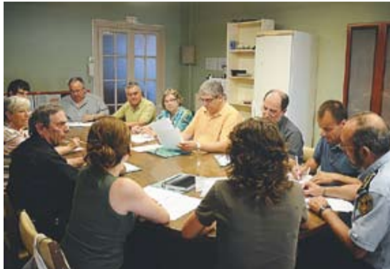
⊕ Un dels cinc grups que es van formar durant la jornada de treball.