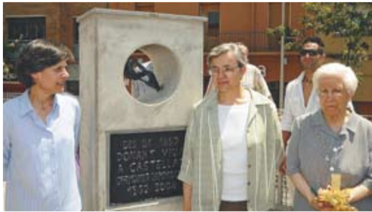
A dalt, deu de les germanes que van assistir a la festa i a sota, el monòlit.

La jornada va començar a les 11 del matí amb una rebuda a les germanes al pati de l'escola. Diverses activitats es van dur a terme com una exposició fotogràfica o l'actuació de Ball de Bastons i del Ball de Gitanes. A les 12 del