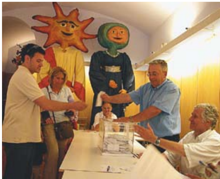
Ciutadans votant a les eleccions europees del 2004.

Les eleccions europees registren, tradicionalment, poca participació. En els últims comicis, els