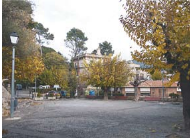
La plaça Doctor Puig, a Sant Feliu, un dels espais remodelats.

El segon capítol més elevat és el del transport públic. La línia C6, que uneix Can Font i