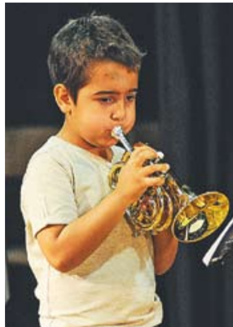
Un estudiant durant el concert

La valoració, tant per part dels pares i mares com dels professors de música, va ser molt positiva. +