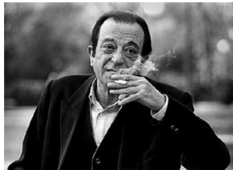
© José Agustín Goytisolo és un poeta cabdal de la literatura actual. || CEDIDA