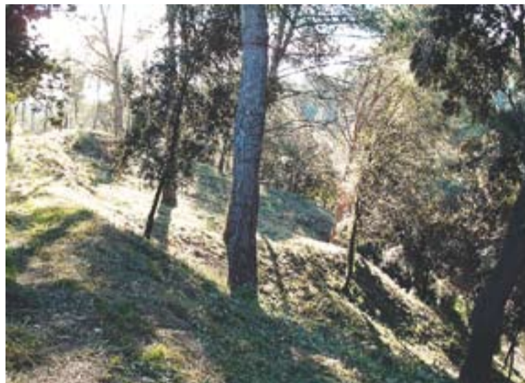
Les administracions preparen el bosc per reduir el risc d'incendis.

El conjunt de l'actuació compta amb un pressupost de 673.576 euros, finançats a través del Pla Únic d'Obres i Serveis de Catalunya de la Generalitat i els ajuntaments. Les obres han de començar en els propers dies. +