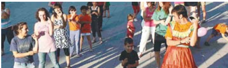
© Moment de la Festa de l'Espai Sargantana amb uns jose balladors voluntaris