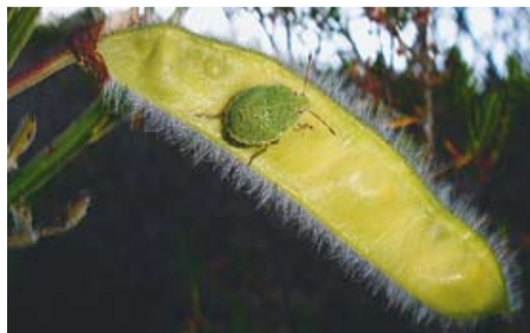
Una de les imatges que es poden veure a la mostra.

Fins els proper 14 de juny es poden veure al vestíbul del Mercat municipal les 54 imatges que formen la quarta edició de la mostra Instants de Natura.