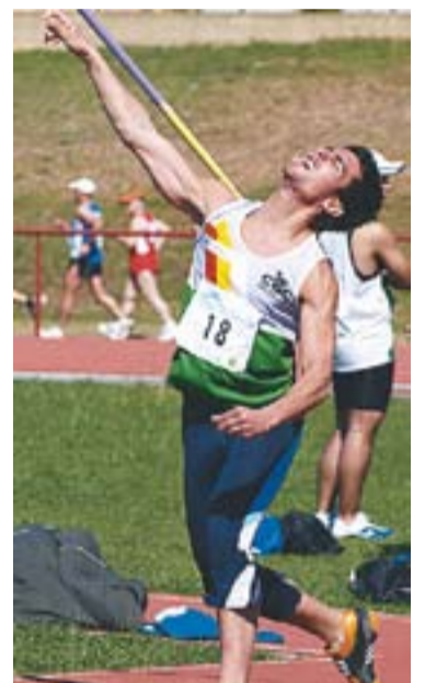
© Ivan Alba. © Alexandra Bayo. || CAC

GARCIA FA PODI || Lluís Garcia va fer podi en la cursa popular barcelonina de Nou Barris. Sobre un traçat de 10 quilòmetres, l'atleta del Club Atlètic Castellàr va assolir un sisè lloc sobre uns 500 corredors, i va tornar a estar en un dels pòdiums de fons. +