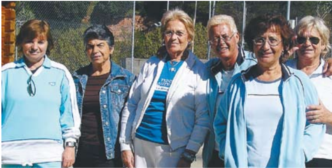
© Components de l'equip de veteranes del Club Tennis Castellàr. || CEDIDA