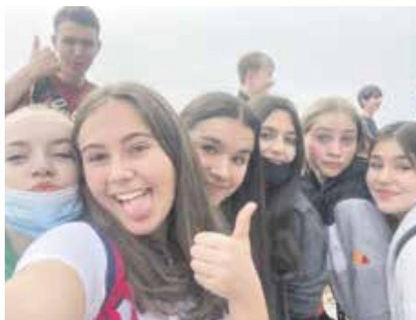
© Alumnes participants del projecte d'intercanvi.