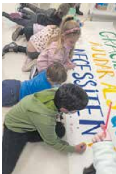
© Tots junts fem grans coses!