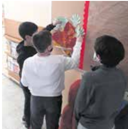
© Esporga de les males herbes (males accions i paraules)

"Els nens i les nenes hem après que hem de respectar-nos, sigui com sigui l'altre, això pot ser una oportunitat per compartir i aprendre dels companys i companyes".