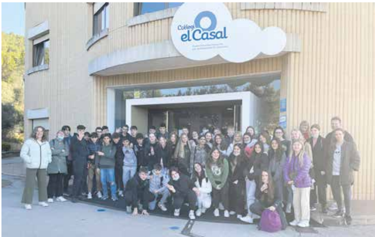
© Foto de grup dels alumnes catalans d'ESO3 i els seus companys danesos de l'escola de Måløv, Dinamarca.

En l'àmbit personal, aquest projecte no només ens ha suposat una millora acadèmica, sinó també una experiència a partir de la qual hem pogut establir noves relacions internacionals. Cal tenir en compte que per poder realitzar aquest intercanvi, l'escola aposta per l'ampliació d'una hora d'anglès més de les que marca el currículum durant