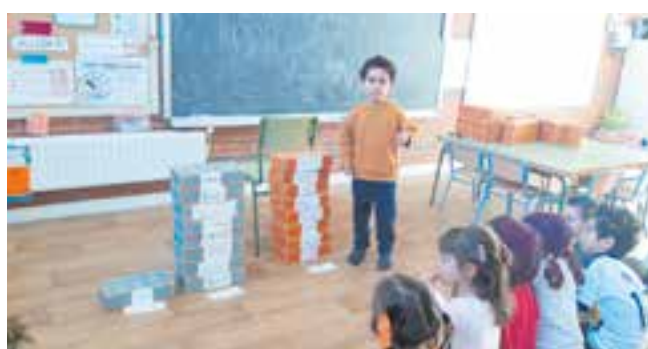
© Comparem l'alçària de 3 muntanyes: la Mola, l'Everest i el Mont Olimp de Mart.