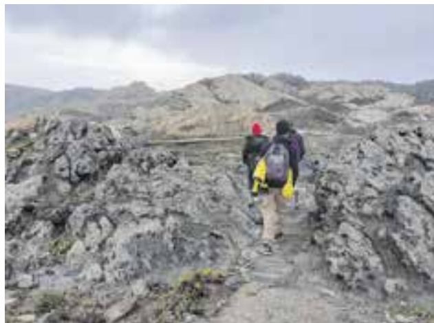
© A través de l'espectacular paratge de Tudela, al cap de Creus