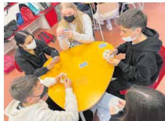
Grups d'alumnes catalans i danesos jugant a jocs de taula. Activitat lingüística i lúdica.

els tres primers cursos de la secundària. A 4t d'ESO hi ha la possibilitat de presentar-te a l'examen oficial de Cambridge B2, més conegut com First Certificate, fent dues hores optatives d'anglès a la setmana dins de l'horari escolar, a més de les tres hores troncales.