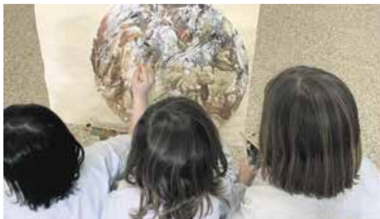
© Alumnes d'15 creant una obra amb terres naturals. (foto 2)

Els dies posteriors de la visita a l'exposició, cada classe va fer tallers per realitzar, individualment o per grups, obres inspirades en el que havíem vist i en el que ens havia fet sentir. Totes les creacions havien de tenir una part estètica i de tècnica, però a la vegada havien de tenir un rerefons amb missatge. Més endavant, vam muntar una exposició