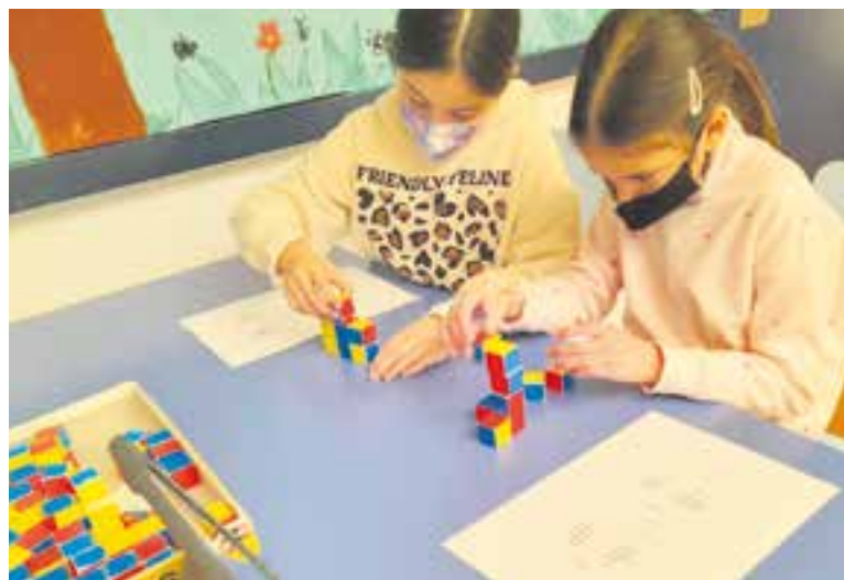
© Geometria: identificació i construcció d'una figura en 3D a partir de representacions en dues dimensions.