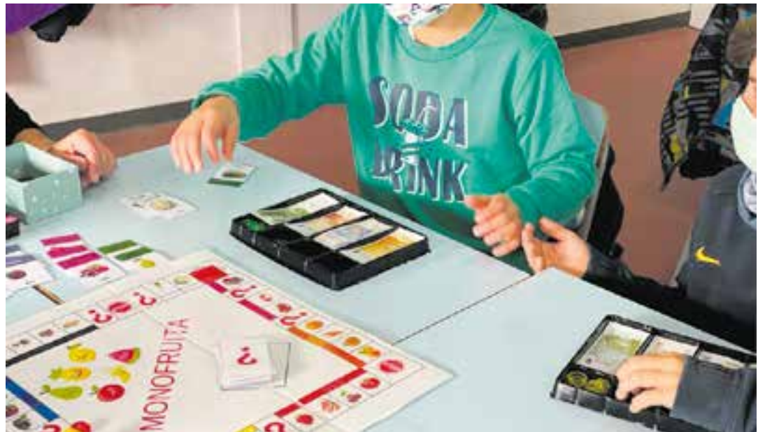
© Joc que treballa la descomposició, la resta i la divisió mitjançant els diners a l'hora de comprar o pagar una part.

Els mestres es continuen formant, ja que veuen les matemàtiques com una eina que ens enriqueix i ens permet entendre el món que ens envolta i, sobretot, ens volen treure la por amb què abans ens hi enfrontàvem.