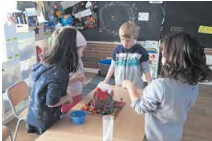
© Fem un volcà del planeta Venus.

5-La conquesta de l'espai. Hem descobert qui van ser la Laika i Galileo Galilei (la figura de l'astrònom) i el telescopi com a eina d'observació de l'espai. Hem investigat sobre els/les astronautes (Iuri Gagarin, Valentina Tereixkova i Pedro Duque) i la vida a dins d'un coet (EEI).