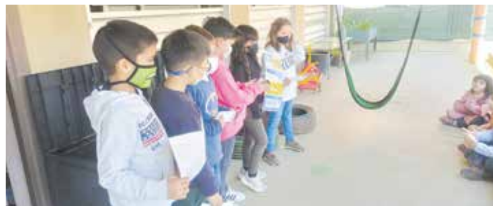
© Explicant-ho als companys d'I5

Escoltar, respectar, reflexionar, ajudar, treballar en equip. Aprendre els uns dels altres. Tots junts podem fer grans coses.