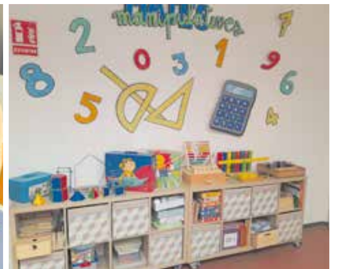
© Material del projecte Matemàtiques Manipulatives.