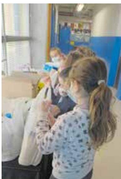
© La participació de tothom és indispensable