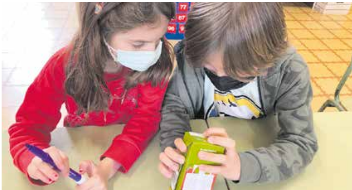
© Observació de la data de caducitat d'alguns aliments