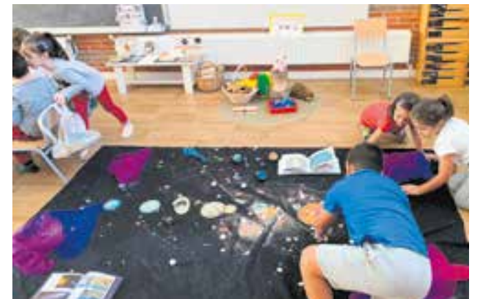
© Representem la creació de l'Univers, el big-bang.

Parlar del nostre planeta ens ha fet més conscients de la importància de cuidar-lo. Ens hem adonat que cadascun de nosaltres pot contribuir a fer del món un lloc millor.