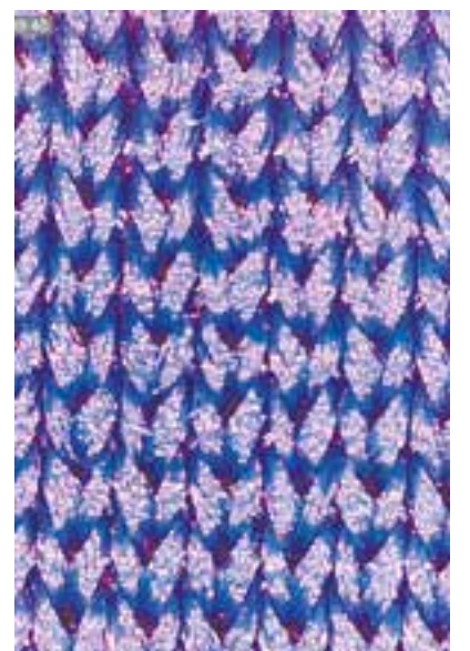
© Teixit elaborat amb un 100% de fibres sintètiques (polièster) observat amb el microscopi.jpg