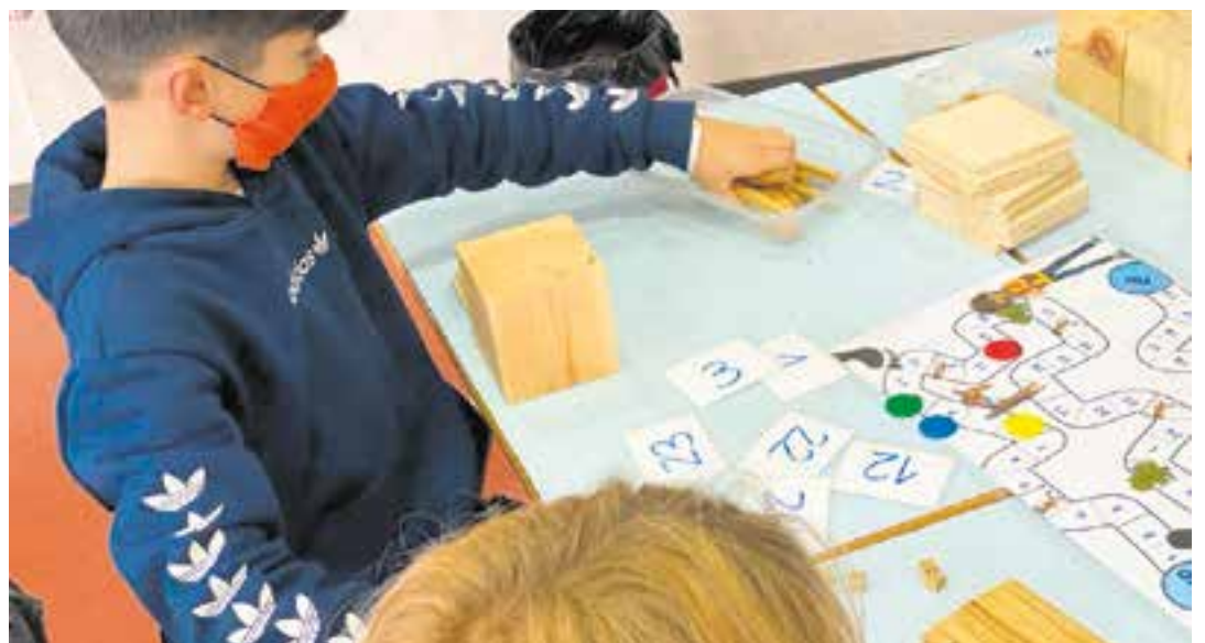
© Joc que treballa els conceptes d'unitat, desena, centena i unitat de miler alhora que es descompon, es divideix, se suma o es multiplica.