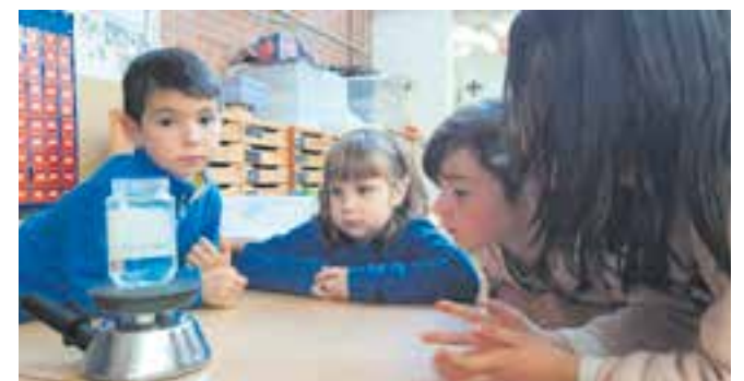
© Experimentem amb els estats de la matèria.