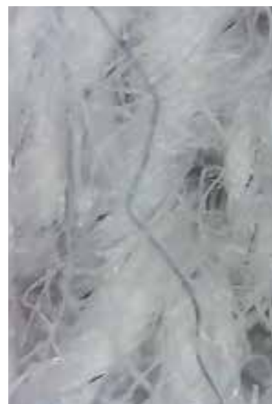
© Teixit amb un 80% de fibres naturals (cotó) i un 20% de fibres sintètiques (polièster) observat amb el microscopi.

Les famílies de l'escola també han col·laborat amb aquests projectes elaborant un núvol de paraules que es va crear en rebre les seves respostes a la pregunta: "Què és per a vosaltres el consum responsable?" .