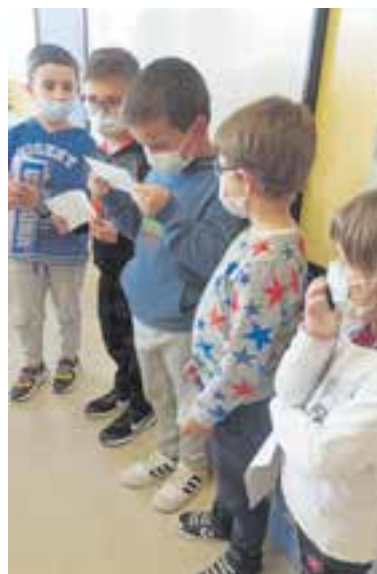
© Exposició oral als companys de 4t