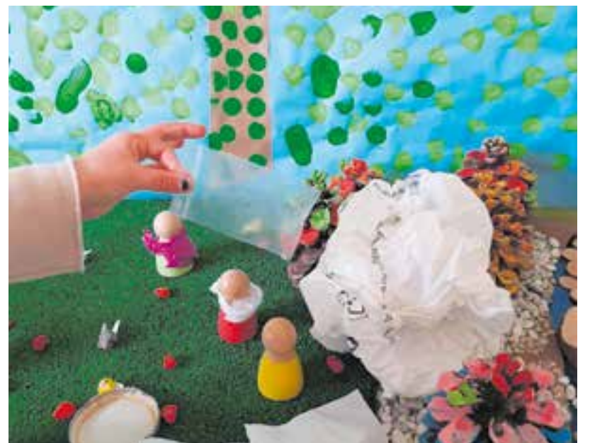
© Minimon sobre reciclatge i consum responsable.