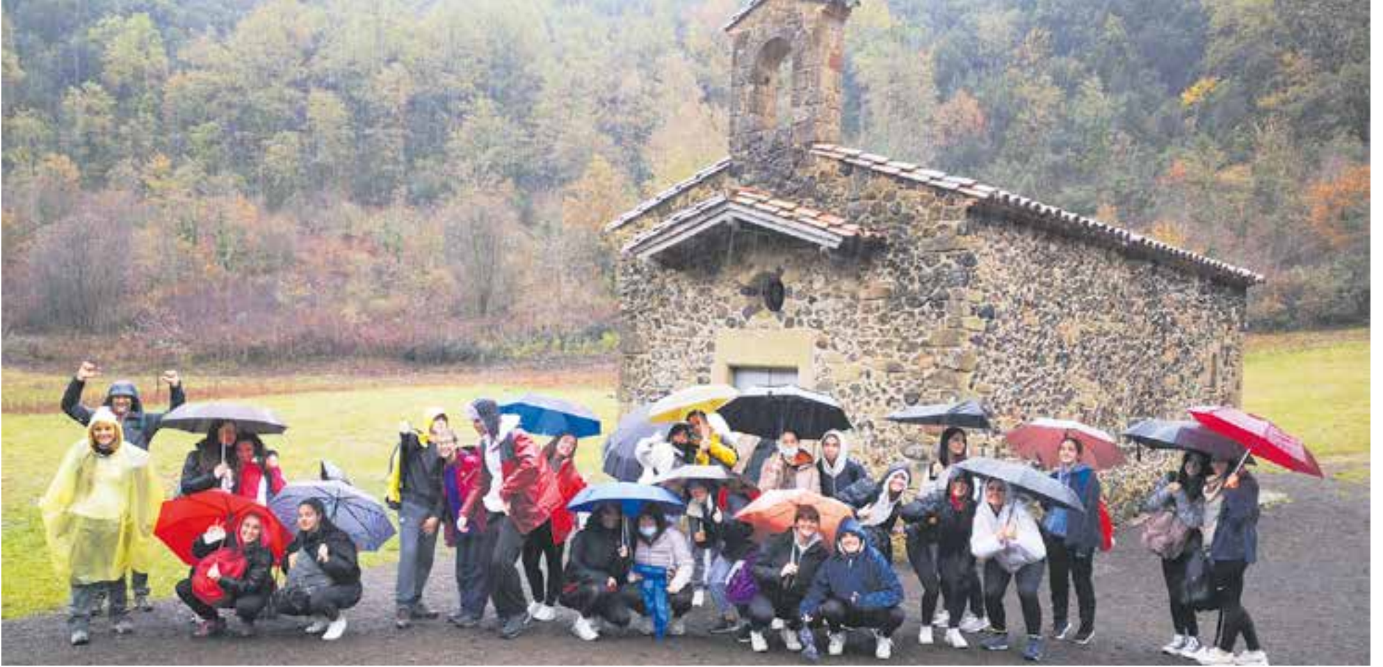
© Sota la pluja al volcà de Santa Margarida