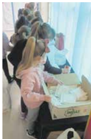
© Classificant els productes. Cadascú té la seva tasca