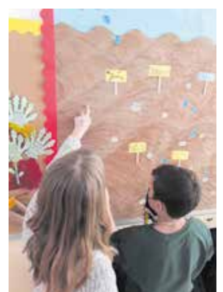
© Anem cultivant la terra