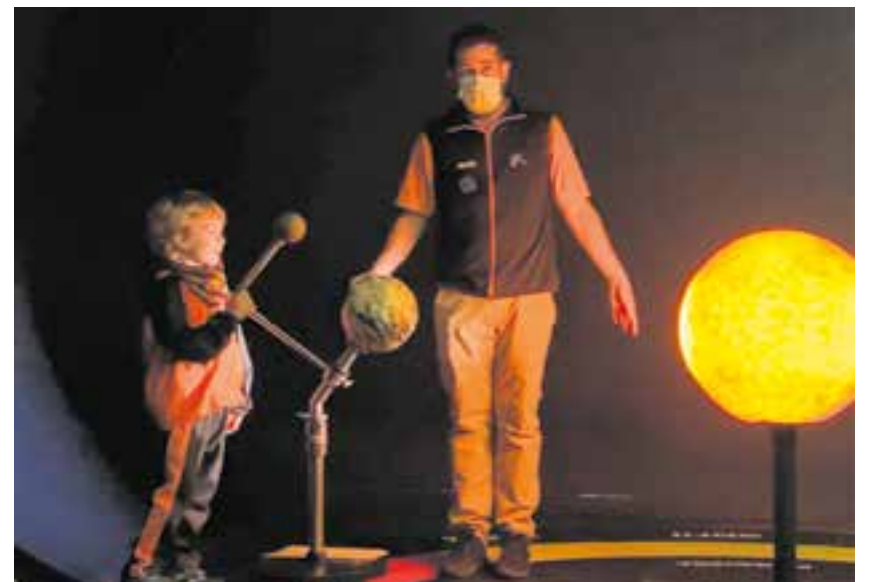
© Visitem el Planetari Bombolla del Cosmocaixa.

Parlar del nostre planeta ens ha fet més conscients de la importància de cuidar-lo. Ens hem adonat que cadascun de nosaltres pot contribuir a fer del món un lloc millor.