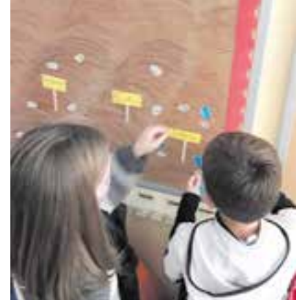
© Inici de la plantada