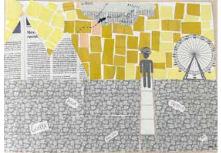
© Collage elaborat per l'alumnat de 1r ESO