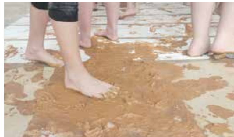
© Activitat d'expressió i moviment a la Nau Bostik. (foto 3)