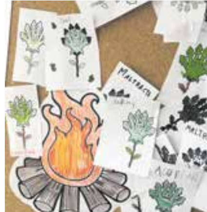
© Crema de les males herbes