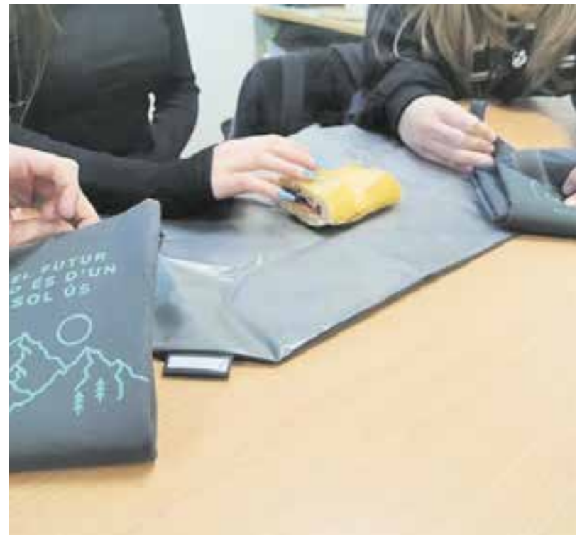
© Alumnes fent ús del boc'n'roll

Som-hi, doncs, que l'acció més petita és millor que la intenció més gran.