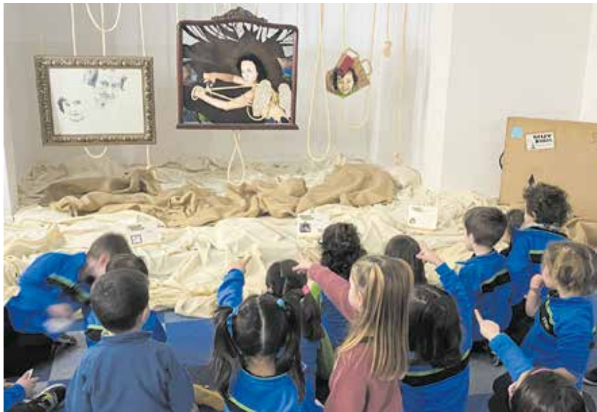
© Alumnes visitant l'exposició de l'escola. (foto 1)