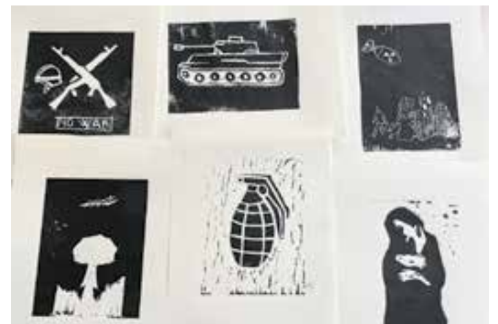
© Linogravats elaborats per l'alumnat de 2n ESO

"També expliquen que gràcies als murs tan gegants que construeixen, molts artistes han aconseguit arribar a la fama i expressar-se pintant-hi coses boniques a les parets, donant esperança i il·lusió a la gent que viu rodejada d'aquests grans murs."