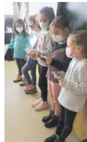
© Exposició als companys de 6è