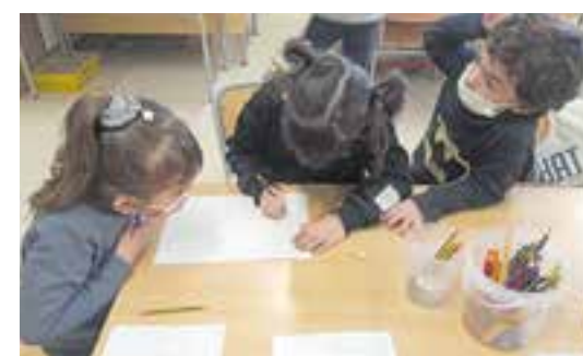
© Escrivint la llista de material i productes

Escoltar, respectar, reflexionar, ajudar, treballar en equip. Aprendre els uns dels altres. Tots junts podem fer grans coses.