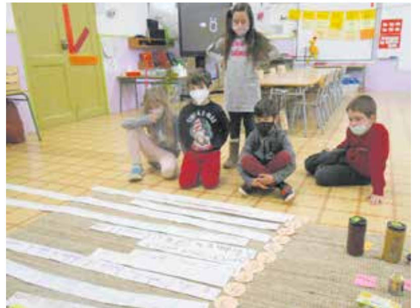
© Posada en comú de les observacions sobre la investigació de la data de caducitat dels aliments.