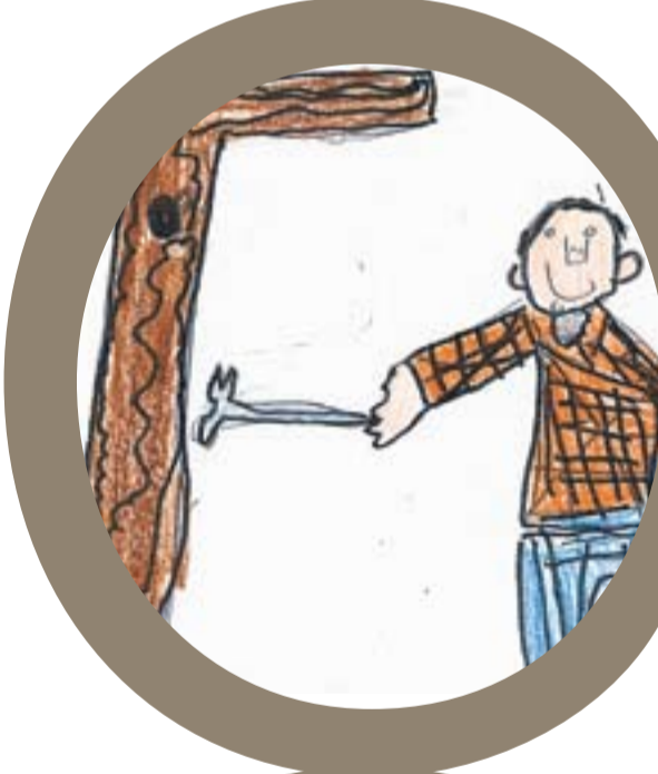
CEIP Emili Carles Tolrà