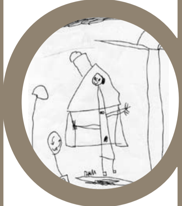
CEIP Sol i Lluna