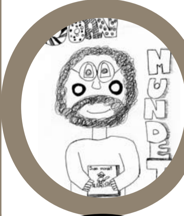
Col·legi La Immaculada