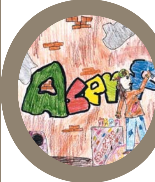
Col·legi El Casal