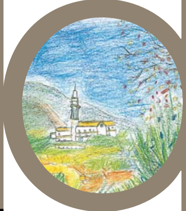
CEIP Mestre Pla