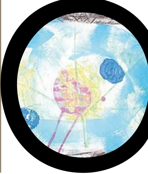
CEIP Josep Gras