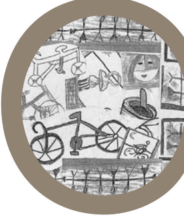
CEIP Sant Esteve