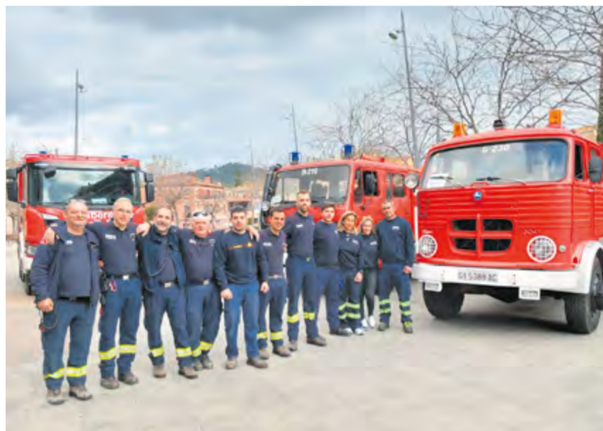
Els Bombers Voluntaris en una acció de sensibilització a la Fira de Sant Josep.

El 2022 i el 2021 han estat dos dels anys més secs dels últims trenta anys