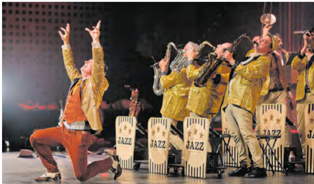
'Els colors de Duke Ellington' van seduir el públic assistent a l'Auditori Municipal, dissabte passat.