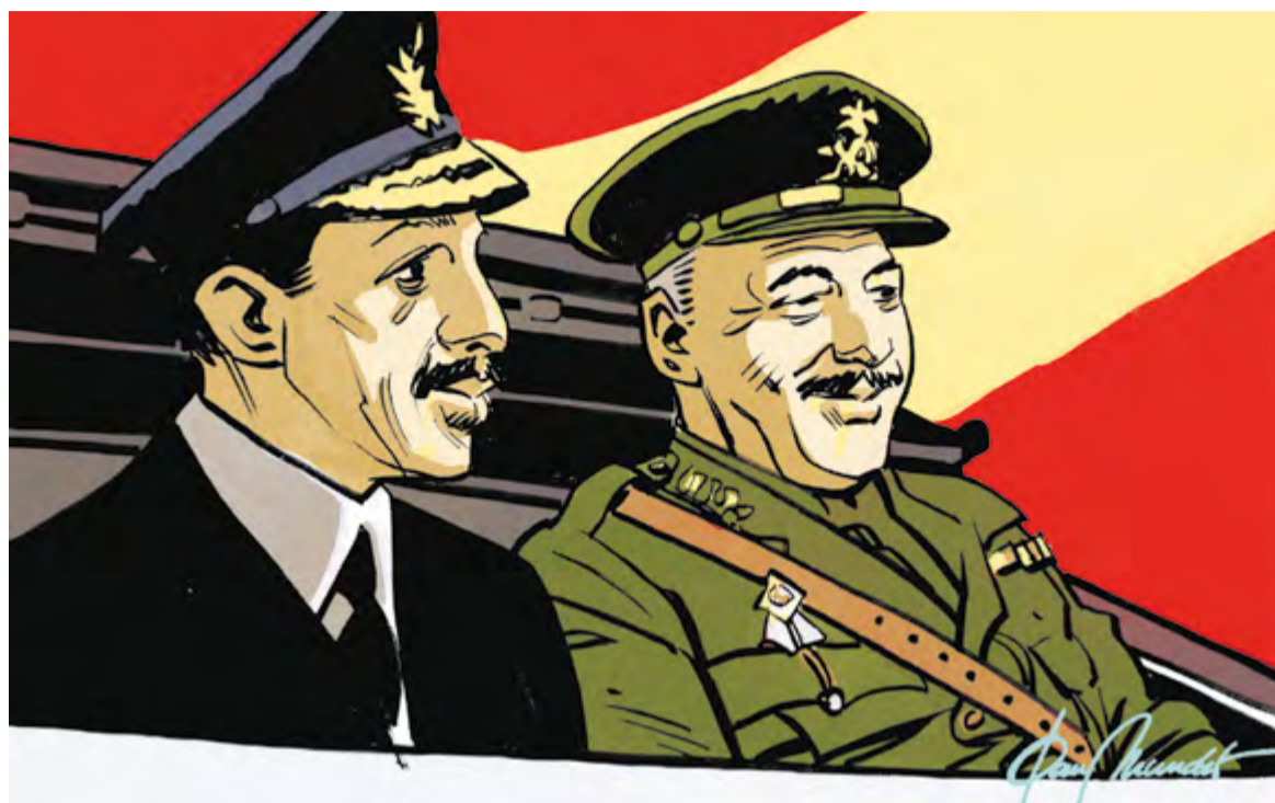
© Cop d'estat real.