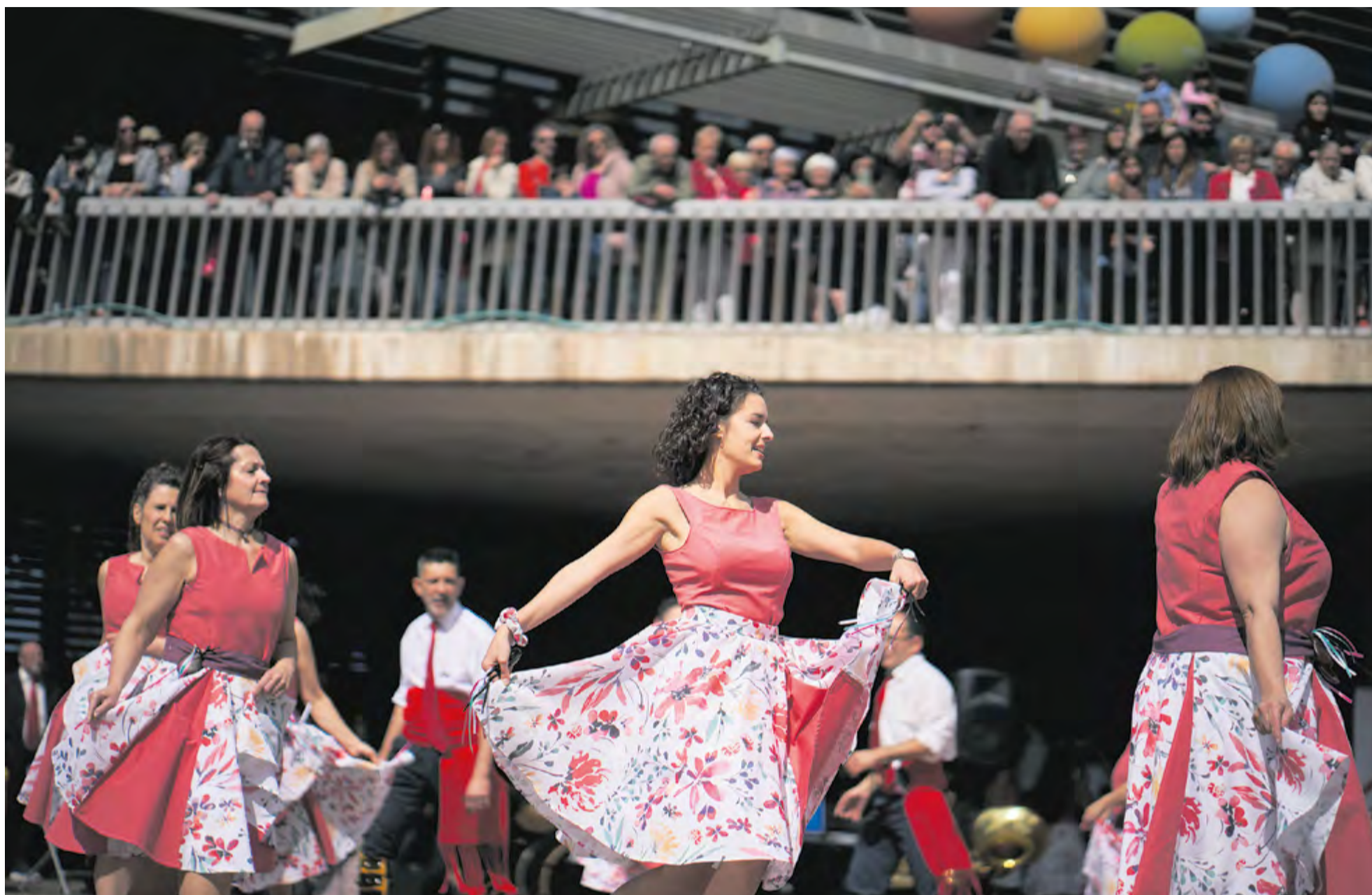
El Ball de Gitanes va fer la presentació de les noves colles a la plaça del Mercat davant de nombrós públic acompanyat de la Cobla Orquestra La Cartutxa. || Q. PASCUAL