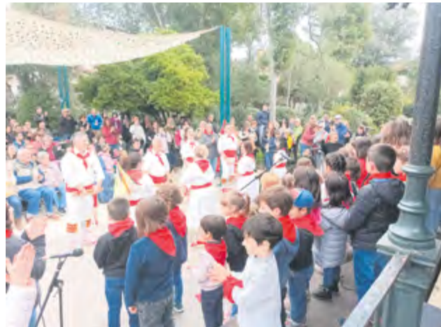
Moment dels Petits Concerts de Sant Josep, dissabte passat.

Per acabar i rematar la bona sintonia que hi va haver entre públic-músics-actors, l'orquestra va deixar la seva zona de confort a l'escenari per baixar, encara tocant, per les escales fins a fora de l'Auditori, a la plaça del Mercat, on encara va regalar un parell o tres de temes més al públic, ja dret i acordonant els músics, marcant ritme amb ells i aplaudint de forma entusiasta.