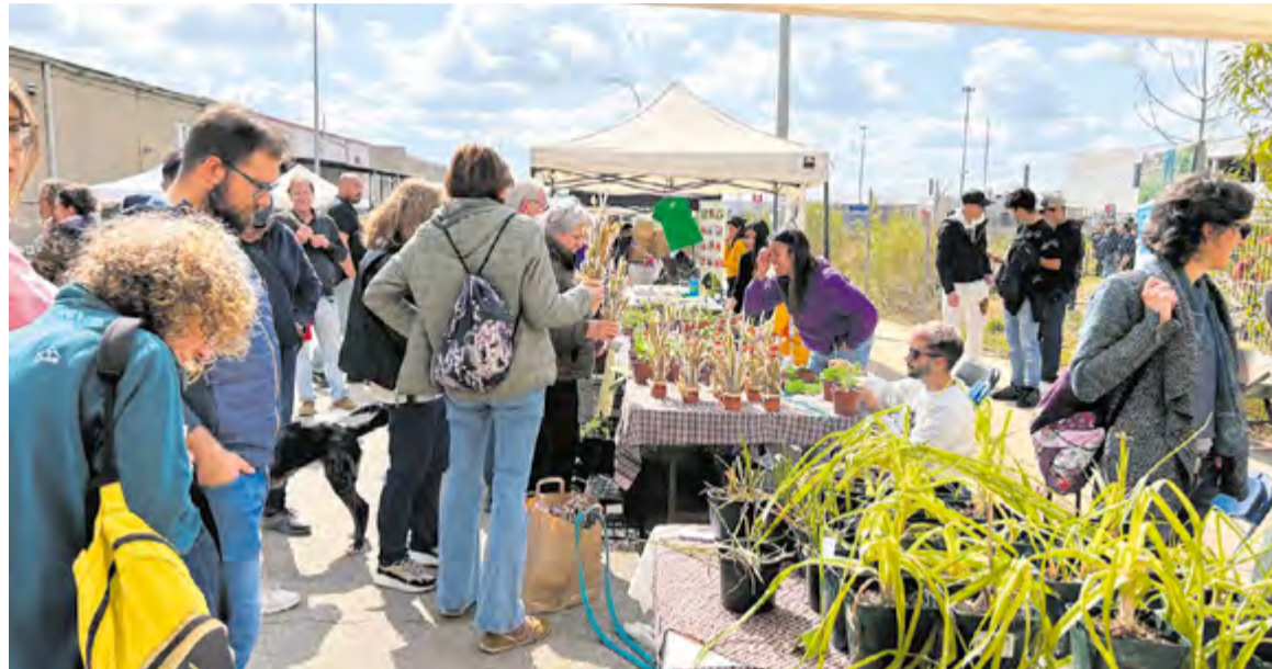
Visitants al mercat de la fira organitzada per l'Institut Les Garberes.

Hi van ser diferents expositors, entre els quals el Viver Tres Turons, Les Refardes, El Vergel de las