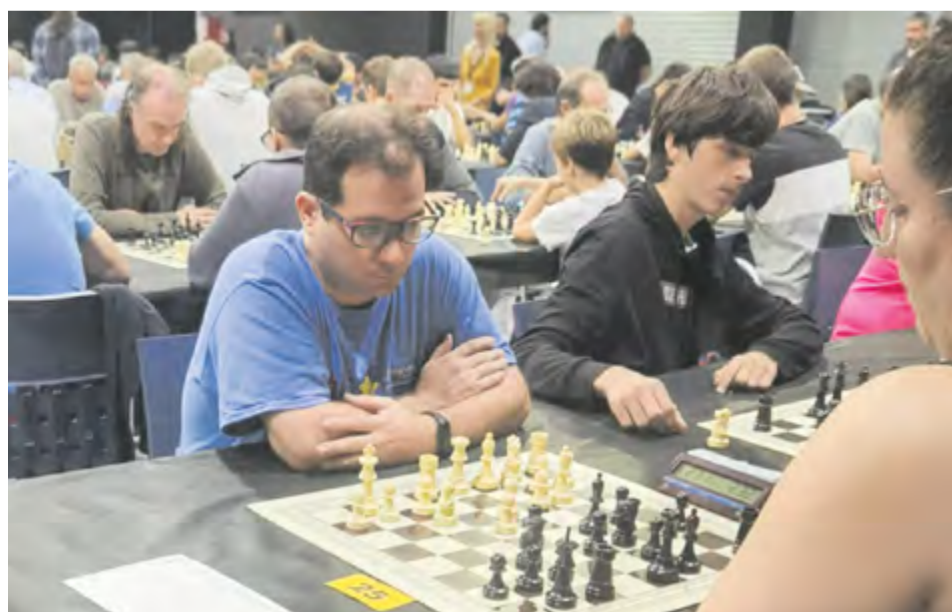
Dos ascensos i un tercer lloc per als equips sènior del Club d'Escacs de Castellar.