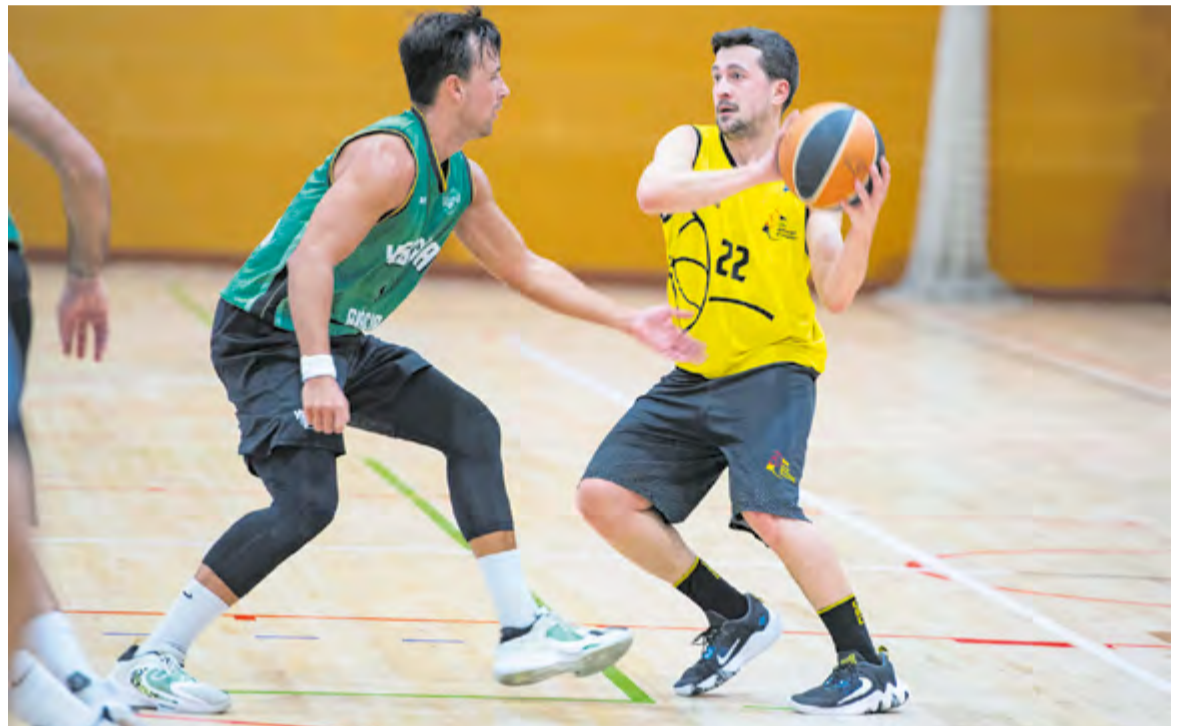
L'equip va dominar tot el partit fins a l'últim quart, quan el Vedruna va poder forçar la pròrroga, on va ser superior. || A. SAN ANDRÉS

"Crec que l'esforç de l'equip ha estat molt bo i que mereixíem millor resultat", va explicar Bordas. "Amb jugadors molt joves s'ha treballat molt i s'ha estat a l'altura. Hemsabut donar la cara i ho continuarem fent", conclou el tècnic. +