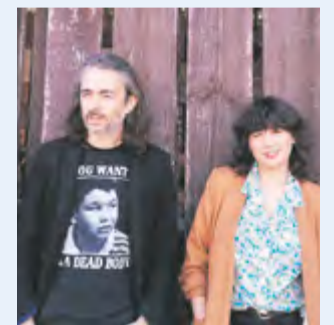
Riders of the Canyon. || CEDIDA

Al llarg de les cinc noves composicions, els excel·lents aranjaments acústics conviuen amb la contundència elèctrica, cosa que sumada a l'equilibrat joc d'harmonies vocals podria recordar grans noms de la música americana com CSN&Y, The Ozark Mountain Daredevils i The Eagles. + || M. A.