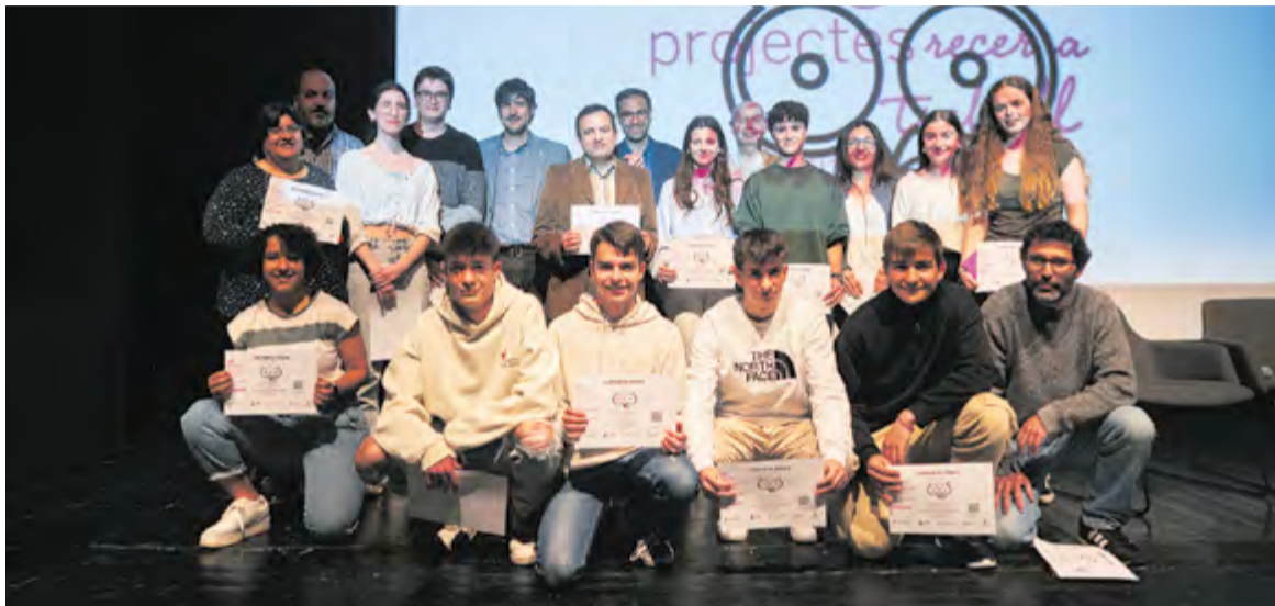
Els alumnes dels instituts Castellar i Puig de la Creu amb els tutors, l'alcalde i el regidor d'Educació dimecres a l'Auditori.