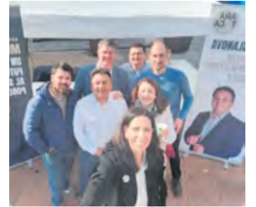
L'equip d'Ara Toca Castellar.