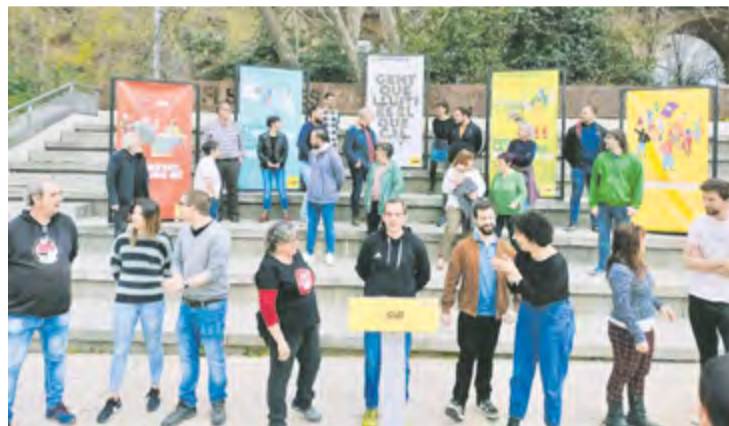
Els diferents candidats vallesans a la trobada del Parc de Vallparadís.