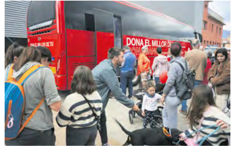
Autobús on es va poder donar sang diumenge passat.