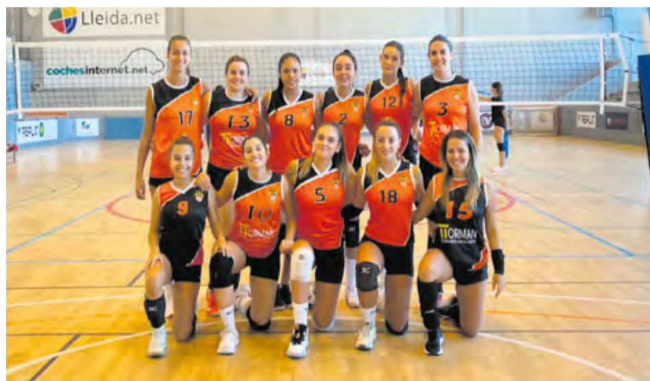
L'equip femení és a només un punt de la primera posició, després de quatre victòries seguides. || CEDIDA

Pel que fa a l'equip masculí, els de Rafa Cortés van aconseguir rascar un punt, el primer d'aquesta segona volta que arriba a la vuitena jornada, després de caure en el tie-break contra el Get Blume d'Esplugues de Llobregat. L'equip va estar molt a prop d'aconseguir una remuntada, després d' aixecar un 2-0 advers, i va caure finalment en l'últim set i va sumar un 3-2 (25-20/29-27/21-25/23-25/15-10). + || A. SAN ANDRÉS