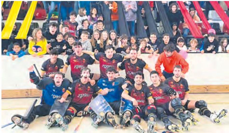
Els grans caminen pel camí del retorn a Primera Catalana.