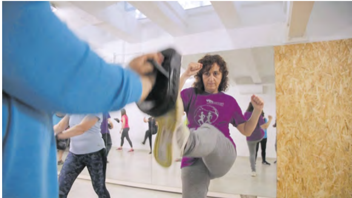
En el taller es fan servir diferents materials, com les manyoples de boxa, que es combinen amb diferents moviments.