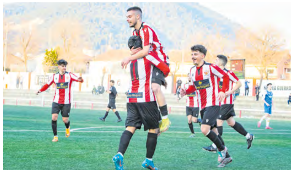
La UE Castellar vol sumar a Can Sant Joan en la primera jornada de la recta final. || A. SAN ANDRÉS

L'equip està ben mentalitzat després d'una setmana de descans i ha pogut recuperar els diversos lesionats, tocats i sancionats, fent net en la convocatòria. El xoc de trens a Montcada obrirà la primera de les 10 jornades a disputar per la Unió Esportiva de cara a la lluita per l'ascens, on els tres primers dels sis classificats, aconseguiran un lloc a Primera Catalana per la temporada que ve. + || A. SAN ANDRÉS