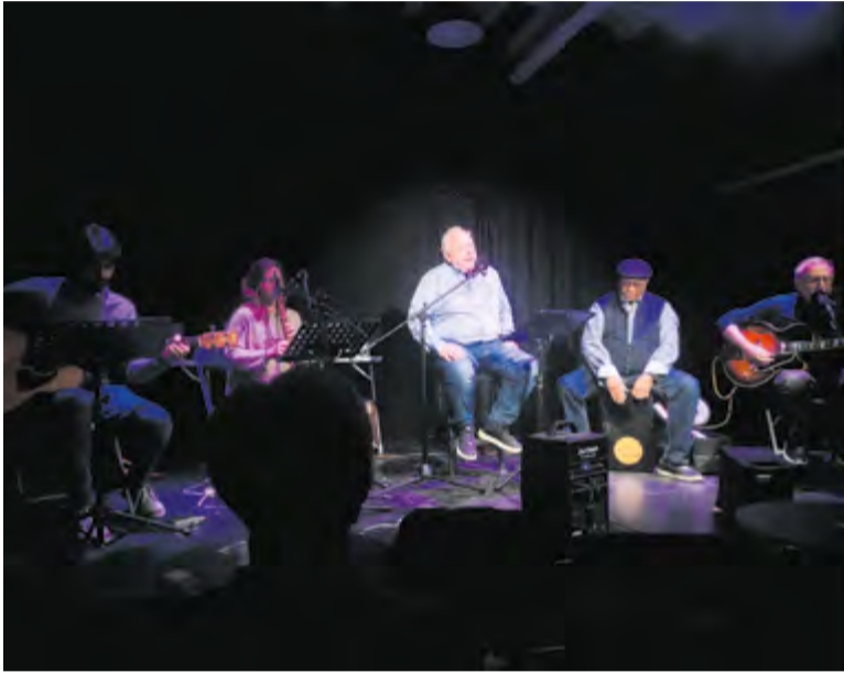
Concert de l'Anima de Bolero, que dijous i divendres passat van omplir L'Alcavot. || C.