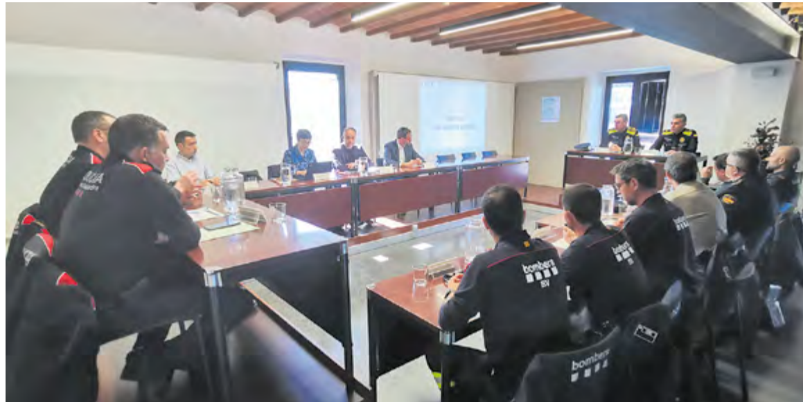
La Junta Local té participació de la policia local, els Mossos, la Guàrdia Civil, els Bombers i els agents rurals.

En concret, amb la nova prefectura també es pretén guanyar unes instal·lacions més ben dimensionades, ja que es preveu que la plantilla de la policia local creixi en els propers anys. Precisament, a la Junta també es va explicar que properament es convocaran sis places d'agent (dues de nova creació, d'acord amb el que es va aprovar en el darrer ple sobre l'ampliació de treballadors municipals, agents de policia local inclosos). Amb les dues noves incorporacions la plantilla de la policia local comptarà amb 38 efectius i “es treballa per