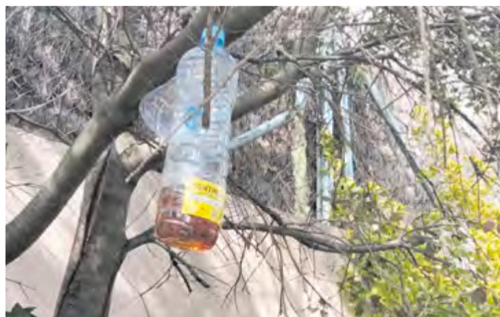
Trampa casolana per caçar vespes velutines reines.