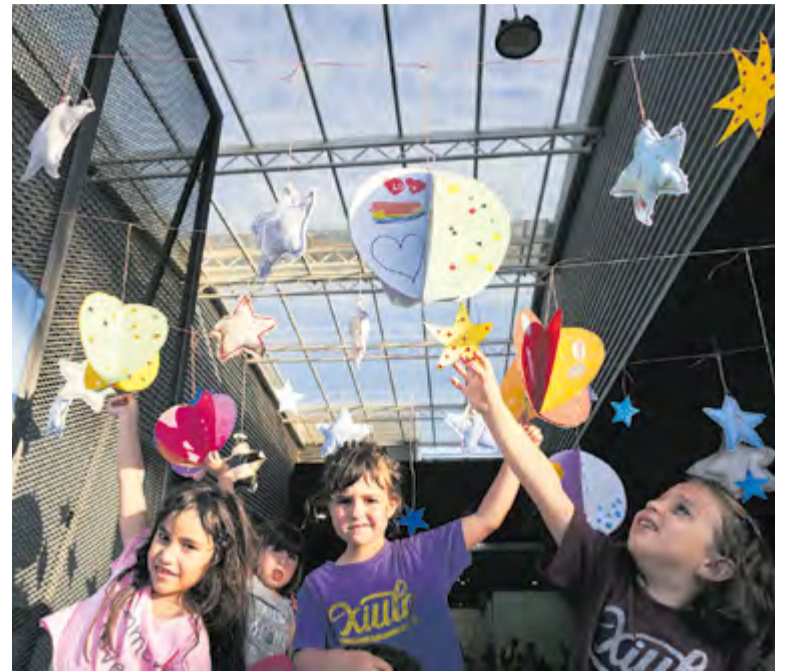
Un dels tallers de l'edició passada de la Marató per la Diversitat.

A la tarda, a partir de les 16 h, diversos esplais conqueriran la zona central de l'Espai Tolrà, amb la gimcana de l'Esplai Sargantana i l'Esplai Xiribec, i la zona de jocs de la Ludoteca. Tarda de música a la Sala Blava a partir de les 17 h amb Ralet-Ralet, Artcàdia i Acció Musical de Castellar, i taller de circ a partir de les 19 h, o la proposta Dona't Espai.