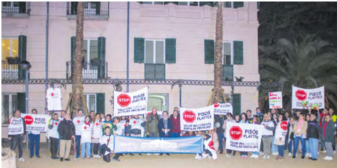
Concentració dels manifestants de la plataforma Veïns de Castellar als Jardins del Palau Tolrà, dimarts passat.

La plataforma Veïns de Castellar demana una consulta sobre el projecte