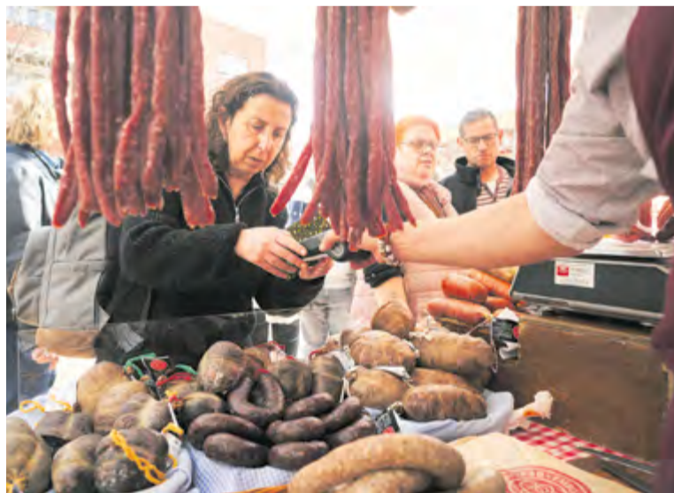
Centenars de persones van voltar per la fira d'aliments artesanals. || Q. PASCUAL

A la plaça d'El Mirador, alguns assistents van aprofitar per donar sang, en la campanya dels Bombers Voluntaris de Castellar i el Banc de Sang i Teixits [més informació a la pàgina 6]. +