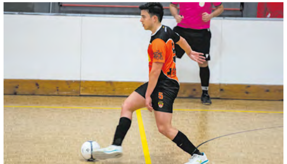
L'FS Castellar intentarà superar la Prosperitat, diumenge (20.00 h) al Blume. || A. SAN ANDRÉS

El Castellar segueix a set de la salvació, abans de rebre aquest diumenge (20.00 h, Joaquim Blume) a la Prosperitat, un rival directe en la lluita per la salvació. + || A. SAN ANDRÉS