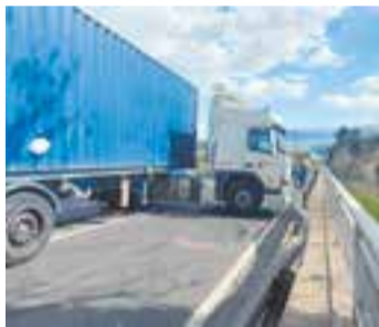
El camió va fer la tisora.