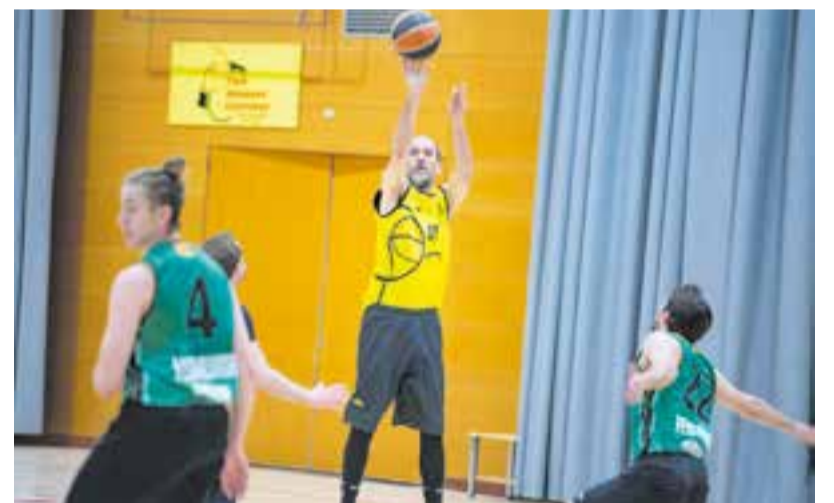
El CB Castellar va reaccionar a l'últim quart per imposar-se a l'Olesa.

Amb quatre jornades per jugar (Manresa, a fora; Molins, a casa; CN Sabadell, a fora, i acabant al Puigverd amb l'Artés), els groc-i-negres tenen a la mà la possibilitat d'obrir un miracle impensable unes setmanes abans. †