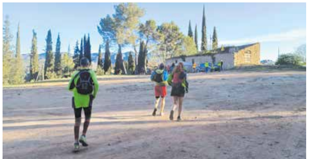
Arribada d'alguns participants al primer avituallament a Sant Sebastià de Montmajor. || Q.P.M.A.