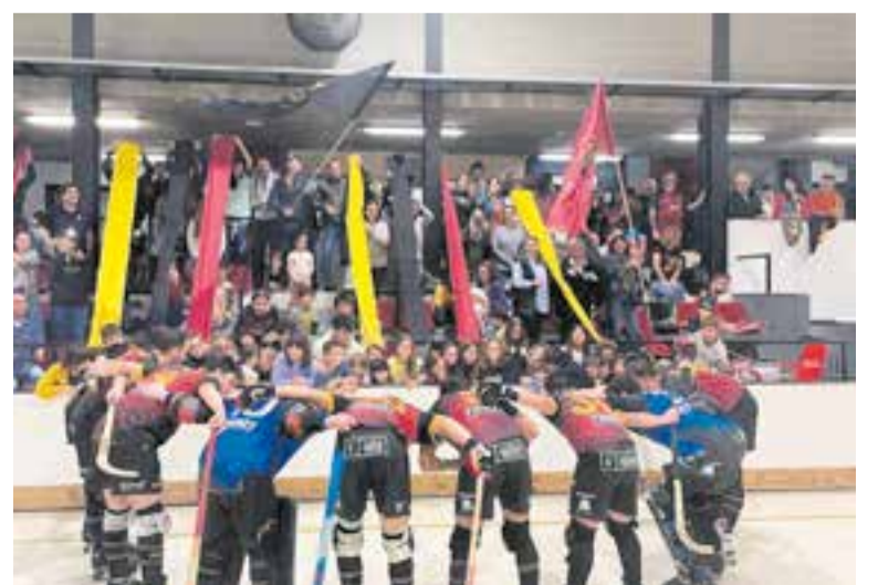
L'equip celebra la victòria aconseguida a casa contra la UE Horta.

La setmana que ve, contra el Palau (dissabte, 19.30 h), l'equip lluitarà per mantenir la segona posició del grup contra un rival que tindrà la complicada feina de classificar-se en tercer lloc, l'única plaça encara disponible de promoció d'ascens, ja que el Sant Cugat pujarà directe i els grans ja ho tenen lligat. +