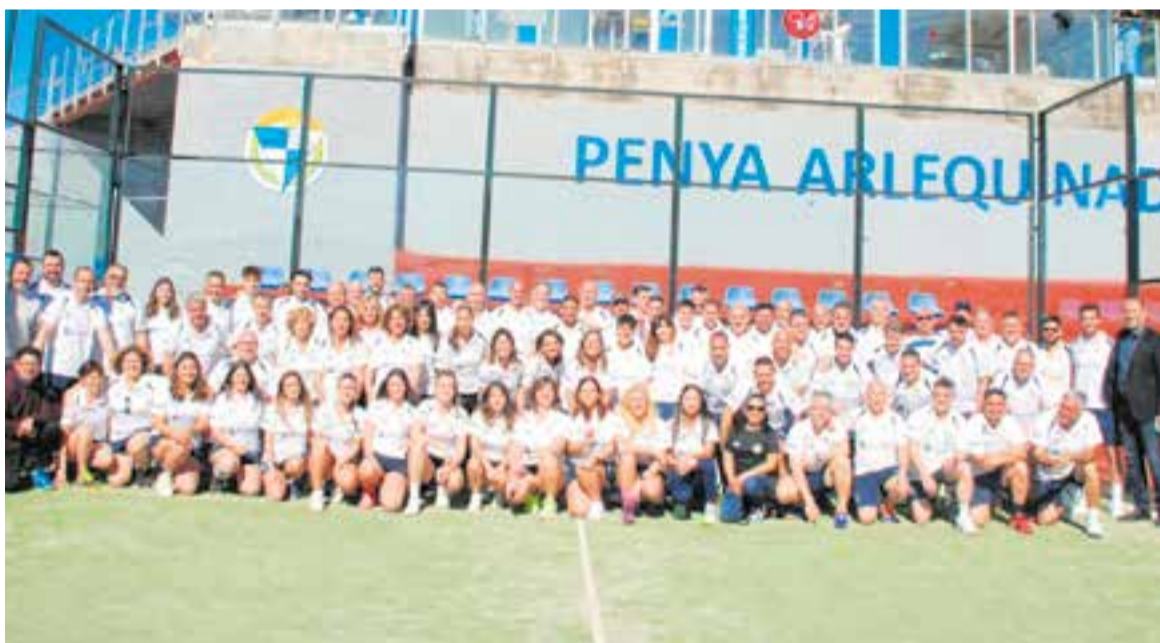
Els 130 integrants dels 14 equips de la Penya Arlequinada.