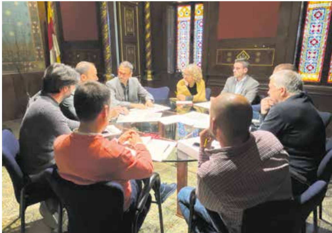
La constitució del Comitè municipal d'actuació davant la sequera es va fer dimecres a la Sala de la Capella.

En l'actualitat, i seguint les directrius del Pla de Sequera, l'Ajun-