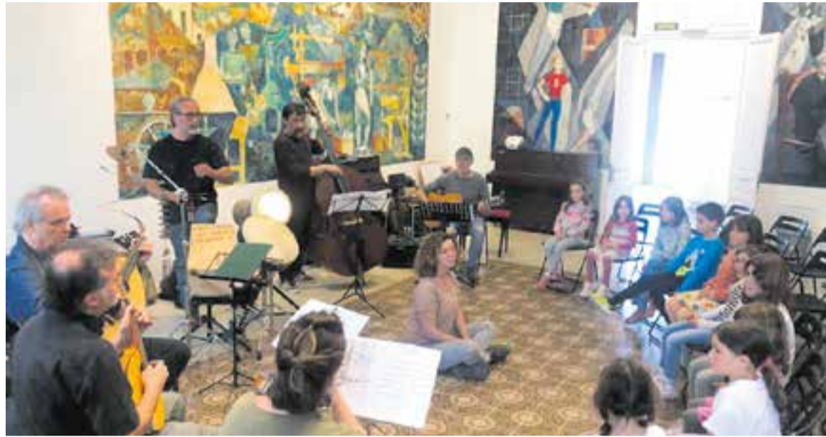
Un assaig del cor de Sant Esteve preparatori de la 'Suite de la Mediterrània'. || COR SANT ESTEVE

aquell moment no era gens habitual que un cor infantil muntés una producció pròpia amb músics i instruments de l'àmbit tradicionals d'altres cultures, i en aquest cas, amb nous arranjaments innovadors i de molta qualitat, fets pel músic terrassenc Pep Coca. D'altra banda, l'aproximació a músiques d'altres cultures en aquells