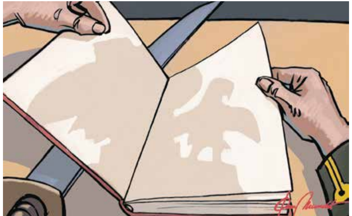
© Pàgina de respecte. || JOAN MUNDET

ció és tan bell com el rostre de qui dorm plàcidament. El somni diürn d'un lector és tan o més profitós que els roncs i té menys detractors si compartiu el jaç amb algú altre. Es pot llegir a peu dret o en una cadira, l'extensió del llibre i la resistència física de cada persona en marca el límit. També es pot gaudir de la lectura al ras, en un banc públic, envoltat d'arbres bressolant les pàgines i amb el cel com a sostre infinit. Es pot llegir al mercat municipal i aprofitar l'embotall d'un croissant de xocolata