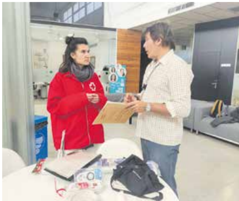
La Creu Roja va programar el taller sobre pobresa energètica a El Mirador.

Respecte al futur, no és gens optimista i qualifica el moment com l'enfonsament del Titanic si les coses no canvien: “Estan sorgint molts moviments ciutadans per revertir les retallades. S'ha de donar més potència al sistema sanitari, sobretot a la primària. I s'ha d'exigir als partits polítics que reformin la LOSC” , va concloure Rodríguez. +