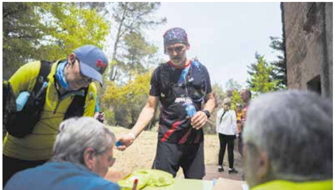
Avituallament a l'ermita de Santa Maria de Les Arenes. || Q.P.M.A.

La Ruta de les Ermites s'inclou a la Copa Catalana de Marxes de Resistència de Catalunya i està valorada en 17 punts. La propera Ruta de les Ermites a Castellar tindrà lloc l'any 2025, quan se'n celebrarà la quinzena edició. +