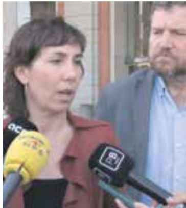
Delegació del Govern a la porta del ministeri dilluns passat.

A la reunió de dilluns, el Ministeri de Transports, Mobilitat i Agenda Urbana va obrir la porta a finançar l'obra sense comptar amb la disposició addicional tercera de l'Estatut, la seva intenció inicial, i que rebutjava frontalment la Ge-