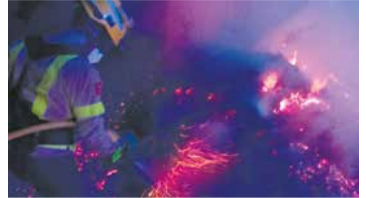
Un dels bombers de Castellar, diumenge passat, a l'incendi del Segrià.

Un camió del parc de la vila va participar en l'extinció de l'incendi de la Franja de Ponent