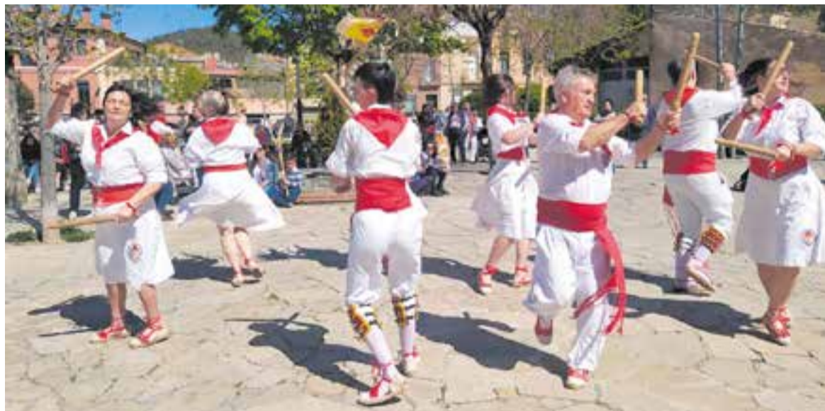
Ballada del Ball de Bastons durant el matí del Diumenge de Rams, a la plaça Major de Castellar del Vallès.

L'entitat bastonera fa una crida per incorporar nous balladors; 'L'Actual' fa d'altaveu de les darreres actuacions balladores