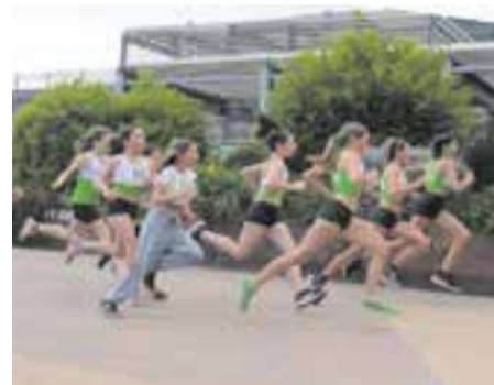
Torna la Milla Urbana a Castellar.

La clàssica Milla Urbana de Castellar arriba a les 32 edicions en aquest 2023, en què també es disputarà la segona edició de la Milla Inclusiva.