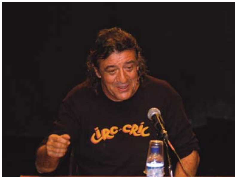
El pallasso Tortell Poltrona va inaugurar la XIV Escola de Pares i Mares

Al mes d'octubre, es van iniciar un seguit de serveis municipals adreçats a joves i infants i també als seus pares i mares. És el cas del projecte d'Unitat d'Educació Compartida, adreçat a alumnes amb necessitats educatives especials, els projectes de suport socioeducatiu per als alumnes de 6 a 16 anys, el projecte TRIA per a nois i noies d'entre 12 i 16 anys en situació de dificultat social o susceptibles de presentar-la, la ludoteca Les 3 Moreres, el Casal de Joves i la 14a edició de l'Escola de Pares i Mares.