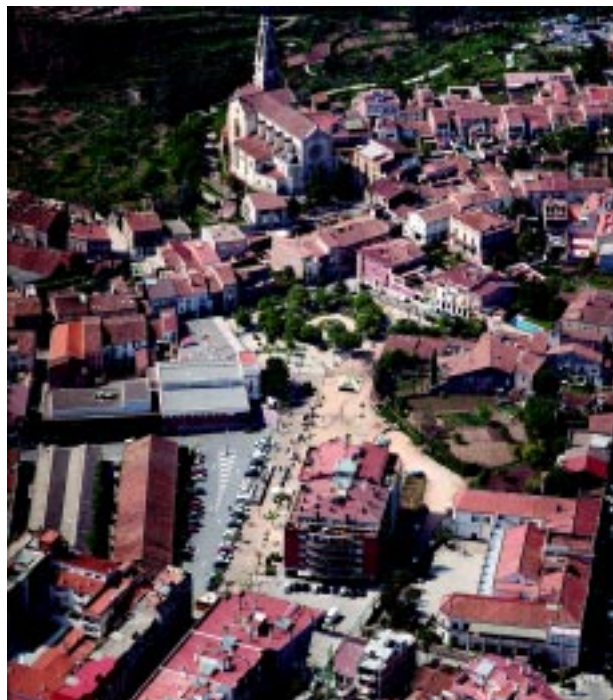
El municipi invertirà en els propers anys a l'entorn de 15 milions d'euros a la plaça Major

El compte enrere per a l'inici de les obres de la plaça Major ja és més a prop després que en els dos plens que hi va haver en el mes de maig es donés llum verda al projecte de la 1a fase d'obres i es convoquessin diferents concursos per a l'adjudicació dels treballs així com de la gestió de l'aparcament soterrat, del futur supermercat i d'un nou bar-restaurant.