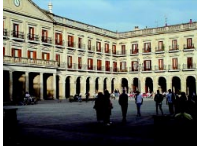
Una imatge de la ciutat basca, referent en polítiques socials.

D'altra banda, es van impulsar programes d'inserció laboral adreçats a col·lectius