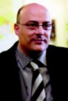
Lluís M. Corominas Alcalde