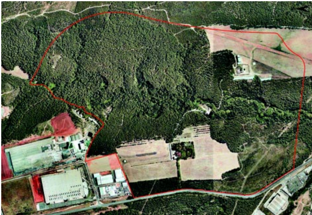
L'àmbit de 125 hectàrees on s'havia fet la proposta de reserva terrestre d'animals

campanyes mediàtiques i complint el compromís de presentar públicament els estudis abans de prendre cap decisió.