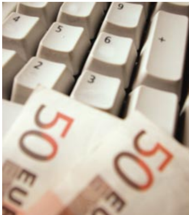
La supressió de l'IAE ha marcat el càlcul de la fiscalitat del municipi

D'altra banda, la taxa de les escombraries també patirà un increment ja que, el 2004 la Generalitat cobrarà un cànon pel dipòsit dels residus en els abocadors. Aquest cànon serà de 10 euros/tona i servirà per finançar infraestructures en l'àmbit dels residus. Aquesta xifra es repartirà entre el conjunt dels contribuents, de manera que el rebut per als domicilis del nucli urbà serà de 82,30 euros (9,50 euros