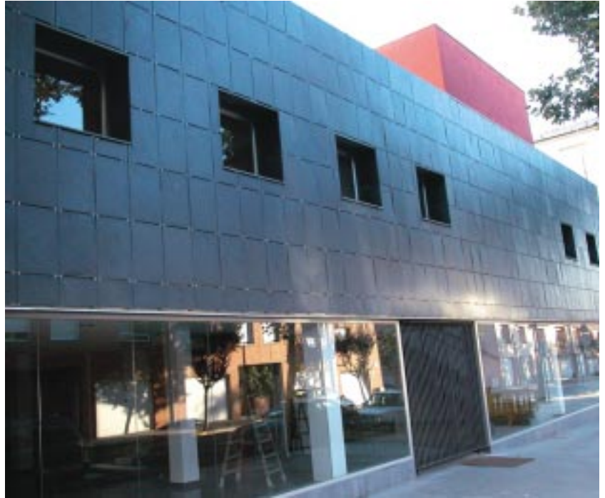
Façana del nou equipament.

Castellar del Vallès disposa d'un nou centre d'activitats situat a la zona de l'Eixample, molt a prop de la plaça de Catalunya. La consecució d'aquest equipament ha suposat una inversió de 900.000 euros, 150 milions de pessetes, que ha finançat íntegrament el consistori.