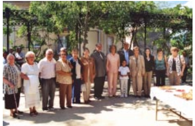
Alguns dels integrants de Suport Castellar, acompanyats de les autoritats.