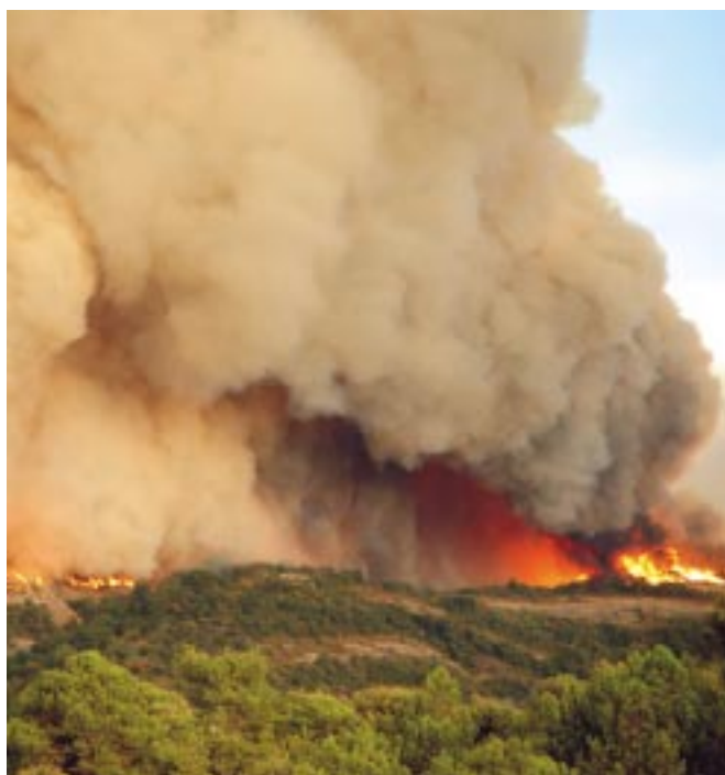
Imatge devastadora dels incendis d'aquest estiu.

Fora del municipi, han dominat les sortides per a sufocar incendis forestals. Les altes temperatures i la baixa humitat registrades des del mes de juny han afavorit els focs a tot Catalunya i han monopolitzat en gran part, la feina dels bombers aquest estiu. Ben diferent de l'any passat, quan la majoria de sortides