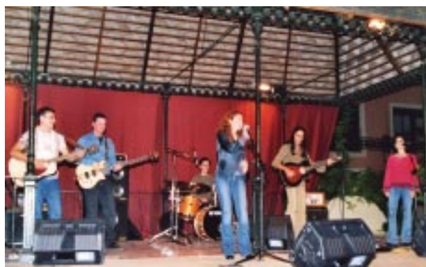
Concert dels Bars al Palau Tolrà.