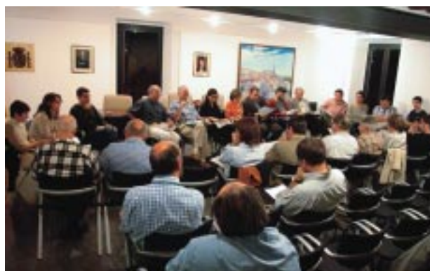
Sessió del Fòrum ambiental.