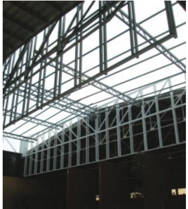
Entre el 2003 i el 2004 finalitzaran les actuacions en la part pública de l'Espai Tolrà. Mancarà la inversió privada, que inclou un hotel i cinemes.

Després d'aquesta intervenció, el consistori iniciarà seguidament les obres d'adequació de dues naus polivalents més petites i d'un local de restauració