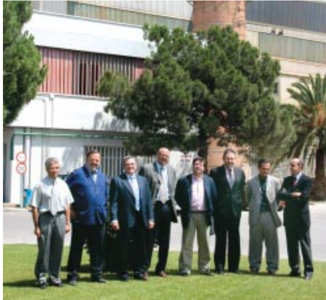
Una representació del consistori va visitar el juliol passat la planta de Castellar, on va ser rebuda per diversos directius de l'empresa.