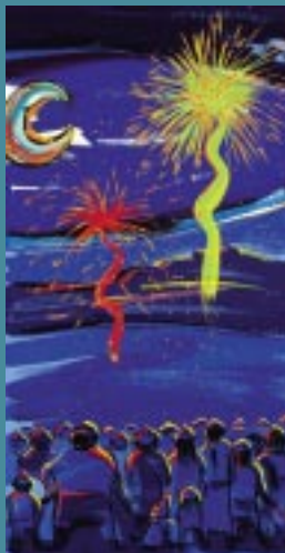
Portada: Cartell de la Festa Major Autor: Carles Martínez Calveras