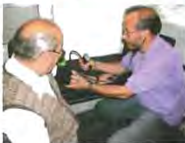
El servei ofereix a jubilats la prendre la tensió arterial

s'intenta educar als avis per tal que no abusin dels medicaments, facin exercici físic, adoptin una dieta equilibrada.