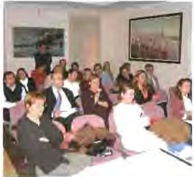
Participants a la reunió de la comissió del Consell.

A la reunió també es va debatre la possibilitat de celebrar al municipi una Diada Solidària, una proposta que ha