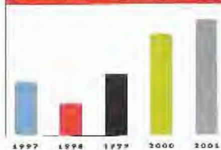
EVOLUCIÓ DE LA SEPARACIÓ SELECTIVA (Tons)