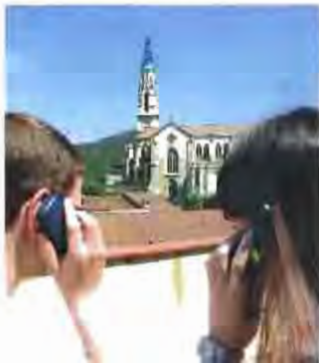
El fòrum planteja que els joves facin un ús responsable del telèfon mòbil.