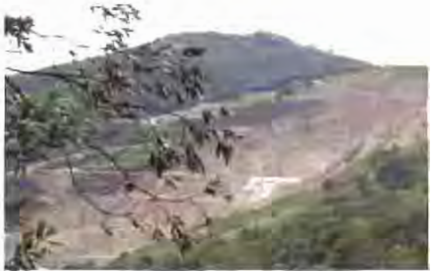
L'empresa Mesta assumeix els costos de restauració, amb un pla d'obra fixat al termini per acabar la pedrera

El Ple del passat dijous de tornada va prendre un acord històric en aprovar provisionalment el Pla Especial de la Pedrera de Vallsalient. Un pla que permetrà reordenar urbanísticament els terrenys d'aquesta explotació, quan d'aquí a tres anys cessi l'activitat econòmica que s'hi desenvolupa. D'aquí, però, per unanimitat, suposa la culminació a un llarg procés per donar cobertura legal a l'activitat que compta amb prop de 70 anys d'història.