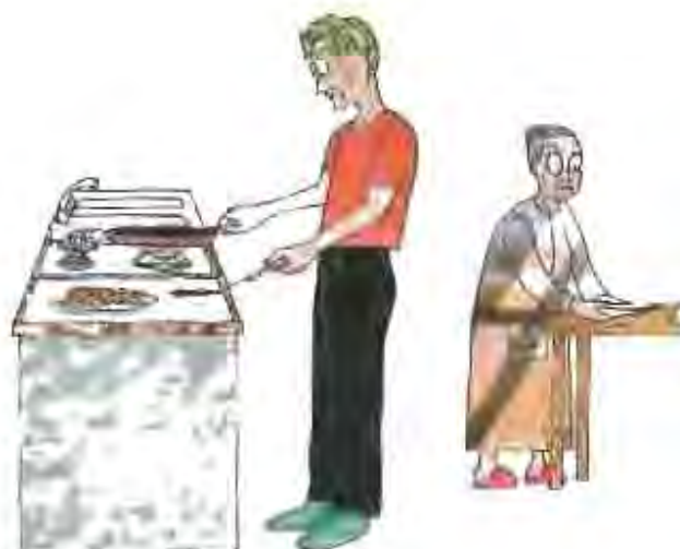
Les il·lustracions de la festa de la gent gran van ser a càrrec de Toni Guillot.

En la sessió també es va donar a conèixer les diferents activitats que es van fer després en el marc de la jornada de Salut Comunitària que va tenir lloc a Castellà el passat dia 20 de maig i que va comptar amb la presència d'un centenar de càrrecs electes i tècnics que van debatre a l'estora de diferents propostes de salut comunitària.