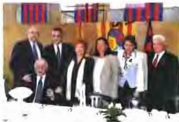
El dinar presidencial en el transcorrer del dia de germanor