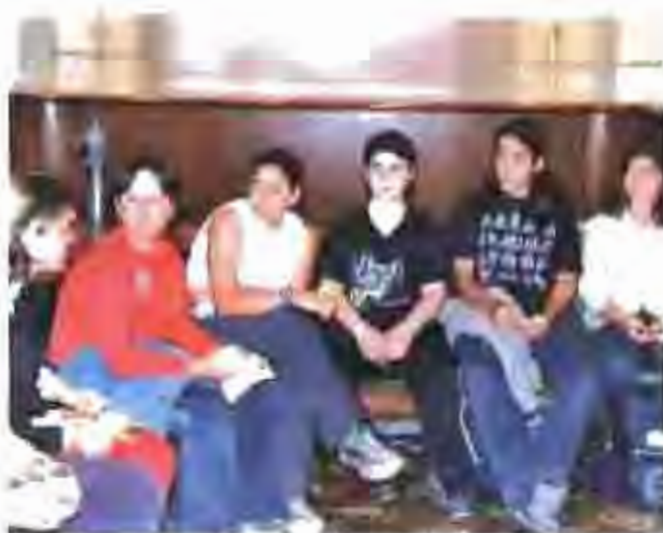
Les activitats s'inclouen dins el programa Sexe amb seny .