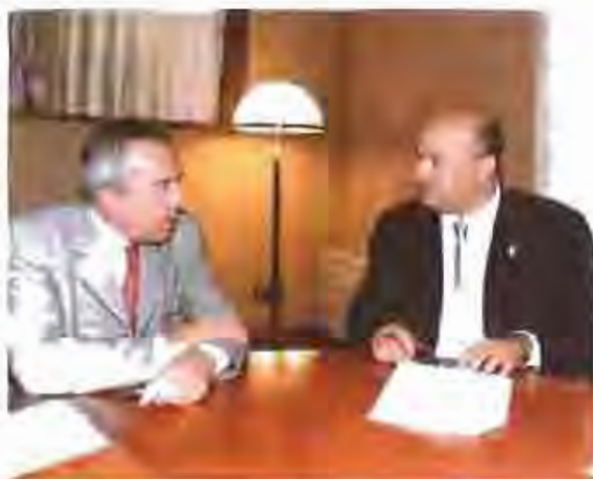
L'Alcalde, amb el president de la Diputació de Barcelona, Manuel Riera.

A proposta del Grup Municipal Socialista, el consistori també ha aprovat una moció sobre el finançament dels ens locals. El text insta el Govern de l'Estat que mantingui l'equilibri financer dels ajuntaments durant per al període 1999-2003. En aquest sentit, es vol garantir la continuació íntegra dels ingressos municipals en l'cas que finalment es feres enlevant la decisió de suprimir l'impost d'activitats econòmiques (IAE), tribut que recaptar els contribuents. La moció intenta el plantejament d'un nou model global de finançament de l'Administració local.