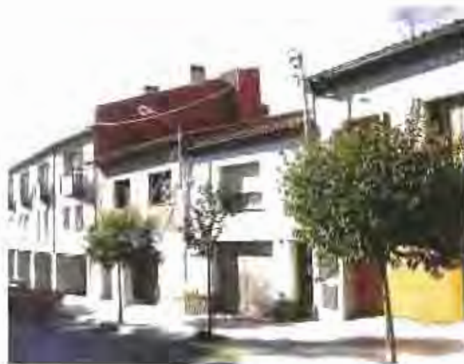
Una nova Plaça Major entrant en les condicions de construcció d'habitatges plurifamiliars al nucli antic

El consistori ha pres en els darrers quatre plens acords d'indole molt diversa però alhora de molta transcendència pel que suposen per al futur del municipi. Entre d'altres aspectes, s'han aprovat inversions per valor de 5,8 milions d'euros. S'han acordat els tràmits definitius per a iniciar la ronda de llevant i s'han aprovat inicialment els plans especials de remodelació de la plaça Major i de restauració de la Pedrera de Vallsallent. També s'ha aprovat el programa marc d'atenció integral a les persones, que durà el nom de Pluràfia. A més, s'han adjudicat les concessions del servei d'enllumenat públic i del tanatori. Aprovacions que es desenvolupen en les pàgines següents de la revista i en el número especial dedicat monogràficament a inversions.