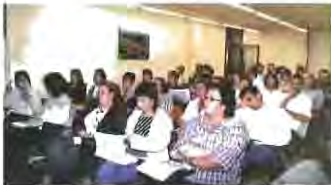
Participants a la jornada sessió de treball social amb els treballadors.