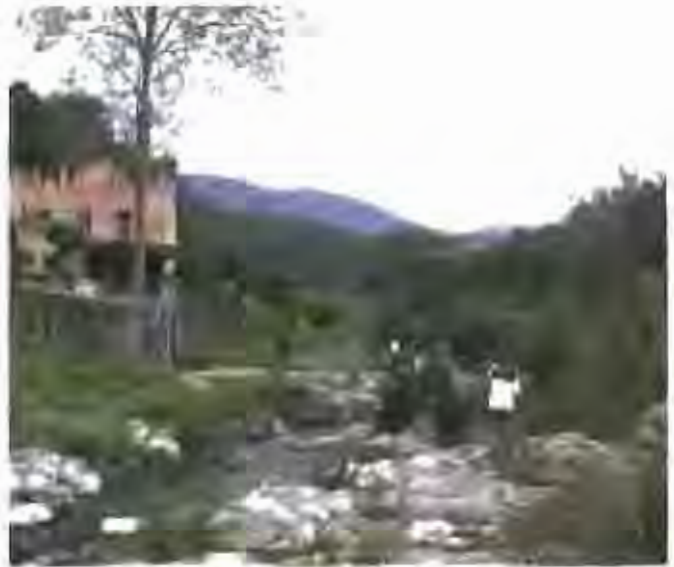
Les escoles han pres el compromís d'apadrinar per menys de 100 euros.

A cada punt del mostreig es realitza una inspecció bàsica del riu de càrrec