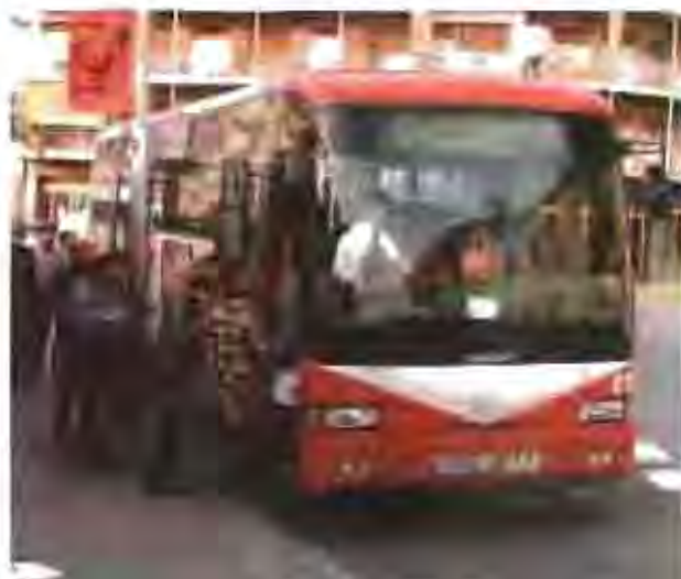
La Castellana ha reduït en 50% l'impacte mediambiental dels seus autobusos.

Aquestes actuacions es complementen, a més, amb una millora de la flota d'autobusos, per tal d'adaptar els vehicles a les persones amb mobilitat reduïda.