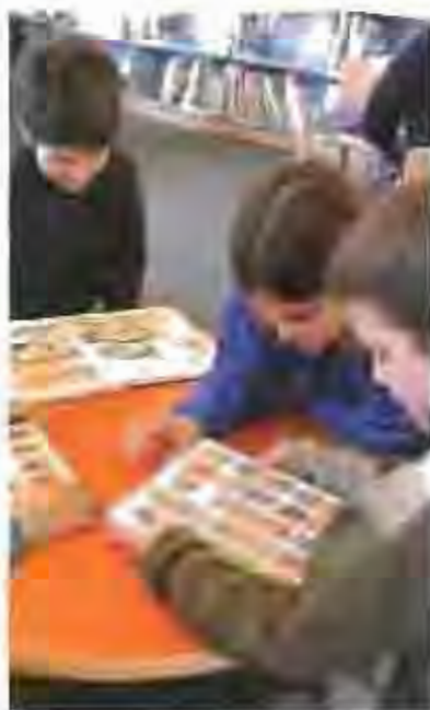
Internet, imatjacions de pel·lícules i base de dades a la sala d'estudi. Altres espais de les instal·lacions que es podran

l'altra gran novetat és el servei gratuït d'accés a internet. Des del passat 11 de febrer, es disposa de quatre punts de