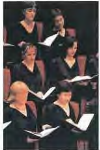
Dansa d'agost ha estat la primera obra de l'any representada a l'Ateneu. L'Auditori es va estrenar amb el Lot dels Amics de l'Òpera de Sabadell.