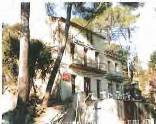
Sant Feliu del Racó tindrà a l'entrada del poble l'edifici i aquesta estarà situada a l'interior del Centre Feliuenc.

treballat en la instal·lació d'una marqueteria a la parada d'autobús de l'entrada de Sant Feliu, i en la reparació de filtracions d'aigua a l'Escola Bonavista.