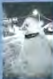
Portada: Mirat de nou al passeig.