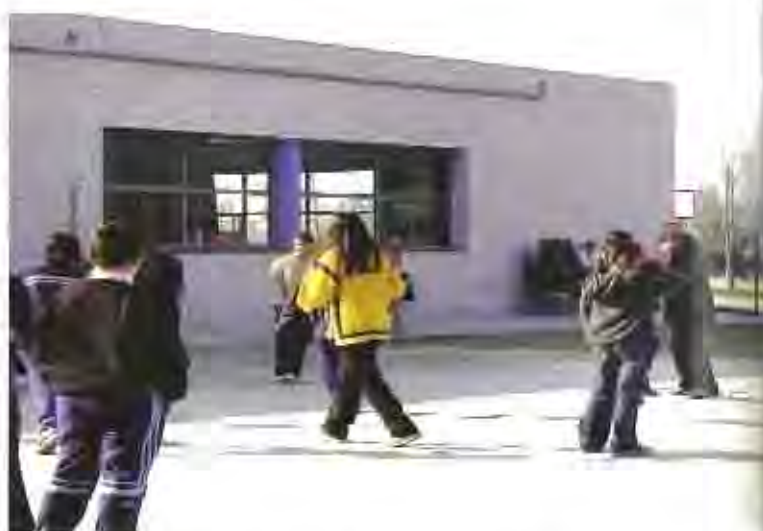
El segon IES permetrà desmassificar les aules de l'ínic centre públic de secundària que hi ha en l'actualitat a Castellà.

El pressupost total de la construcció de l'institut és d'uns 3 milions d'euros, uns 500 milions de peses. aproximadament i, si es compleixen les previsions, podria posar-se en funcionament entre els anys 2004 i 2005.