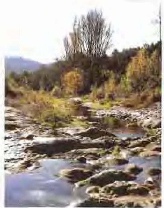
Els centres escolars han pres el compromís de donar continuïtat al Projecte rius en els cursos vponents.

El treball es farà a partir de dues visites anuals en el tram escollit: la primera, entre el 15 d'abril i el 15 de maig, i la segona, entre el 15 de setembre i el 15 d'octubre. Dos períodes que es consideren els més plujosos i en què hi ha més cabal d'aigua al riu. A cada punt del mostreig es farà una inspecció bàsica del riu de corrent general i un estudi de l'ecosistema aquàtic. D'aquesta manera, "es podran descriure les característiques físiques i químiques de l'aigua, la vida animal i vegetal que hi ha al riu i l'estat del bosc de ribera" . A més, també es farà una anàlisi mitjançant macroinvertebrats, uns animals molt petits que viuen dins el riu i que serveixen com a bioindicadors de l'aigua.