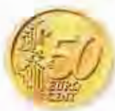
50 cèntims - 83 ptes.