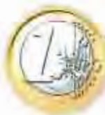
1 euro - 166 ptes.