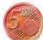
5 cèntims - 10 ptes.