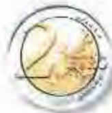
2 euros - 333 ptes.