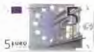
5 euros - 833 ptes.