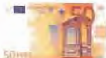
50 euros - 8333 ptes.