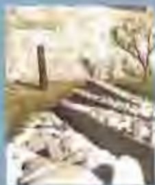
Parroquia : capçal esquerra de la plaça de l'Abat Comanys autor: Josep Guals