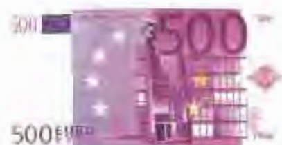
500 euros - 83333 ptes.

A partir de l'1 de gener, aquests bitllets i monedes seran in-útils perquè a les caixes i moneders.