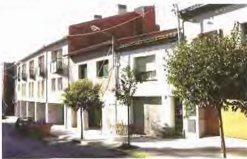
El carrer de Sant Jordi, al nucli antic de Castelló.