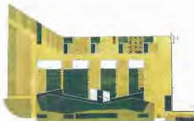
La plaça de la Fàbrica Nova permetrà esporgar tot el sector nou d'habitatges plurifamiliars de Can Tolerà.

La sala de plens de l'Ajuntament es va omplir el passat 6 de novembre de gom a gom en una nova sessió del Fòrum Ambiental que va servir per debatre les propostes urbanístiques sobre quatre espais públics que han d'esdevenir clau en un futur no gaire llunyà. D'una banda, es van presentar els nous projectes de les places de la Fàbrica Nova i dels Horts de l'Alemany. De l'altre, es van donar a conèixer les darreres novetats que incideixen també en les futures remodelacions de la plaça Major i de l'espai de Col Calissó.