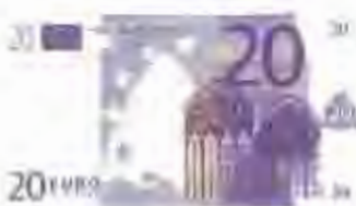
20 euros - 3333 ptes.