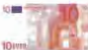
10 euros - 1666 ptes.