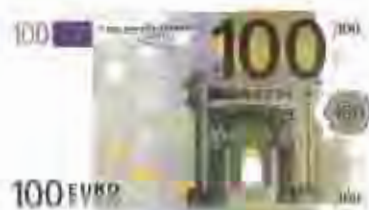
100 euros - 16666 ptes.