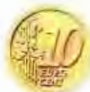
10 cèntims - 20 ptes.