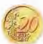
20 cèntims - 33 ptes.