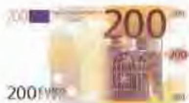
200 euros - 33333 ptes.