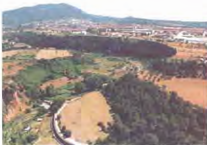
El riu Ripoll, el seu país i el terme municipal de Castellar.

Des de l'any 1997 els Ajuntaments de Castellar del Vallès, Sabadell i Barberà del Vallès han estat treballant en l'estudi de l'àmbit del riu Ripoll d'una manera unitària. Aquest procés ha culminat amb la realització del Pla Director del Ripoll Mitjà . Un document que estableix les directrius per al desenvolupament de les actuacions en els tres municipis, el punt de partida d'una gestió coordinada i un compromís de les seves corporacions.