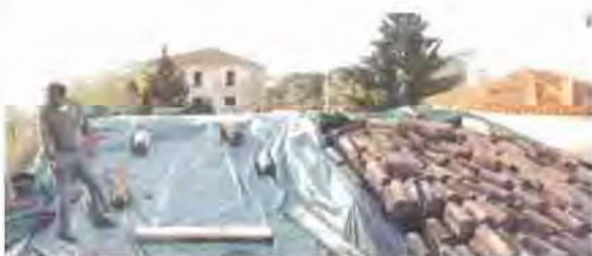
La teulada de l'edifici de la Policia Local, en procés d'arranjament.