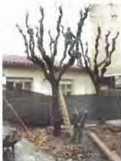
Treballs d'esporga de l'arbrat viari.