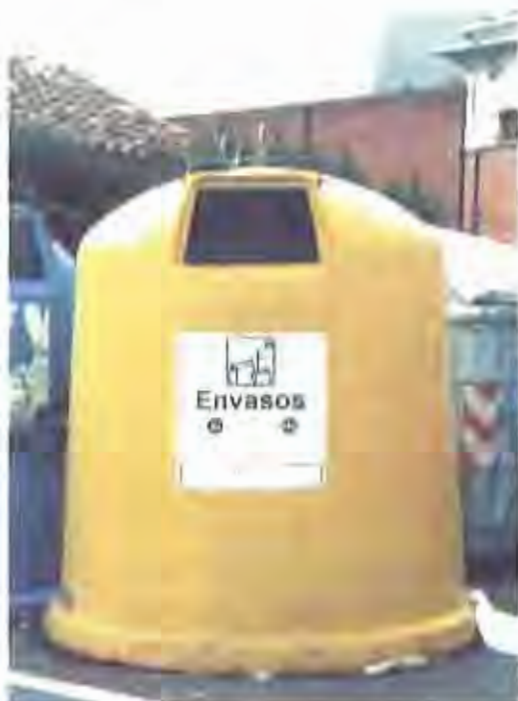
A banda de les llunes, els contenidors grossa recolliran envasos de vidre i brics.

L'Oficina 21 ampliarà en els propers mesos la dotació de contenidors de recollida selectiva. L'objectiu és aconseguir la recomanació d'un iglú de cada tipus de recollida per cada 500 habitants.