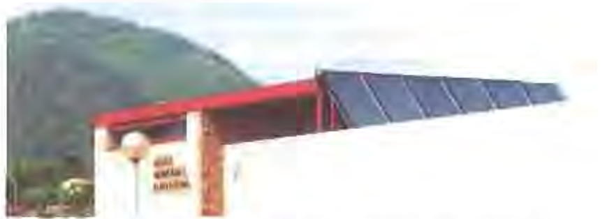
El consistori incentivarà les noves construccions que implantin mesures d'estalvi energètic.

Les ordenances municipals del 2001 també preveuen que l'Ajuntament subvencioni a fons perdut els edificis de nova construcció que fomentin l'aplicació de mesures d'estalvi energètic, i concretament l'aplicació d'energia solar. El conjunt detallat de les ordenances i el