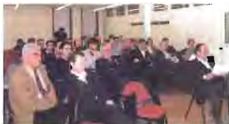
Uns 60 comerciants van assistir a la presentació de l'estudi.

L'estudi també ha assenyalat que és necessària una Associació de Comerciants més dinàmica i més representativa. Per aquest motiu el pla de dinamització aconsella la professionalització de les campanyes promogudes des de l'Associació per tal de combatre millor els problemes del sector, com és la implantació de noves superfícies comercials al polígon. En aquest sentit, la darrera sessió del ple de l'Ajuntament va aprovar per unanimitat una moratòria per a la instal·lació de nous establiments de mitjana superfície del sector alimentari al municipi.