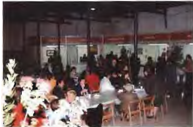
Imatge d'arxiu de la Mostra de 1998.

ticipació local sinó que també atrauen l'atenció de visitants foranis. En aquest cas, l'objectiu és, tal i com diu Montse Gatell, "donar a conèixer la bona qualitat dels restaurants, pastisseries i establiments especialitzats en vins i caves que hi ha a la nostra vila" .