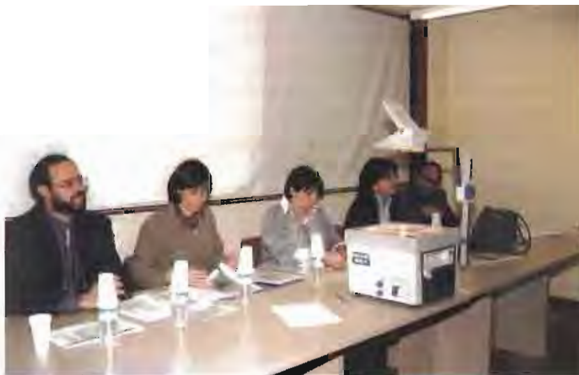
El Consell Municipal Socio-sanitari va aplegar més de 70 persones.

jançant la realització d'un total de 650 enquestes, és a dir, un 33 per cent de tota la població castellarenca major de 65 anys.