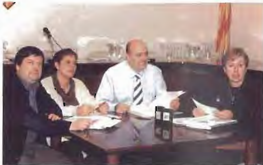
Imatge de la roda de premsa que l'equip de govern va oferir abans de la celebració del Ple.

Els projectes d'urbanització i pavimentació de diversos carrers del municipi preveuen destinar a l'entorn de 40 milions més. En aquest cas es