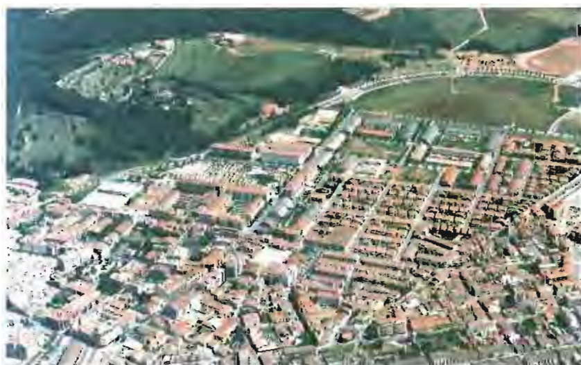
Una vista panoràmica recent de Castellar del Vallès.

L'Ajuntament ha iniciat les primeres tasques per definir i debatre el model de municipi que el consistori pretén assolir en els propers anys. El Castellar del futur quedarà concretat dins el Pla Estratègic, una eina de treball que acaben d'engegar els regidors del grup municipal d'Esquerra Republicana a través d'una regidoria específica. Segons els dos regidors d'aquest grup municipal l'èxit i la qualitat del Pla Estratègic dependrà del nivell de participació ciutadana que es pugui assolir.