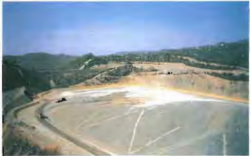
L'abocador de Coll Cardús, situat a la població vallesana de Vacarisses, és el lloc on van a parar la majoria de deixalles domèstiques del nostre municipi.

El consistori va aprovar per unanimitat un protocol per a l'eliminació de residus, signat entre l'empresa Tratesa, que gestiona l'abocador de Coll Cardús (Vacarisses), i els ajuntaments de Castellar, Barberà i Sabadell. El document garanteix que els municipis que històricament han abocat a la planta de Vacarisses, entre els quals hi ha el nostre, puguin seguir-hi abocant les seves deixalles fins l'any 2006, com a mínim.