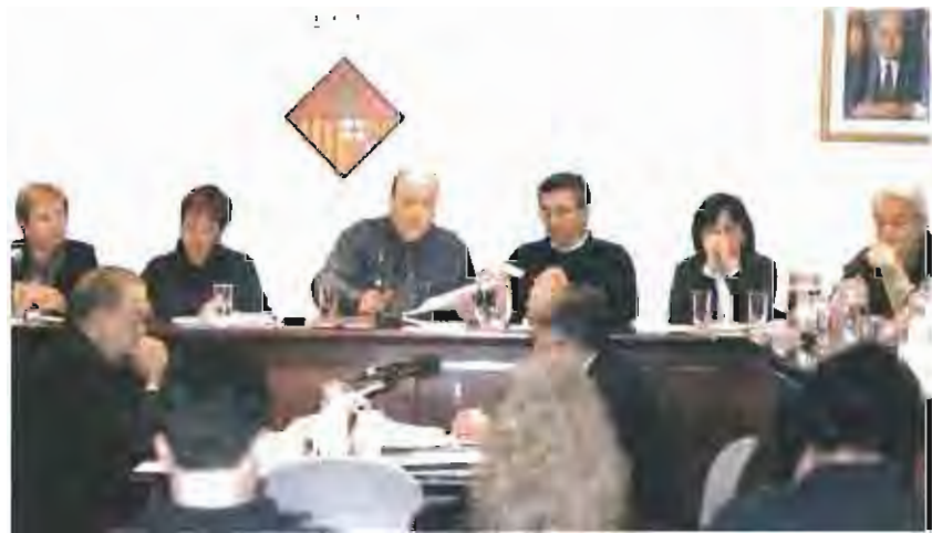
Una imatge del darrer Ple municipal, que va tenir lloc el passat dia 30 de novembre.

El pressupost ordinari per a l'any 2000 és de 1.650 milions de pessetes, import que equival a uns 9,91 milions d'euros. La xifra és només un primer indicador que ja el proper mes de gener es veurà incrementat fins als 1.720 milions de pessetes, quan el Ple aprovi la primera modificació del pressupost. Aquest primer canvi preveu incorporar el romanent de 70 milions generats per la liquidació de l'exercici actual de 1999.