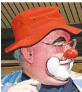
© Gabi Ruiz Bailón · Director

Any rere any ens retrobem amb aquesta manifestació clownesca que és la Setmana del Pallasso, i cada any resulta més difícil abastar les expectatives que es van creant al seu voltant. Això és bo perquè és una demostració de l'evolució positiva i de l'arrelament que aquest festival va assolint. És una mostra de la importància de fer les coses amb il·lusió i creient fermament en allò que es fa.