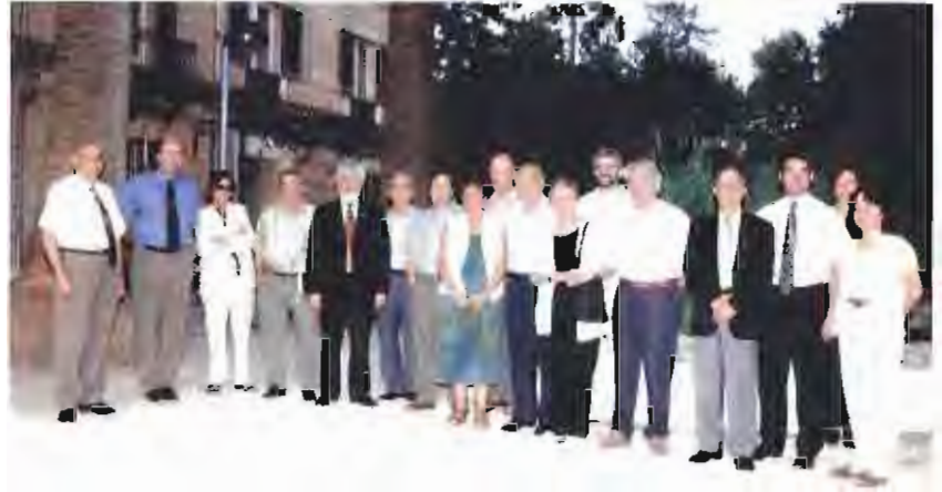
Aquesta és l'última fotografia del consistori 1995-1999

Després de les eleccions del 13 de juny passat, l'Ajuntament de Castellà va celebrar el 29 de juny passat el darrer ple de la legislatura. Un ple eminentment protocol·lari que va servir per aprovar l'acta de la sessió anterior i per acomiadar el total de 7 regidors que aquesta legislatura ja no continuen. Durant aquest ple els regidors que han estat almenys vuit anys al consistori van rebre una insígnia d'or del municipi com a recordatori i com a reconeixement a la seva dedicació.