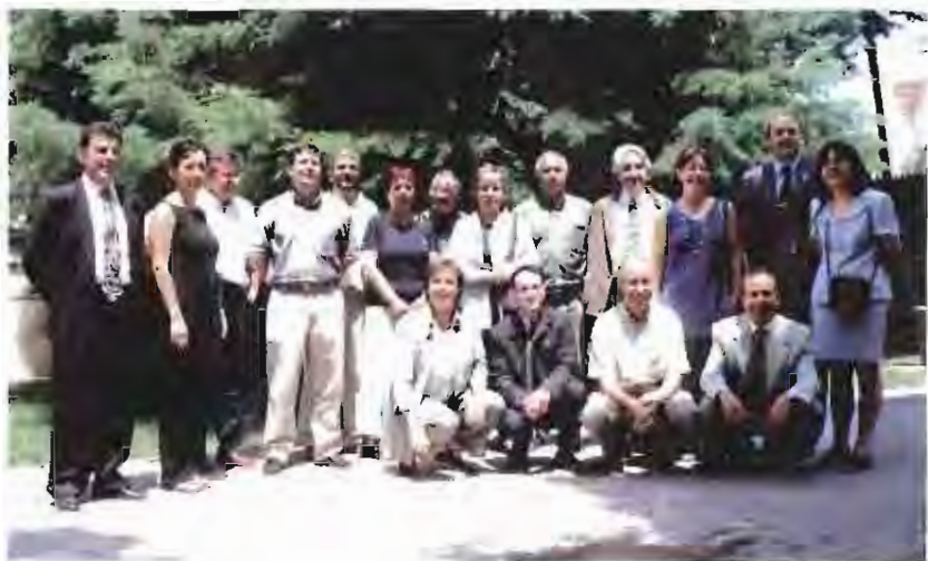
Aquests són els 17 integrants del nou consistori

La sessió de constitució de l'Ajuntament és un dels actes que més gent aplega a la Sala de Plens de l'Ajuntament. I és que és un dels moments de la vida democràtica del municipi on els partits tracen els primers esbossos del que marcarà la política del consistori en els propers quatre anys.