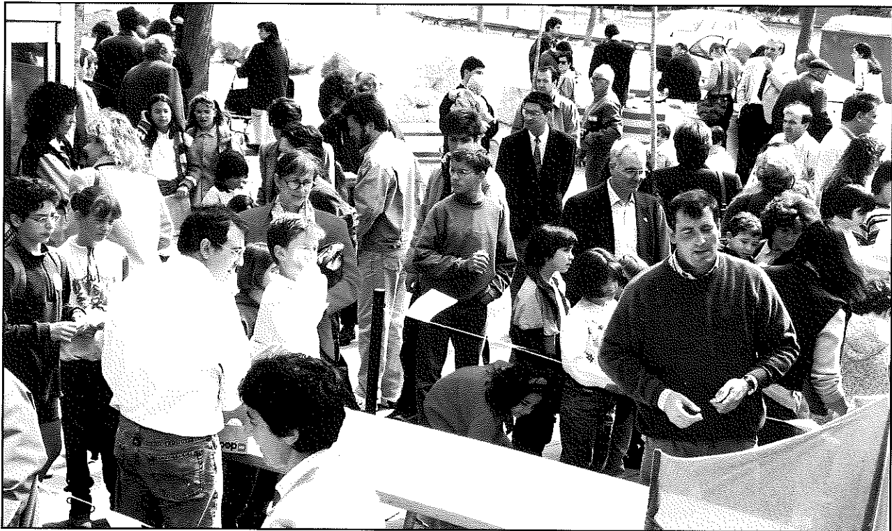
Amb la renovació del padró quedaran actualitzades les dades personals de tots els castellarencs