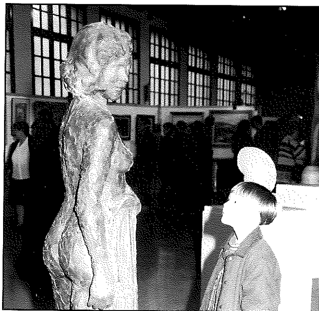
Una escultura exposada en la sisena edició de Firart.

Un total de 12.000 persones van visitar la sisena edició d'aquest certamen, una xifra lleugerament superior a l'enregistrada en l'anterior edició. Firart, que se celebra cada dos anys, va néixer el 1986 com una mostra bianual on no hi participaven només artistes sinó que també ho feien comerços i indústries de la vila. Des de l'edició de 1994 s'hi exposen exclusivament obres d'art.