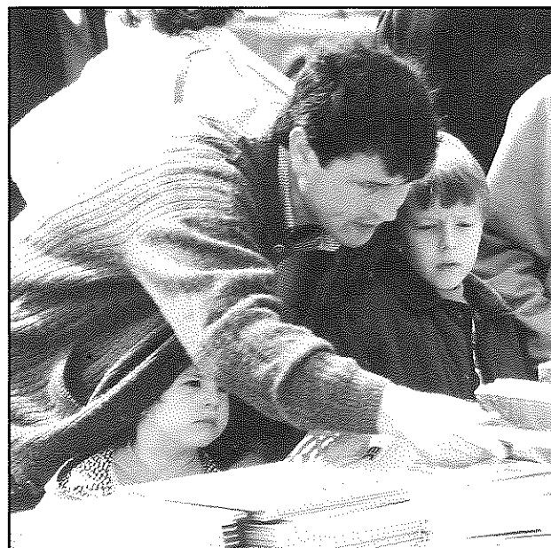
Com cada any, els llibreters del poble van ser a la plaça Major per Sant Jordi i van oferir les darreres novetats editorials.

les parades de llibres de Sant Jordi de diversos llibreters de Castellar. Cada una d'elles mostrava les novetats editorials d'aquest any i un ampli ventall de llibres per a tots els gustos, aficions i edats. Mentre els pares compraven el lot de llibres per a la família, els més menuts van poder fruit de la fira d'entreteniments que l'entitat La Xarxa havia organitzat a la mateixa Plaça Major.