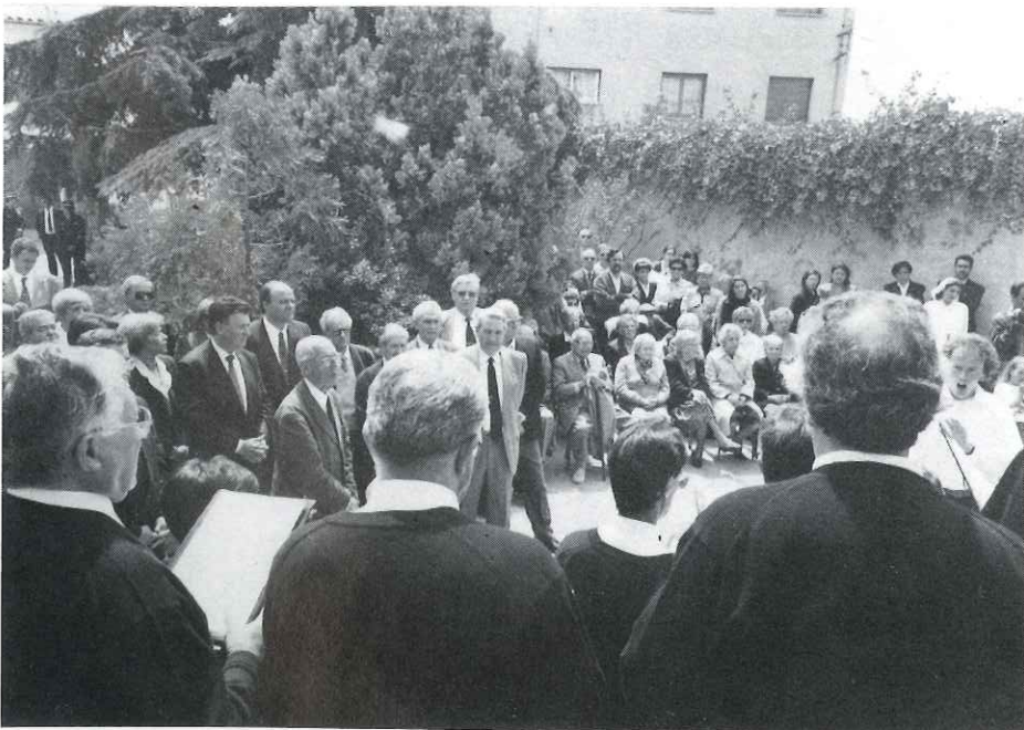
En l'acte festiu hi van participar les corals Sant Esteve i Xiribec