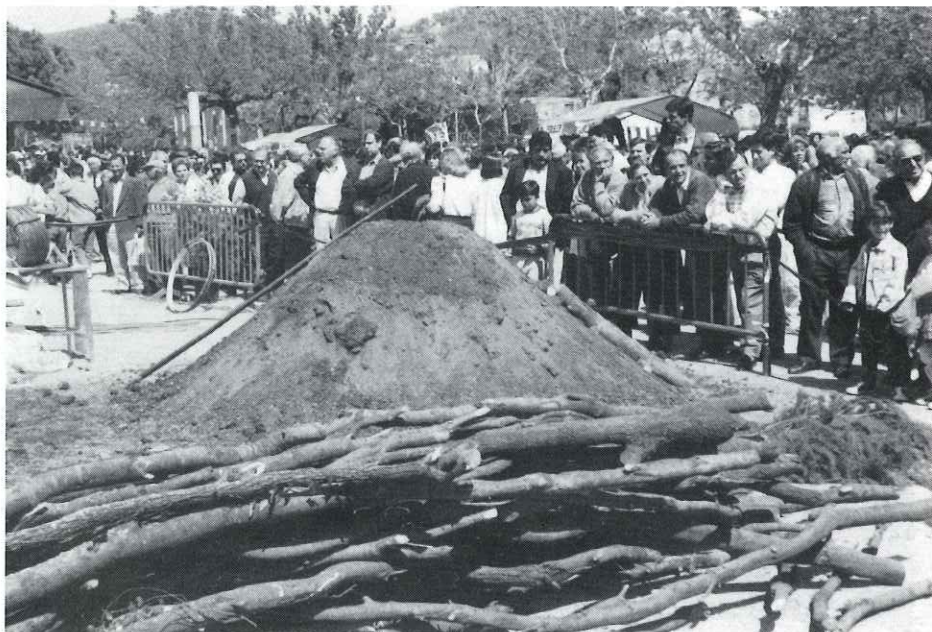
Els carboners van ser la novetat d'aquest any

Sens dubte es pot dir que la diada de Sant Jordi, Castellar va ser una festa amb la VII Mostra d'Oficis Artesans i la venda de llibres i roses al passeig de la plaça Major, així com l'activitat del Grup Rialles de Castellar muntada per entretenir la mainada.