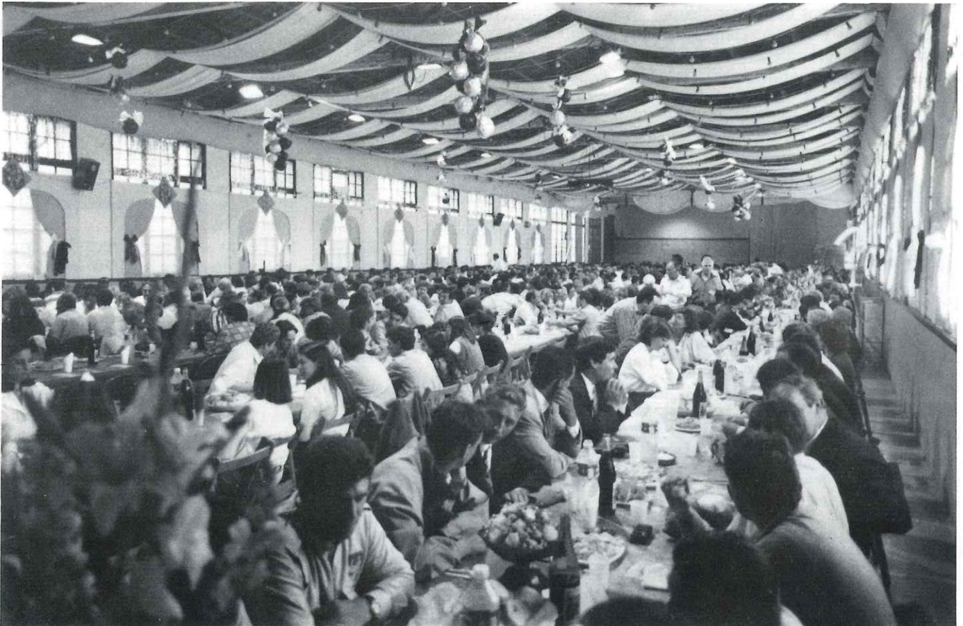
La Nau de la plaça Major va acollir 900 persones vingudes de tot Catalunya