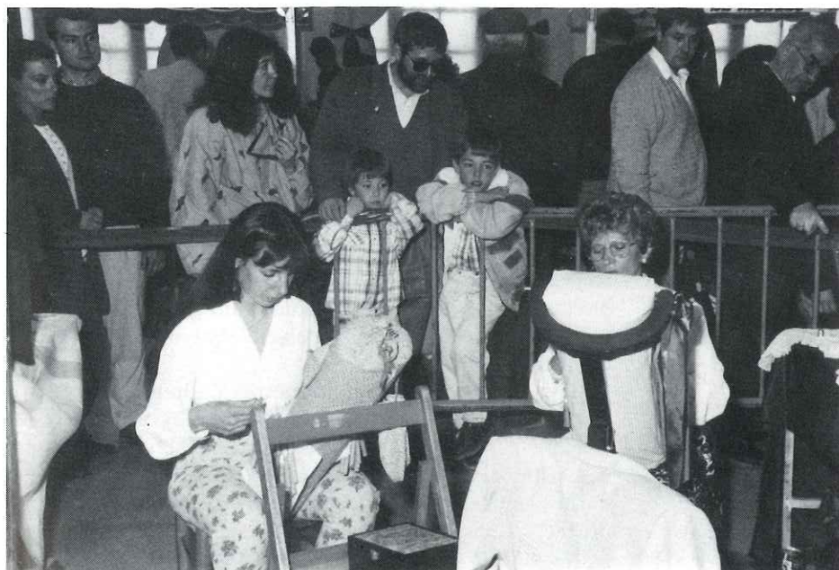
La VII Mostra va tornar a ser un èxit d'artesans i de públic

La diada de Sant Jordi d'enguany amb la VII Mostra d'Oficis Artesans, les parades de llibres i roses i les actuacions a l'Auditori Municipal, han posat el llistó molt alt de les activitats culturals i de lleure de la nostra vila, cada dia en augment.