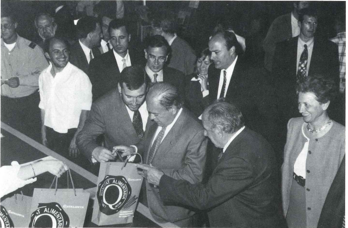
En la VI Trobada d'ADF de tot Catalunya, Jordi Pujol va estar acompanyat dels consellers de Governació i d'Agricultura entre altres personalitats