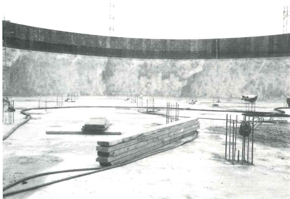
El dipòsit de Canyelles és enorme. Té una cabuda de 8 milions de litres d'aigua

En un futur pròxim serà l'antena d'emissió de Ràdio Castellar del Vallès, l'emissora municipal.