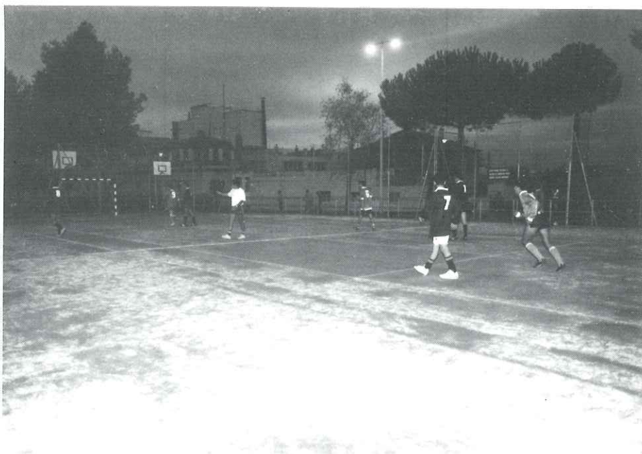
A la pista de les piscines d'estiu s'hi ha col·locat gespa artificial, cosa que ha contribuït al seu èxit

Així va acabar una jornada molt interessant en un ambient cordial i distès que ha de fer possible que govern i oposició continuïn fent la seva tasca respectiva, però en un clima de respecte i cordialitat mútua, que de ben segur que repercutirà en una millor gestió dels problemes de tot Castellar.