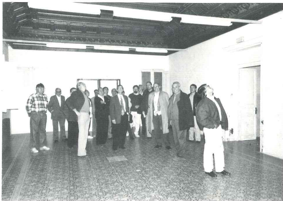
El palau Tolrà va ser adquirit per l'Ajuntament l'any 1987

conselleria de Sanitat i Benestar Social s'hi traslladarà la Policia Local; a l'edifici principal del palau Tolrà la totalitat de les dependències que hi ha al carrer Major i, a més, les conselleries d'Ensenyament, Esports i Medi Ambient.