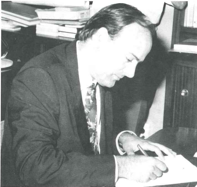
L'alcalde Lluís M. Corominas