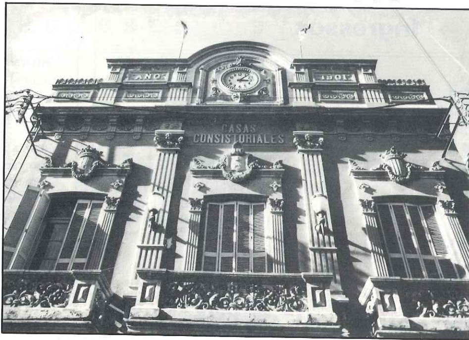
El pressupost municipal per al 1990 puja més nou-cents milions

El pressupost municipal d'enguany s'emmarca dins d'una nova etapa dels ajuntaments, donat que entra en vigor la nova llei d'hisendes locals de 1988 que permet als ajuntaments una major autonomia municipal en preveure una àmplia flexibilitat en les ordenances fiscals, que el consistori de Castellar va aprovar a finals de l'any passat, i que s'incorporen en aquest pressupost.