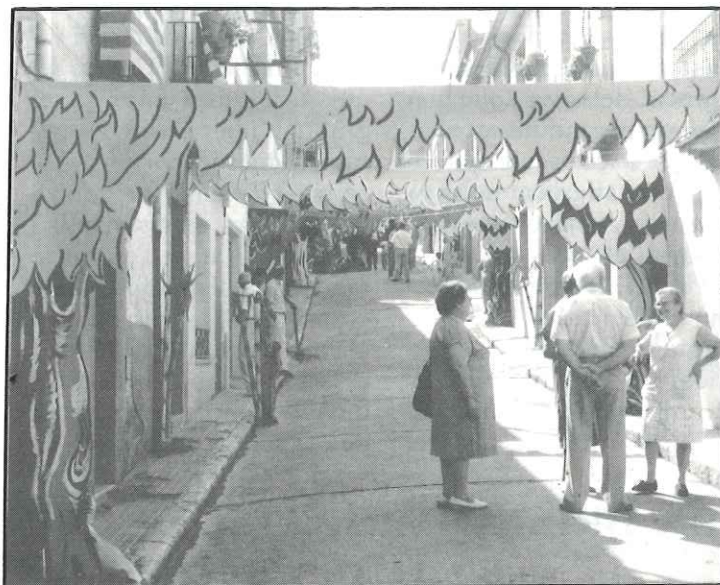
L'engalanament de carrers i places és un dels majors atractius de la Festa Major de Castellar en els últims anys.

7. Al primer classificat se li farà entrega d'una placa de marbre.