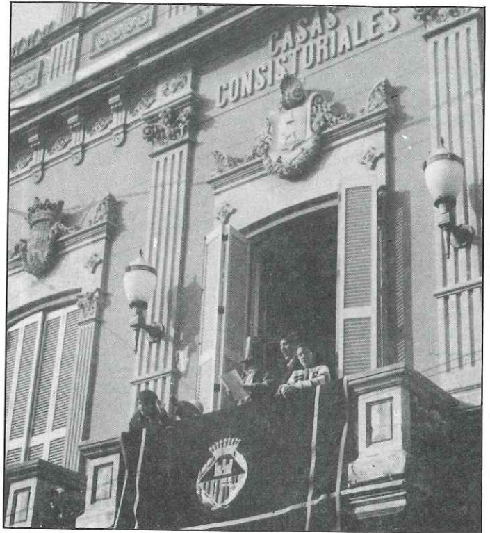
El dia 28 de desembre, l'Alcalde més innocent de la vila va adreçar una allocució als castellarencs.

Aquestes activitats han contribuït de manera força lúdica a viure l'ambient propi de les festes nadalenques.