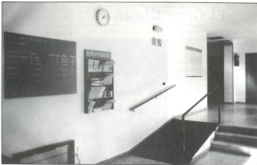
Des de fa unes setmanes, l'Ambulatori compta amb una nova retolació.

Per demanar número d'injectables, es necessita presentar el volant P-10 així com la targeta d'afiliació a la Seguretat Social