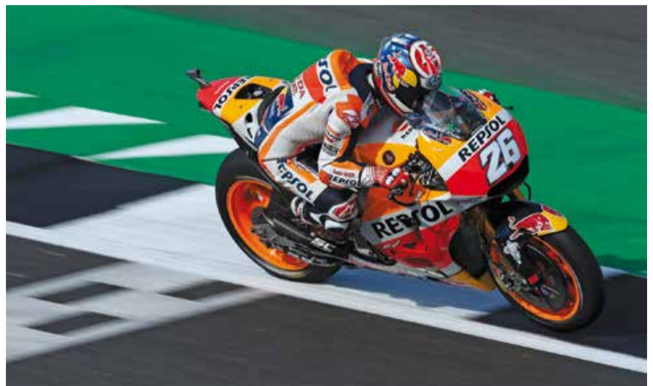
Dani Pedrosa només va poder aconseguir la setena posició al circuit anglès de Silverstone.

on cada vegada s'escurçaven més les diferències i 'Dovi' es col·locava en segona posició després d'aconseguir la tercera victòria de la temporada.