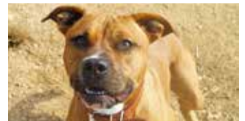
MARVEL Edat: 2 anys