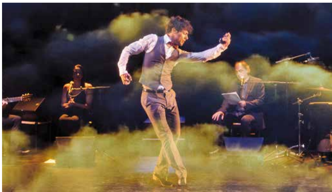
'Federico García', de Pep Tosar, un homenatge al poeta, es podrà veure el 18 de novembre a l'Auditori Municipal.

Per a commemorar el 81è aniversari de la mort de Federico García Lorca, Pep Tosar s'apropa al món interior del poeta en un viatge pels paisatges de Castella i Andalusia. L'acte tindrà lloc el proper 18 de novembre. Ciara , de Bohemia's Produccions es podrà veure, no a l'Auditori, sinó a la Sala de Petit Format de l'Ateneu, el dia 15 de desembre. L'Ateneu també serà l'escenari, els dies 15, 16 i 17 de setem-