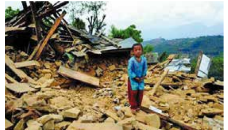
El terratrèmol va devastar el 25 d'abril de 2015 el Nepal.