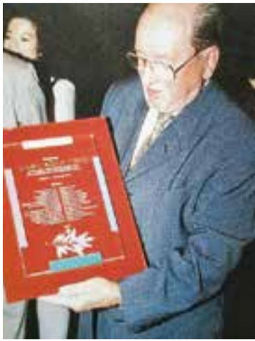
Homenatge a Mercadé al 2000.

Va exposar l'any 1964 a la seva ciutat natal, Sabadell, a l'Acadèmia de Belles Arts, i posteriorment també ho va fer al Cercle Sabadellès, a la Pinacoteca de Sabadell, a