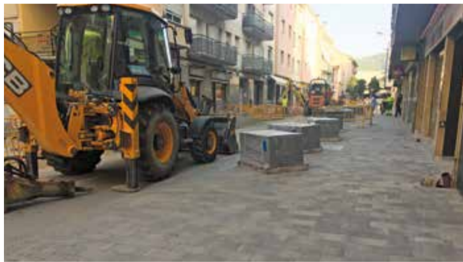
Imatge de les obres que s'estan fent al carrer Sala Boadella.

En total, la inversió prevista és de 193.000 euros, dels quals 113.000 es corresponen a obres de reparació d'asfalt i els 80.000 restants a la reparació de voreres i guals del municipi. Precisament, aquestes dies s'estan duent a terme treballs d'adaptació de guals per a vianants a la ronda de Tolosa i a la zona propera al CAP i a l'escola Joan Blanquer. +