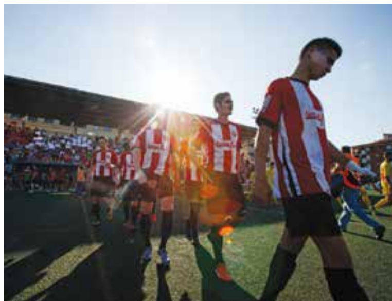
La UE Castellar en una imatge de la temporada passada.

Aquesta temporada la UE Castellar estrenarà la nova gespa al Pepín Valls, que va començar-se a renovar aquest agost i s'espera que estigui llesta per la segona jornada de lliga del 10 de setembre, quan el Llagostera B visitarà la Vila. Per aquest motiu, el torneig del Vallès ha canviat de data -originàriament el dia 7- i es disputarà el dia 12. †