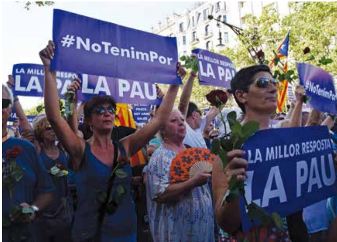
Un grup de castellers al mig de la manifestació desfilar pel Passeig de Gràcia.

L'autocar sortia passats dos quarts de quatre de Castellar i arribava a Barcelona prop d'una hora més tard. El moviment de gent ja es denotava i la multitud es començava a concentrar al passeig de Gràcia. Allà gairebé tots els castellers van agafar les roses que es repartien per simbolitzar la solidaritat amb