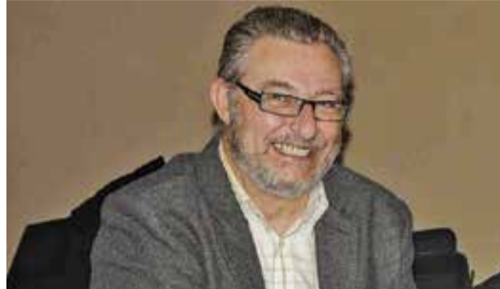
Una imatge d'arxiu de l'expresident de Comerç Castellar.