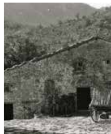
Arxiu d'Història de Castellar