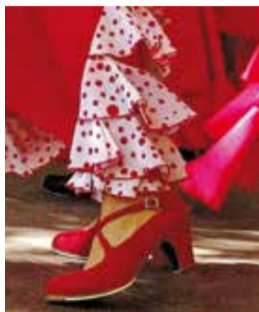
Aires Rocieros Castellarencs