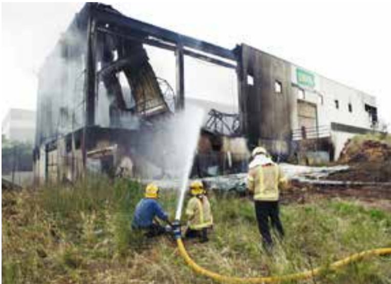
Tasques d'extinció de l'incendi, el juliol passat.

La seu de l'empresa Dispopack Vallès va cremar el juliol passat