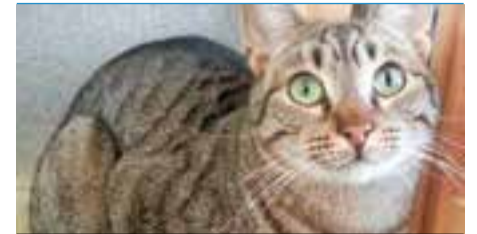
SHERLOCK Edat: desconeguda