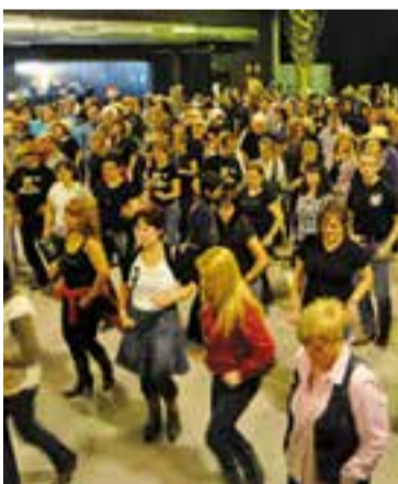
Amics del Ball de Saló