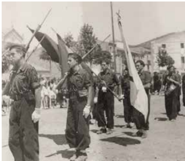
La plaça Major en una imatge després del final de la guerra civil.

L'Arxiu Nacional publica la llista de processos i resolucions dictades per tribunals militars