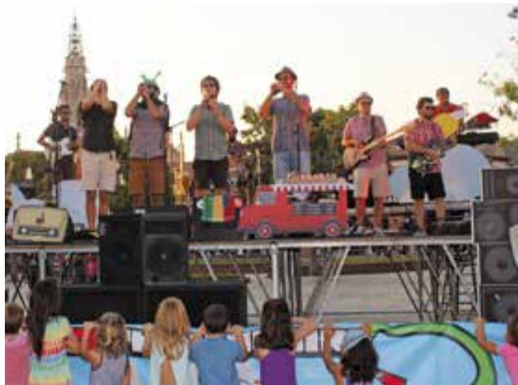
The Penguins a la Festa Major 2016, a la plaça Major de Castellar.

bre, de tres representacions de l'obra El retaule del flautista de T.I.C. Escènic. L'ETC també ha programat, per als dies 10, 11, 12, 17, 18, 19, 24, 25 i 26 de novembre, l'obra El chico de la última fila .