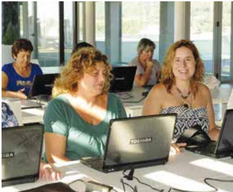
Tornen els cursos d'informàtica i de noves tecnologies a El Mirador.

La nova proposta formativa d'El Mirador, que comença a l'octubre, també inclou cursos d'expressió corporal, arts plàstiques i habilitats socials