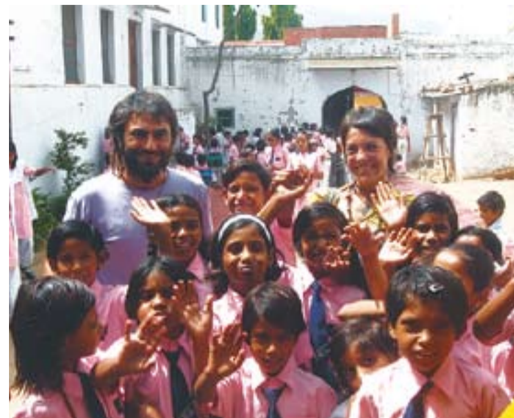
© Alumnes de l'escola de Pushkar, a l'Índia. || CEDIDA

La Bústia Oberta, que serveix per a què la ciutadania envii preguntes, queixes i suggeriments, és el servei més utilitzat, amb un 65% dels tràmits. El segueixen amb un 25% els tràmits relacionats amb el padró. La resta de serveis són, per exemple, la sol·licitud de certificats de convivència, la domiciliació de tributs o la sol·licitud de cites amb càrrecs públics. +