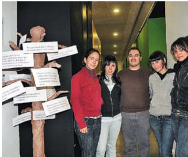
El taller de creació de l'escultura L'arbre dels Drets Humans .

gurar la mostra Malalts mentals a l'Àfrica. Els grans oblidats . Aquesta exposició il·lustra la situació de les persones que viuen en aquest continent amb una discapacitat afegida a les dures condicions de vida de la regió. Es tracta d'una activitat organitzada per Viatges i més per sensibilitzar les persones que, moltes vegades, desconeixen aquesta situació. La mostra es pot visitar fins diumenge al vestíbul de l'Ateneu, de 18 a 20 hores i dissabte i diumenge, d'11 a 12 i de 18 a 20 hores. †