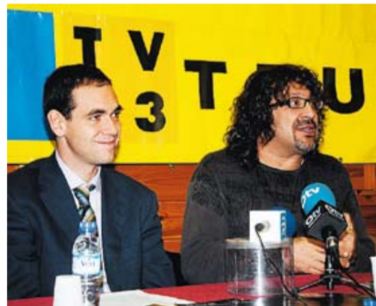
© Pep Sala durant la roda de premsa per la Marató de TV3. || JOSEP GRAELLS

voluntària en aquest dia i diu: “És un honor que em fa moltíssima il·lusió. Estic acostumat a fer aquest tipus d'accions solidàries i quan m'ho van proposar no vaig dubtar ni un moment a dir que sí” . El Club de Tennis Castellar és l'entitat responsable que l'artista hagi acceptat la invitació i espera que faci venir molta gent. Les entrades costen 10 euros i es poden adquirir a la Regidoria de Cultura, de 17 a 20h i al Club de Tennis, de 9 a 12 hores i de 17 a 20 hores. La totalitat del preu es destinarà a la recaptació de fons per a la Marató de TV3. +