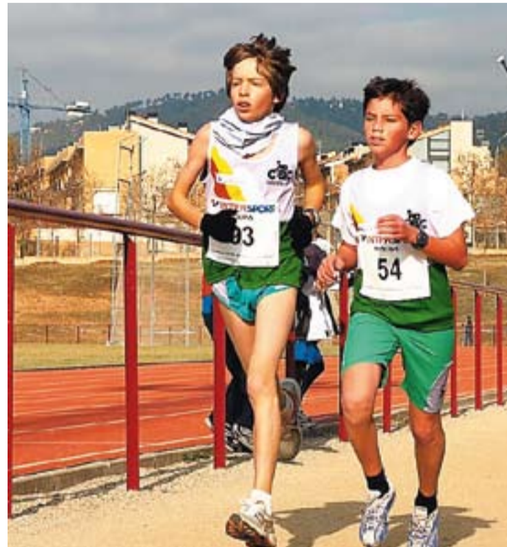
© La cursa absoluta en categoria masculina del Cros Vila de Castellar. || C.A.C.