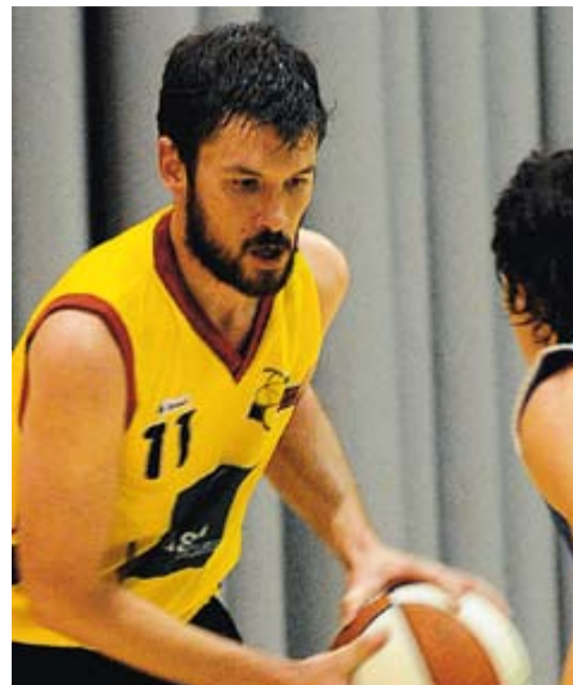
© Fernando Flores (esquerra) ja no és entrenador de l'equip femení. El substitueix Jordi Juste (al centre), actual coordinador i entrenador de l'equip masculí, que perd Mike Woodward (dreta). || JOSEP GRAELLS