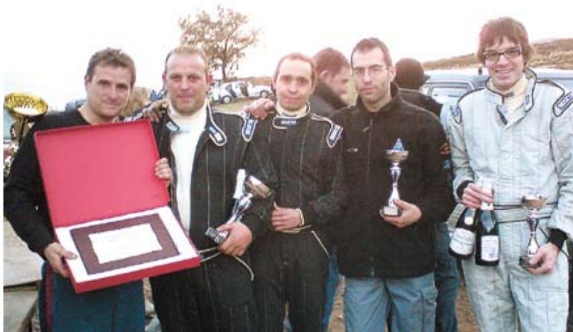
Membres de l'Escuderia T3 després de les Cinc Hores de Resistència d'Avià.