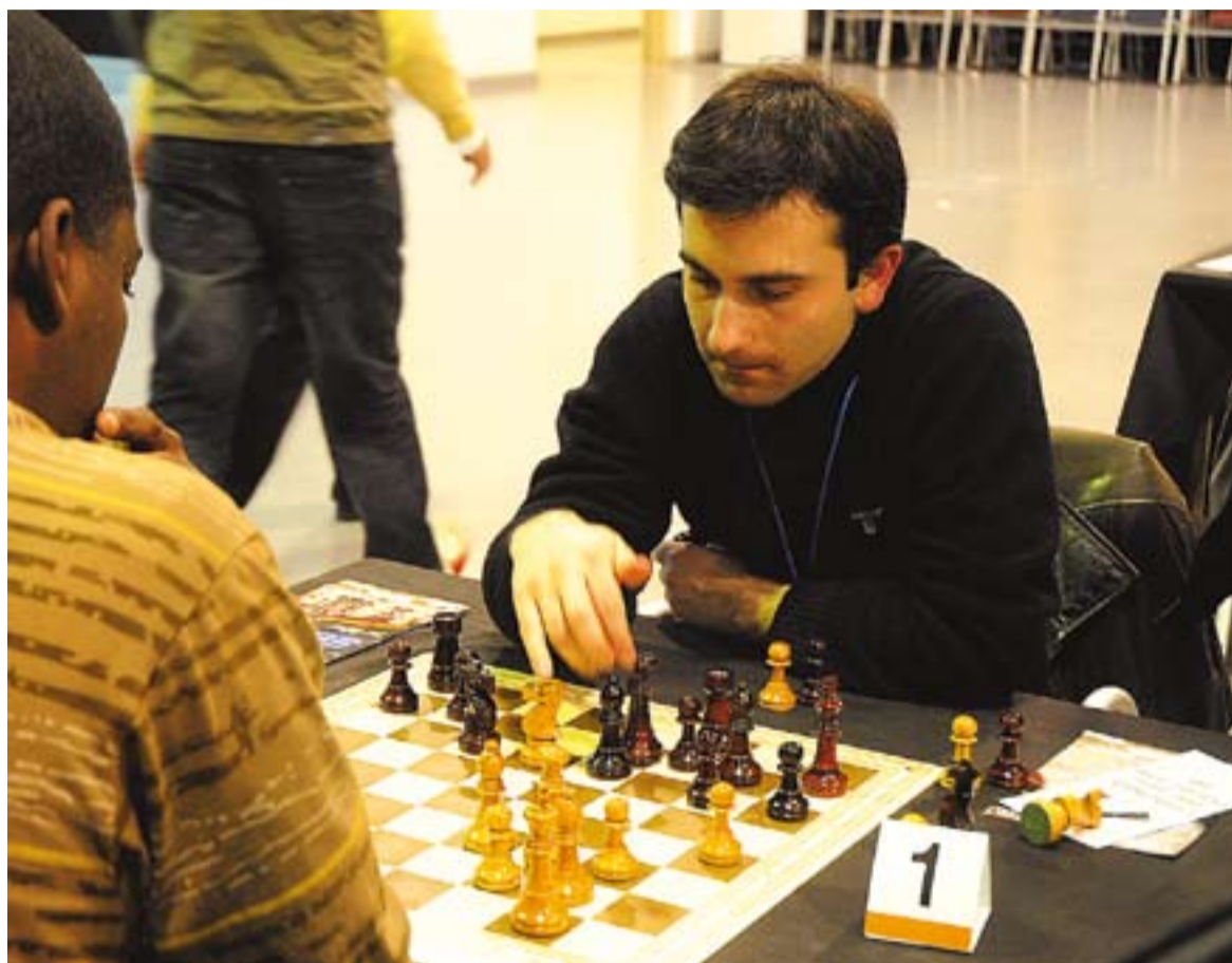
El vencedor de la prova en una imatge del Memorial Joaquim Marzà Peiro.