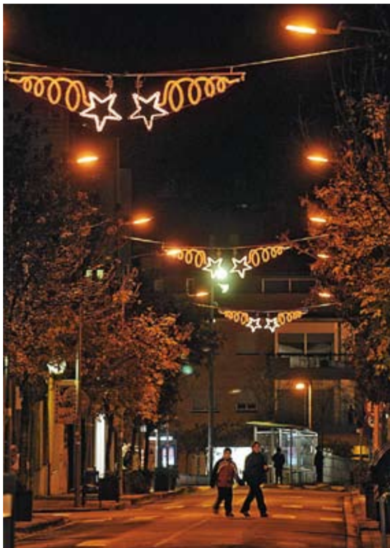
⊙ La carretera de Sentmenat il·luminada amb els llums nadalencs.

ESTRENA DELS CARRERS PER A VIANTS || Els carrers Sala Boadella i Montcada s'inauguraran aquest dissabte amb una festa, de 10 a 13 hores. A les 11 hi haurà una cantada de Nades amb la Coral Sant Esteve. Després, s'iniciarà l'actuació de Ball de Bastons i a les 12:30 hores el Ball de Gitanes. També es farà un taller infantil, contes de carrer, jocs gegants, un taller de maquillatge, un taller de postals de Nadal i un altre d'intercanvi de punts de llibre. +