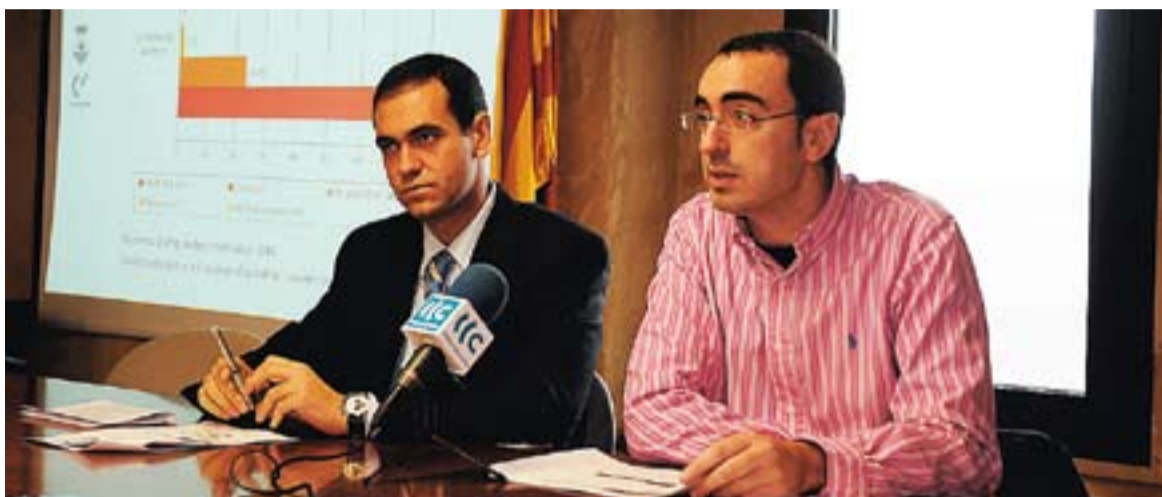
© L'alcalde de Castellar, Ignasi Giménez, i el regidor de Règim Intern i Relacions Ciutadanes, Òscar Lomas. || J.G.

Un 75% de les persones enquestades està "molt satisfeta" amb el SAC