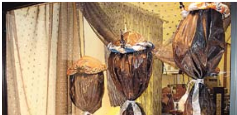
L'aparador de la botiga Abenoza, una de les participants al concurs.

La Cambra atorga cinc premis de 1.000, 600, 400, 200 i 150 euros respectivament. A més, l'Ajuntament atorga tres premis als millors establiments de 600, 450 i 300 euros cadascun. Dels 20 comerços que prenen part al concurs d'aparadors, 16 són membres de l'ACC. Els establi-