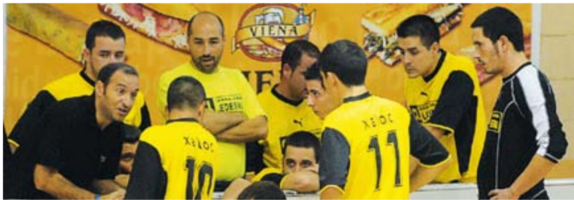
⊕ Concentració màxima per als de Xavi Romance si volen seguir líders.

L'equip de Xavi Romance ocupa el primer lloc de la taula, tot i que té un partit més que l'Avinyó, que es troba segon a tres punts. El primer enfrontament serà aquest cap de setmana