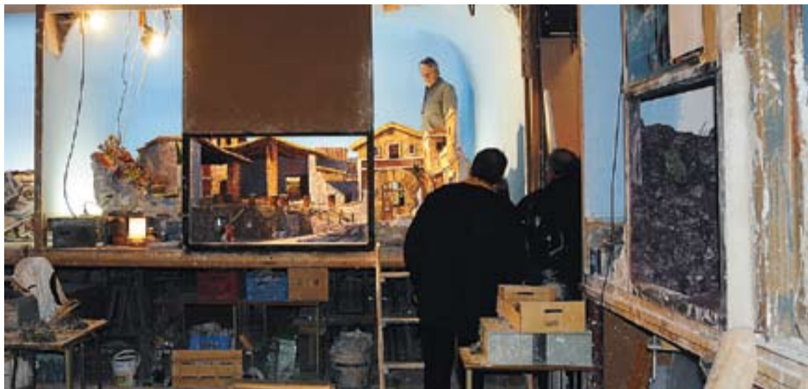
Els pessebristes fan els últims retocs als diorames 48 hores abans de la inauguració.