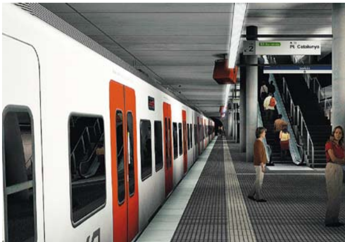
Simulació d'una estació de tren del Metro del Vallès a Sabadell.