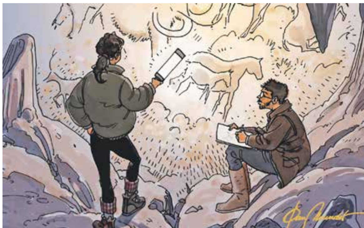
© Recer i cerca. || JOAN MUNDET

En el número d'abril de 2015 col·laboren 10 autors que han produït 10 estudis, 5 ressenyes i la memòria de l'Arxiu Municipal