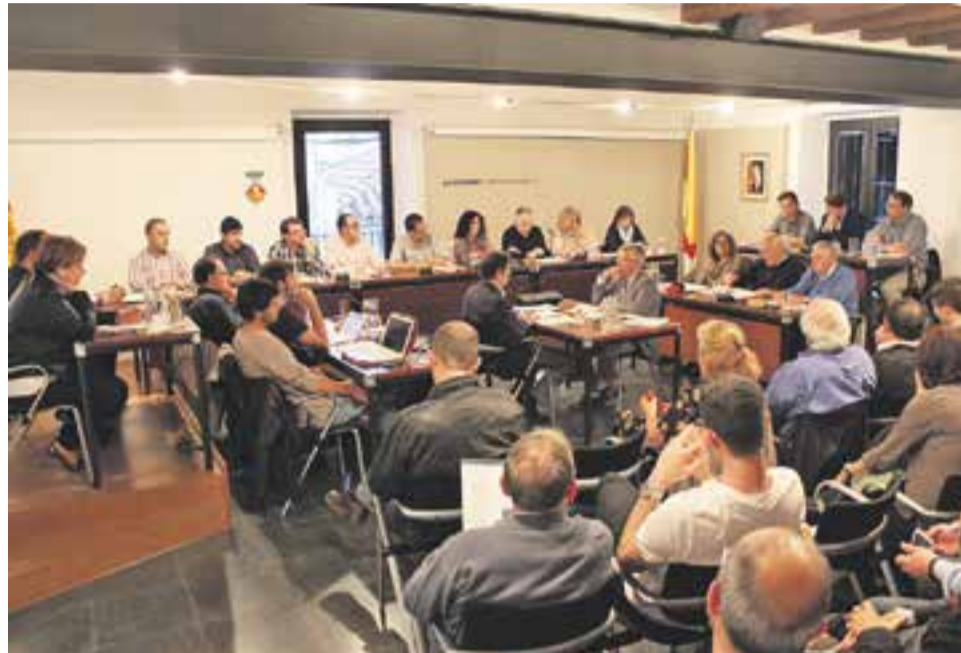
⊙ Un moment de l'últim ple del mandat, dimarts passat. || R. GÓMEZ

També va generar cert debat la dissolució del Consorci urbanístic per al desenvolupament de les ARE (Àrea Residencial Estratègica) Nou Eixample i Turuguet. Per