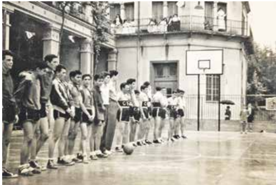
AUTOR: DESCONEGUT FONS: PERE OLLER ARGELAGUET

CADA SETMANA, UN NOU FASCICLE DEL COL·LECCIONABLE AL TEU QUIOSC, PAPERERIA O LLIBRERIA