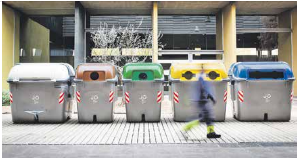
© Alguns dels contenidors de diferents fraccions que es poden veure als carrers de Castellar. || Q. PASCUAL

PER FRACCIONS || Un 60,66% del total de residus municipals recollits durant el 2014 es corresponen amb la fracció resta, el que equival a 6.365,84 tones, 86,64 tones menys respecte l'any anterior. Aquesta quantitat de residus es gestiona al Centre de Tractament de Residus del Vallès Occidental (CTR), fet que permet reduir el percentatge de deixalles