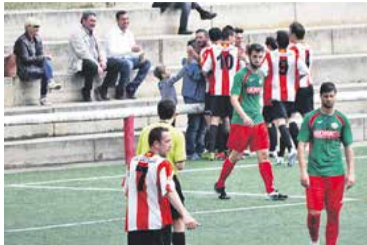
© Dani Quesada celebra el seu gol amb els companys i l'afició del Castellar || A.S.A.