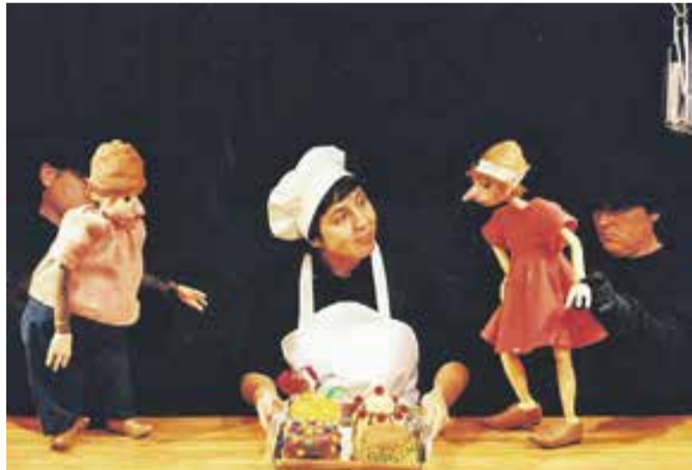
© Una imatge de l'espectacle de titelles. || CEDIDA

⊙ 'La pastissera i els follets' és la funció que es representarà diumenge a l'Auditori