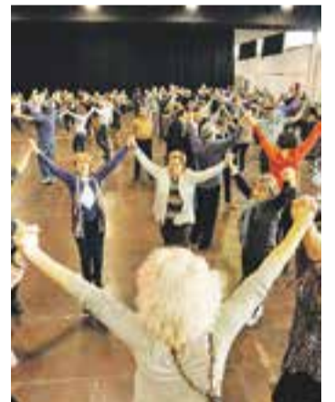
© Imatge del 38è Aplec. || Q. PASCUAL

Aquells interessats poden dirigir-se aquest mateix dijous als locals de Colònies i Esplai Xiribec o bé posar-se en contacte amb l'Agrupació Sardanista trucant al 639 792 832 (Joan) o al 606 905 251 (Montserrat). + || ANNA PARERA