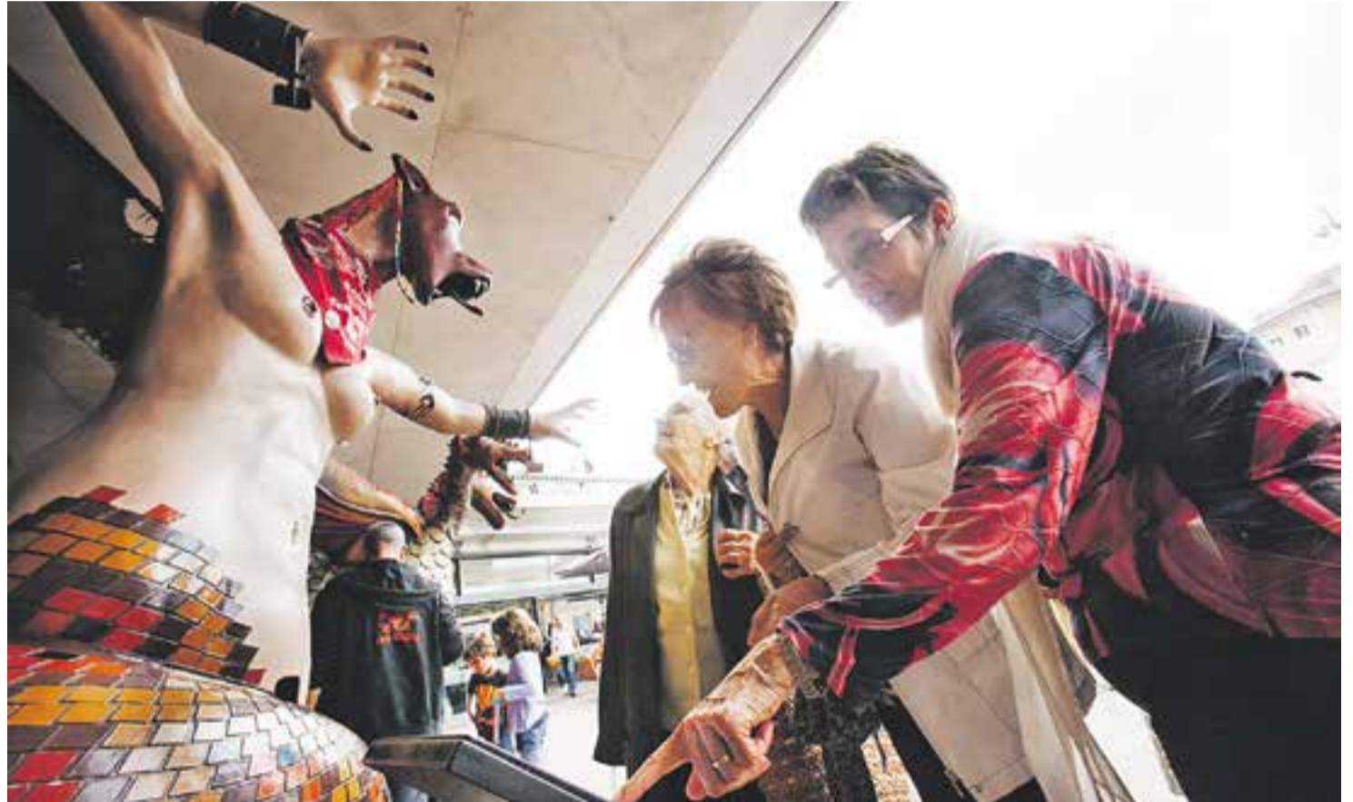
Tres assistents a l'exposició de bestiari, observant la Pàjara de Terrassa.

Van ser molts els curiosos que al llarg de dissabte van apropar-se a llegir les històries de les quatre criatures. D'aquesta manera van poder esbrinar que la Víbria és el drac de la Colla de Diables de Castellar, que pesa 90 quilos i té 12 punts de foc. La va construir Joan Parera Datzira l'any 1995 i la llegenda explica que la Víbria era un drac ferotge que els sarraïns van portar a les terres del Vallès per venjar-se de les seves derrotes contra els cristians. De petita van alimentar-la a la cova de Santa Agnès amb bestiar, fins que va créixer i aleshores va anar a cercar aliments per l'entorn de Sant Llorenç del Munt malmetent les collites i els ramats. Gràcies a la intervenció del Comte de Barcelona Sunifred, que va aconseguir ferir a la fera amb la seva llança, es va posar fi al malson. Per un altre costat, van descobrir que el Drac Antonot pertany a la colla sabadellenca de Can Deu. Va construir-se l'any 1985, tot i que fa 13 anys que Les Forques de Can Deu el van recuperar i reconstruir. Es tracta d'un drac de dos caps i dues cues, d'un pes de 72 quilos i que està fet de fibra de vidre i ferro. Per la seva banda, la Pàjara és una criatura que, segons la llegenda, va néixer el 2 de juliol de 1983 en sortir d'un ou que va pondre