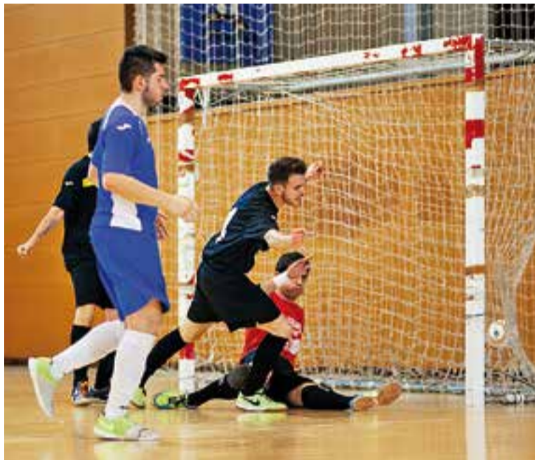
La golejada serveix per quedar a només un punt de la salvació

Començava la segona part i seguia el domini local, enfront els del Vallès Oriental i als vuit mi-