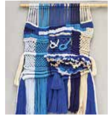
© Mostra de l'exposició. || A.PARERA