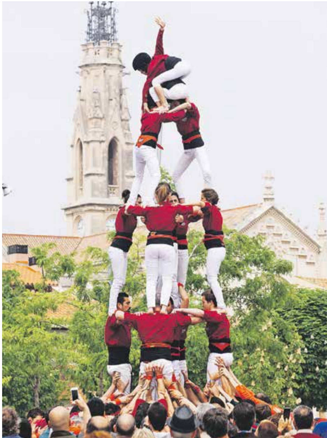
El 4d6 amb agulla va ser un dels castells de la Diada castellera.