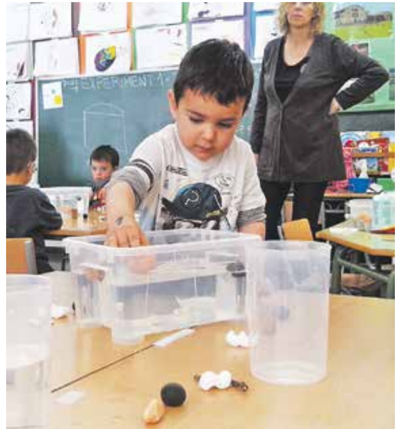
Ⓢ Un dels experiments que s'han dut a terme a la Setmana de la Ciència

ganitzat els mateixos alumnes de l'escola. Al punt de les 17h i fins les 19h, es duran a terme diferents sessions del taller familiar "Ginys electrònics" que es farà a l'aula de ciències. Els tallers Planetari, Carrefitti i Del Pou a casa, on també podran participar pares, mares i alumnes, es duran a terme de 17h a 20h. Una de les activitats més espectaculars serà sense cap mena de dubte l'espectacle "Experiments amb bombolles", que convidarà als assistents a gaudir de les formes més originals que sorgeixen tot donant forma al sabó. Ja a partir de les 21h tindrà lloc el sopar de cloenda -una botifarrada-, i un ball de fi de festa amb DJ Pepo de Can Font. +