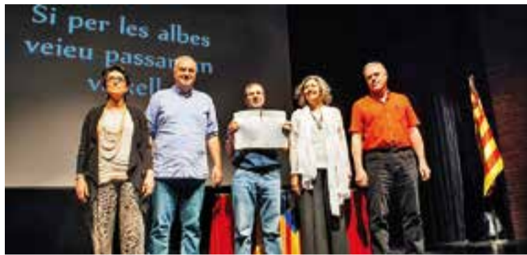
El coordinador de l'ANC amb els caps de llista i números 2 d'ERC i CiU.