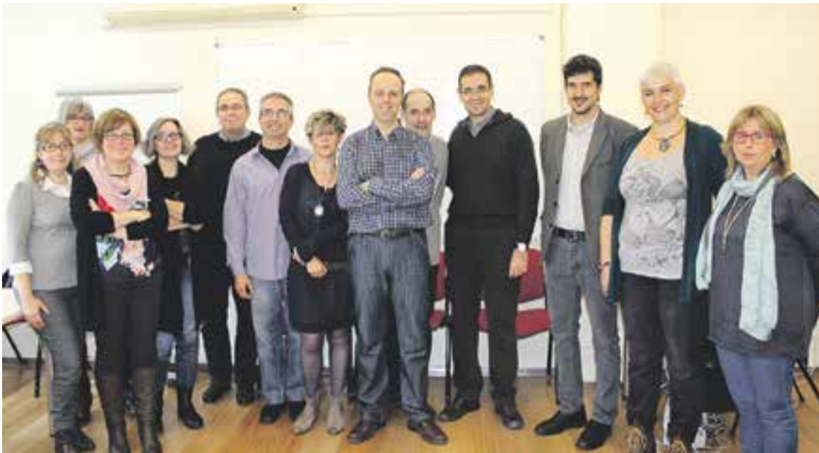
© Els nous treballadors municipals durant la sessió d'acollida que va tenir lloc dilluns a Cal Botafoc. || AJ. CASTELLAR