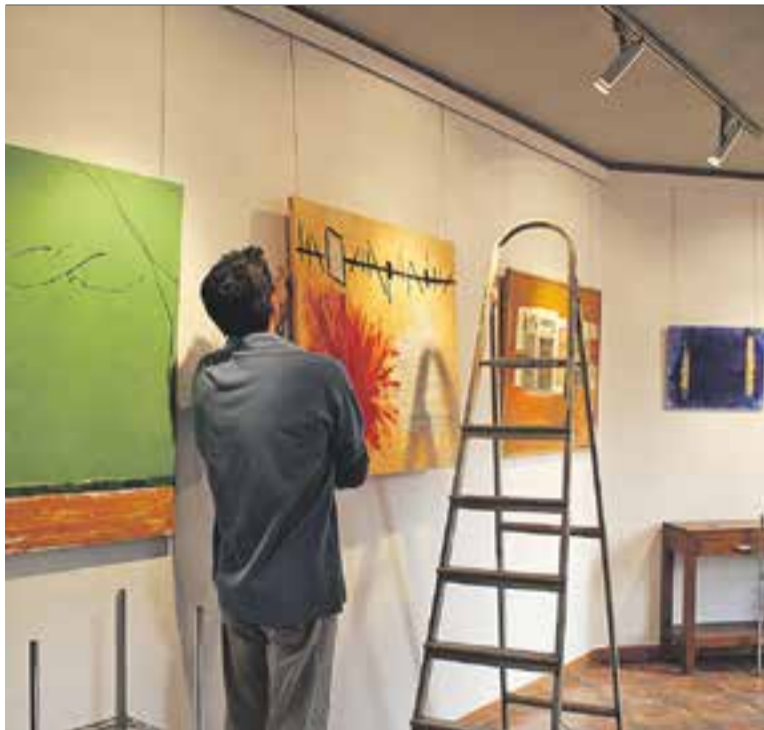
Darrers retocs al mercat d'art. || A. PÉREZ