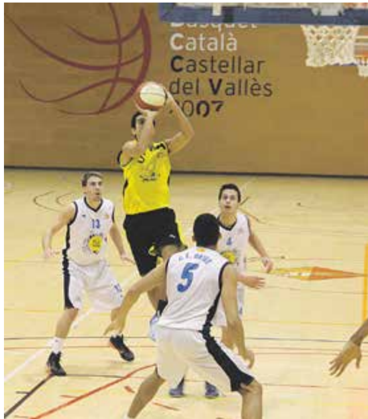
© Toni Roure, tot fent un llançament aquesta mateixa temporada. || M. CORNET