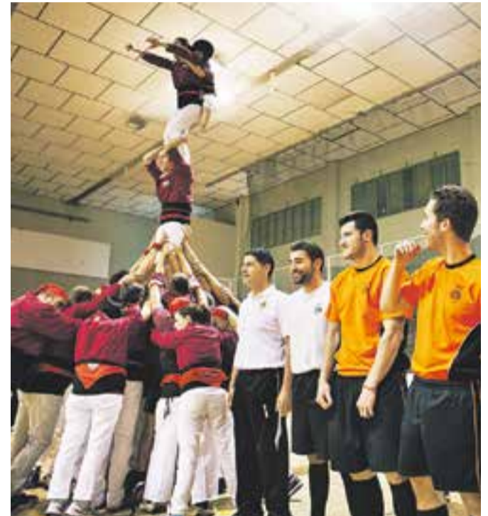
© El FS Castellar va fer una presentació multitudinària dels seus equips amb moments molt emotius, com mostra la imatge de l'esquerra. A la dreta, un castell dels 'Cappgirats'. || Q. PASCUAL