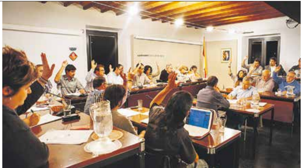
⊙ Imatge d'arxiu d'una votació del ple de l'octubre passat.