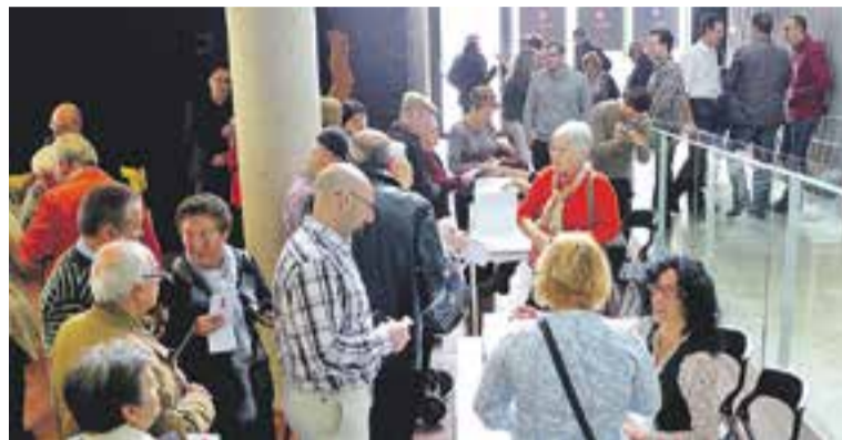
Participants voten a les primàries del PSC de Castellar.

En segon lloc, va assenyalar que els socialistes han de fer "una llista que representi el que som" . "Som gent diferent i no sempre