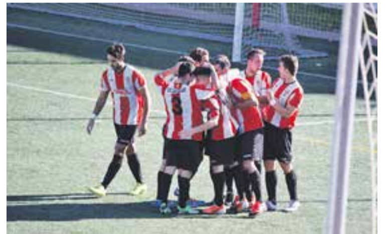
© Els jugadors de la Unió Esportiva, durant la celebració d'un gol. || M. CORNET

El pròxim duel de la Unió Esportiva tornarà a ser fora de casa, dissabte (16 h) al camp del Taradell, que és dotzè i arriba al duel amb la moral molt alta pel seu triomf al camp del Cardedeu (1-2). Un triomf seria molt important per a afrontar amb el màxim optimisme l'aturada de la lliga pel Pont de la Puríssima. +