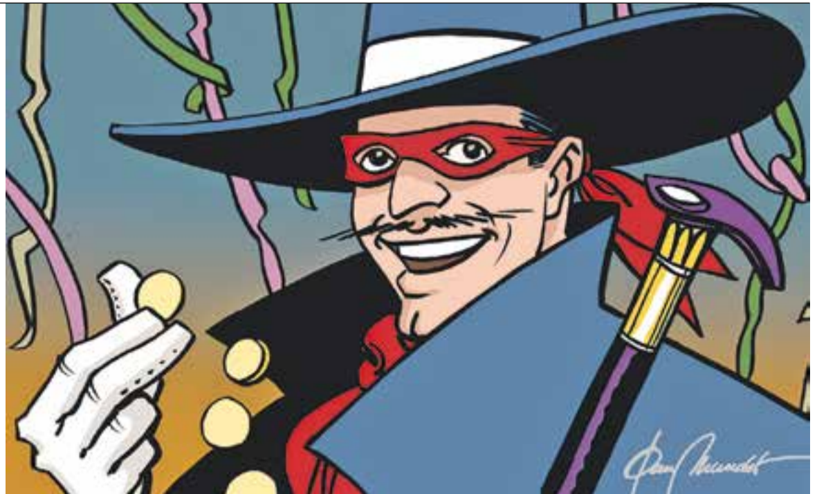
© SI CAV m'hi apunto. || JOAN MUNDET

El senyor Marcel és l'administrador de l'empresa X, S.A. Aquesta empresa ha generat uns guanys que segons la llei haurien de servir d'estalvi o de finançament; per pagar un plus als treballadors després de tanta retallada; per I+D i per generar ocupació, o, al final del període, per engreixar els beneficis dels accionistes, i en aquest darrer cas,