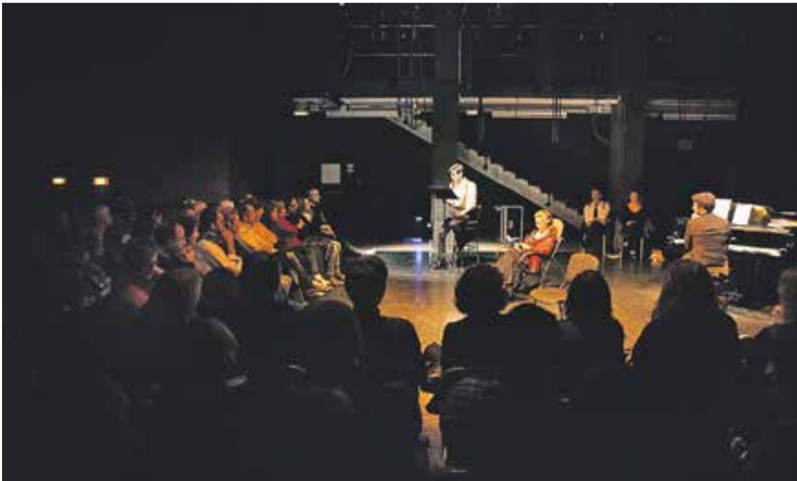
El públic compartia amb els actors i actrius l'escenari.