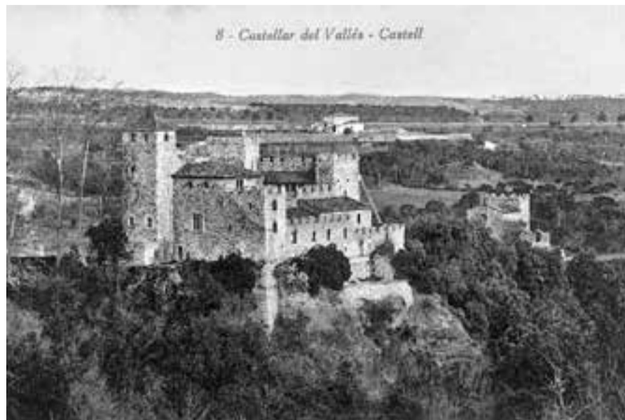
AUTOR: L. ROISIN FONTS: ARXIU MUNICIPAL DE CASTELLAR Ó

CADA SETMANA, UN NOU FASCICLE DEL COL·LECCIONABLE AL TEU QUIOSC, PAPERERIA O LLIBRERIA