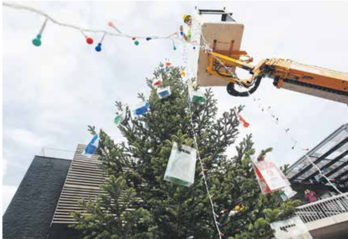
⊙ Aquest divendres, a partir de les 20.30 hores, s'encendrà l'arbre de Nadal. || Q. PASCUAL

El finançament de la decoració i la il·luminació extraordinària es reparteix entre l'Ajuntament i els associats. "Estem molt agraïts a l'Ajuntament, que ha fet mans i mànigues per donar-nos un gran cop de mà", apunta el president de Comerç Castellar. D'altra banda, la sort també contribuirà a pagar les despeses de la decoració i l'arbre de Nadal de la plaça del Mercat. Si bé el 2013 l'associació va fer un donatiu de cada butlleta de la Grossa a una entitat sense afany de lucre com Via Solidària, aquest Nadal el que es recapti servirà per a sufragar el cost d'aquesta campanya. En aquest sentit, Ogaya