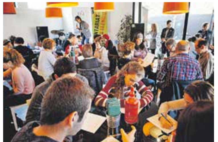
Els participants van omplir les taules del Cal Calissó.