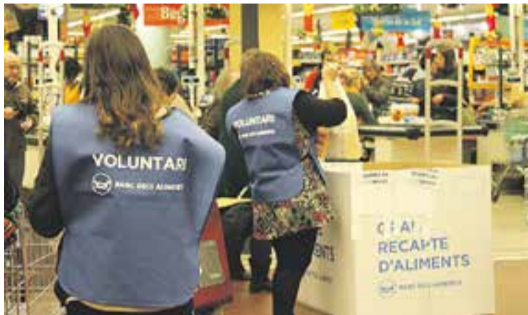
© Una vintena de voluntaris estaran repartits pels diferents supermercats.

Avui, divendres 28, i demà, dissabte 29, se celebra arreu el Gran Recapte, impulsat, des de fa anys, pel Banc d'Aliments. Així, a les portes de sis supermercats de Castellar -Condis, Aldi, Consum, els dos Mercadona i el Canyameres- trobarem vint-i-dos voluntaris que, en els horaris de cada establiment, recolliran els diferents productes i també informaran als ciutadans. "Enguany, com a novetat, també estarem recollint divendres al matí. La campanya comença, oficialment, al migdia, però hem demanat permís a un delegat del Banc d'Aliments del Vallès i ens