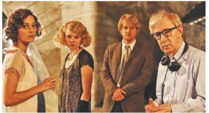
© 'Midnight in Paris', de Woody Allen. || CEDIDA

Finalment, el dia 16 de març, es projectarà Ajami , una proposta israeliana (2009), dirigida per Scandar Copti i Yaron Shani. Ha estat menció especial Càmera d'Or al Festival de Cannes (2009) i millor pel·lícula, director, guió, muntatge i música de l'Acadèmia de Cinema israeliana. †