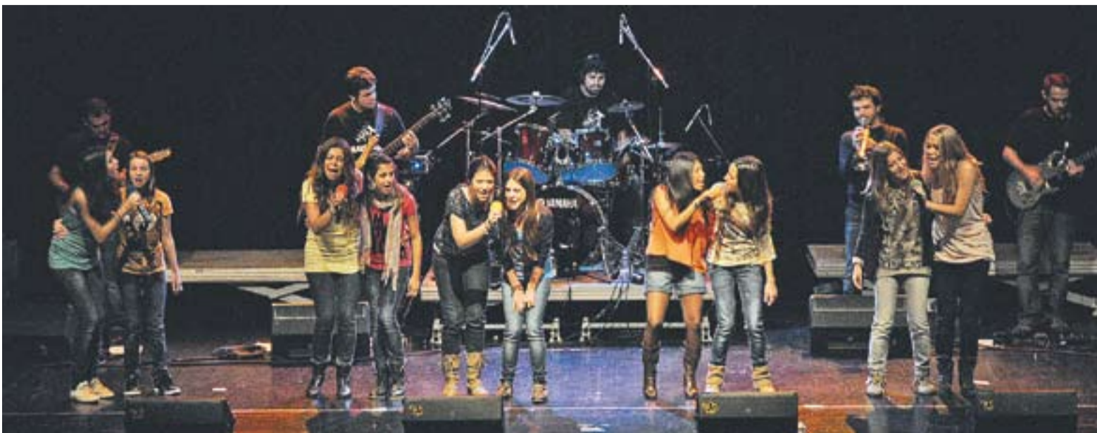
© Totes les components del grup Macedònia, les que marxen i les que comencen en l'actuació a l'auditori. || J. GRAELLS