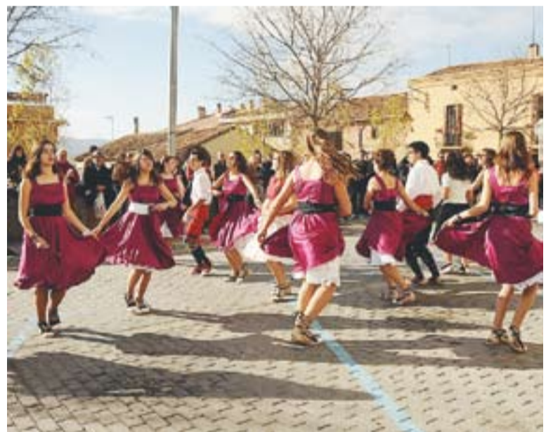
El Ball de Gitanes actuarà en directe a TV3 aquest diumenge.