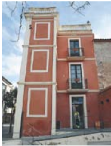
© La Casa Massaveu. || J.GRAELLS

El trasllat de les respectives seus es farà de manera simultània i s'iniciarà la setmana que ve i, se-