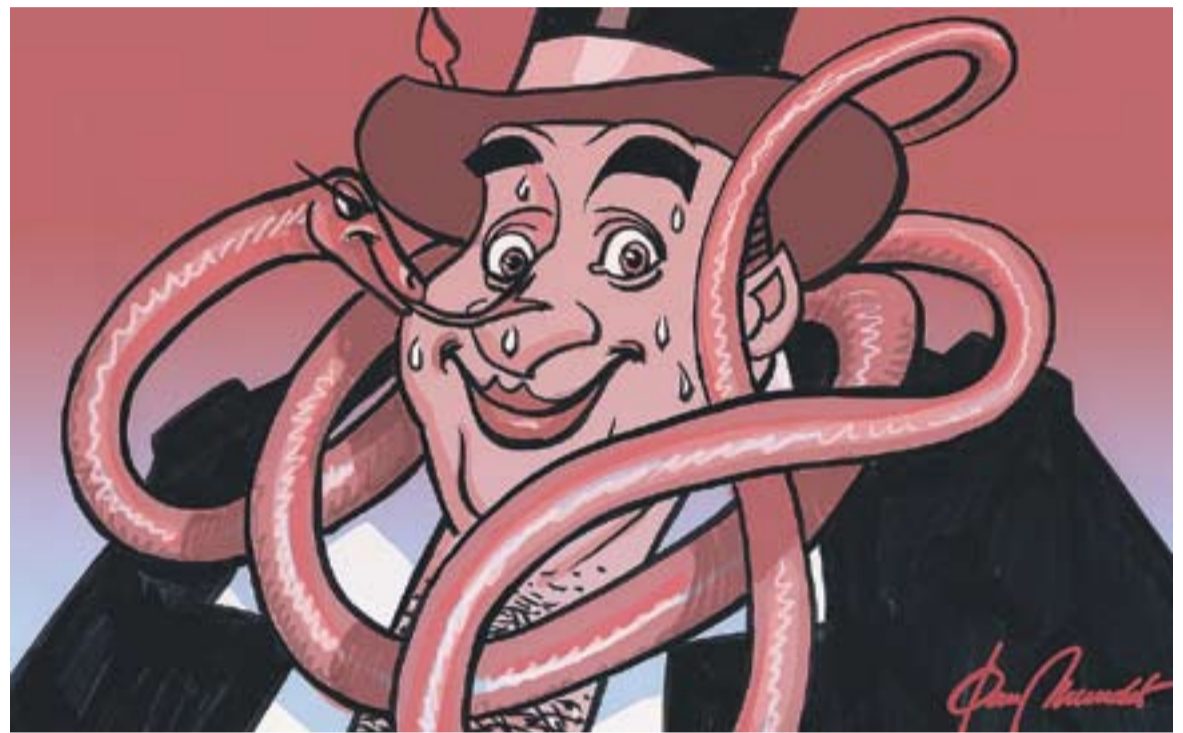
© Ofidis entremaliats. || JOAN MUNDET