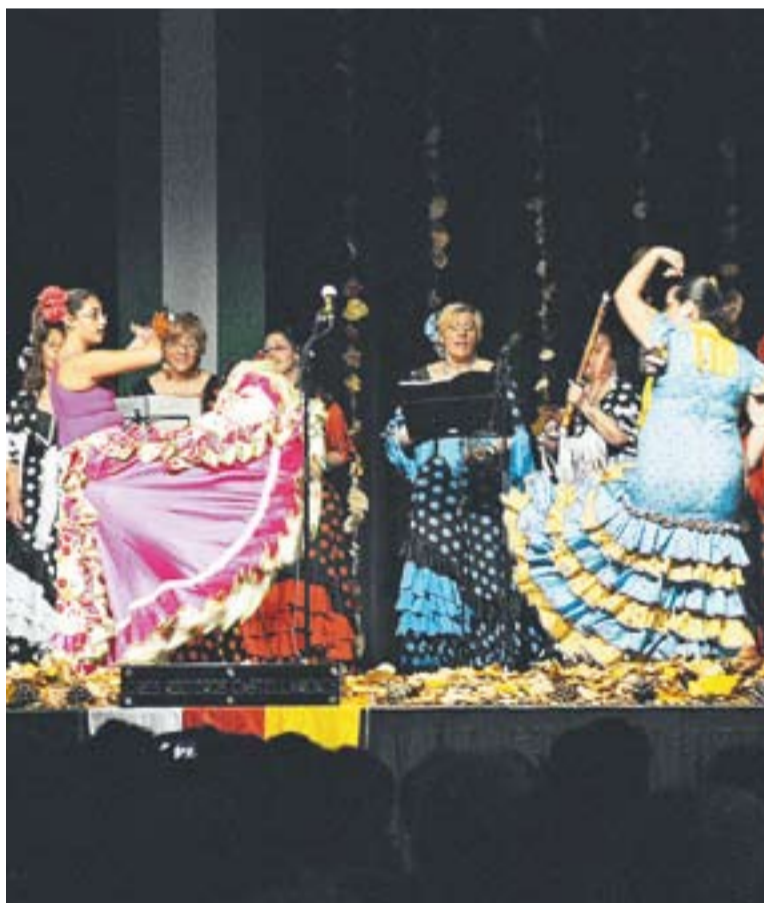
Actuació dels coros rocieros durant la jornada a l'Espai Tolrà

tellarenc. A més, han participat en el sorteig d'una panera feta per una trentena de comerços castellarencs que té pràcticament de tot.