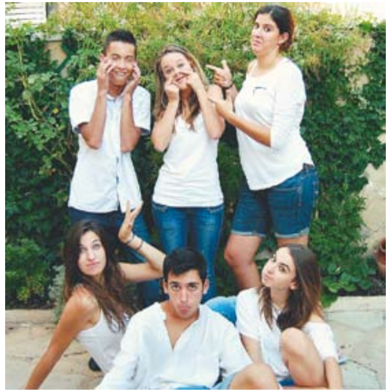
© Els alumnes de l'institut Puig de la Creu que participaven al curt. || J. MUNDET

Joan Mundet és dibuixant, pintor i il·lustrador que millor ha retratat les aventures del Capitán Alatrisme. Des de l'any 2000 il·lustra les novel·les d'Arturo Pérez-Reverte, amb qui també manté una bona amistat. ✦