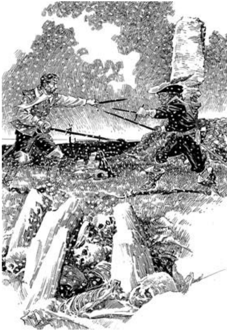
© Una de les il·lustracions de la novel·la 'El puente de los Asesinos'. || JOAN MUNDET

La història passa entre Nàpols, Roma i Milà. A Alatrisme li ordenen intervenir en una conjura crucial per a la corona espanyola: