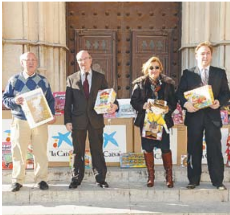
Els representants de la Caixa durant l'entrega de les joguines a Via Solidària

En concret, al voltant d'unes 400 persones van assistir a aquesta tercera trobada i van col·laborar amb aquest banc de productes cas-