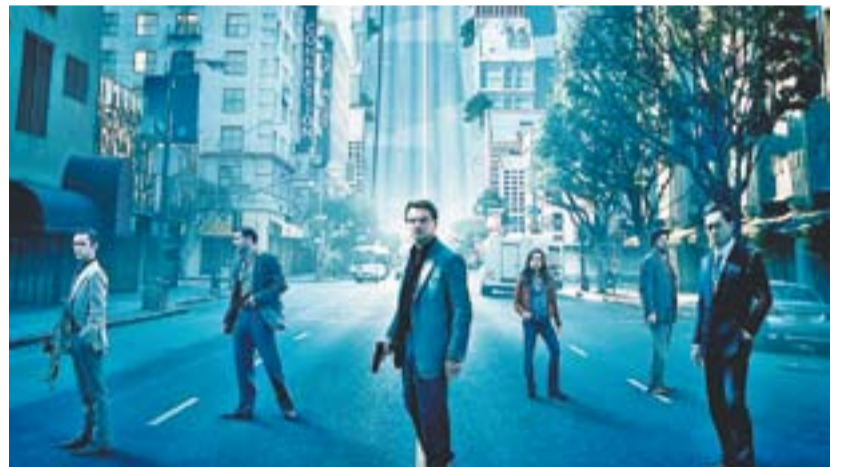
© 'Origen', amb Leonardo DiCaprio. || CEDIDA