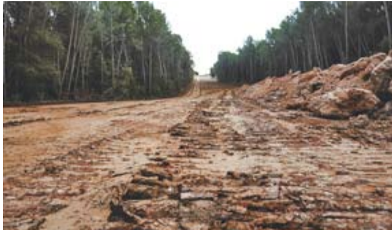
Terrenys de Colobres afectats per les obres.

Quant a les crítiques de poca transparència sobre el projecte fetes per L'Altraveu i que recollia L'ACTUAL de divendres passat,