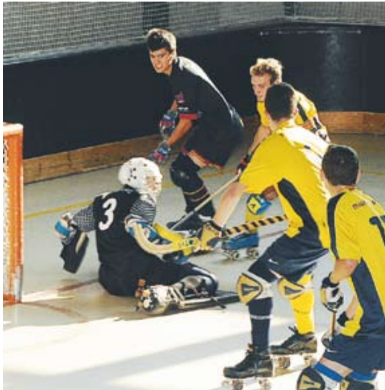
© El pavelló Dani Pedrosa serà la seu d'aquestes eliminatòries. || JOSEP GRAELLS

Pel què fa els equips de l'Hoquei Club Castellar, un d'ells està disputant també fases de classificació. És l'infantil B, que ho tindrà complicat per aixecar l'eliminàtoria i classificar-se per estar entre els millors de Catalunya. En un format de doble eliminatòria en aquesta categoria, els castellarencs van caure la setmana passada a casa per 3 a 5 contra el Sant Cugat. Aquest proper diumenge hauran de remuntar a domicili per superar al ronda.