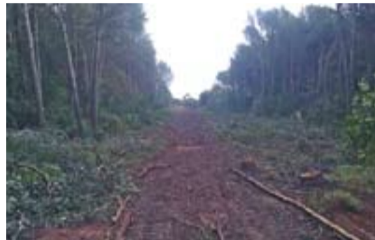
Zona camp de vol (obres Gasoducte) Autor: Jordi Béjar