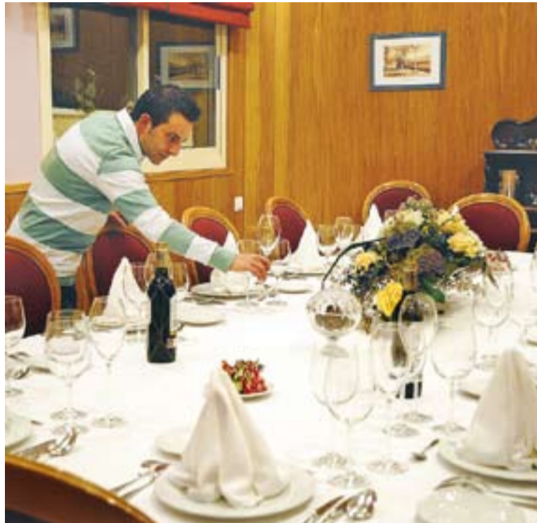
⊙ El gerent de Casa Pedro prepara una taula per un dinar d'empresa

El nombre de sopars, respecte als que s'organitzaven fa cinc anys, segons un restaurador de Castellar, s'ha reduït fins al 80%. Segons l'expert, un dels principals motius és que les empreses, a l'hora de retallar despeses, han optat per les supèrflues, com aquesta: "Si l'empresa no paga el sopar, s'ha de fer càrrec de l'àpat cada treballador i treballadora i amb l'èpo-