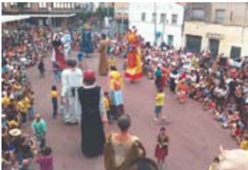
Records de Festa Major Autor: Xavi Alavedra

Envia'ns fotos de Castellar fetes amb el mòbil: lactual@castellarvalles.cat