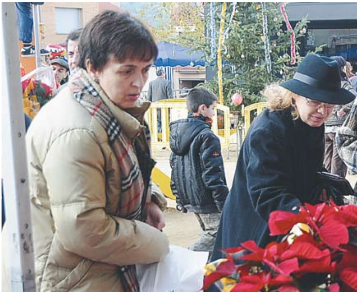
📍 L'any passat, la Fira de Santa Llúcia es va celebrar a la Plaça Calissó.

A més, aquest cèntric carrer de Castellar tindrà un reclam addicional. A la tarda, a partir de les 17 hores, se celebrarà també el 9è Mercat del Parc a Taula. És una activitat inclosa dins el programa Viu el Parc i organitzada per la Xarxa de Parcs de la Diputació de Barcelona amb la col·laboració de l'Ajuntament, que pretén destacar els valors naturals, culturals i paisatgístics dels nostres parcs, mitjançant la viticultura, els productes naturals de proximitat i la gastrono-