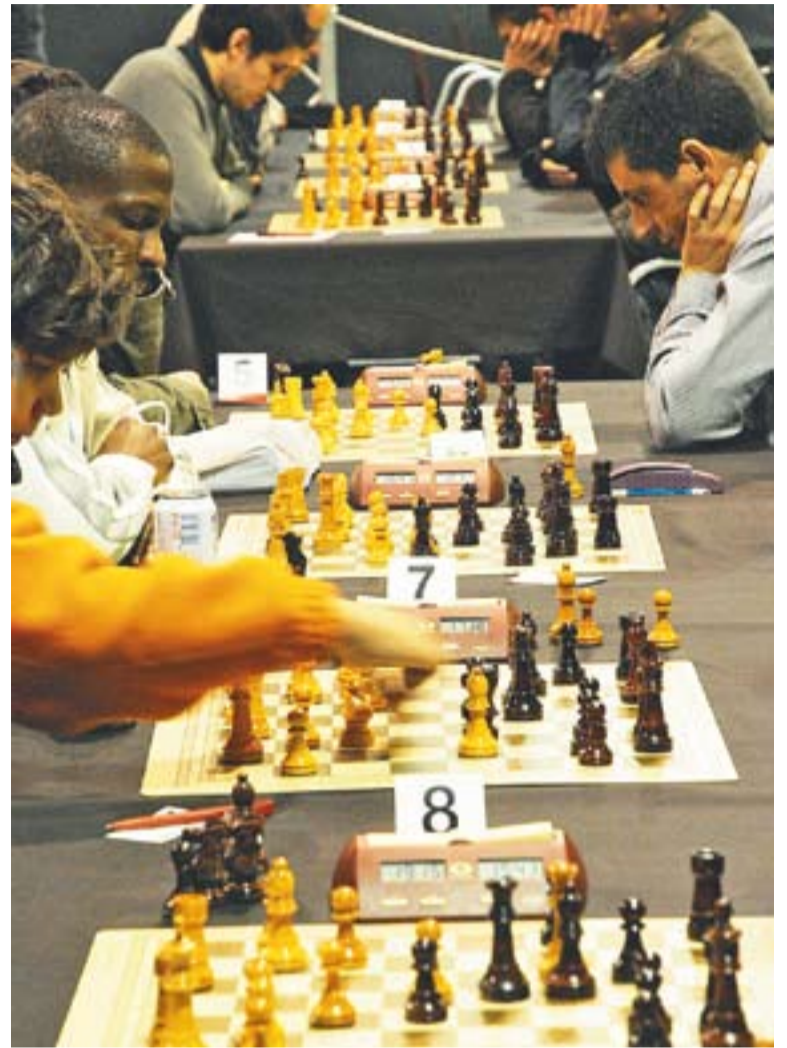
Imatge de l'anterior edició del torneig Memorial Joaquim Marzà.

El preu de la inscripció per als participants és de 20 euros, 10 pels jugadors sub16 i 15 pels veterans. †