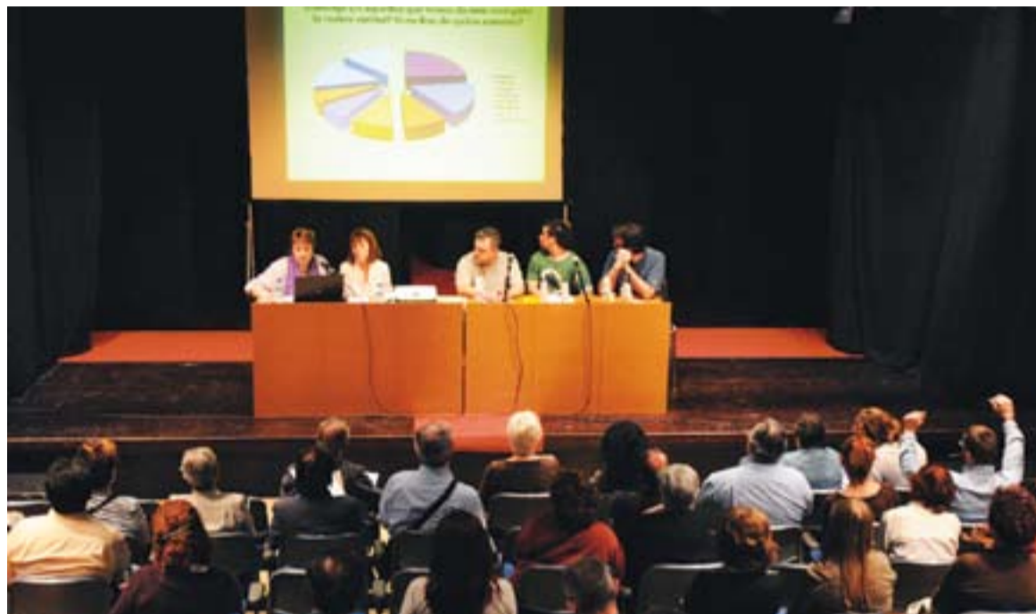
© Moment de la reunió de dimarts passat per organitzar una Mostra d'Entitats el proper mes d'octubre. || JOSEP GRAELLS

VALORACIÓ DE LES ENTITATS || A la reunió hi va haver un torn obert de preguntes, durant el qual la majoria d'entitats es van mostrar satisfetes amb aquesta iniciativa, tot i que van voler puntualitzar algunes qüestions. Una d'elles va preguntar si es tindrien en compte les dates en properes edicions, per la disponibilitat d'algunes entitats de fer la Mostra el dia decidit per l'Ajuntament, de la idoneïtat d'alternança amb la Festa de la Diversitat i de la possibilitat de fer ús del pressupost del PEC per finançar la Mostra i les activitats que s'hi duguin a terme. Genescà va res-