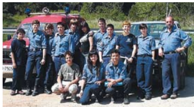
© Tots els participants a la sortida de dissabte. || CEDIDA

Les dades se sumen a d'altres, recollides per professionals, i es converteixen després en una memòria de seguiment de l'estat de les aigües del riu Ripoll. †