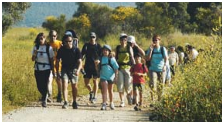
Moment de la XX Caminada Popular, l'any 2007.

La inscripció és de 7 euros i inclou l'assegurança, l'esmorzar i una medalla, que es lliurà a tots els participants en arribar. Es pot fer efectiva fins avui, al PIJ, demà dissabte, al CEC i, com a màxim, 15 minuts abans de la sortida. +