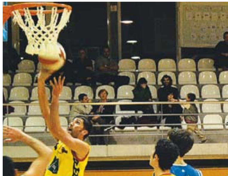
⊙ Els de Castellar jugaran 'de tràmit' abans de la promoció.