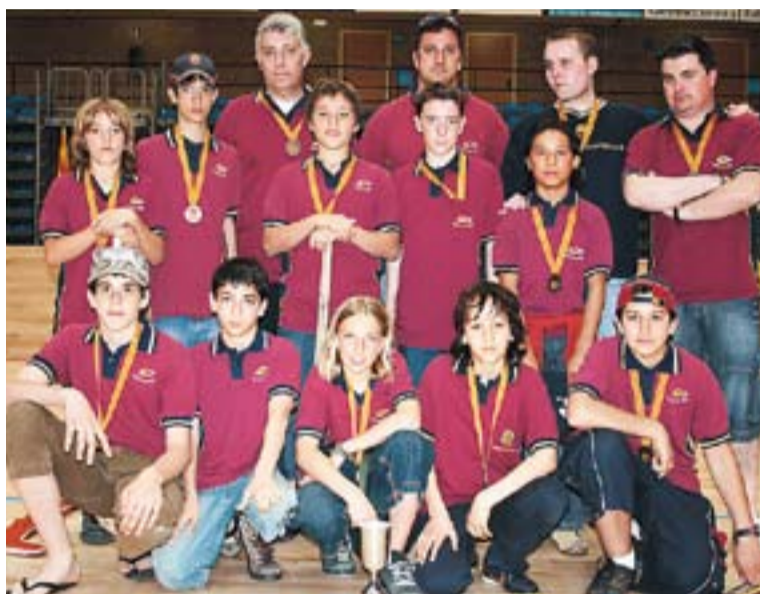
⊙ L'aleví de l'Hoquei amb la medalla i la copa que els acredita com a quarts.