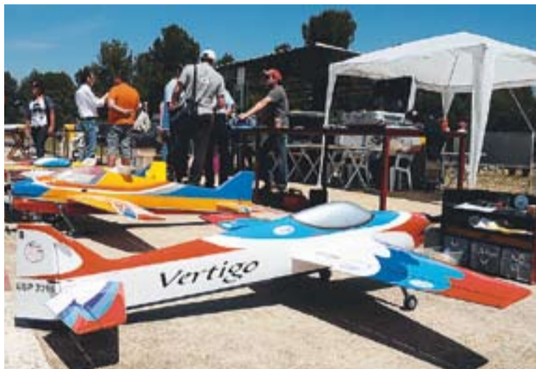
Moment de la preparació dels avions del II Open d'aeromodelisme 2008