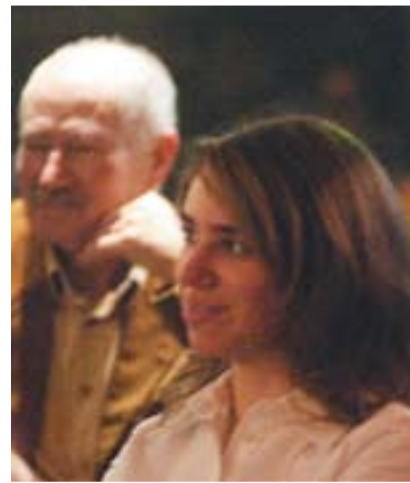
© Sessió anterior de la tertúlia. || ARXIU

Recentment, el grup ha posat en marxa un dossier de poesia, per a fer alguna sessió sobre aquest gènere, considerat una mica més complicat que la novel·la. +