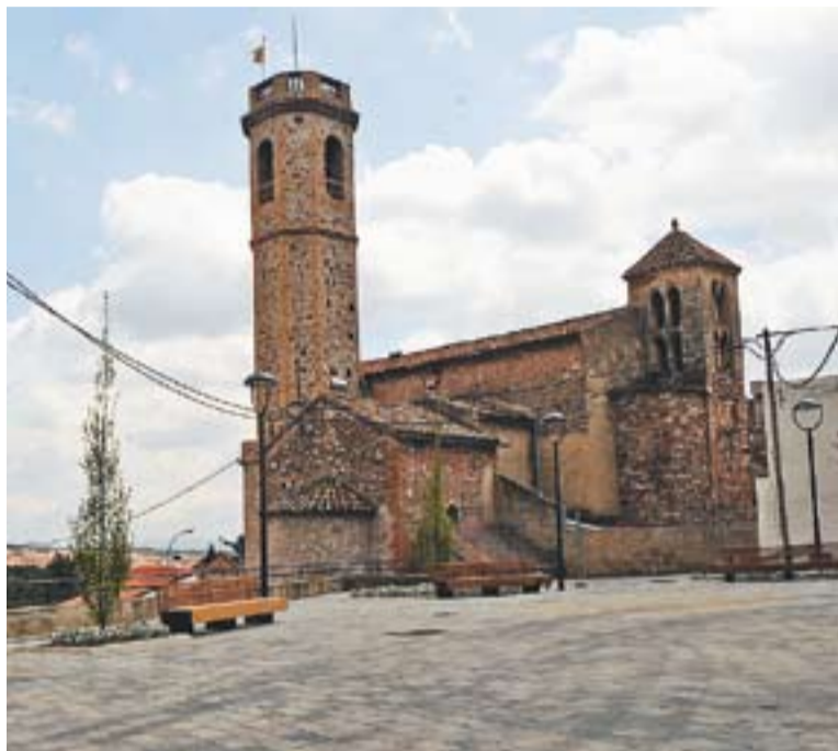
La nova plaça Doctor Puig de Sant Feliu del Racó.

Aquesta actuació forma part del Pla d'Accessibilitat del nucli