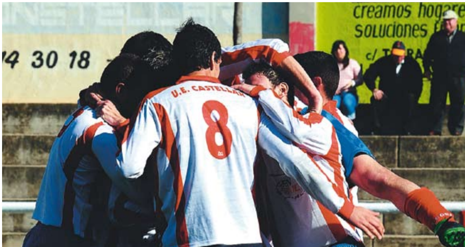
Els castellarencs celebrant un gol.

⊕ La Unió Esportiva vol potenciar el filial i el juvenil la temporada que ve