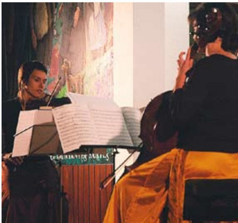
© Imatge d'un concert a la Capella l'any passat. || ARXIU