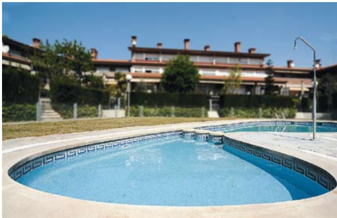
⊕ A partir d'ara, quedarà prohibit omplir la piscina amb aigua de boca. || J.G.

AIGUA DEL TER-LLOBREGAT || D'altra banda, ja s'han adjudicat les obres per a la connexió de Castellar a la xarxa d'aigües Ter-Llo-