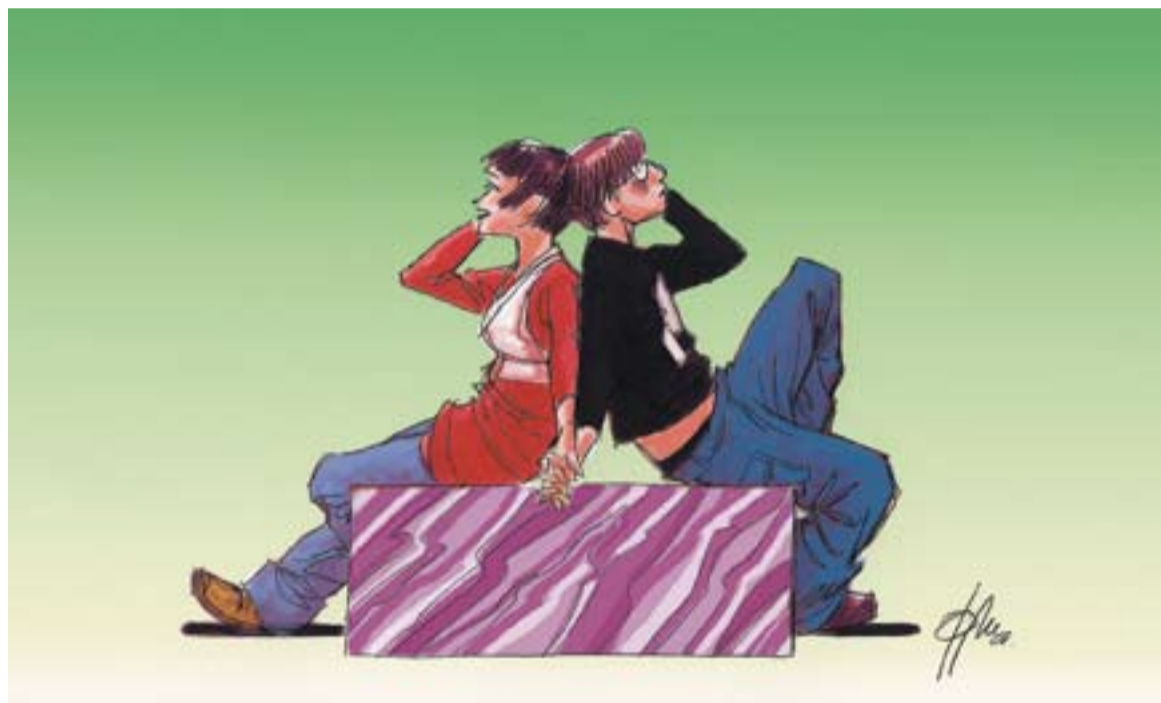
© Parlar a cau d'orella. || JOAN MUNDET

Cal, per tant, que tots en prenguem consciència i treballem per evitar situacions desagradables que sens dubte es produiran si continuem actuant de forma acomplexada perquè, de ben segur, ells no cediran. ✦