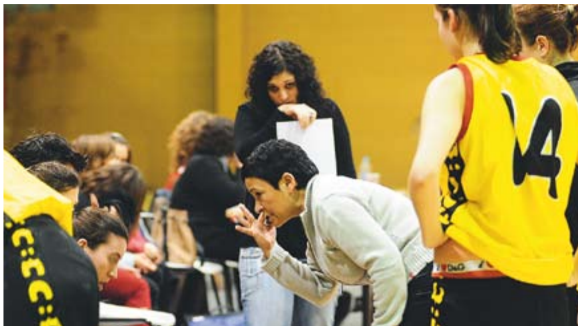
⊙ La plantilla durant un temps mort, preparant la tàctica del partit.