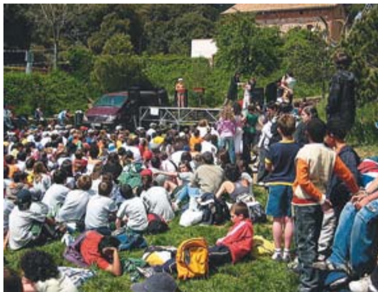
Alumnes durant la festa de Viu el Parc.

Els alumnes del CEIPs Bonavista, Emili Carles Carles Tolrà, Mestre Pla, Sant Esteve i el col·legi El Casal van participar en una roda d'activitats amb el grup d'animació infantil Guixot de 8 que va proposar als alumnes un seguit de jocs fets de material de rebuig. Mentre alguns alumnes participaven en jocs d'habilitat i enginy, altres prenen part al recorregut 'De passeig' on, acompanyats per un guia de natura, podien conèixer l'entorn. "Els alumnes podien trepitjar l'alzinar o les pinedes que havien conegut a la primera part de la campanya quan un monitor del parc els va visitar a l'aula" , va explicar Canals.