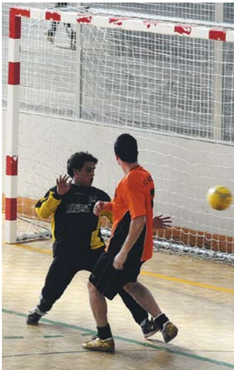
Imatge d'arxiu d'un partit del FS Castellar.

ELUDIR EL DESCENS || El sènior B de l'entitat té un partit molt complicat aquest cap de setmana, ja que ha d'aconseguir la victòria per no perdre la categoria. Per aconseguir aquest repte, els castellarencs s'han de desplaçar a la pista de l'Escola Pia de Granollers, un rival que es troba a la sisena plaça. A part de guanyar, els del FS Castellar hauran d'esperar que el FS Quatre Camins perdi a casa davant del Jamones Alta Montaña. ➔