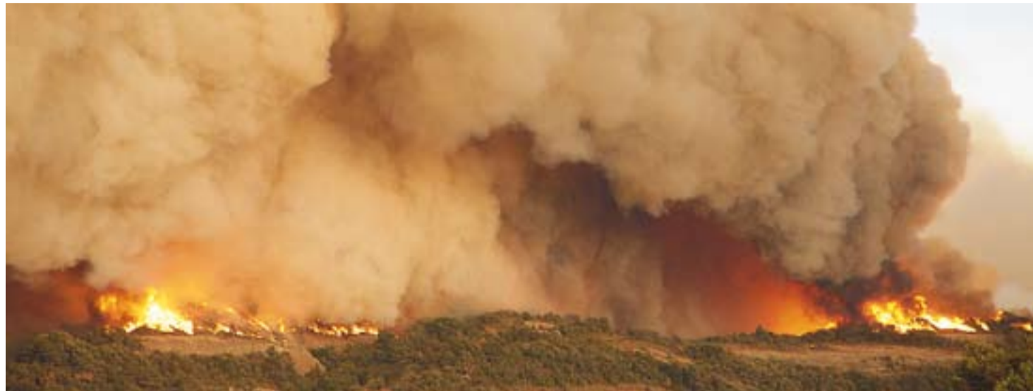
Una imatge de l'incendi que es va registrar l'agost del 2003 a Sant Llorenç Savall.

La Policia Local, com a centre receptor d'emergències, avisaria l'alcalde del municipi, que és el president del Comitè d'Emergència. Junt amb el responsable de Protecció Civil (una plaça que s'acaba de crear i que encara està vacant), valoraria la necessitat d'activar el Pla d'Emergències. Si ho fes, el Parc de Bombers es convertiria en la central operativa de la resposta. Fins aquí es convocarien tots els agents que formen part del pla: Policia i Bombers, ADF, serveis mèdics, l'àrea de Comunicació municipal i altres agents externs, com els Mossos d'Esquadra. Cadascun d'aquests agents disposaria d'unes fitxes on estarien definides les seves funcions concretes.