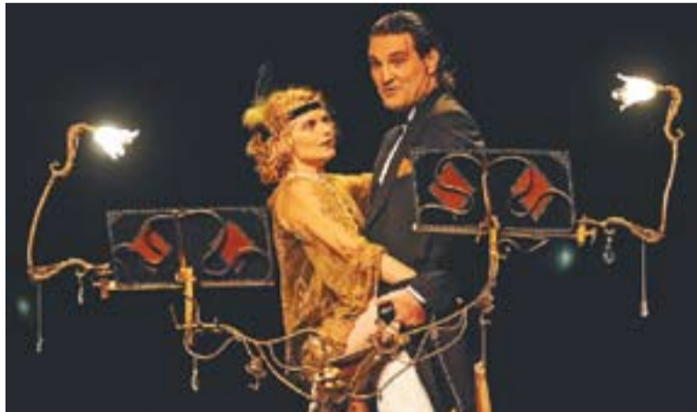
Parella protagonista de la representació a l'Auditori de Castellar.