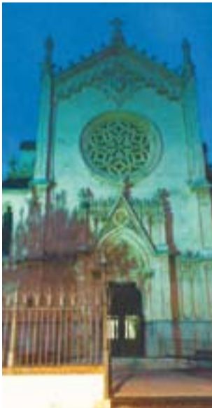
Arriba la tardor