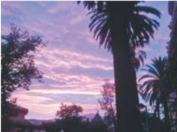
Jardins del Palau Tolrà Autor: Manel Navas

Envia'ns fotos de Castellar fetes amb el mòbil: lactual@castellarvalles.cat