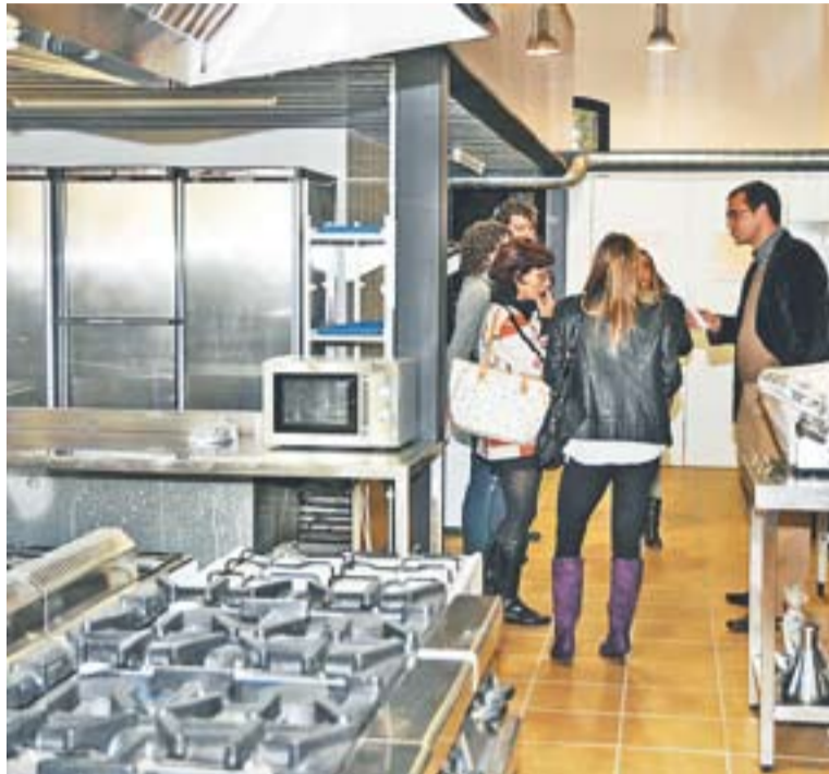
⊙ L'alcalde i personal de l'Ajuntament van visitar l'espai dimarts passat.

LA REMODELACIÓ || Un cop finalitzada la reforma de l'equipament, els Safareigs compten amb una