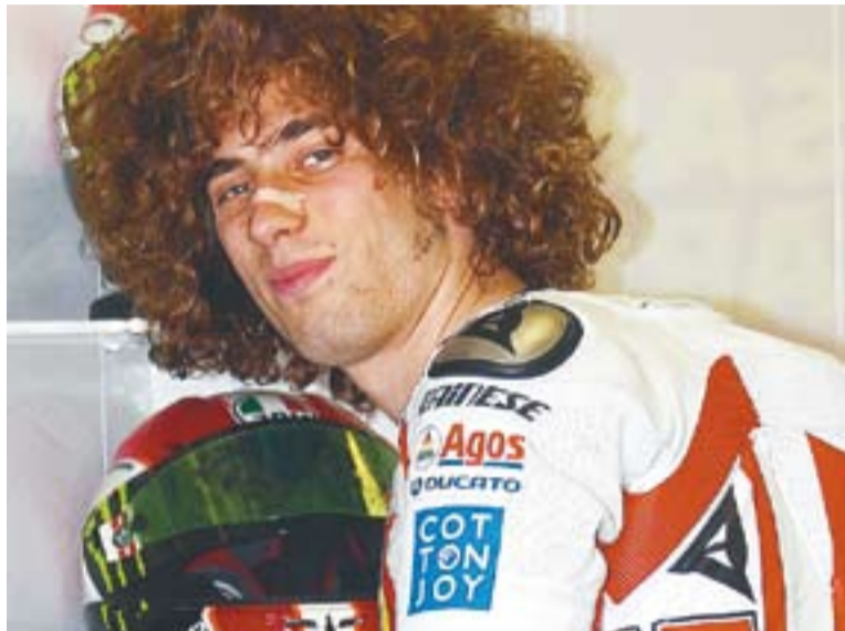
Marco Simoncelli en una imatge d'arxiu.

Pedrosa també va tenir paraules per Marco Simoncelli al seu bloc d'internet. En una nota breu titulada 'Una gran pèrdua', el pilot castellanenc escriu: "Des d'aquestes línies m'agrada traslladar a tota la família i amics de Marco Simoncelli el meu sincer condol. El que va passar va ser un cop mot dur per a tota la família del motociclisme. Quan passen accidents així la resta de coses perden sentit. Tant el meu