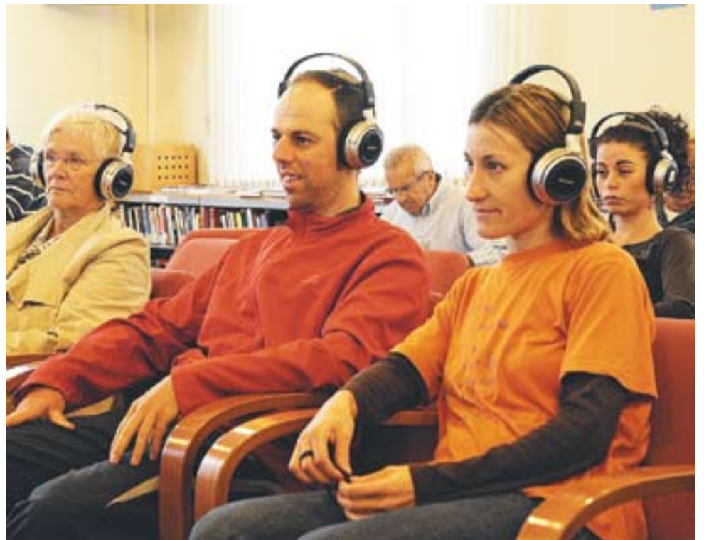
⊙ Els usuaris de la biblioteca assisteixen a la projecció de 'Les veus del Pamano'. || JOSEP GRAELLS

La pel·lícula ha tingut una bona acollida a la Biblioteca. "Ha anat venint gent a totes les sessions programades". Les veus del Pamano "es basa en la novel·la de Cabré però no és la novel·la. Els personatges no són creïbles perquè no parlen català occidental, però l'ambientació està molt ben aconseguida", afegeix Sabaté. +