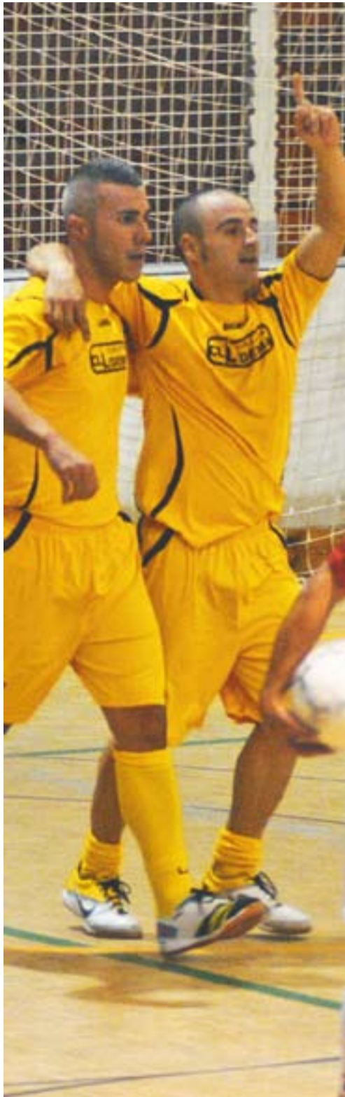
Jugadors d'Atlhètic 04 i Futbol Sala Castellar celebren els seus gols al pavelló Joaquim Blume.

També és el cas del Futbol Sala Castellar. El triomf de dissabte ha injectat confiança a l'equip, que no pensa renunciar al seu estil ni aquest cap de setmana a casa contra el líder. “L'important és jugar bé i els resultats acaben arribant tard o d'hora. No saltres seguirem igual i anirem a jugar contra l'Olimpic la Floresta amb la voluntat de tenir la pilota i tancar-los a la seva àrea” . El primer classificat de la categoria ha golejat sense pietat i ha marcat 22 gols en només dues jornades de lliga. +