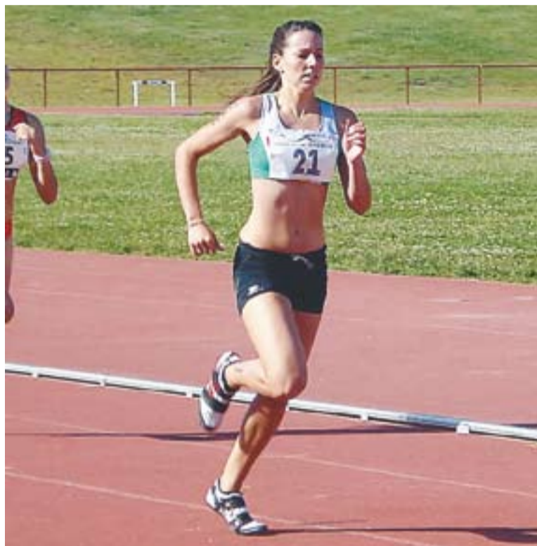
© Anna Olivé va aconseguir la victòria als 800 metres. || CLUB ATLÈTIC CASTELLAR

També la castellarenca Alexandra Bayo va destacar a la seva