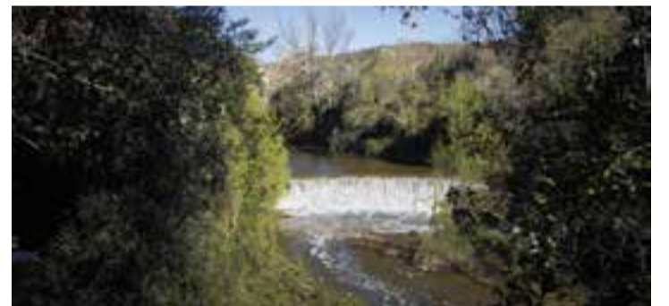
Un dels trams del riu Ripoll. || Q. PASCUAL

Més informació a https://www.diba.cat/ca/web/mediambient/llegim-el-riu . → || REDACCIÓ