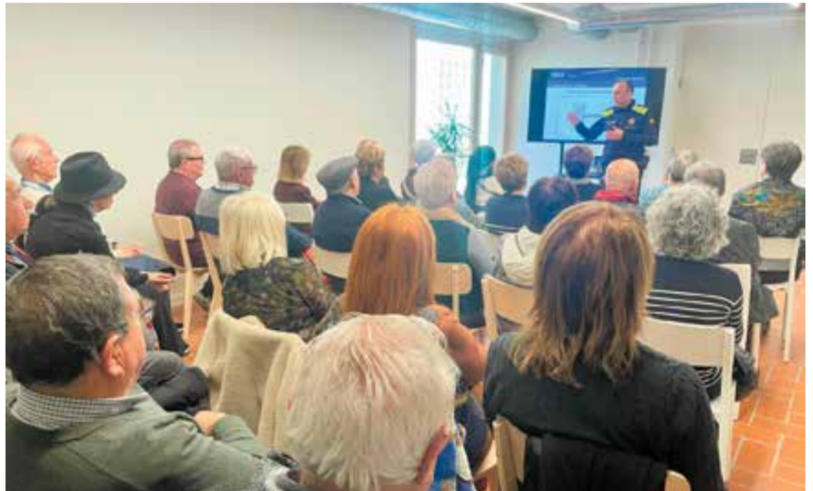
El Casal de la Gent Gran de la plaça Major va ser la seu d'una xerrada sobre seguretat.

"Intentem donar consells a la gent gran, com a col·lectiu més vulnerable de la societat perquè se sentin més segurs a casa i pel car-