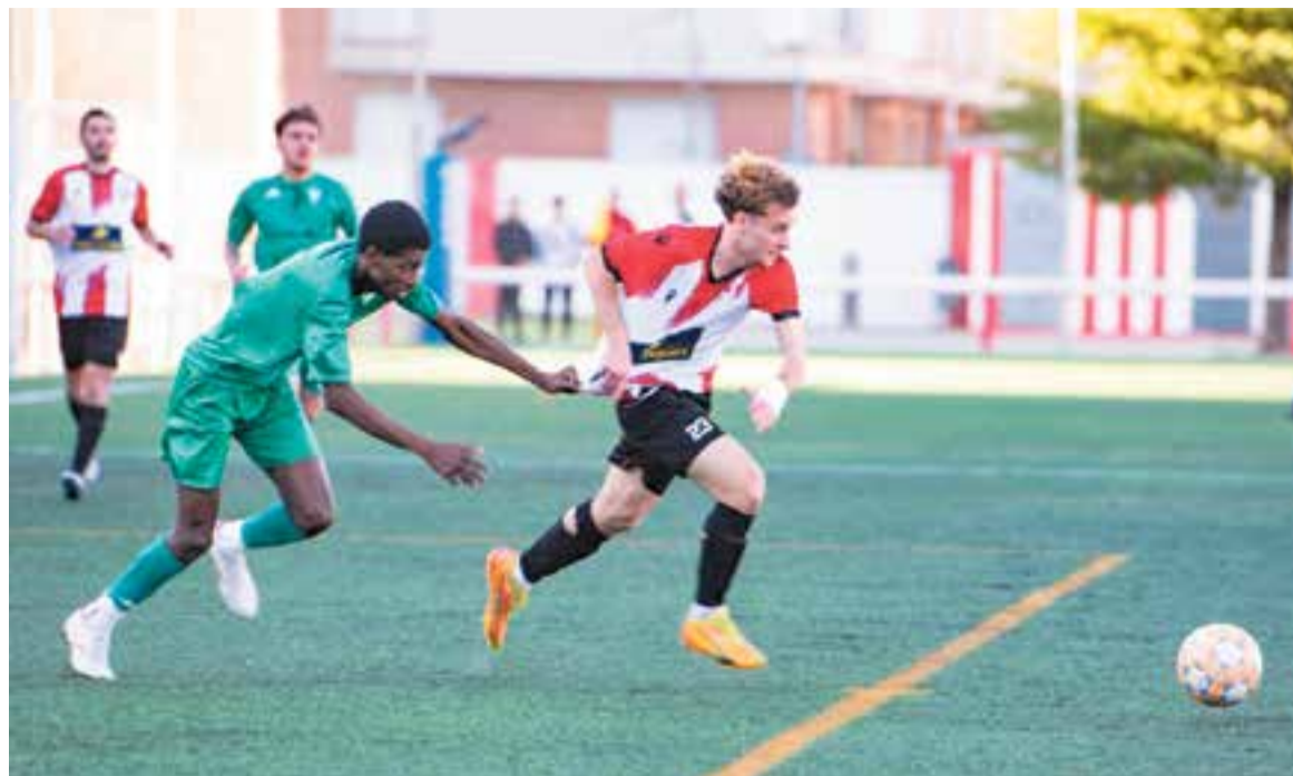
L'empat serveix per deixar el descens a cinc punts, quan queden sis jornades per acabar. || A. SAN ANDRÉS

En l'inici de la segona, com sempre, l'allau atacant local va tancar per complet els blaus –que en aquesta ocasió van vestir de verd– però aquests es van anar animant a mesura que van passar els minuts, van prendre el control del