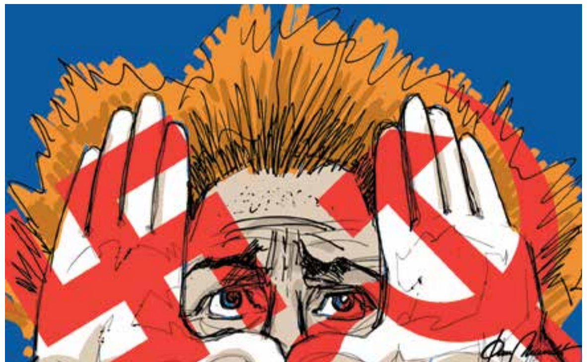
© Oh Europa II. || JOAN MUNDET

“Europa ha perdut una ocasió daurada que no es tornarà a presentar per enfortir la seva unió”