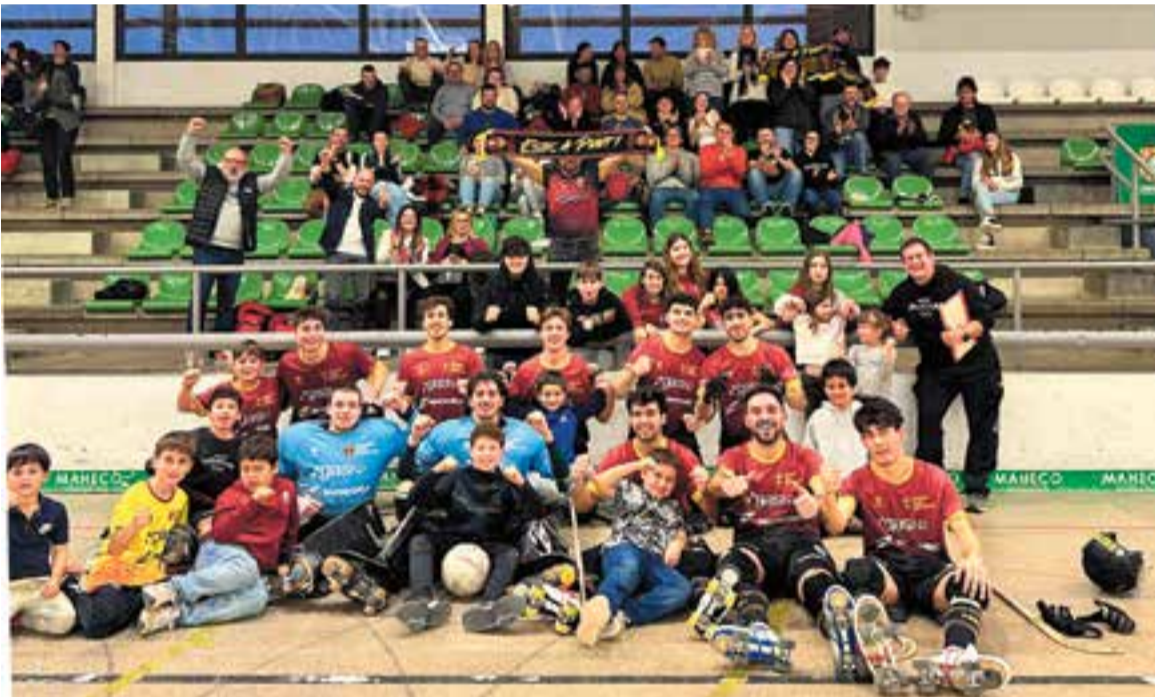
L'equip va celebrar la victòria amb l'afició desplaçada a Cerdanyola.

El femení d'Erik Nasser es va permetre el luxe de superar per 8-7 el Pons Lleida, terceres classificades de la Lliga, i refermen el seu gran moment de forma amb la 5a victòria consecutiva i se situen setenes. +