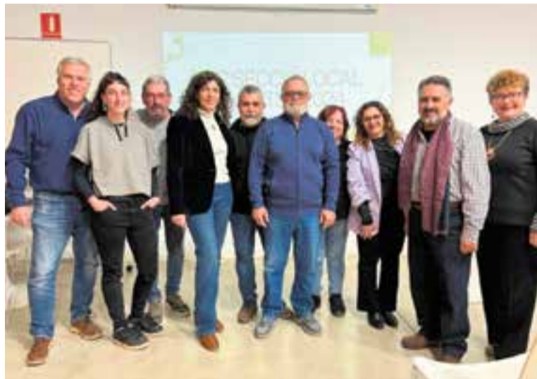
L'executiva local d'ERC i alguns militants abans de fer l'assemblea.