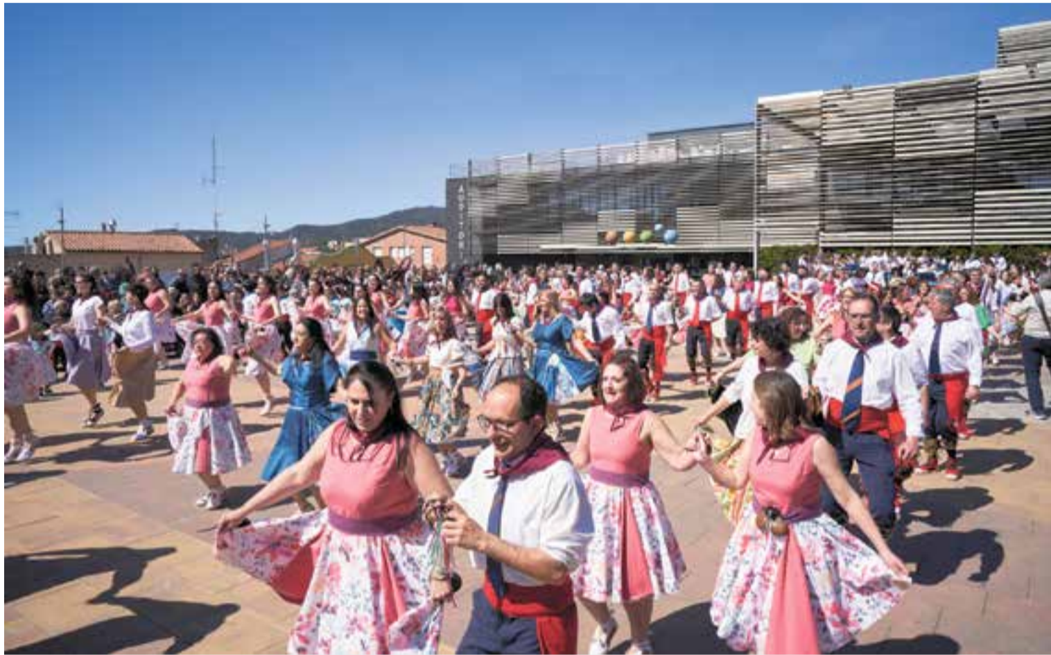
La ballada va ser l'acte més important de la commemoració dels 50 anys del Ball de Gitanes, una tradició arrelada des de fa més d'un segle a Castellar.

El Ball de Gitanes de Castellar commemora el seu 50è aniversari en un acte amb més de 600 assistents