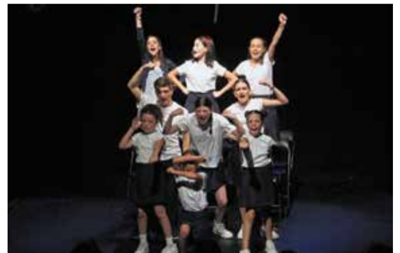
Intèrprets de 'Matilda, el musical', que representa Llum a Escena. || CEDIDA

El musical es distingeix per les cançons dinàmiques, una escenografia creativa i un enfocament que combina el sentit de la fantasia amb el poder de la resistència davant les adversitats. Les entrades seran amb el sistema de taquilla inversa, amb reserva de localitats. + || M. A.