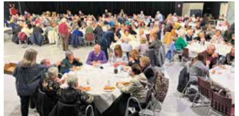
La Sala Blava es va omplir de socis i sòcies de l'Associació de Jubilats.

L'Associació de Jubilats i Pensionistes gestiona el Casal Catalunya i el Casal de la Gent Gran de la plaça Major. Actualment compta amb 2.330 membres associats, 301 membres actius i fa unes 23 activitats al llarg de l'any, com cant coral, pintura, dibuix, informàtica, balls de saló, balls en línia, sardanes, teatre, modisteria, découpage o classes d'anglès i de català. + || REDACCIÓ