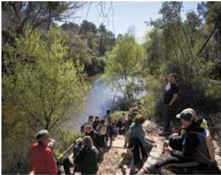
Un moment del recorregut de la passejada 'Aigua, història i vida'.

Els assistents van poder conèixer el patrimoni hidràulic, històric i natural