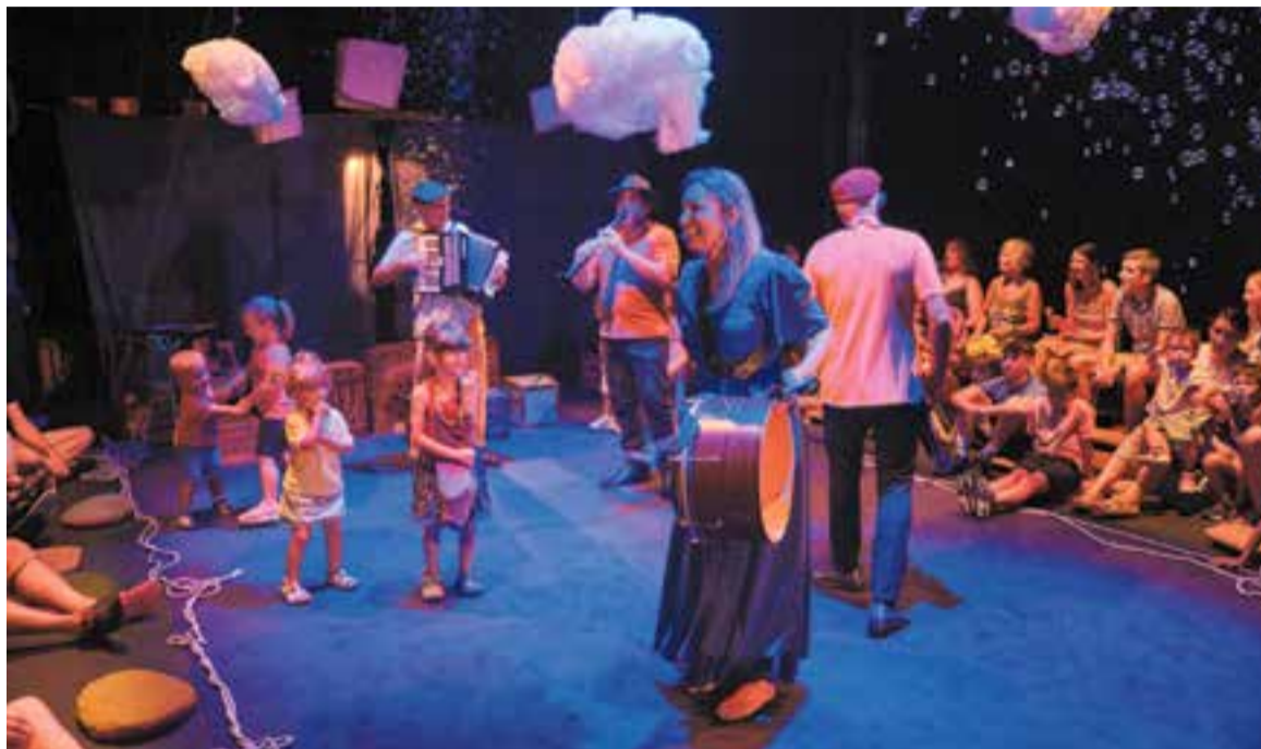
Un moment de l'espectacle 'Juguem', que es presenta aquest diumenge a l'Auditori.

A l'espectacle, veurem cinc intèrprets a l'escenari; quatre músics i un actor, de la Cia. Cascai Teatre, la productora de la Cia. Ninnus.