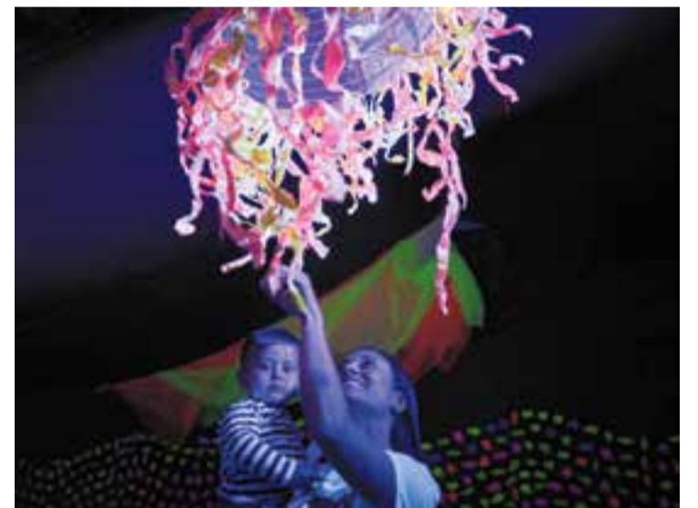
Imatge d'arxiu de l'edició de l'any passat de la Marató per la Diversitat.

D'altra banda, s'hi instal·larà un espai de contes, de ludoteca i activitats infantils en anglès, i també es faran diversos tallers d'autoretrat, estampació de totebags , automaquillatge, construcció cooperativa de cases i sorrals sensorials. Finalment, la jornada festiva i de sensibilització de dissabte també inclourà altres propostes lúdiques com exhibicions de cultura popular de castellers, tabalers, espurnes o gegants, i esports inclusius amb el TEB. Durant tot el dia hi haurà servei de bar i al migdia es farà una botifarrada popular. Tota la programació de la marató de Suma es pot consultar al perfil @sumacastellar d'Instagram i al portal web sumacastellar.cat. ➔ || ROCÍO GÓMEZ