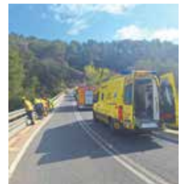
Punt de l'accident.