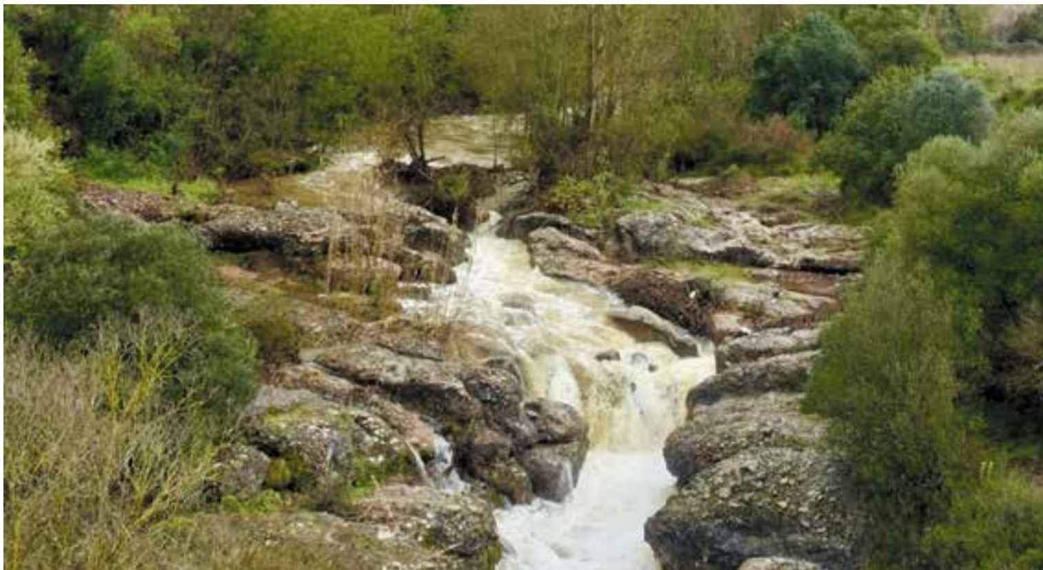
Imatges del riu Ripoll al seu pas pel pont de Turell, a Sant Feliu del Racó, després de les pluges del mes de març.