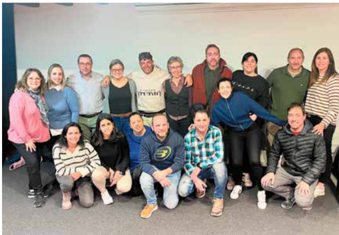
Tot i haver entrat a finals de desembre al club, la nova junta es va presentar en públic la setmana passada. || A. SAN ANDRÉS

"El nostre projecte serà continuista amb la gestió que s'ha fet fins ara, però amb un aire renovador, separant la gestió de les tres seccions. El vòlei començarà a gestionar-se individualment