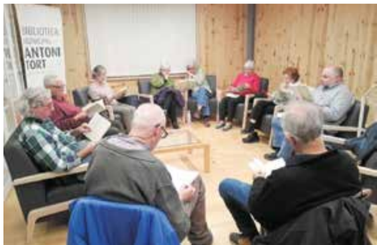
Moment d'un club de lectura de poesia a la Biblioteca Antoni Tort.