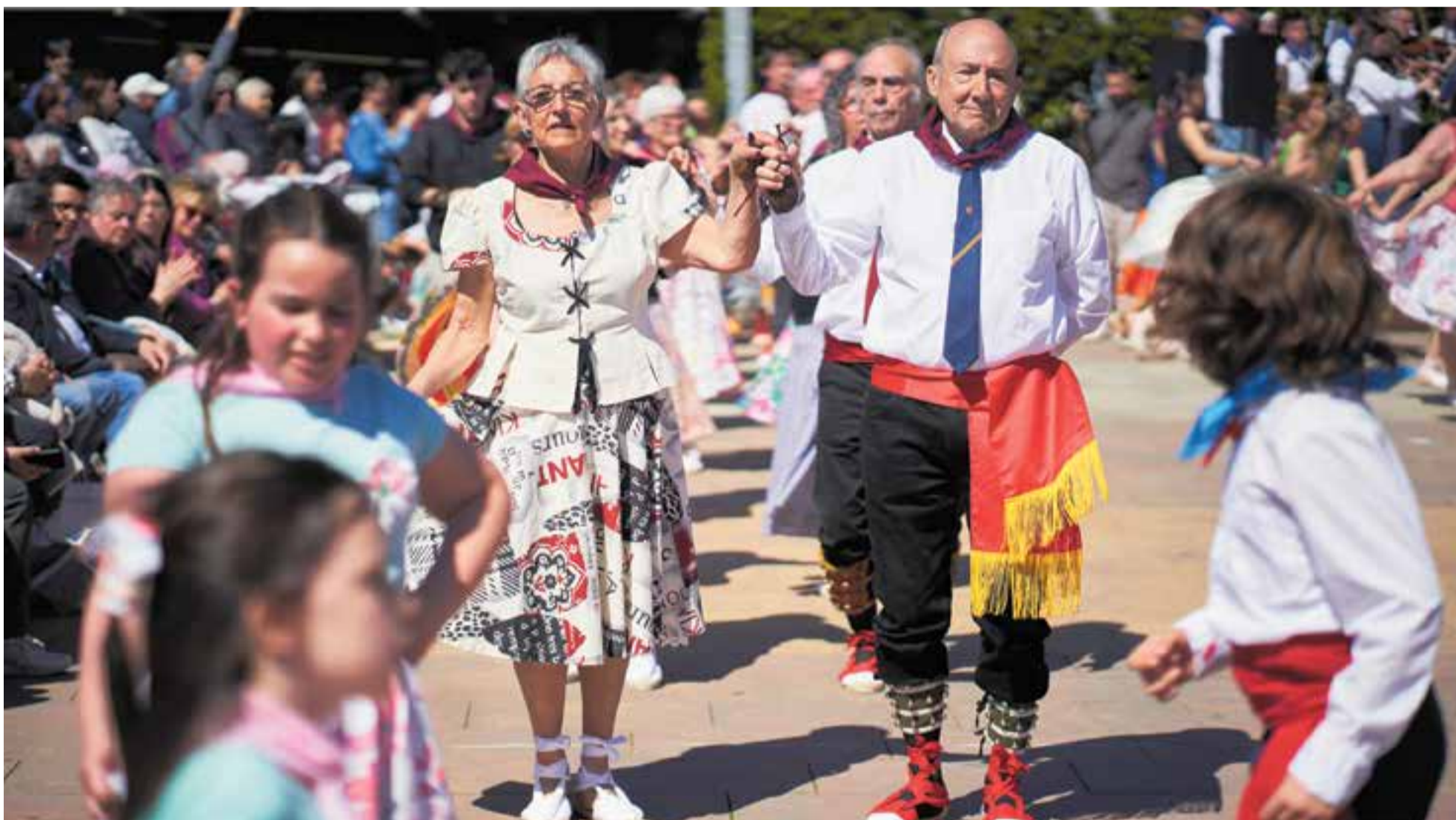
Imatge de l'acte central dels cinquanta anys de ballades ininterrompudes de Ball de Gitanes, diumenge passat a la plaça d'El Mirador, que va reunir membres de totes les generacions. | I.Q. PASCUAL CULTURA | P18

Castellar va tenir 21 dies de pluja al març i es van acumular 228 l/m 2