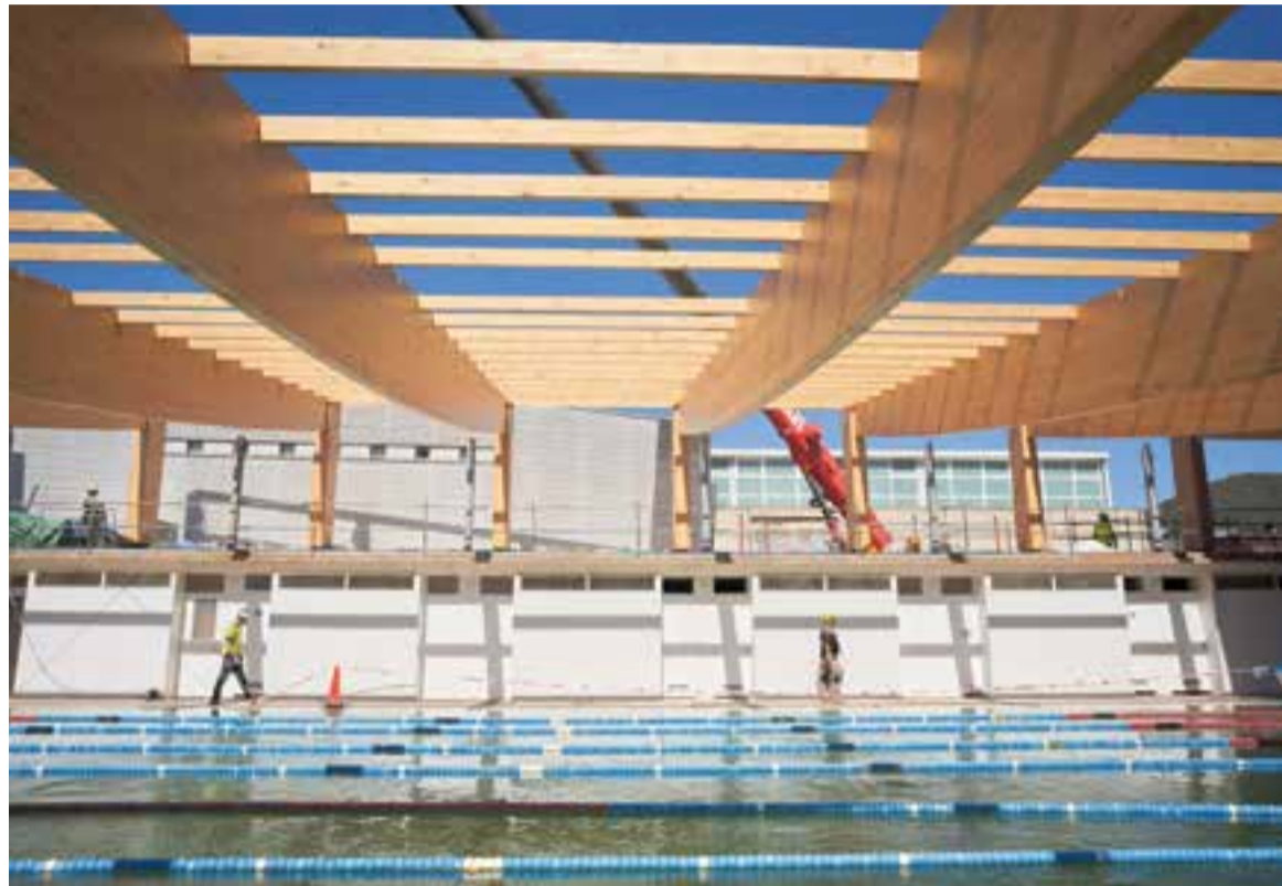
Imatge de les obres a la coberta de la piscina interior de Sige aquest dimecres.

Pel que fa als terminis d'execució, està previst que la instal·lació de les bigues i la coberta finalitzin a mitjans d'abril. Des de Sige també expliquen que durant el mes de maig "es posaran a punt les dues sales d'activitats dirigides: la sala Puig de la Creu, de 'cycling' i 'striding', i la sala Juan Aguilar, adjacent" . Finalment, també detallen que "es millorarà la climatització de la piscina i es renovaran tots els tancaments que donen a la zona exterior" . Un cop finalitzades les obres, també es durà a terme la rehabilitació integral de la sala Vallés, renovant el tami i millorant l'espai d'entrenament. Cap a finals d'any es preveu fer accions de millora a les sales La Mola i Clasquerí.