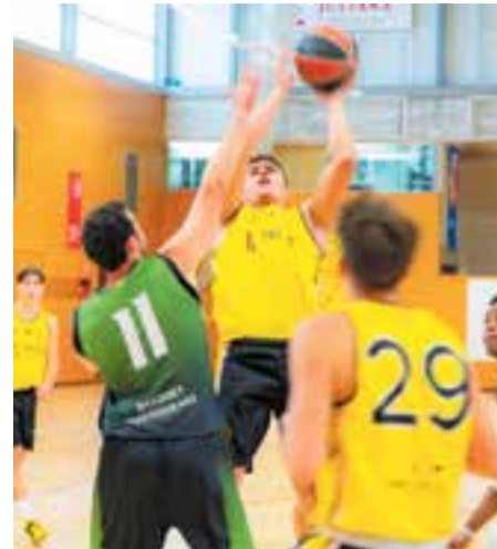
El masculí rep el colíder. || A. SAN ANDRÉS

Després del sever correctiu contra l'UBSAB de fa dues setmanes, el CB Castellar masculí rebrà el segon classificat, el Sant Josep Obrer de l'Hospitalet. Els de Jaume Prat volen capgirar la situació i tornar a escalar posicions en la taula per enganxar-se a la zona capdavantera. La derrota contra el filial de Sant Adrià ha de quedar en una mera anècdota, aprendre dels errors i no tornar-los a repetir. Una nova oportunitat serà aquest diumenge (19.15 h) al Puigverd, on els visitarà el colíder de la categoria, el Sant Josep Obrer; un conjunt amb balanç de 5-1 (3-3 per al Castellar) i que no serà el millor rival per capgirar la situació. El femení de Xavi Revilla (4-2) ho tindrà millor per tractar de sumar la cinquena victòria consecutiva i visitarà (dissabte, 16.30 h) la pista del CB Roda de Ter (3-3). +|| A. SAN ANDRÉS