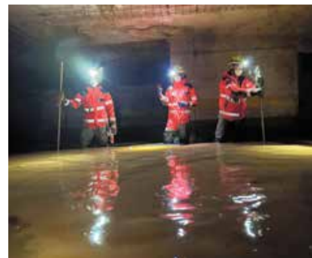
D'esquerra de dreta i de dalt a baix: diversos materials recollits a Castellar i enviats aquesta setmana a València. Al centre, bombers de Castellar treballant en un pàrquing, i a sota, dos membres del SERNA a Picanya.