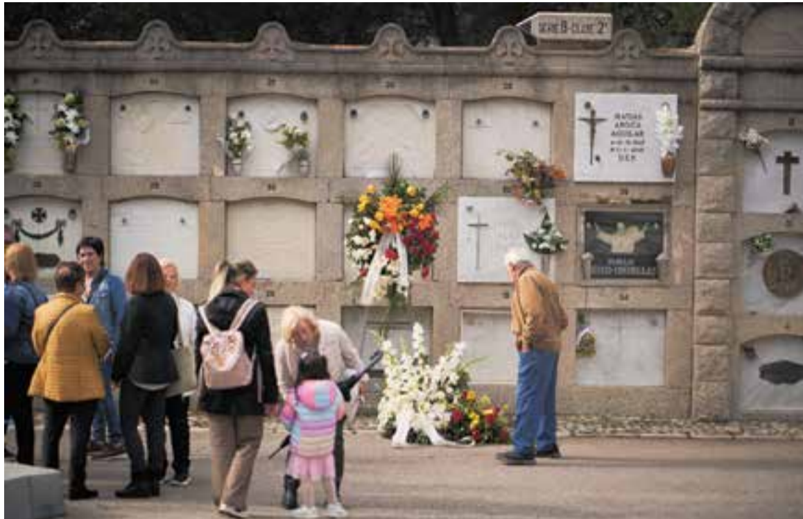
La visita al cementiri de Castellà va ser constant durant tot el dia durant la festivitat de Tots Sants.

Normalment, la visita als difunts en aquestes dates tan assenyalades acostuma a coincidir amb el fet que els familiars renoven els rams davant les làpides o tombes i arrangen així el nínxol del seu ésser estimat. Les oficines del ta-