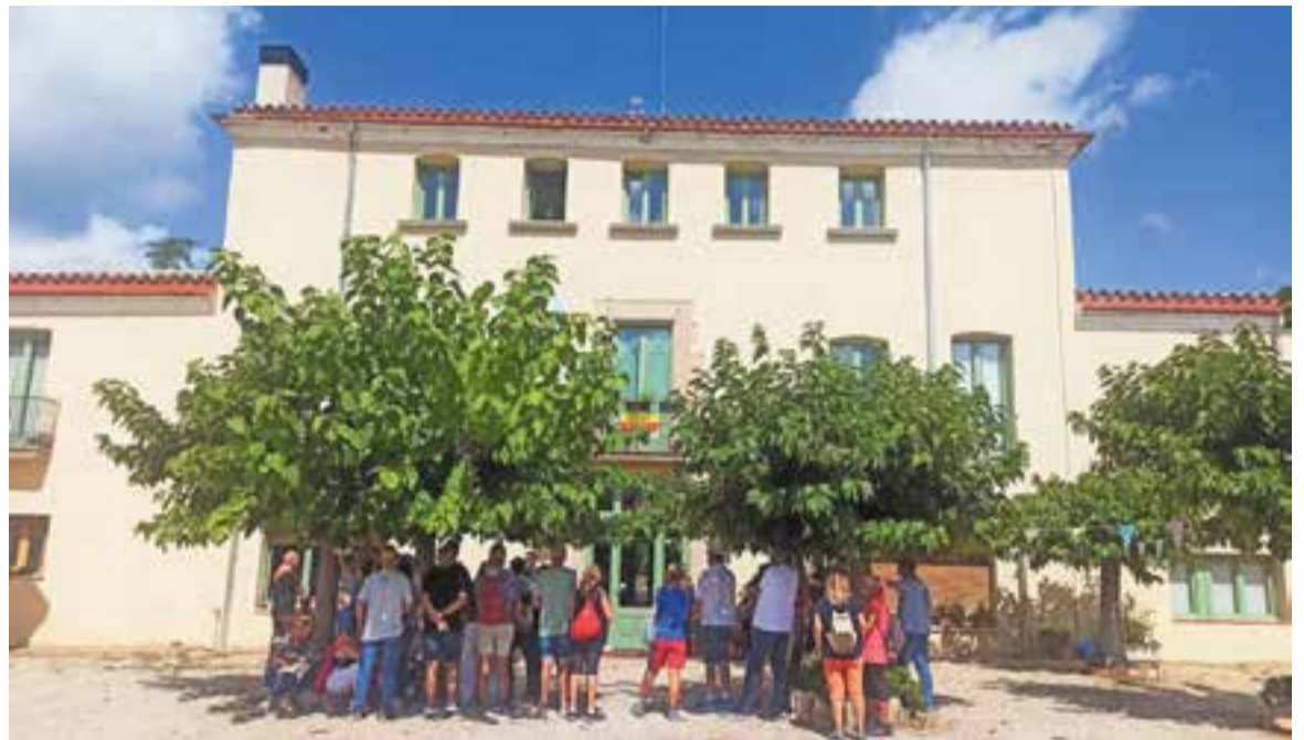
Imatge d'arxiu d'una visita a la Masia de Can Carner.

Des de la cooperativa remarquen que aposten per crear "un veï-