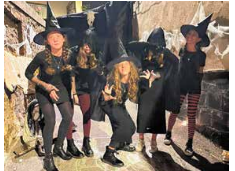
Una representació de les bruixes del túnel del carrer de la Mina.

Un dels atractius principals del túnel del carrer de la Mina, a banda del traçat del nucli antic, eren les ganes i l'empenta de les joves bruixes de Castellar, que esperaven els