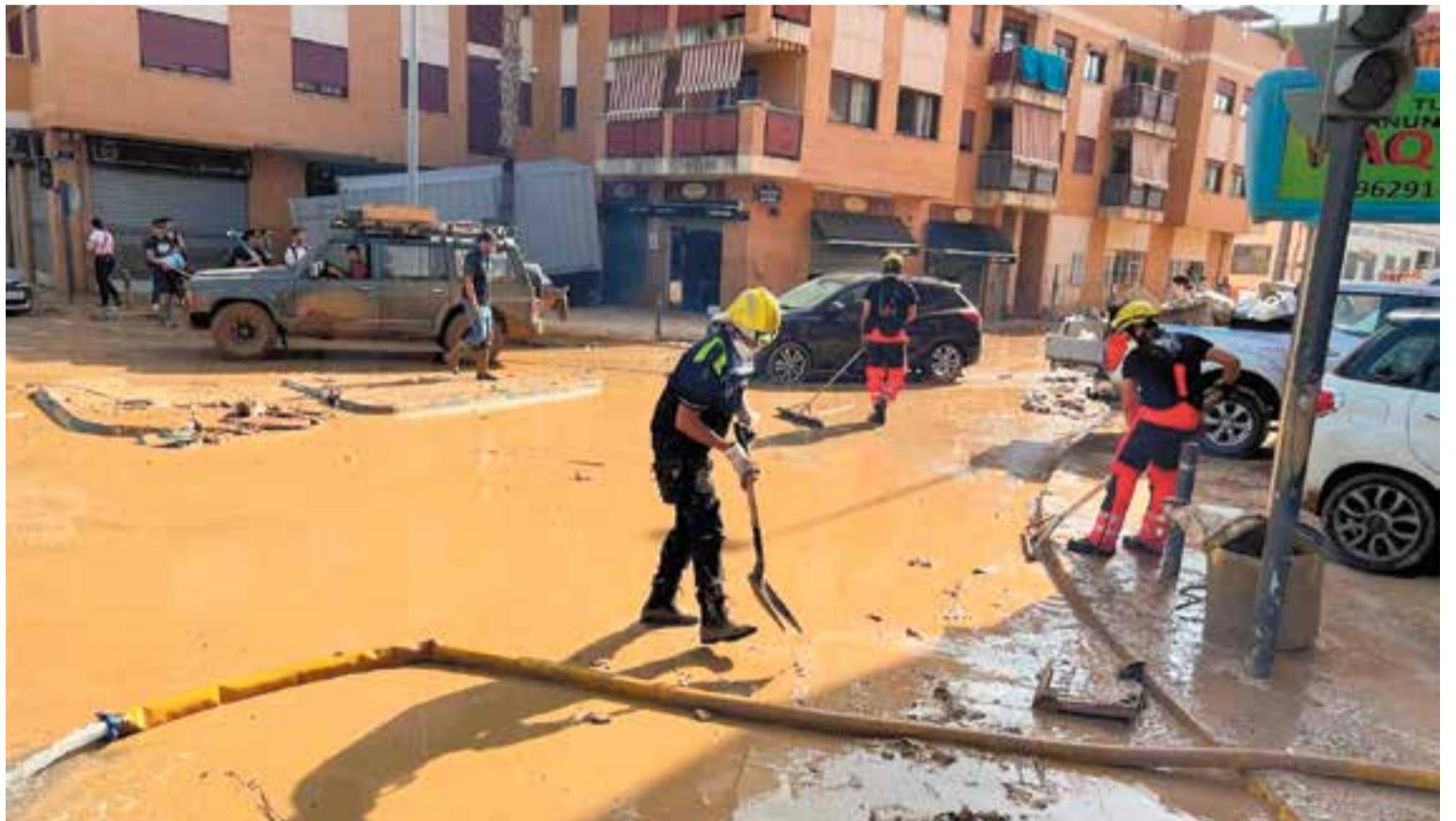
Un dels quatre agents de la policia local que s'ha desplaçat al municipi de Sedaví per ajudar els cossos de protecció civil.

Dilluns al matí, dos bombers voluntaris de Castellar del Vallès van marxar des de la central de Bellaterra, juntament amb al-