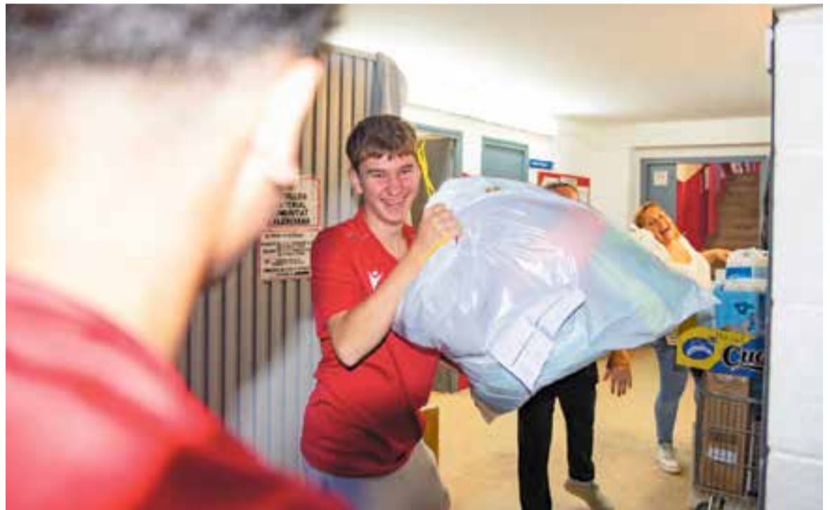
Els somriures i les ganes d'ajudar van ser la tònica durant la càrrega dels vehicles del comboi de la UE Castellar.

El club, finalment, no ha escollit l'autocar retolat per portar l'ajuda i ha estat un dels altres de l'empresa Autocars del Vallès –totalment blanc–, el que ha baixat fins allà. Des del club castellarenc es creu que no