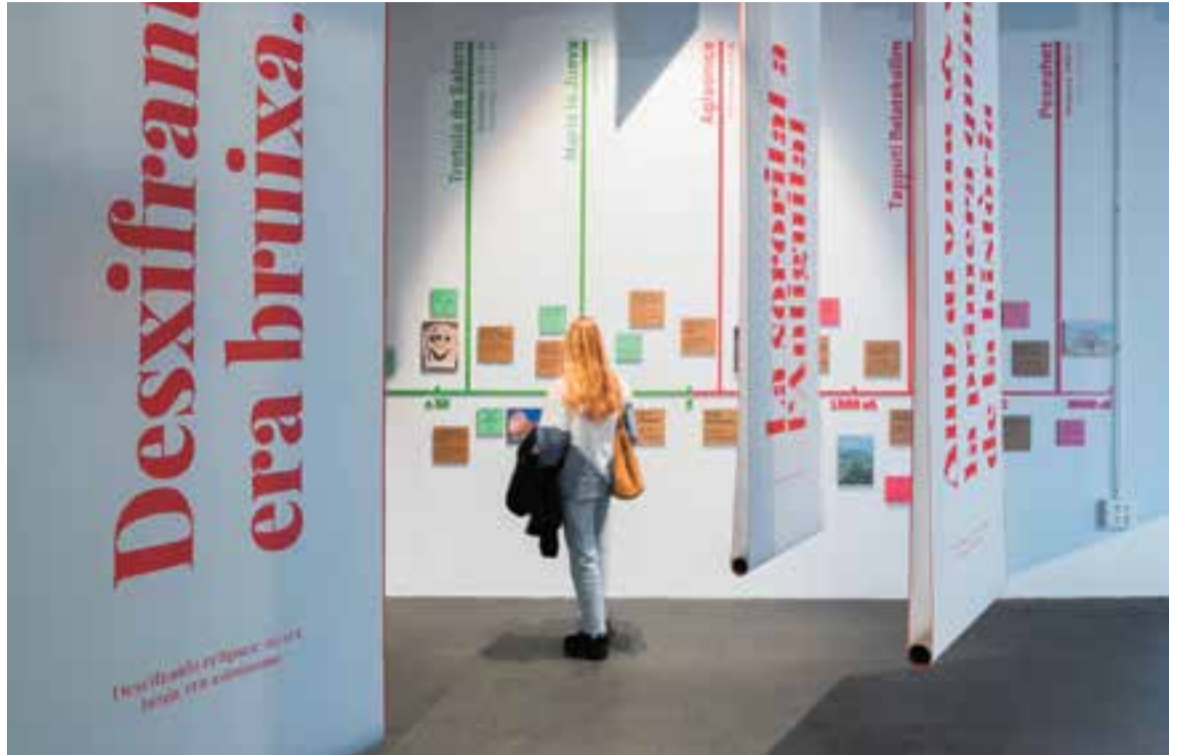
La mostra '(In)visibles i (O)cultes' obre aquesta tarda la Setmana de la Ciència 2024.

Les activitats continuaran dilluns 11 de novembre, a les 17 h, amb un taller de programació amb