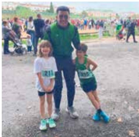
Els sub-10 amb el seu entrenador.

El club no va deixar passar l'oportunitat aportant el seu gra de sorra i omplint diversos vehicles que es van ajuntar amb la comitativa de la UE Castellar. +|| REDACCIÓ