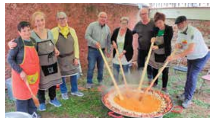
Algunes de les persones voluntàries que van fer la paella a la Casa Massaveu.