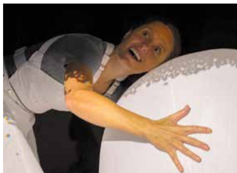
La Cia. La Curiosa apropa les 'Textures' a infants d'1 a 5 anys, a l'Auditori.