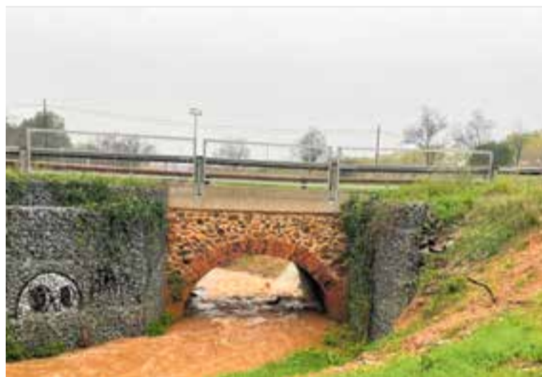
El Ripoll, al seu pas per Colobres en una imatge de dilluns passat.