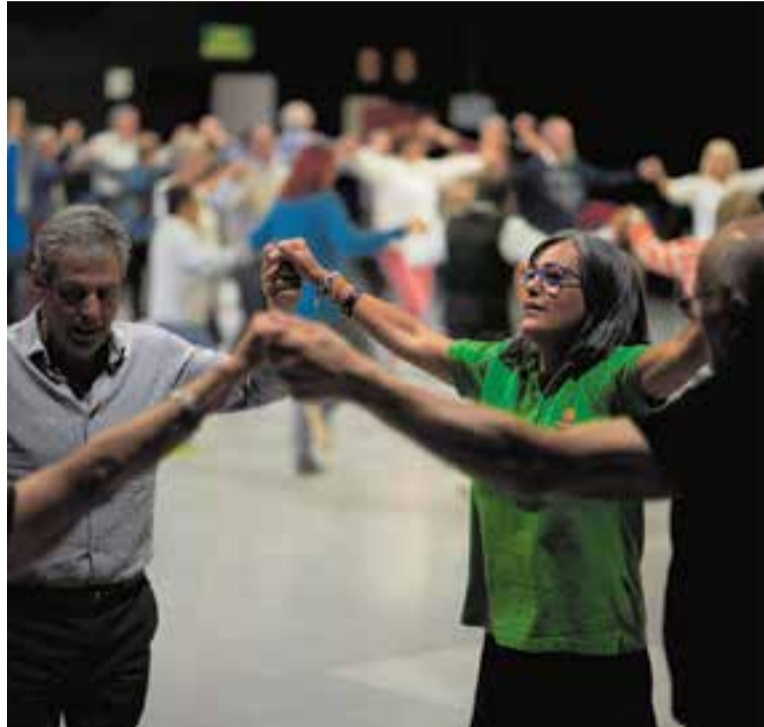
Record de la 47a Diada Sardanista a la Sala Blava de l'Espai Tolrà.