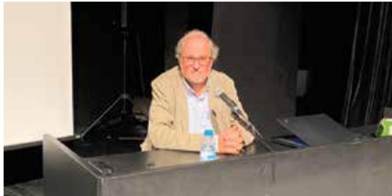
Quim Torra durant la conferència de L'Aula, dimarts passat.

L'expresident de la Generalitat, Quim Torra, va protagonitzar dimarts passat l'última sessió de L'Aula. Torra és advocat i sempre ha estat molt vinculat a diverses institucions culturals. A tall d'exemple, va ser director del Born Centre Cultural, va fundar l'editorial A Contra Vent i també va presidir Òmnium Cultural. De fet, la conferència de Torra va tractar sobre la llengua catalana. Sota el títol “ Si la llengua falla, fallarà tot ”, una frase de Pompeu Fabra, el ponent va oferir una fotografia de la situació actual del català. “ No tenim eines per protegir la llengua i hem de fer un pas endavant, com els nostres avis després de la guerra, que van decidir parlar-nos en català ”, va dir.