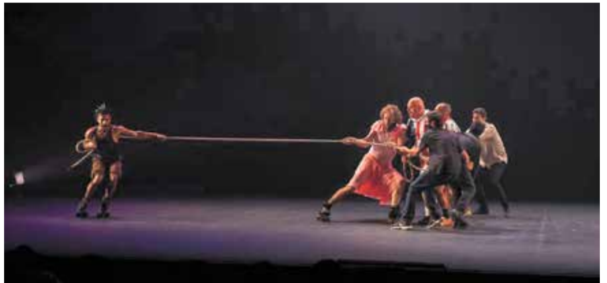
Moment de l'espectacle de circ 'De tu a tu', del Col·lectiu Mur. Es podrà veure aquest dissabte a l'Auditori Municipal.

A l'espectacle passen coses i neix la veritat, l'avorriment, el joc, l'amor, la comprensió, l'escolta, la ira, la fragilitat, la complicitat, la manipulació, la confiança. El cos ens diu coses. + || REDACCIÓ