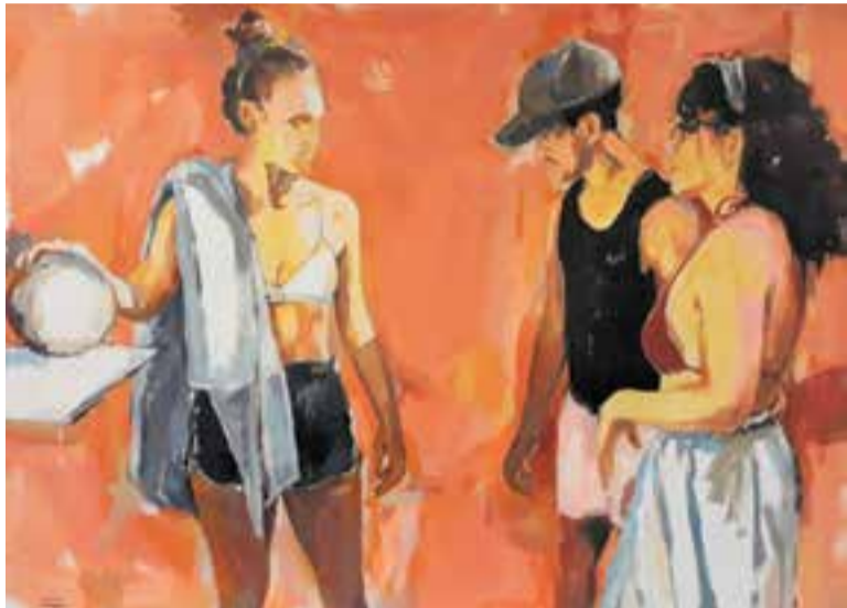
Un dels quadres d'Esteve Prat que es poden veure al Calissó Cultural.

El pintor castellarenc Esteve Prat exposa una mostra de les seves pintures del 7 de novembre al 5 de desembre al Calissó Cultural.