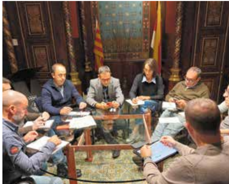
Reunió del comitè d'emergències dilluns passat. || AJ.CASTELLAR

Dimecres passat es va celebrar una sessió del Consell d'Alcaldies del Vallès Occidental per abordar el suport a les poblacions valencianes afectades per la catàstrofe pro-