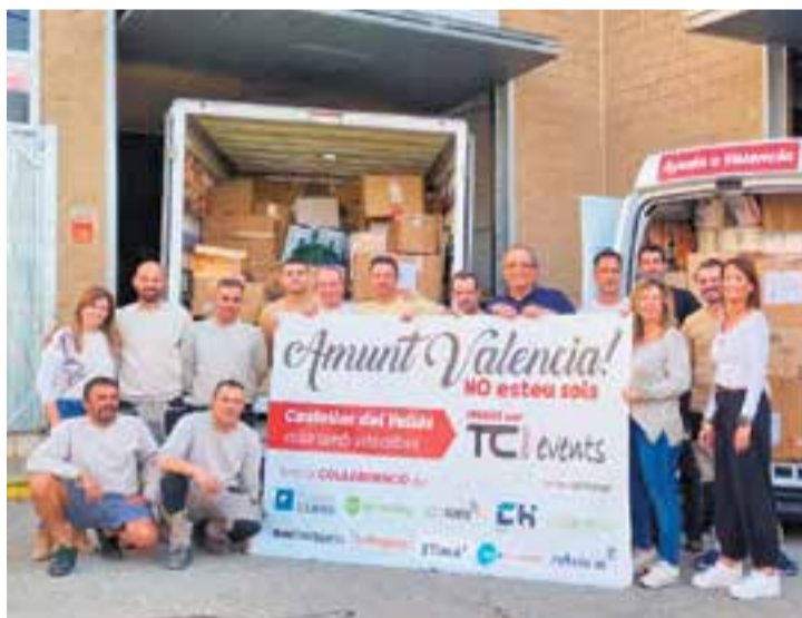
Fins a una dotzena d'empreses locals han enviat material solidari.