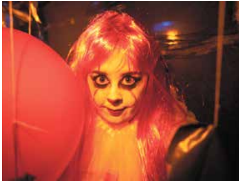
Un dels personatges del túnel del terror del carrer Major, divendres passat.

A més del recorregut de caramels i lliminadures del Trick or treat a l'eix comercial, Castellar va tenir dos pols d'atracció: el túnel del carrer Major i el túnel del carrer de la Mina, organitzats per l'Associació de Veïns i Comerciants del Carrer