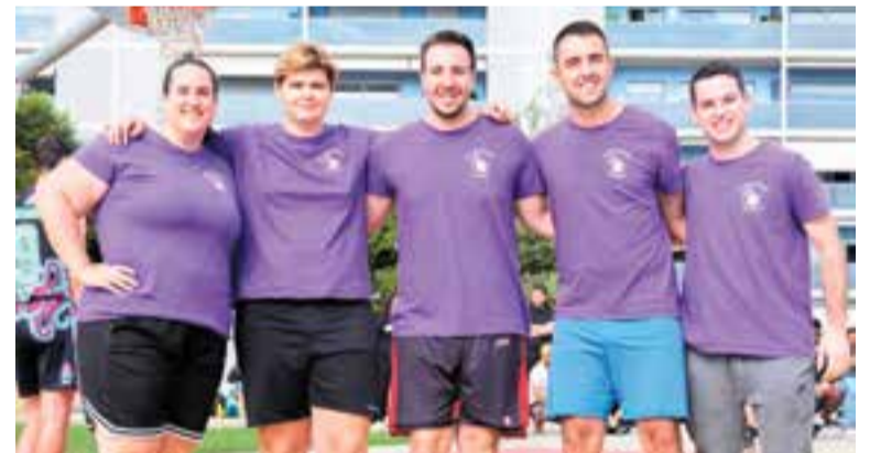
L'equip de 3x3 del Pinya que va participar a Badalona.

El torneig també tindrà obsequis, sortejos, DJ i més sorpreses. Serà el segon 3x3 que organitza el Bàsquet Pinya després del que va organitzar al mes de juliol a l'Espai Tolrà, que va comptar amb més de 40 participants. Així mateix, seguint el seu vessant social i solidari, l'entitat castellarenca destinarà part dels beneficis recaptats en el torneig de Reis a la Marató de 3Cat. + || REDACCIÓ