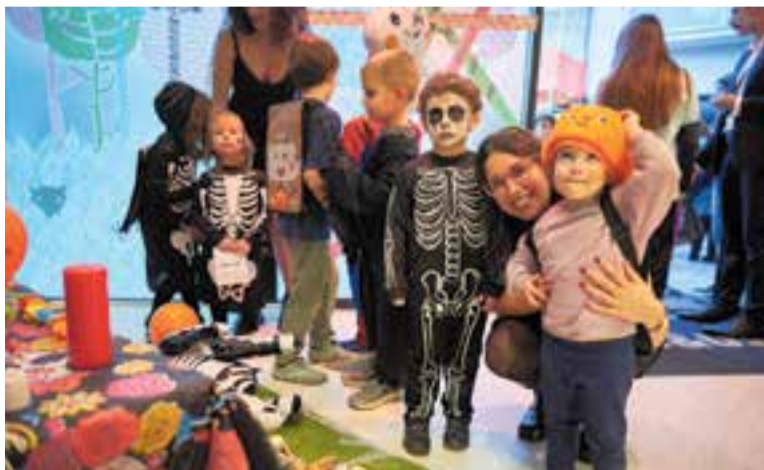
Una de les parades del recorregut va ser Kids&Us, un dels impulsors de la proposta del 'Trick or treat', que també va repartir dolços.

Gairebé una trentena d'establiments es van sumar divendres passat a la segona edició del Trick or treat , una proposta de Comerç Castellar amb la col·laboració de l'acadèmia d'idiomes Kids&Us. Però no només els comerços van voler participar en el dolçissim recorregut. Molts vilatans van decorar les seves portes per anunciar que repartirien caramels i lliminadures als grups d'infants que piquessin a la porta i pronunciessin