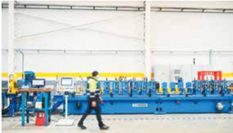
Un operari en les instal·lacions de l'empresa CELO en una imatge d'arxiu.

L'atur a Castellar es manté força estable. Segons les dades del mes d'octubre, el municipi té en aquests moments 958 persones sense feina, 9 més que al mes de setembre. Aquesta petita modificació a l'alça manté invariable la taxa d'atur de Castellar del Vallès, que és del 7,4%, una de les més baixes de la comarca i la província. En aquest sentit, des de la Diputació ofereixen dades interanuals de l'atur dels municipis de la província i en el cas de Castellar, s'ha produït un petit augment de 23 persones, cosa que es tradueix en un creixement del 2,4% de les xifres de desocupats entre octubre del 2023 i octubre del 2024. Com és habitual, la taxa d'atur comarcal es manté gairebé dos punts per sobre de la de Castellar: el Vallès Occidental va tancar l'octubre amb 43.667 aturats i una taxa d'atur del 9,3%. En el cas de la província, la taxa també és superior a la de Castellar: a l'octubre s'ha situat en el 8,7%, gairebé idèntica a la del setembre. + || REDACCIÓ