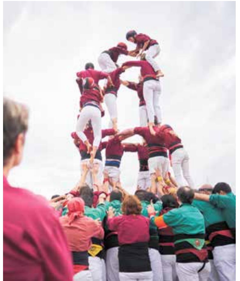
Els Capgirats, durant un moment de l'actuació a la plaça d'El Mirador.

Els Capgirats també han aprofitat per fer una crida a totes aquelles persones i famílies que vulguin incorporar-se a la colla. Se'ls pot trobar a través de les xarxes socials, que mantenen actives. +