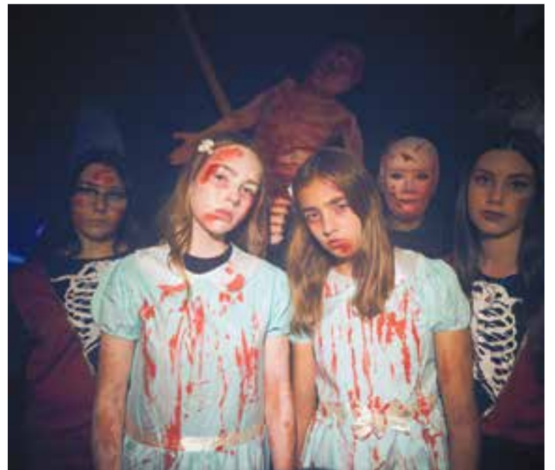
Les bessones de l'hotel Overlook es van instal·lar al túnel de La Fàbrica.

Així, l'Espai Tolrà es va transformar només per una tarda (o això esperem) en l'hotel Overlook. A les portes rogenques, color sang, d'aquest hotel improvisat s'acumulava una boira inesperada i densa que complicava el fet de respirar i fins i tot de cridar. I entre revolt i revolt, esperaven els visitants les inquietants bessones vestides de diumenge amb un contradictori pitxi blau cel, un aterridor recepcionista, algun cadàver més viu que mort, i un dels habituals del túnel de Castellar, el famós psicòpata amb serra de cadena. Aquest ensurt mai falla. És el pic d'adrenalina que a tots ens fa falta. Gaudim-lo! +