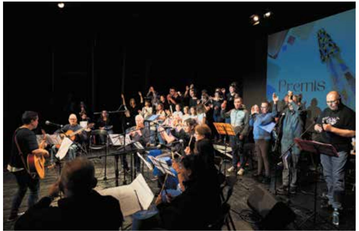
La gran majoria de participants al festival cantant de manera conjunta “Actitud” al final de la gala.

Com en edicions anteriors del SOM Festival, el grup Krec'n'tu, de Salut Mental Sabadell, no es va voler perdre la gala i va interpretar dos temes rockers: “Que tot et vagi bé” de Txarango i “I was born to love you” de