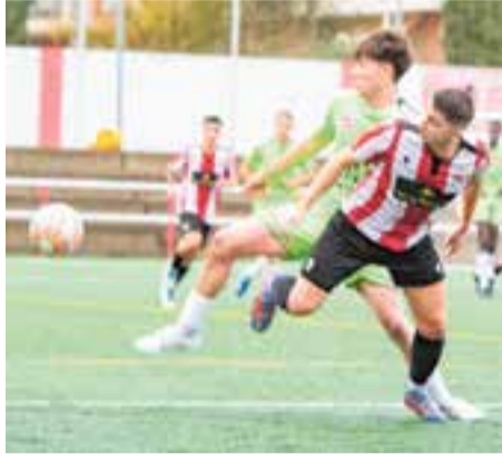
El Torroella va ser més efectiu.