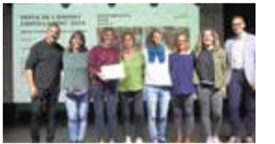
Els esportistes van tenir el seu protagonisme a la Festa de l'Esport.