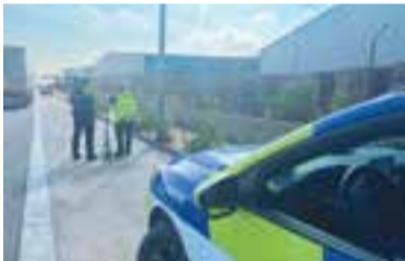
Control policial a un patinet.

La policia local de Castellar del Vallès s'ha adherit a la campanya de control de ciclistes i vehicles de mobilitat personal (VMP) que ha posat en marxa aquesta setmana el Servei Català del Trànsit. Així, des de dilluns, 21 d'octubre, i fins aquest diumenge s'estan duent a terme controls per incidir especialment en les accions o omissions dels usuaris de bicicletes i VMP, i també en els altres usuaris de la via que s'hi relacionin. Entre d'altres, es controlen conductes com la circulació per llocs inadequats com la vorera, l'ús de dispositius de telefonia mòbil o auriculars durant la conducció o la sobreocupació dels vehicles. En el cas de VMP, també se'n controlen les característiques tècniques. †|| REDACCIÓ