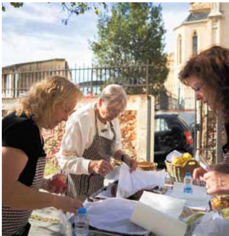
Les Castanyeres de Castellar al pati de la Casa Massaveu l'any passat.

LES CASTANYERES AL MASSAVEU I per continuar amb la tradició dels productes nostrats i amb finalitat solidària, les castanyeres de Castellar seran al pati de la Casa Massaveu (carrer de l'Església) els dies 31 d'octubre, 1, 2, i 3 de novembre per oferir castanyes ben torrades i moniatos, en horari de 10 a 22 h. Com l'any passat, també tindran una tómbola amb productes de di-