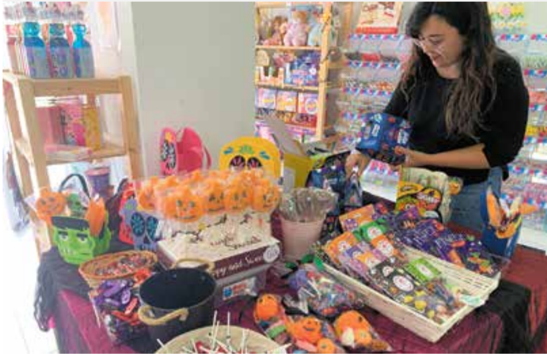
El 'trick or treat' consisteix a demanar lllaminadures per cases i establiments durant el vespre del 31 d'octubre.

La festivitat que arriba dels països anglosaxons agafa força a la vila amb diverses activitats