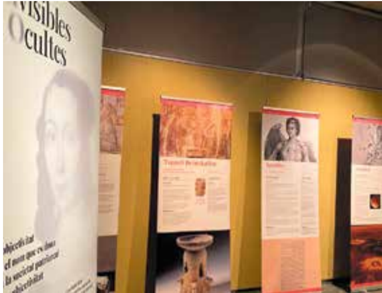
La mostra "(In)visibles i (O)cultes" inaugurarà la Setmana de la Ciència.

Les activitats engegaran divendres que ve, 8 de novembre, amb la inauguració de l'exposició "(In)visibles i (O)cultes", a les 18 h al Mercat Municipal, que ha estat l'espai triat per instal·lar aquesta mostra que viatja a través de l'espai i el temps per la vida de 24 dones científiques i que es podrà visitar durant tota la