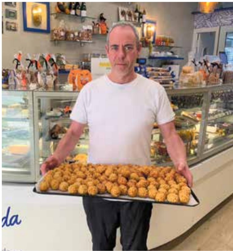
La Pastisseria Muntada ha elaborat 150 kg de panellets per aquesta festivitat.