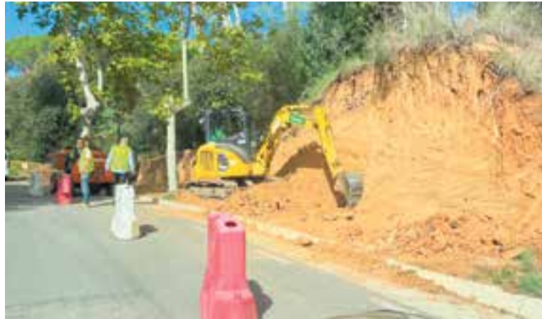
Ja han començat les obres de la segona fase del camí bici.

Després que el 2023 es duigués a terme una primera fase des del carrer de Sant Feliu fins a la urbanització de l'Aire-sol A-B, ara l'actuació continua amb l'habilitació d'un tram de 750 metres, que s'allargarà fins al camp del Serrat de Sant Feliu del Racó. El nou vial serà també de formigó raspallat de 2 metres d'amplada (o 1,5 metres en punts específics) i disposarà d'il·luminació solar per garantir que el recorregut es pugui fer en horari nocturn. A més, els trams propers a la carretera es protegiran amb baranes de fusta, i el pont de la carretera ja està adap-