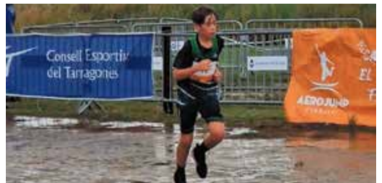
Vila-seca va ser una cursa èpica per als atletes del CAC, amb aigua i fang.