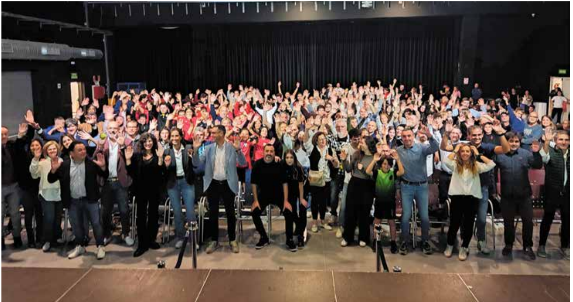
Foto de família dels quasi 300 esportistes de la vila que van participar en la Festa de l'Esport d'aquest any amb les autoritats municipals en primer terme. L'acte va tenir lloc dijous de la setmana passada a la Sala Blava.