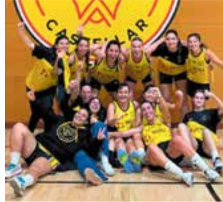
La victòria, l'estat natural del femení.

Quarta victòria consecutiva per al femení 53-43 contra el CB Santpedor. Les de Xavi Revilla van ser superiors després d'una ajustada arrencada al primer quart, en què van caure per 7-8. Després es van emportar tots els parcials, van arribar 21-20 al descans i van noquejar les rivals en la segona part. L'equip continua escalant posicions i ja estan situades en la sisena plaça.