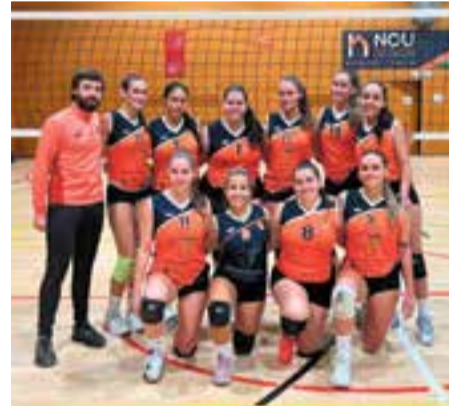
L'equip femení de vòlei continua imparable.

Victòria del femení, que continua a la part alta després de superar per 3-1 (22-25/27-25/26-24/25-19) el CV Barberà B. El conjunt, des de la tercera plaça, obre una esletxa de set punts amb la zona de promoció de descens i es consolida com un dels favorits en la lluita per la classificació per la promoció d'ascens a Primera Catalana.