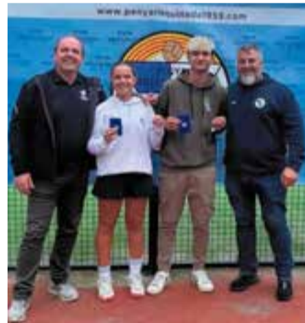
Una de les parelles participants a l'HIPOFAM.

La Penya Arlequinada de Can Font i Can Avelaneda va aconseguir un total de 2.000 € per a l'estudi de la hipomagnesèmia, en l'11a edició del torneig HIPOFAM. Aquesta quantitat anirà íntegrament dedicada a l'estudi d'aquesta malaltia a l'Hospital de la Vall d'Hebron de Barcelona.