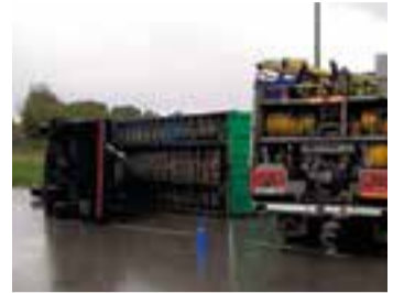
Imatge del camió bolcat.