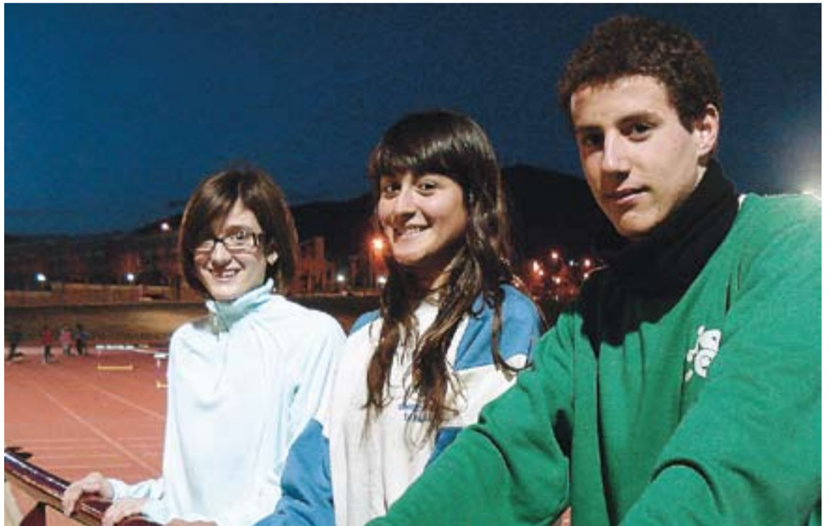
© Alexandra Bayo, Mònica Córdoba i Albert Moreno. || J.M.

Mònica Córdoba va quedar en cinquena posició del Campionat de Catalunya de Cros, lloc que finalment li ha servit per viatjar a Tarancón (Cuenca), amb quatre atletes més de la selecció catalana, on es farà l'espanyol individual de cros. L'objectiu de Córdoba serà fer un bon paper i ajudar a la selecció a emportar-se la victòria per equips. +