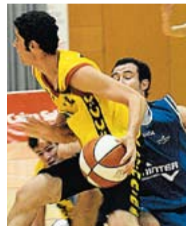
⊙ L'equip no surt dels últims llocs. || J.G.

Manresa ha estat un tornar a començar. Els castellarencs havien plantat cara la setmana anterior, també a fora, a la pista del Sitges. Aquesta vegada es jugaven les garrofes contra un equip de la zona baixa, un enfrontament directe on era obligatori guanyar per afrontar els propers partits amb més tranquil·litat. Un últim quart fatídic va suposar una derrota de 24 punts contra l'Albert Disseny malgrat que els castellarencs havien començat el partit bé, amb un 21 a 29 al final del primer quart. Els de Forné ja anaven per darrere en el mar-