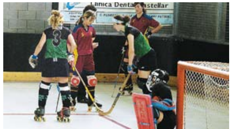
Una jugada del partit davant del Bigues i Riells.