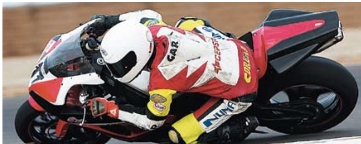
© Toni García en uns entrenaments previs al Campionat de Catalunya. || X-BIKE.

El pilot de l'escuderia X-Bike ha estat entrenant-se aquesta última setmana al Circuit d'Al-