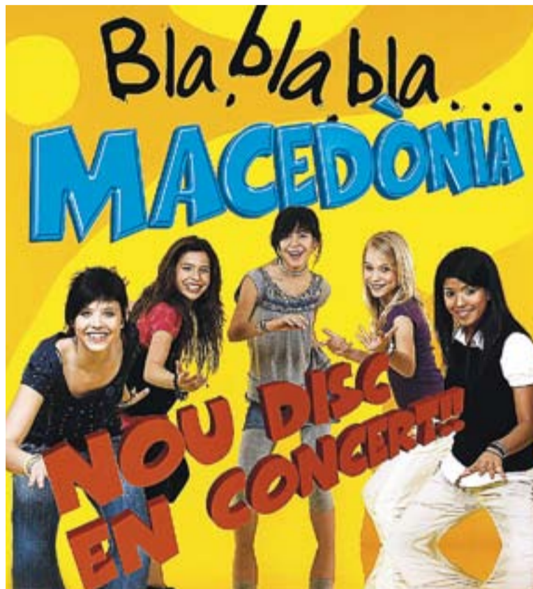
© Cartell promocional del nou disc de 'Macedònia'. || CEDIDA

El disc compta amb 12 cançons molt aconseguides. Algunes de les més destacades són: Bla, bla bla... , que és alhora el primer senzill, Bombolles , El