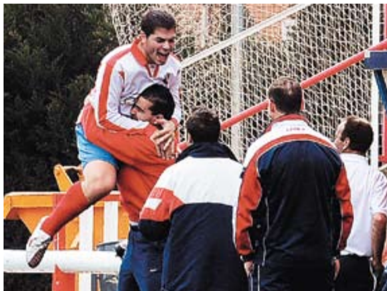
⊙ Aguilar i Argemí celebren el tercer gol de diumenge. || JOSEP GRAELLS

Any nou, vida nova. El 2008 ha començat amb una Unió Esportiva imparabile que registra uns números espectaculars. Els castellarencs han escalat fins la sisena posició i s'han convertit en el millor equip de la lliga gràcies a una ratxa de vuit victòries en nou partits. Les lesions han respectat l'equip, la davantera funciona, i Aguilar, Ivan, Moreno i Argemí s'han convertit en els amos de Territorial. La capacitat anotadora supera ara els dos gols per partit. "Són mecàniques. Ara tot ens va de cara. Els jugadors creuen en