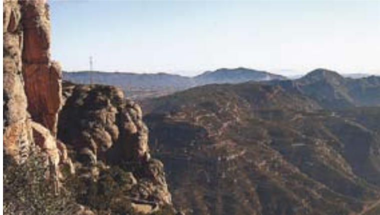
© Vista del paratge vallesà des de Montserrat. || M.A.

Es farà una parada per esmorzar a la Casa de l'Obac i es continuarà fins al monestir de Montserrat. A l'acabament, es donarà un petit record a totes les persones participants. +