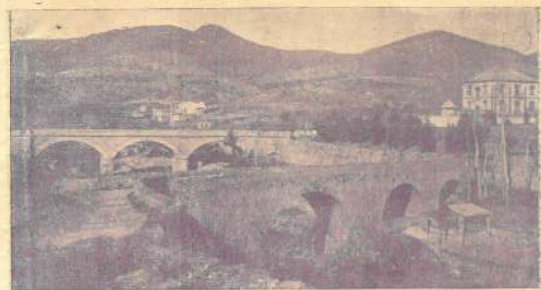
Bells indrets de Castellà. Ponts sobre 'l riu Ripoll