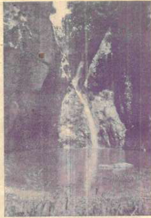
Bells indrets de Castellar. Gore d'en Barba.