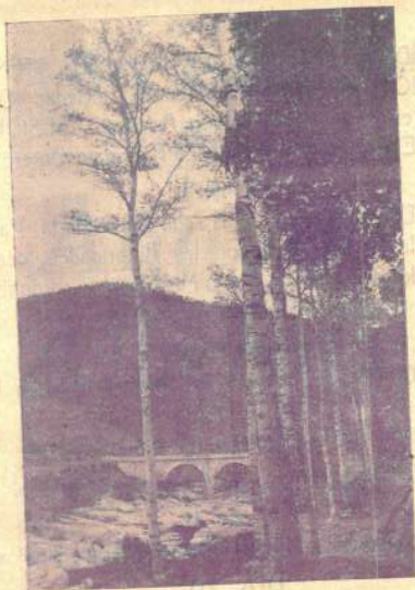
Bells indrets de Castellar. Pont de Turell