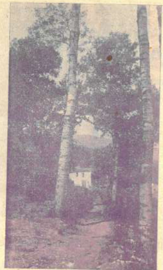
Bells indrets de Castellar. Paisatge clixé Vergés

Papers de totes menes Fàbrica de Paper estrassa.