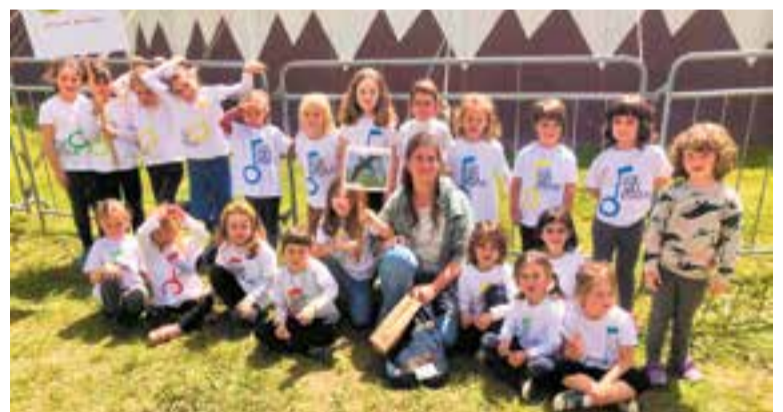
El cor de petits del Cor Sant Esteve va cantar al Circ Cric.

Els cantaires eren artistes i espectadors, alhora, perquè van interpretar els temes des de la grada. En aquest sentit, van veure equilibristes, malabaristes i pallasos "i el Tortell Poltrona ens va regalar un espectacle seu". La matinal va finalitzar amb un dinar plegats, i diverses activitats de circ conduïdes per un animador i amb un bany al riu. †