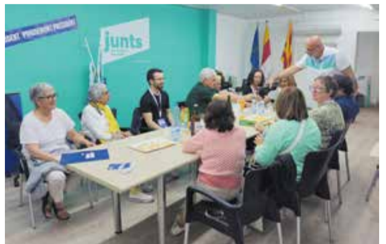
Membres de Junts per Castellar celebren amb cava els resultats electorals.