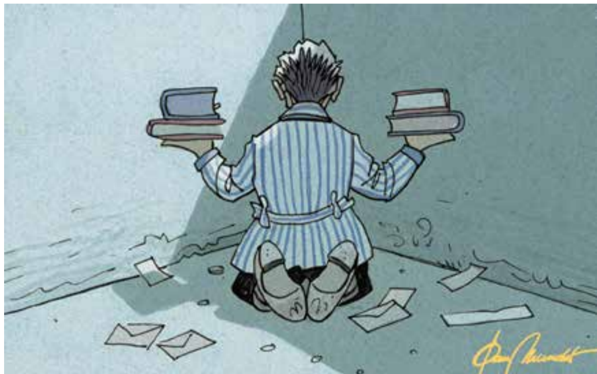
© Dia de reflexió. || JOAN MUNDET

“Ens hem acostumat a exercir el dret de vot i ens resulta un entreteniment tediós?”