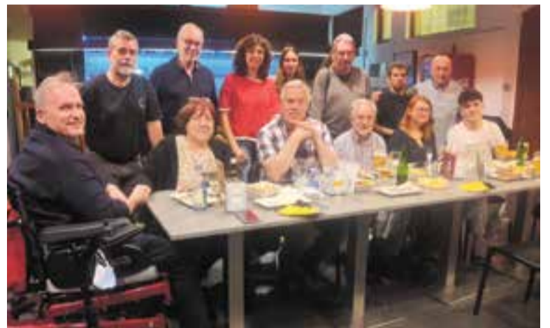
Com és tradició, ERC va fer seguiment de la nit electoral al Calissó. || C.D.