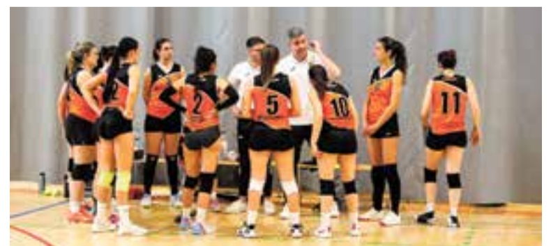
El femení té a les mans la permanència a Segona Catalana.