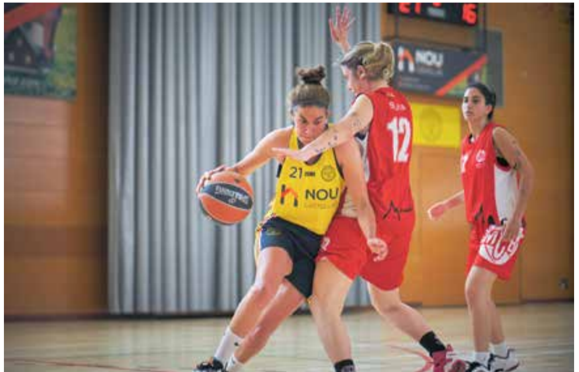
Una jugadora del CB Castellar intentant desfer-se d'una rival del Montmeló al pavelló Blume la setmana passada.

D'altra banda, l'equip masculí va caure per 100-75 contra el La Salle Manresa, en l'últim partit disputat a Primera Catalana. El conjunt acaba en últim lloc de la taula (6-20), suma el segon descens consecutiu i la pròxima temporada serà equip de Segona Catalana. +