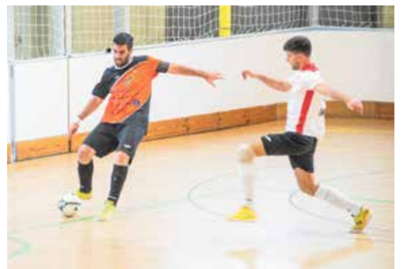
L'FS Castellar, a punt per aconseguir la salvació al Joaquim Blume. || A. S. A.

El Blume haurà de ser un polvorí (dissabte, 19.00 h) per segellar la permanència. + || A. SAN ANDRÉS