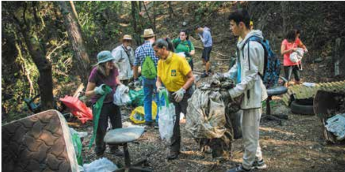
Els voluntaris van recollir cadires d'oficina, matalassos, quadres i un senyal de trànsit, entre altres residus.