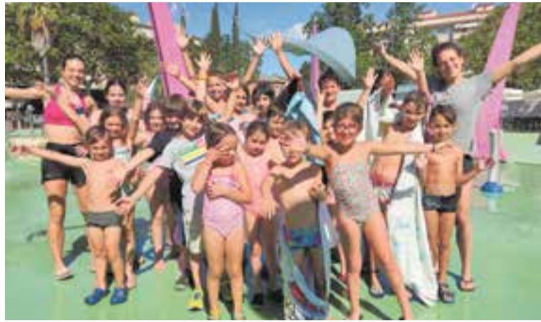
Participants del casal Canglomerat Escola d'Escalada als jocs d'aigua.

Per donar suport a les entitats organitzadores, l'Ajuntament tornarà a destinar al projecte una dotació de 25.000 euros. També cedirà diversos espais municipals i n'assumirà la neteja. A més, en aquesta edició es tornarà a oferir una oferta addicional d'activitats promogudes per l'Ajuntament. D'aquesta manera, infants i adolescents tindran l'oportunitat de tastar fins a 26 de propostes diferents de la