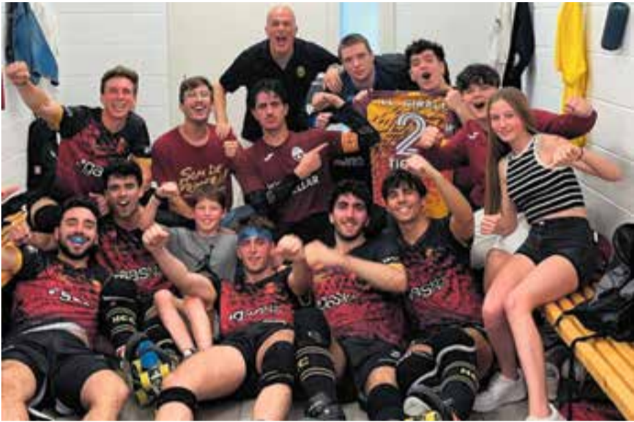
Quarta victòria consecutiva d'un HC Castellar en plena forma.

L'HC Castellar suma la quarta victòria consecutiva en Lliga i es manté a nou punts de distància amb el líder, el Bell-lloc, i a cinc amb el seu perseguidor, el Barberà. Van superar per 2-6 el Vilanova quan falten tres jornades pel final.