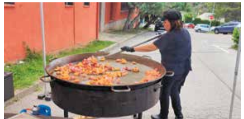
En la celebració de Can Font no va faltar la paella gegant.

A banda dels veïns de Can Font i Ca N'Avellaneda, també es van apropar a aquesta festa gent del voltant de la comarca: "Sempre tenim alguns visitants de Sabadell, del nucli urbà de Castellar i de Terrassa. Enguany, però, ens ha coincidit amb la Fira Modernista, que s'ha celebrat durant tot aquest cap de setmana a la co-capital vallesana", va recordar la presidenta de Can Font i Ca n'Avellaneda.