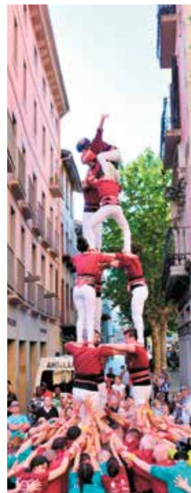
Els Capgirats, a Olot.