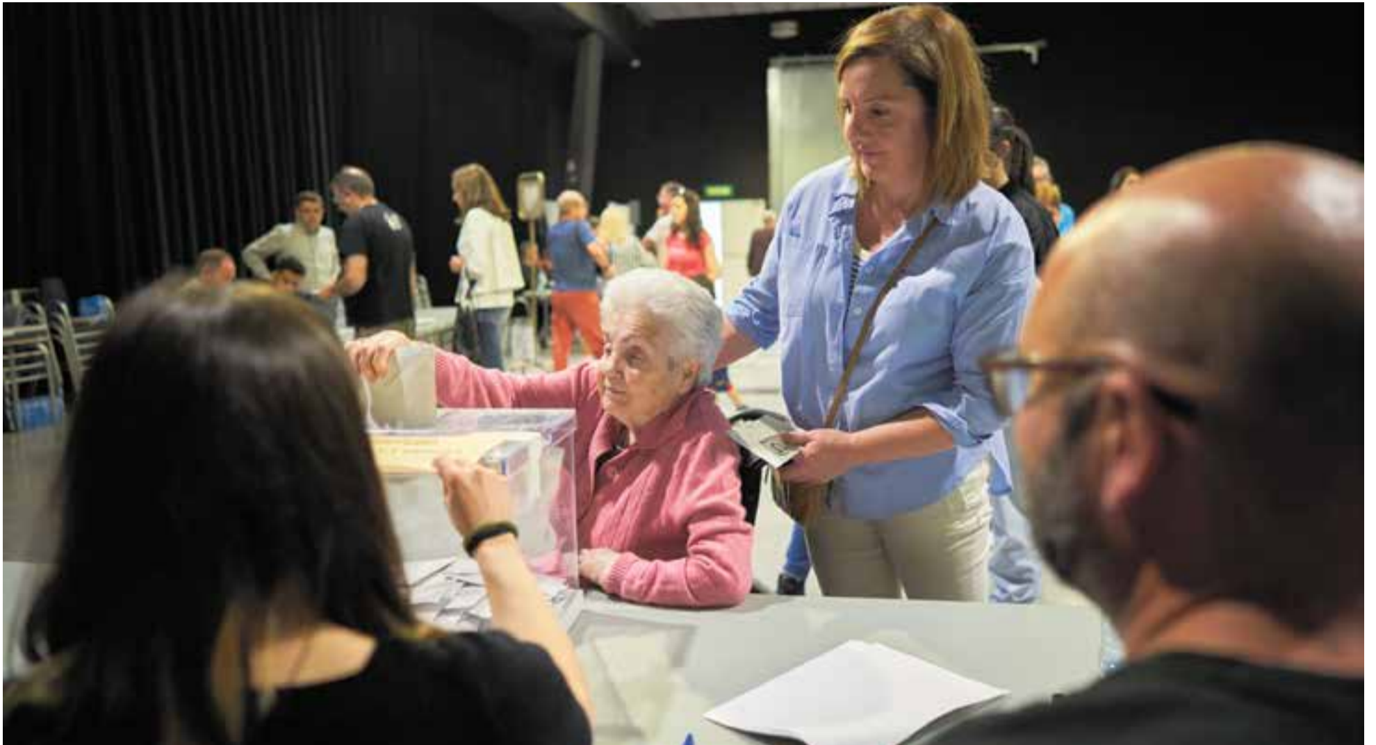
Una votant exercint el seu dret a vot a la Sala Blava de l'Espai Tolrà. La jornada electoral a Castellar del Vallès es va viure en 9 col·legis electorals distribuïts en 14 seccions i 25 meses.

Els socialistes han obtingut a Castellar el 27,6% dels vots i s'han imposat a Junts per Castellar, que queda en segona posició (23,4%). ERC, guanyadors el 2021, queda en tercer lloc amb el 15,9% dels vots. La participació va ser del 59,3%