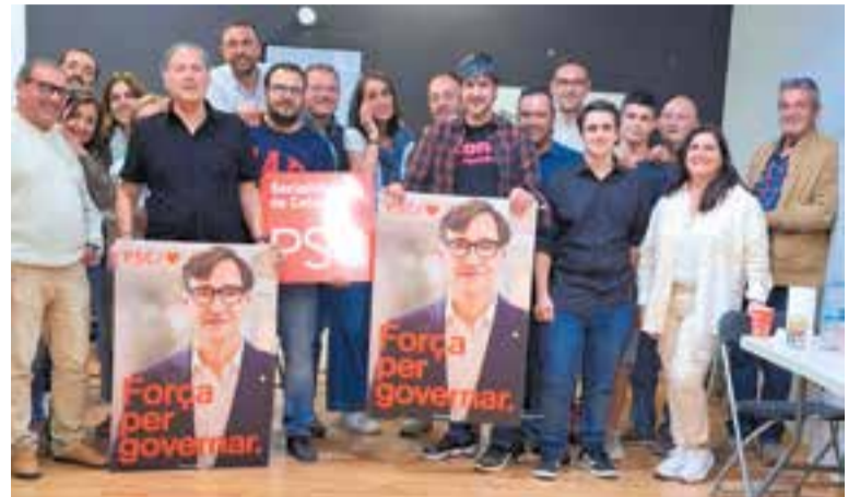
Els guanyadors de les eleccions a Castellar amb cartells de Salvador Illa.