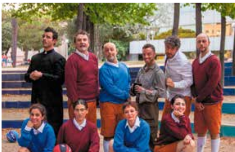
Els membres de la companyia Parking Shakespeare reinventen 'Ricard III'.

Tot està a punt per al 44è Aplec de Castellar Vell i pel 41è Concurs d'Arrossaires previstos per a diumenge, 19 de maig. Diverses entitats i associacions culturals del municipi faran viva aquesta tradició local. Respecte al programa anunciat a 'L'Actual' 450 , finalment no es farà l'itinerari previst a les 10 h a càrrec del Centre d'Estudis. Hi haurà jocs de cucanya de l'Esplai Xiribec, concurs de flors boscanes de l'Escola Nocturna, el ball de Gegants de l'ETC, Ball de Gitanes, Ball de Bastons i els Castellans de Castellar. Les inscripcions per al concurs d'arrossaires es tanquen avui.