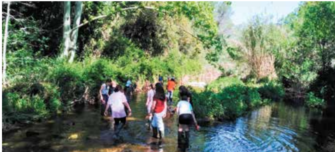
Els alumnes van fer un taller per treballar de manera lúdica els macroinvertebrats, la flora i els rastres de fauna al riu Ripoll.

Així, la festa ha inclòs, d'una banda, un circuit d'aventura, amb un itinerari sobre els arbres i una vintena de plataformes on s'arribava creuant ponts i tirolines; d'altra banda, també s'ha fet un taller que permetia treballar de manera lúdica els macroinvertebrats, la flora i els rastres de fauna del tram del riu proper a Can Juliana. En aquest sentit, els