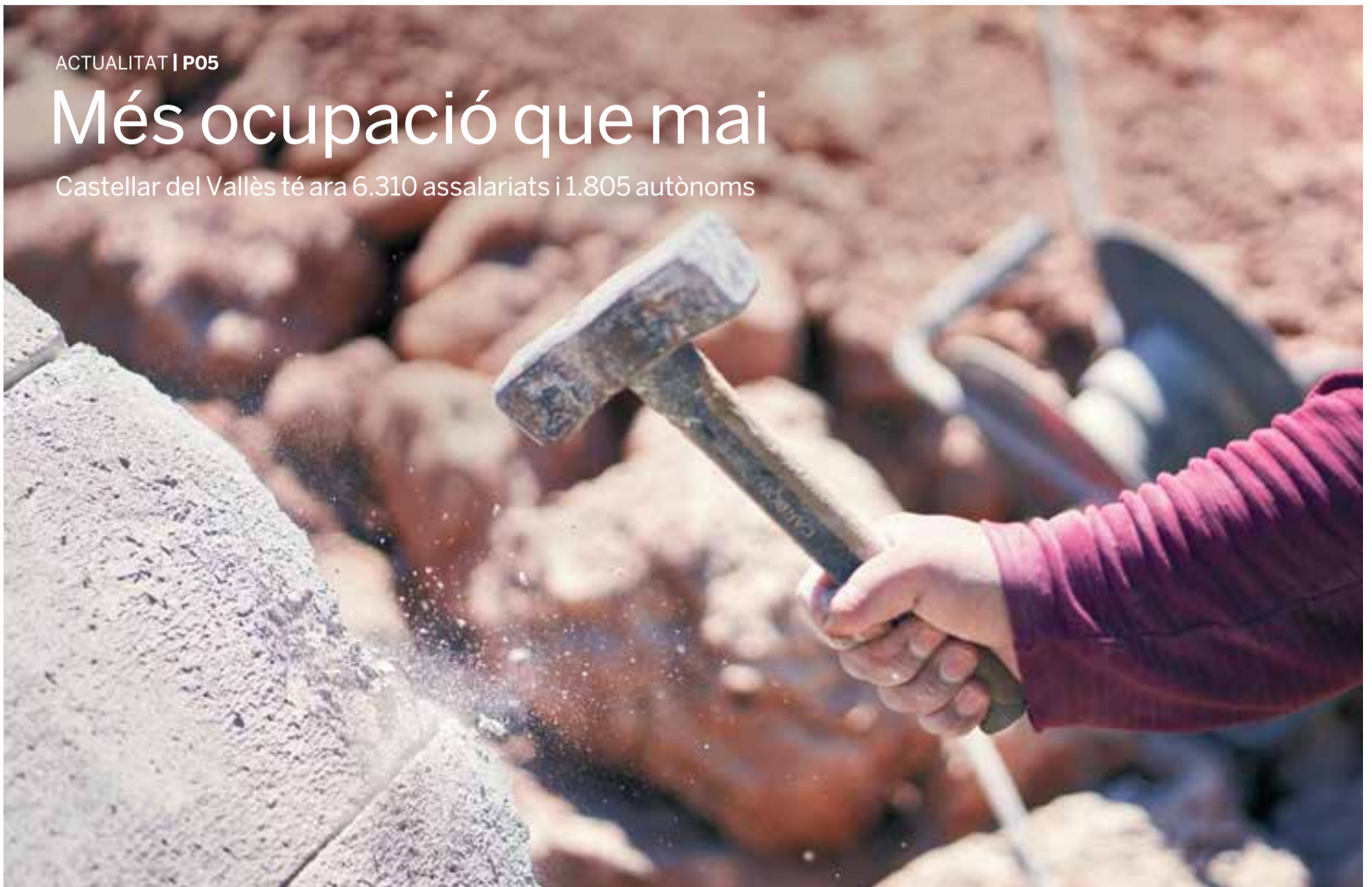
Un treballador pica amb un martell en les obres de construcció d'un nou centre logístic al polígon de la Bruguera en una imatge de dimarts passat. || Q. PASCUAL

Castellar del Vallès té ara 6.310 assalariats i 1.805 autònoms