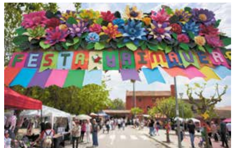
Festa de la Primavera a Can Font i Ca n'Avellaneda durant una edició anterior. || Q. P.

Durant tot el diumenge també hi haurà servei de bar, amb entrepans i begudes. A més, com cada any, es muntaran diverses paradetes que vendran tota mena de productes artesans, tant comestibles com d'artesanía. Any rere any, la festa atrau més gent i ambient, tant de veïns de les urbanitzacions com del nucli de Castellar. + || M. A.