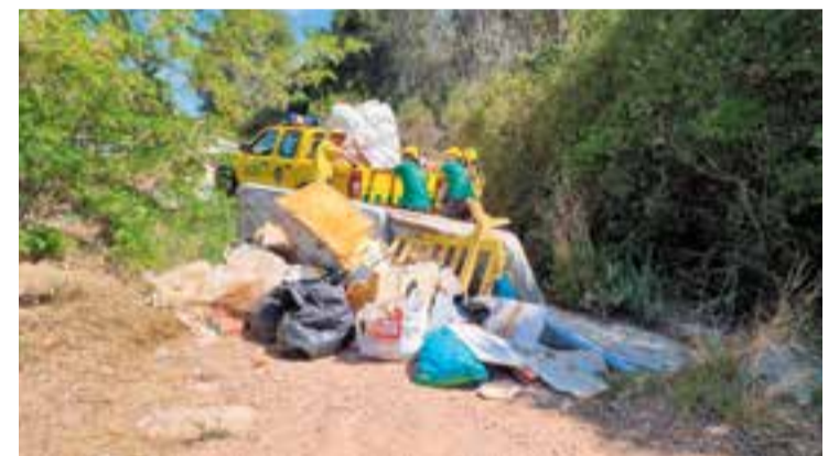
L'edició del 2023 va netejar una part del camí del riu Ripoll.

Castellar participa un any més en la campanya Let's Clean Up Europe, una acció comuna a tot Europa que té per objectiu conscienciar sobre la quantitat de residus que es llencen de manera incontrolada a la natura i promoure accions de sensibilització a través de la recollida d'aquests residus abocats il·legítimament. Enguany la zona que s'ha decidit netejar és el turó de Puigverd, per això es demana als voluntaris que acudeixin al punt de trobada –a l'aparcament de la ronda de Llevant– a les 9.30 hores. És previst que l'activitat duri unes tres hores. Es recomana dur roba i calçat còmode, portar aigua i protecció solar. L'organització lliurarà guants i bosses. L'any passat l'acció de neteja es va fer al camí del riu Ripoll, i el 2022 a la zona de Can Barba, moment en què es van recollir 1.200 quilos de residus. L'activitat és oberta a tothom, però els menuts de 16 anys que hi vulguin participar han d'anar acompanyats d'una persona adulta. †