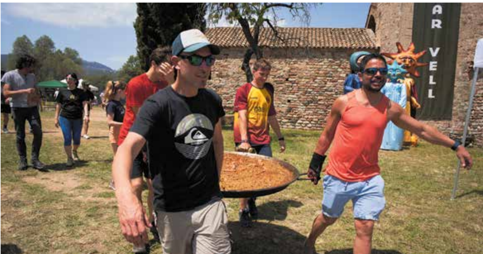
Preparació de les paelles d'arros per al Concurs d'Arrossaires a l'Aplec de Castellar Vell de l'any 2022.

Des d'avui i fins al 17 de maig, les colles es poden apuntar al 41è Concurs d'Arrossaires del 44è Aplec de Castellar Vell