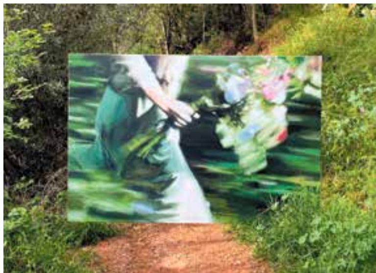
'El primer quadre' de Viena Boedo, en una foto on es veu rodejat de natura. || V. BOEDO

L'artista presenta una obra de gran format que es pot veure fins al 6 de juny