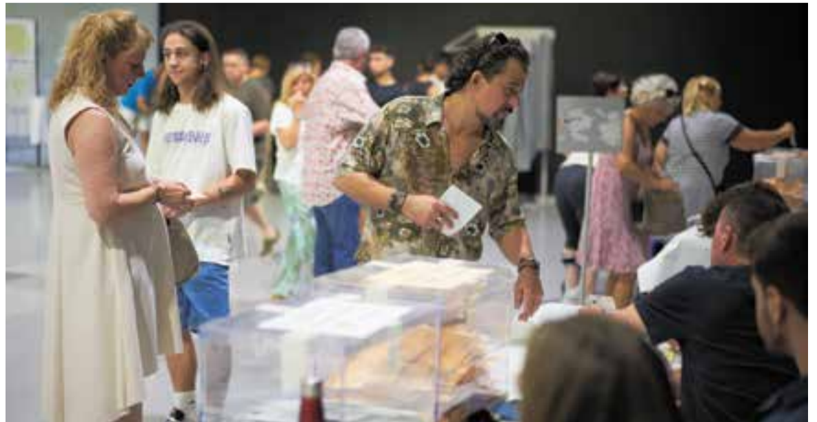
La darrera cita electoral van ser les generals, celebrades el 23 de juliol passat. A la imatge, votacions a l'Espai Tolrà.

A les darreres eleccions al Parlament, celebrades el 14 de febrer de 2021, la força guanyadora a Castellar va ser ERC, que va aconseguir el 24,8% dels vots. En segona i tercera