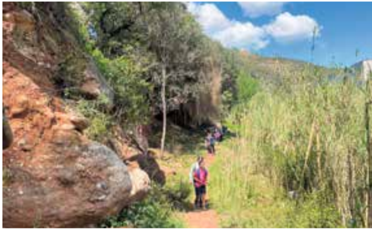
En l'edició de 2023 van participar 217 persones en la caminada. || A.J. CASTELLAR