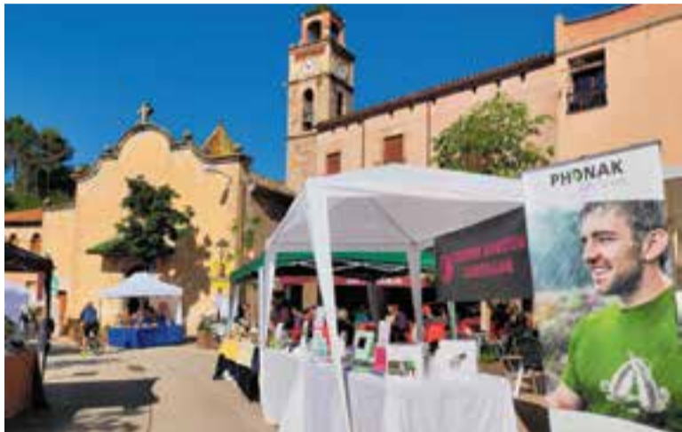
Una imatge de la Fira de Sant Ponç de Sant Llorenç de l'any passat.