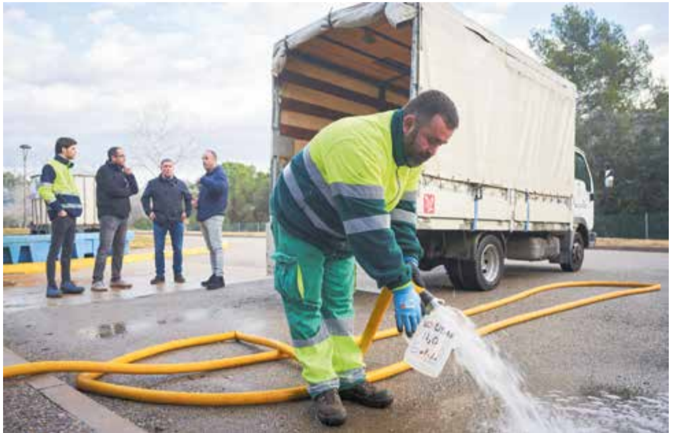
L'Ajuntament de Castellar fa servir aigua regenerada per feines de neteja i reg des del mes de gener.

Com que els embassaments han superat aquest percentatge es poden relaxar les mesures