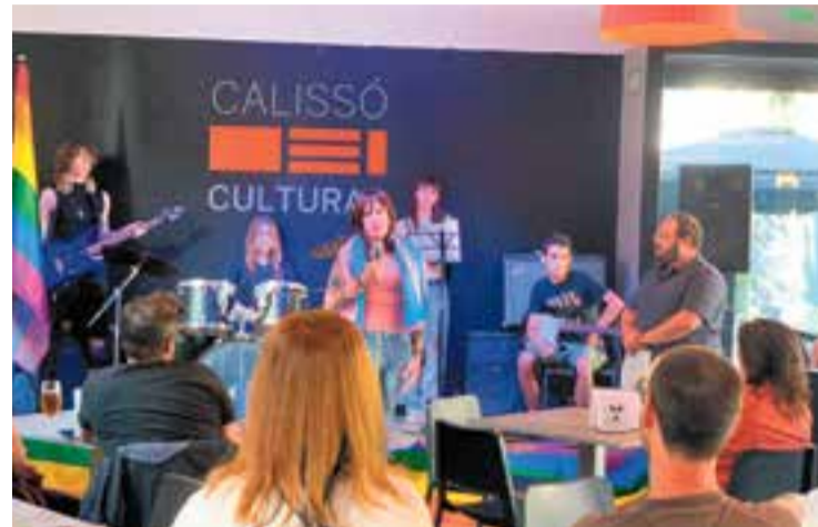
Acte celebrat l'any passat en el Dia contra la LGTBI-fòbia.