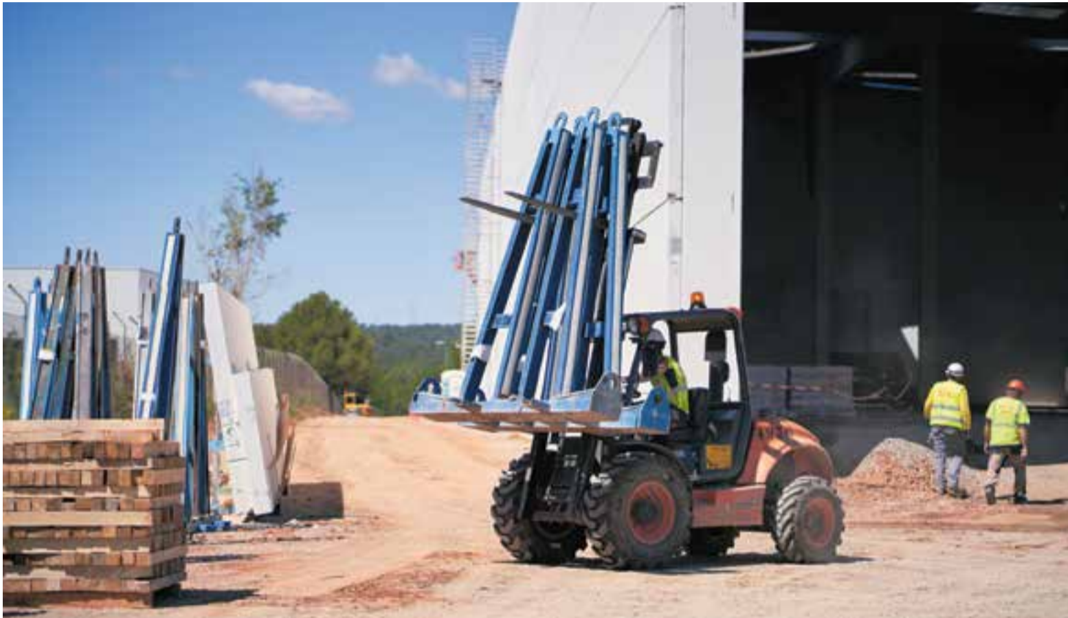
Una imatge de principis d'aquesta setmana d'unes obres de construcció d'unes naus industrials al polígon de la Bruguera.

La vila té la xifra més alta des de fa 15 anys: 6.310 assalariats, als quals s'afegeixen 1.805 autònoms