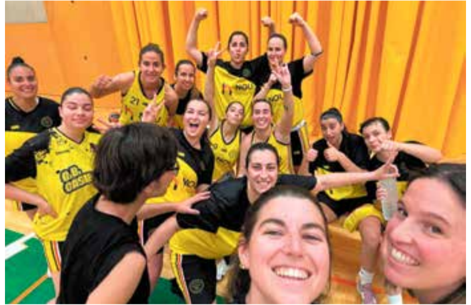
Les jugadores del CB Castellar no van perdre la moral després del partit a Vilassar.

Derrota en el primer match-ball del femení del CB Castellar, que haurà d'ajornar l'ascens de categoria, després de caure per 56-44 contra les seves màximes rivals del CB Vilassar de Mar. El masculí guanya el CB Castellet a dos partits d'acabar la Lliga.