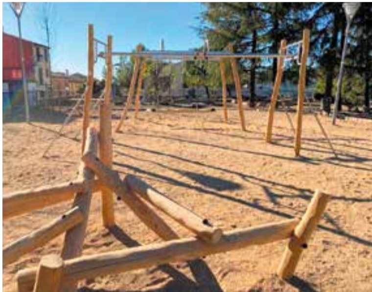
'Donem vida a l'Era d'en Petasques' va ser el projecte més votat l'any 2022.

Un cop hagi finalitzat el termini la comissió d'impuls i gestió dels pressupostos participatius n'estudiarà la viabilitat entre el 8 i el 30 de juny. Les que en resultin seleccionades es faran públiques l'1 de juliol, i durant els mesos de juliol i agost se'n farà difusió. A més, en aquest període també s'enviaran les cartes de votació a la ciutadania, i els promotors de les propostes en faran una presentació virtual. Les propostes preescollides es podran votar de l'1 al 12 de setembre, via web a través d'un sistema d'identitat digital o bé presencialment a El Mirador. Podran votar les persones majors d'11 anys empadronades a Castellar del Vallès.