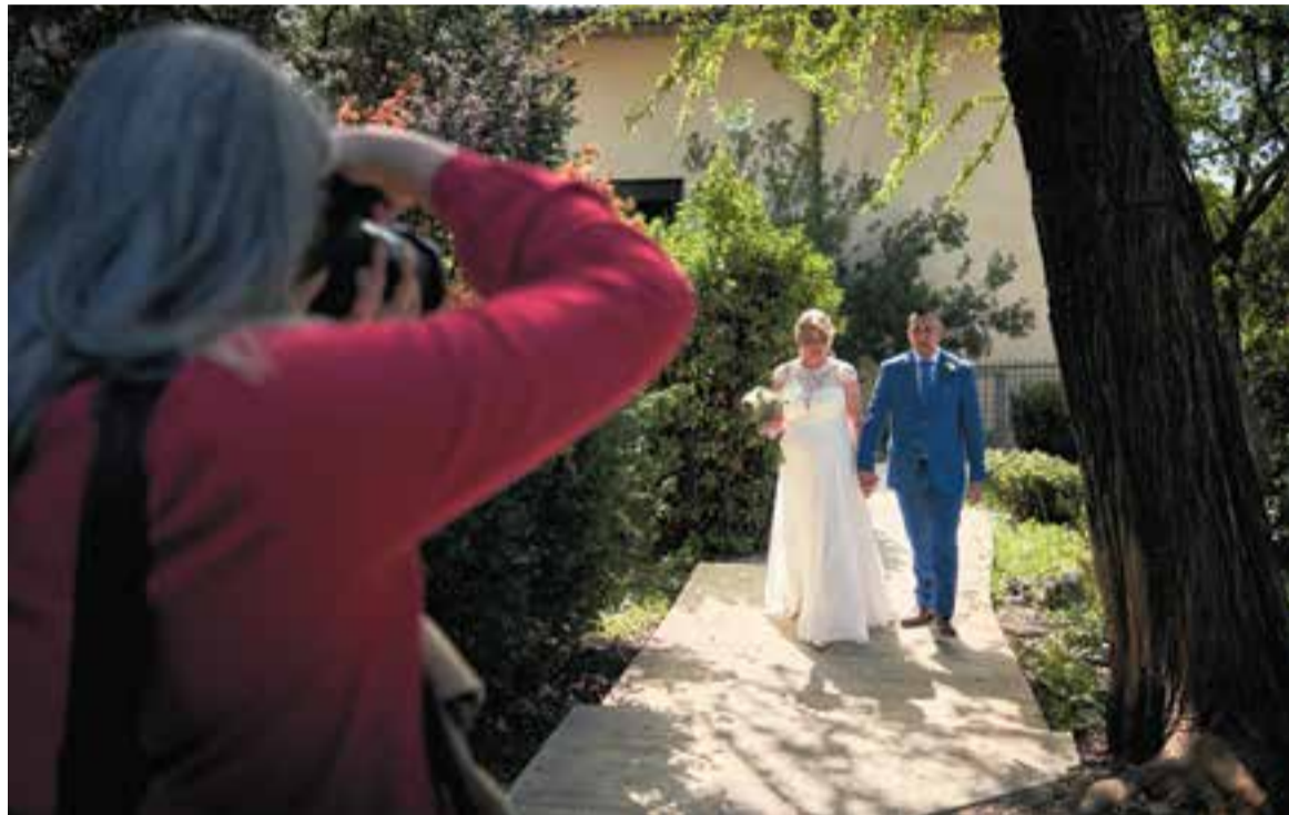
Sessió de fotos d'un casament a Ca l'Alberola, fa uns dies, prèvia a la cerimònia.

En els últims tres anys la tendència és positiva, si bé el 2023 el total de casaments a Castellar van ser 119, onze menys que el 2022, la xifra és superior al total de 2021,