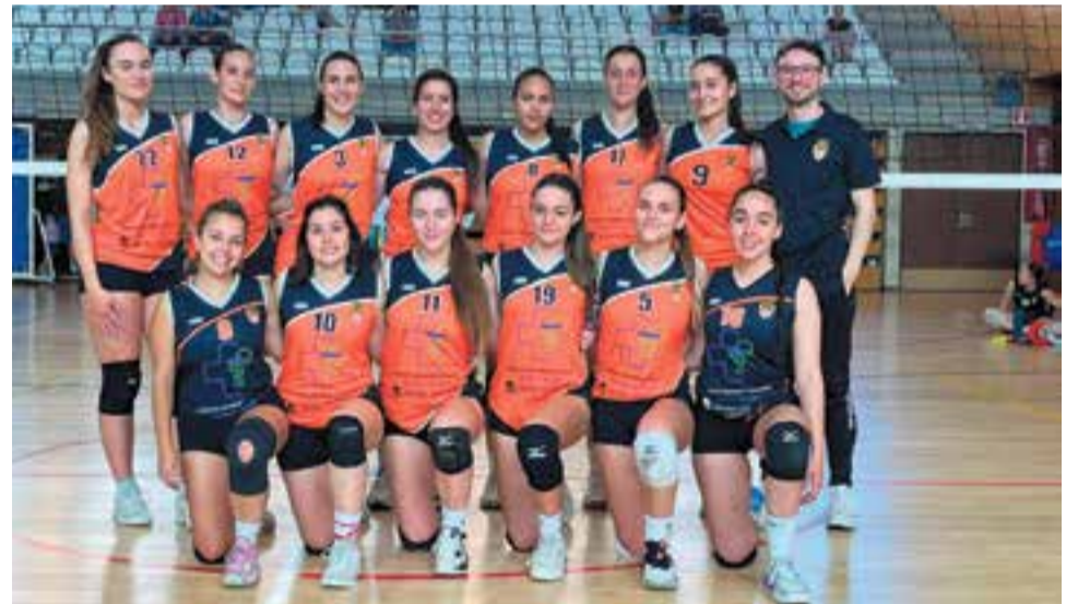
El femení de vòlei, a només una victòria d'aconseguir una nova permanència a 2a Catalana. || CEDIDA

Quan queden dues jornades de posar punt final a la temporada, el conjunt rebrà l'Encamp andorrà (diumenge, 18.00 h, Puigverd), abans de visitar el CN Sabadell, únic rival amb el qual han puntuat en aquesta fase. +|| A. S. A.