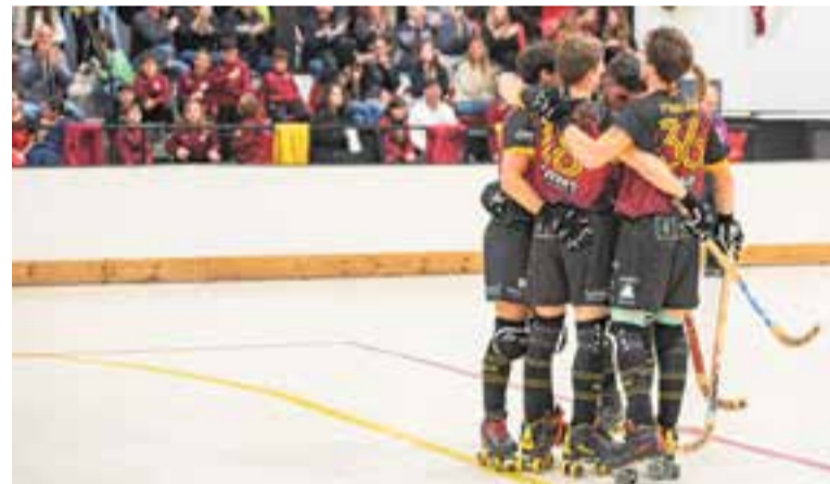
L'HC Castellar continua sumant victòries i ja és equip de promoció. || A. SAN ANDRÉS

Aquesta setmana, el conjunt de Mateo rebrà el CP Sant Ramon (diumenge, 12.15 h, Dani Pedrosa), penúltim classificat que lluita per evitar el descens, mentre que l'equip femení de Quima Jimeno –que va descansar aquesta jornada– també jugarà a casa, contra el CEH Sabadell (dissabte, 18.30 h). † || A. SAN ANDRÉS