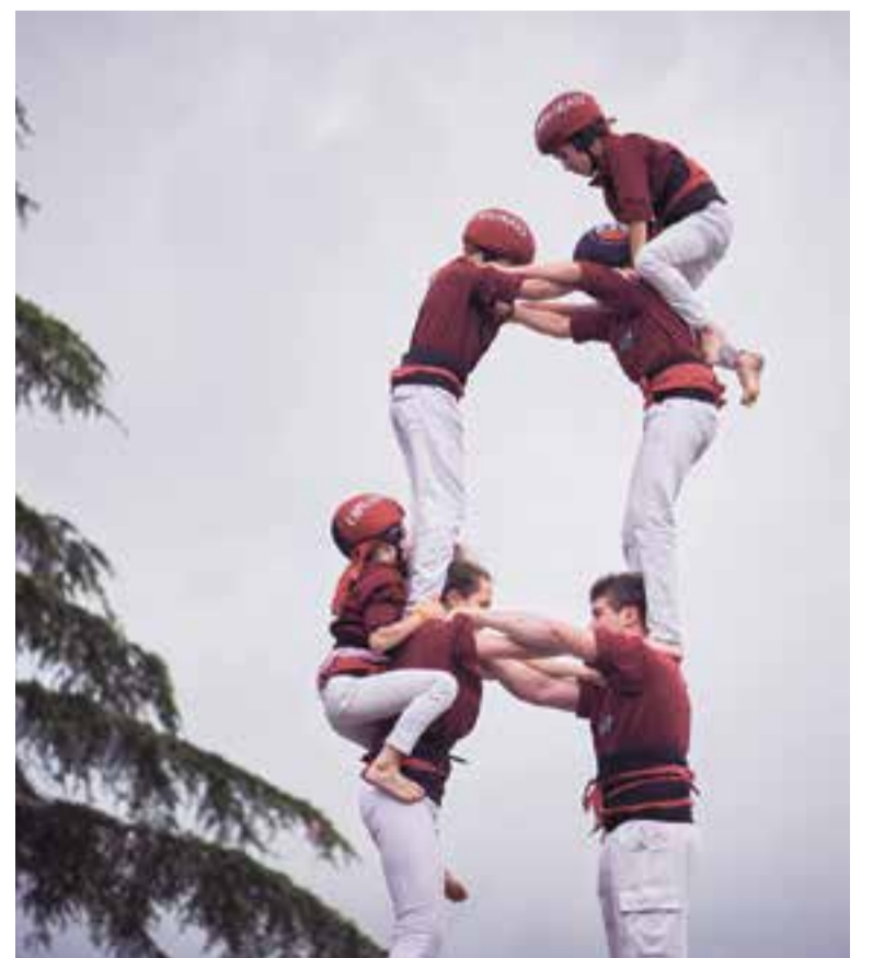
Un castell durant la diada, dissabte a la tarda.

Però un aniversari s'acaba bé si hi ha pastís i espelmes. I en van tenir, els Castellers de Castellar -Capgirats? I tant, i amb focs artificials i tot! ➔