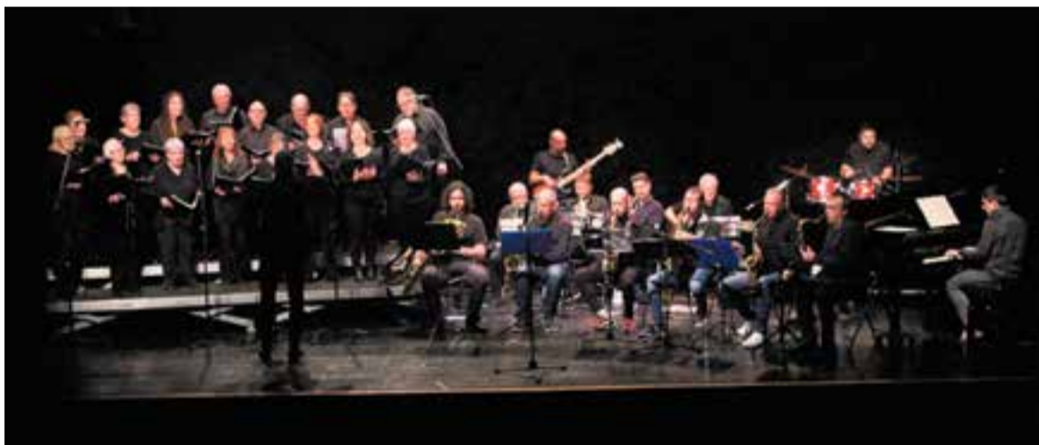
La Coral Bell Ressò i la Big Band durant el concert a l'Auditori Municipal, el 25 d'abril.