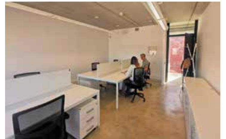
Aquest és l'espai de cotreball al Centre de Serveis.