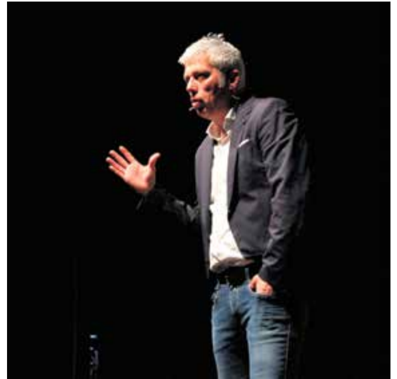
El periodista Albert Om durant la conferència a l'Auditori.

“ Quan descobrim algú a través de la tele sembla que surti un bolet, i abans hi ha hagut tot un procés ”, va dir Om abans d'explicar la seva experiència a la televisió i concloure que la seva feina “ no és un esprint, aquesta feina és una cursa de fons ”. +