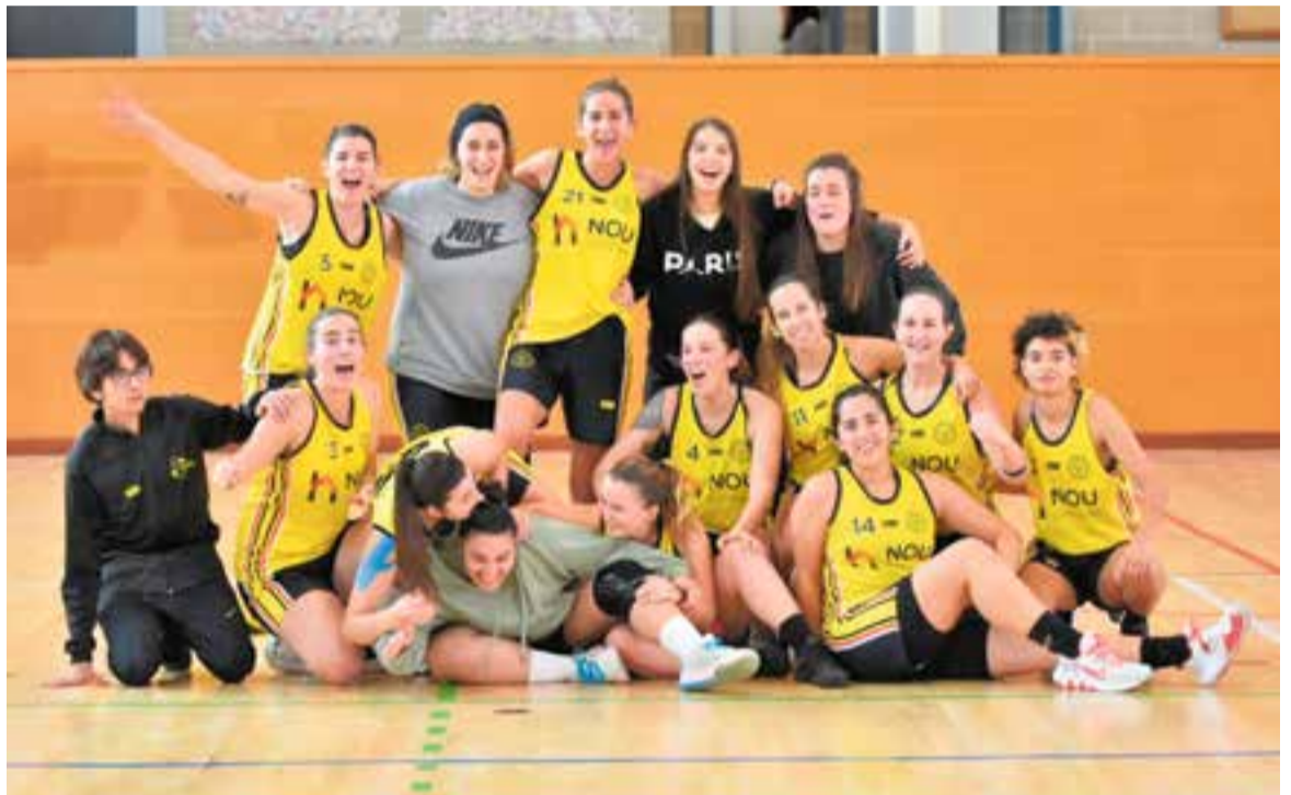
El pavelló Puigverd va viure dues victòries consecutives en Lliga de l'equip femení. || CEDIDA

L'equip té dues jornades per aconseguir l'ascens directe, però en cas de no fer-ho, encara podria assolir el repte si es classifica per a la Final4 de la categoria, en què hauria de superar un partit de prèvia contra els primers o segons classificats dels altres grups. +|| A. SAN ANDRÉS