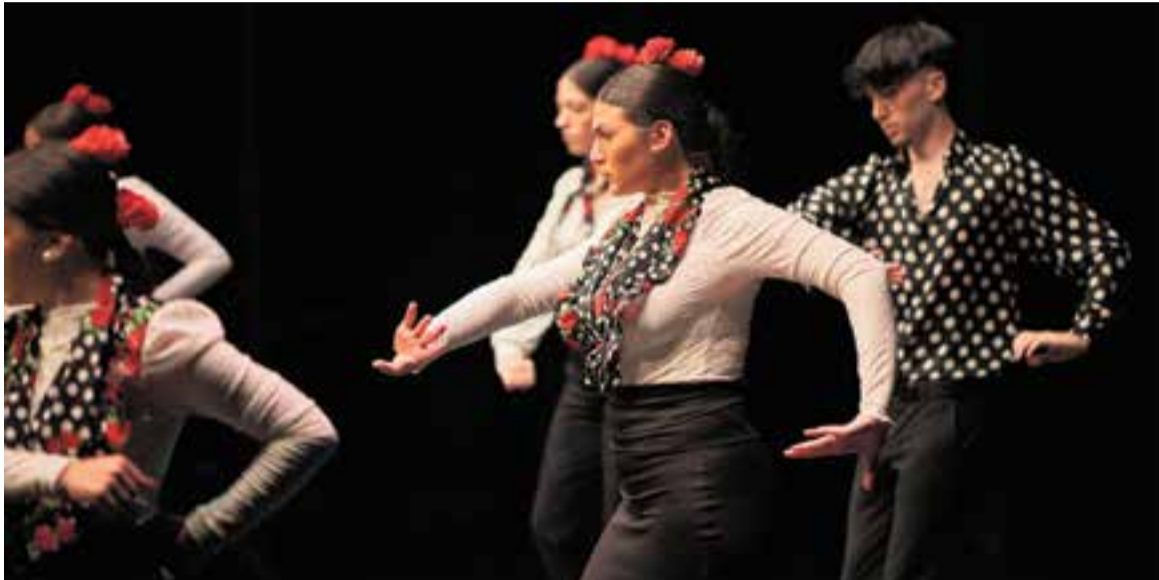
Celebració del Dia Internacional de la Dansa a l'Auditori. A la imatge, el grup Casa de Andalucía interpretant un tango.

L'Auditori Municipal Miquel Pont va acollir la celebració del Dia Internacional de la Dansa amb un gala de dansa que va tenir lloc dissabte a la tarda. Organitzada per l'associació Zona Dansa, diversos ballarins d'escoles i de disciplines diferents van mostrar el seu mestratge sobre l'escenari.