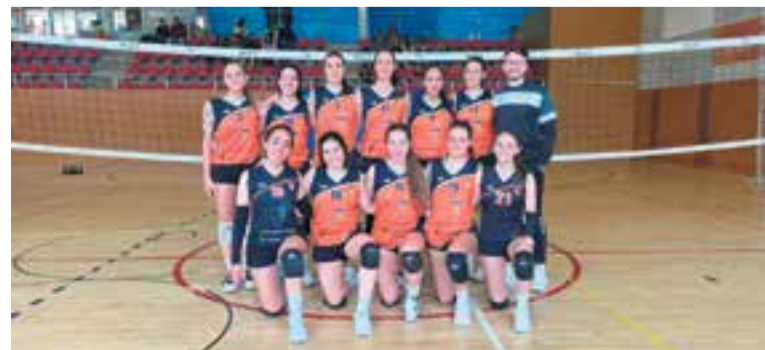
Les jugadores de l'FS Castellar que van disputar el partit contra el Bordils.