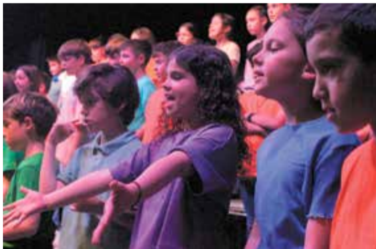
El projecte 'Cantem' fomenta el treball en equip i l'amor per la música. || C. D.

mílies que van omplir les butaques de l'auditori amb la il·lusió i l'expectació que regalen les primeres vegades. "És el primer dia que cantem tots junts, és un treball de curs que es fa a les aules per separat. El dia del 'Cantem' es troben, fem un assaig d'una hora sense públic i després fem el concert amb les famílies. Les nenes i els nens estan molt emocionats, amb els nervis a flor de pell, els hi encanta, es nota que se saben les cançons i que volen gaudir amb la seva família de la música", va concloure una coordinadora també emocionada per la feina feta amb els alumnes i la resta de companys. +