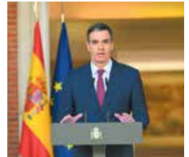
Sánchez, dilluns a la Moncloa.