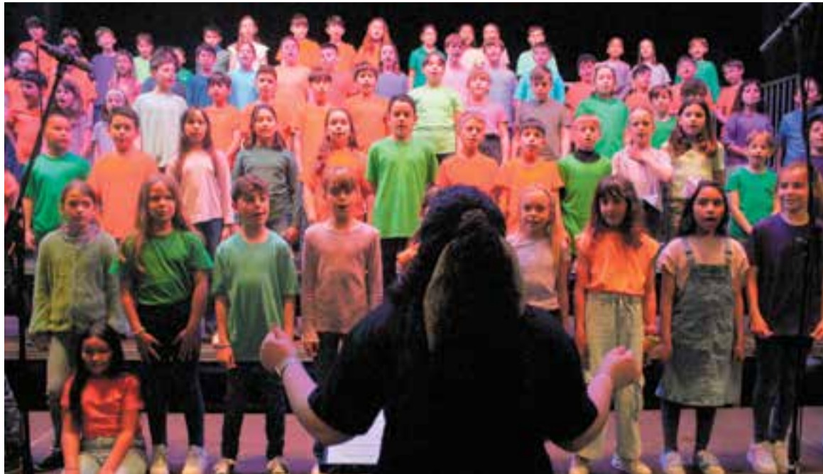
Més de 200 infants es van reunir per cantar plegats -per primera vegada- a l'Auditori Municipal Miquel Pont.