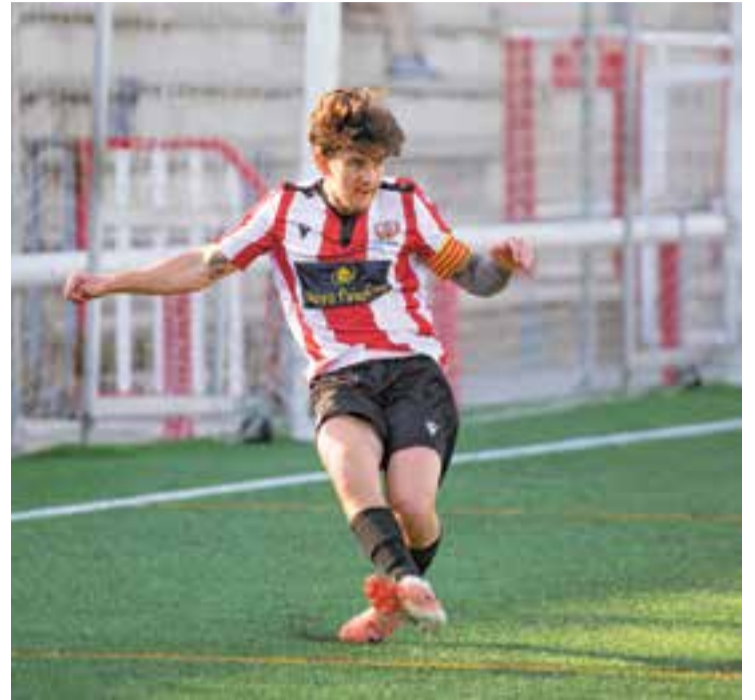
El Castellar acumula 2 jornades sense guanyar, després de caure per 1-2 a casa. || A. S. A.