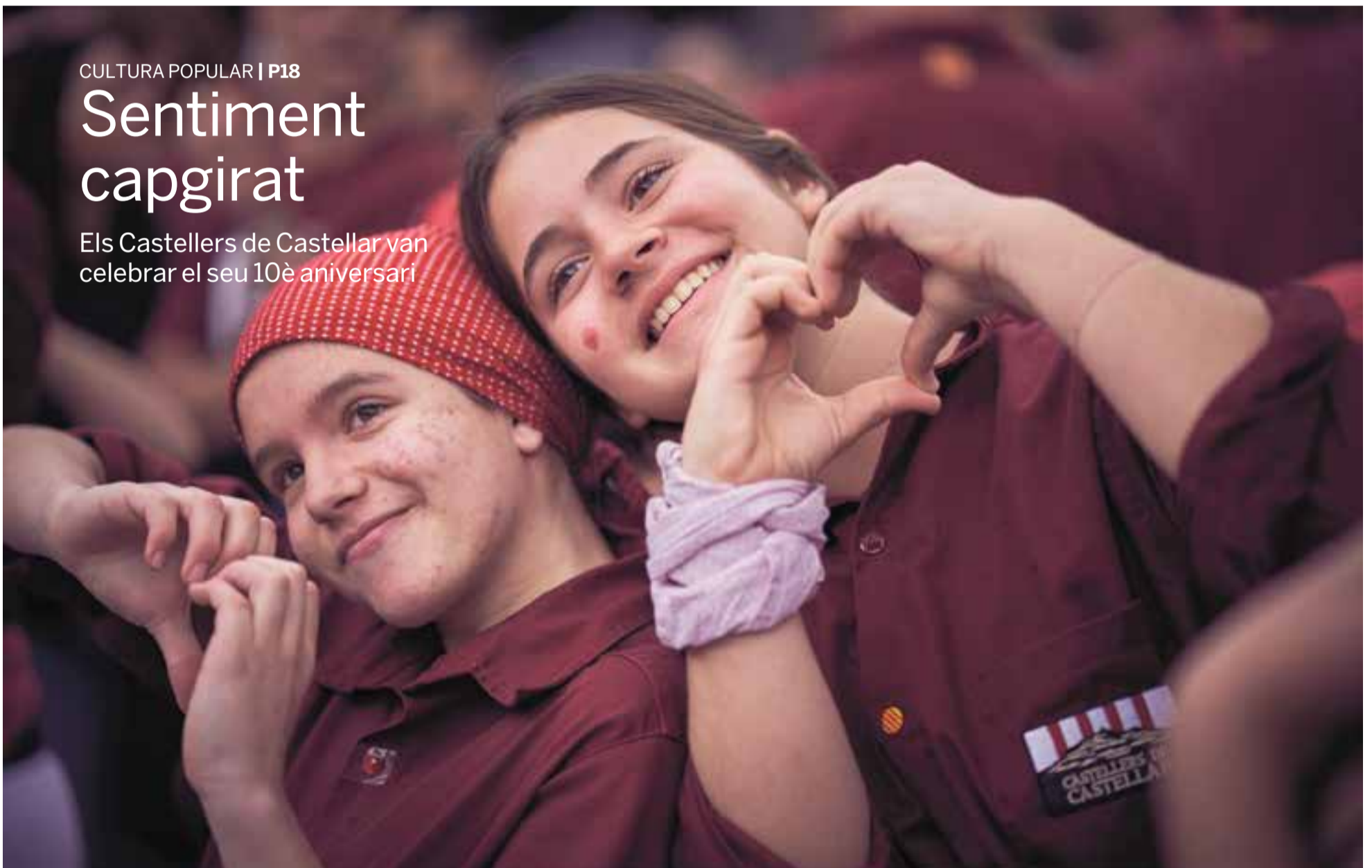
Dues noies dels Castellers de Castellar dibuixen un cor amb les mans durant la celebració de la diada de la colla capgirada dissabte passat.

Els Castellers de Castellar van celebrar el seu 10è aniversari