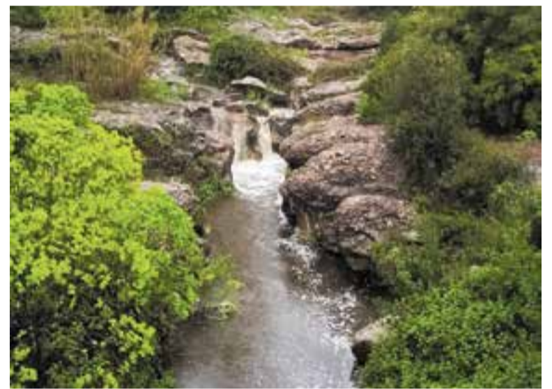
Aigua abundant a dos indrets del riu Ripoll després de les pluges de dilluns.