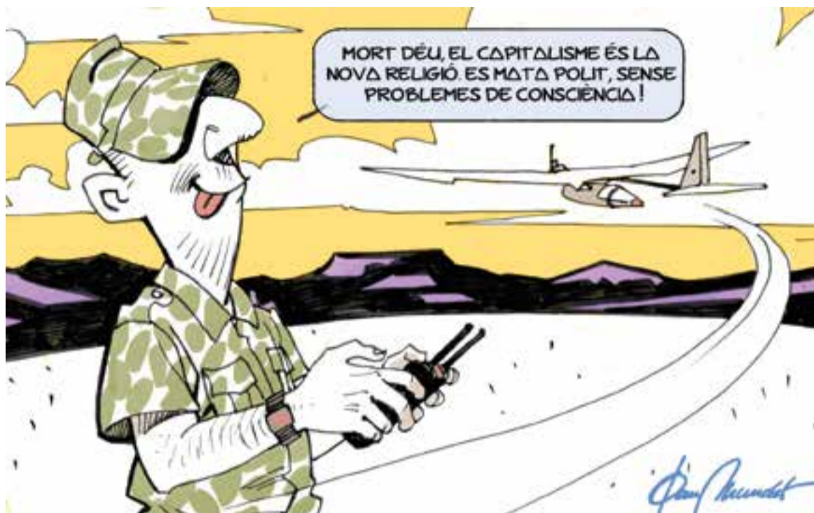
© Modern War. || JOAN MUNDET

“Hi ha un fet irrefutable: la guerra sempre acaba alimentant les mateixes butxaques”