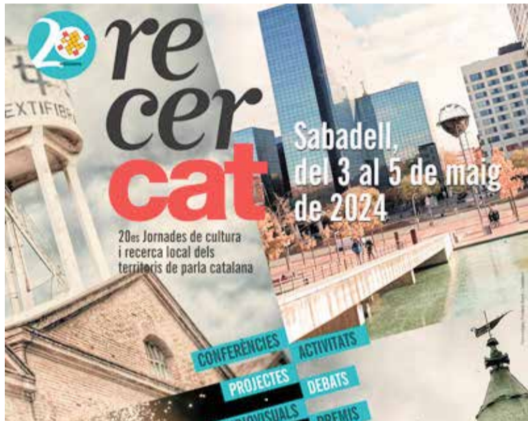
Imatge promocional del RECERCAT 2024, que enguany celebra 20 anys.

L'esdeveniment tindrà lloc al cor de Sabadell els dies 3, 4 i 5 de maig