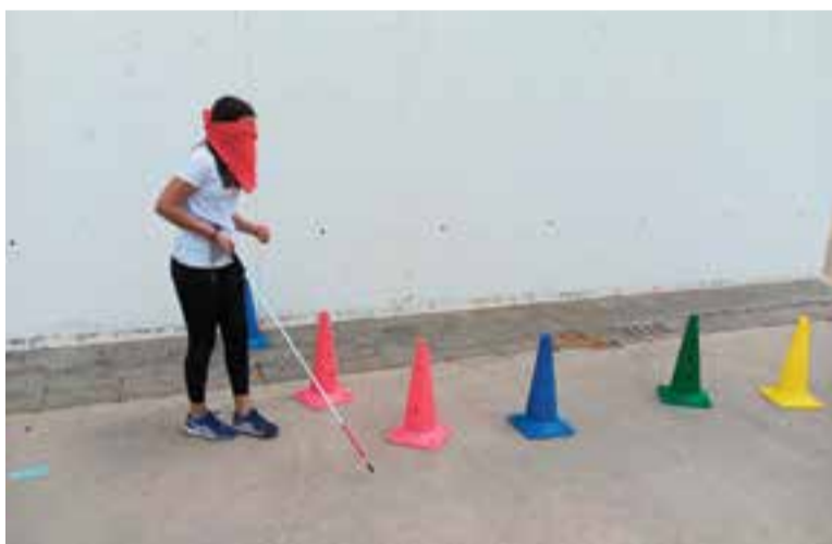
Una alumna amb els ulls embenats fa un circuit provista d'un bastó.