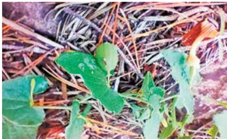
Flor de l'herba de la carabasseta que es troba al Puig de la Creu. || M. B.

El Banc de Dades de Biodiversitat ( http://biodiver.bio.ub.es ) recull