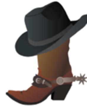
Amics del Ball de Saló