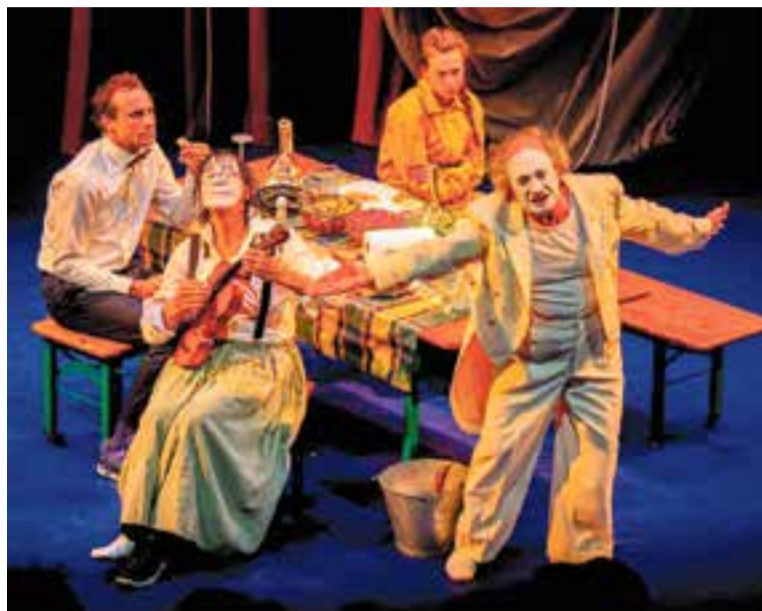
La família Pla-Solina protagonitza 'Travy', una obra que es podrà veure dissabte.

Travy posa sobre la taula dos corrents teatrals que ajuden el públic a reflexionar-hi: d'una banda, el clown, el teatre folklòric i popular. I de l'altra, les formes postdramàtiques i metateatrals, i exposa dues generacions i dos moments vitals: els dels qui ja veuen el final del camí sense por, i el dels qui en veuen el