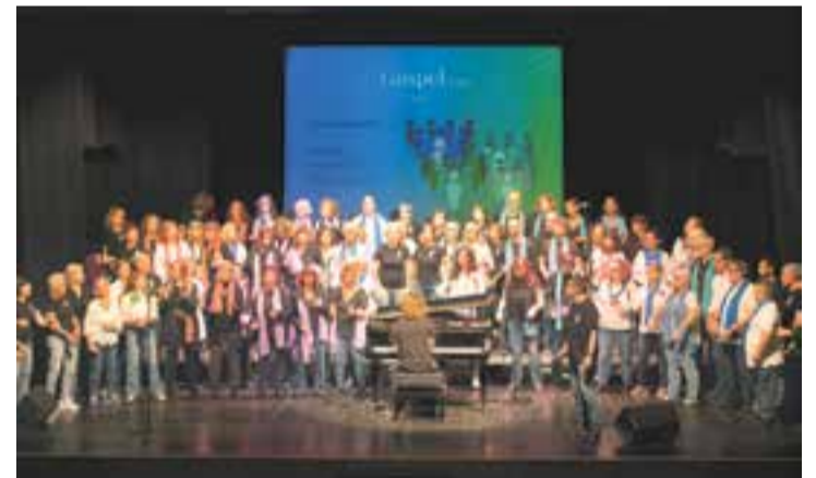
Cantada conjunta dels cors Sentits, Clot i Di-versions a l'Auditori. || LL. MARTÍ

Per cloure el concert, les corals van interpretar conjuntament tres peces de gòspel. Van agradar tant i els aplaudiments del públic van ser tan persistents que els cors els van regalar un bis, interpretant conjuntament el tema de gòspel Total Praise . || M. ANTÚNEZ