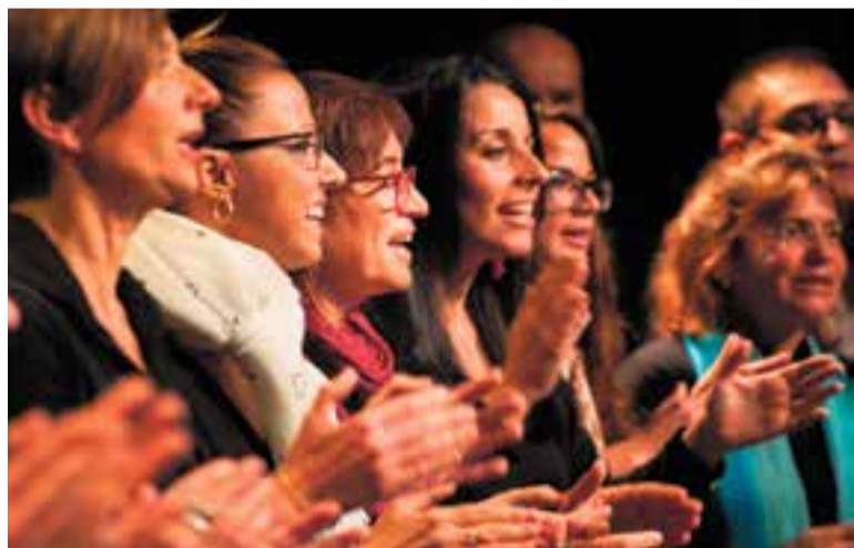
Moment d'un dels concerts de gòspel del Cor Di-Versions, a l'Auditori Municipal.

La llegenda explica que la fera va intentar volar cap al Puig de la Creu, encara que finalment va caure al Sot d'en Goleres. Els cavallers del comte van anar a buscar el cos per; un cop esbudellat i ple de palla, passejar-lo en mig de festa grossa per tots els pobles de Catalunya. Així els vilatans podien comprovar que la Víbria ja no els tornaria a fer mal mai més. Aquest va ser l'instant final de l'espectacle, amb espectadors, actors i diables units en una dansa davant d'una Víbria sense foc i envoltada de palla. †