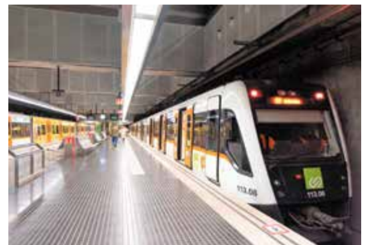
Sabadell Parc del Nord, darrera parada de la línia que podria perllongar-se.