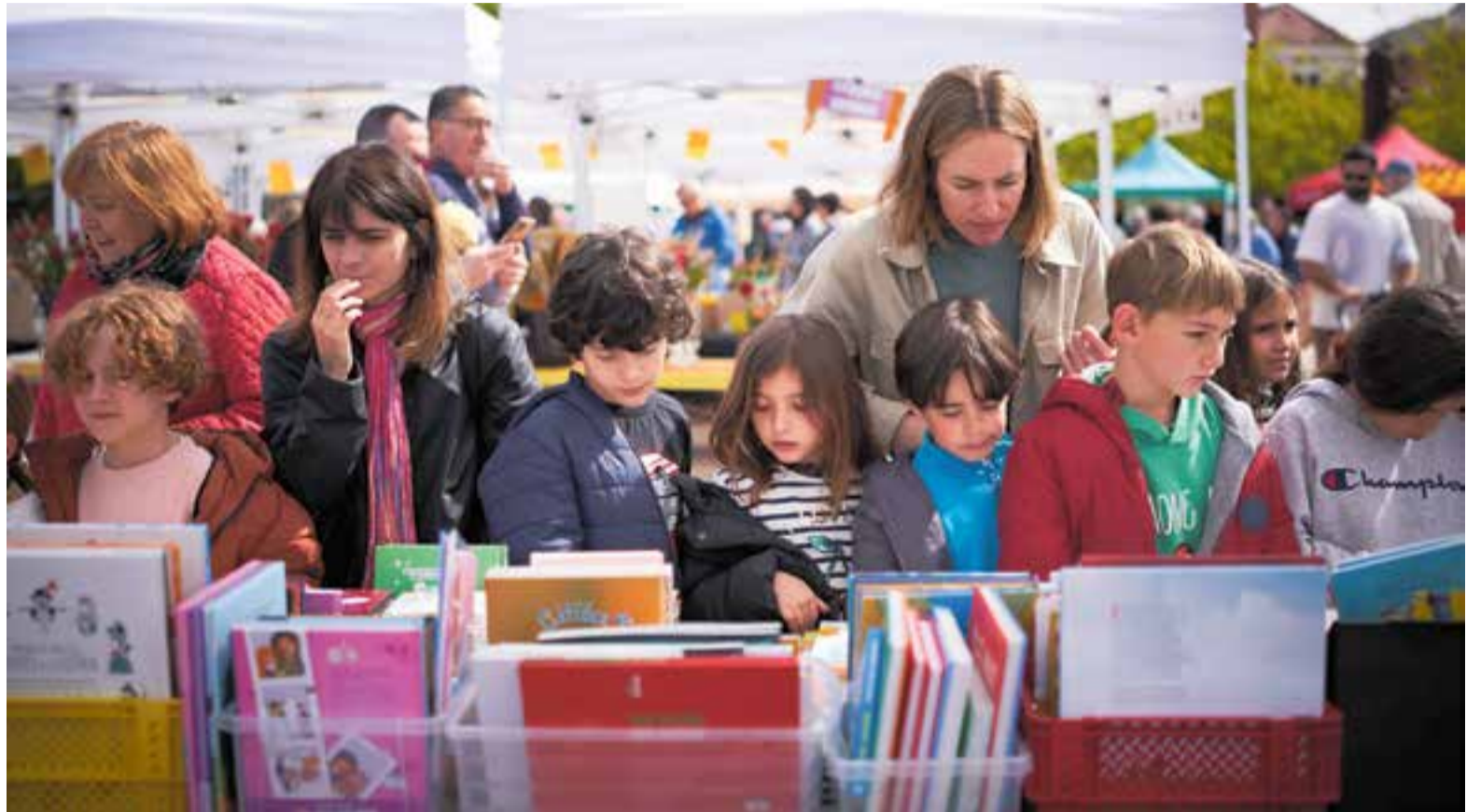
Els llibreters de Castellar comencen a preparar la diada de Sant Jordi al gener, seleccionant els títols que millor poden encaixar a la seva parada.