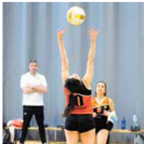
Un punt d'or per la permanència.