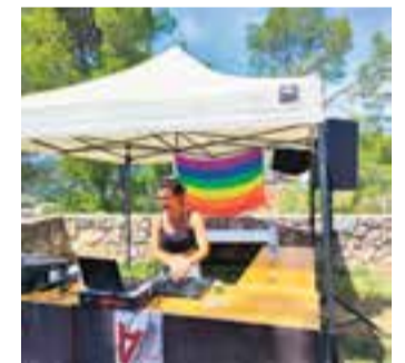
Vermut al parc de Canyelles.

En aquest vermut també hi haurà una zona comercial i furgoteques, a més, també hi col·labora l'Esbart Teatral de Castellar. Vilabarrakes és una associació juvenil de Castellar del Vallès que programa, al llarg de l'any, diverses activitats lúdiques i culturals dirigides especialment als joves. Els vermuts electrònics van ser una proposta que ja l'any passat van aconseguir gran èxit de públic i que es van portar a terme sobretot al parc de Canyelles. + || M. A.