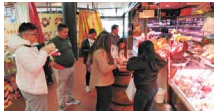
Els alumnes participant en la gimcana la setmana passada al mercat. || AJUNTAMENT

Els alumnes del curs de català bàsic B2 van participar la setmana passada en la campanya A l'abril cada paraula val per mil . En el marc de la sortida, van visitar alguns comerços propers a El Mirador, van resoldre el significat d'algunes frases fetes, van omplir butlletes i, fins i tot, van gaudir d'un petit tast. A la gimcana lingüística, si es respon l'endevinalla que es trobarà en els cartells dels establiments que col·laboren en la campanya es podrà guanyar un dels tres premis de 50 euros en vals de compra que se sortejaran. Aquesta campanya està organitzada pel Servei Local de Català (SLC) de Castellar del Vallès, Comerç Castellar i l'Ajuntament. Prop d'una cinquantena de comerços castellers prenen part a la campanya, que s'acaba el 29 d'abril. L'objectiu és conscienciar de la riquesa que representen totes les llengües i difondre el lèxic català, a més d'implicar el comerç en projectes relacionats amb la llengua catalana. → || REDACCIÓ