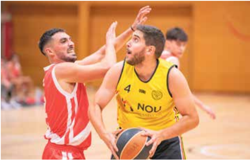
El CB Castellar ja és oficialment equip de Segona Catalana.

El CB Castellar confirma el descens a Segona Catalana de manera matemàtica, després de caure per 82-90 contra el Sant Jordi Blau de Rubí. Aquest és el segon descens consecutiu, després d'haver perdut la categoria de Copa Catalunya la temporada passada. L'equip femení va guanyar i manté el segon lloc de la taula.