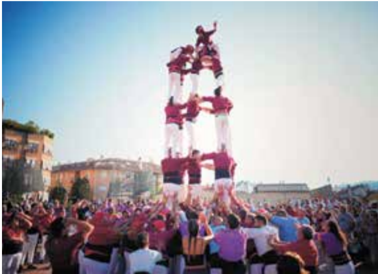
Actuació dels Capgirats en la Diada Castellera de la Festa Major 2023

La plaça de la Fàbrica Nova i la d'El Mirador, els espais de la celebració