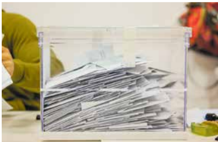
Una urna en un col·legi electoral de Castellar en unes eleccions passades.

A la demarcació de Barcelona s'hi presenten 16 formacions, de les quals vuit tenen actualment representació. Del total de diputats de la cambra, 135, des de la demarcació de Barcelona se n'escullen un total de 85. ✦ || REDACCIÓ