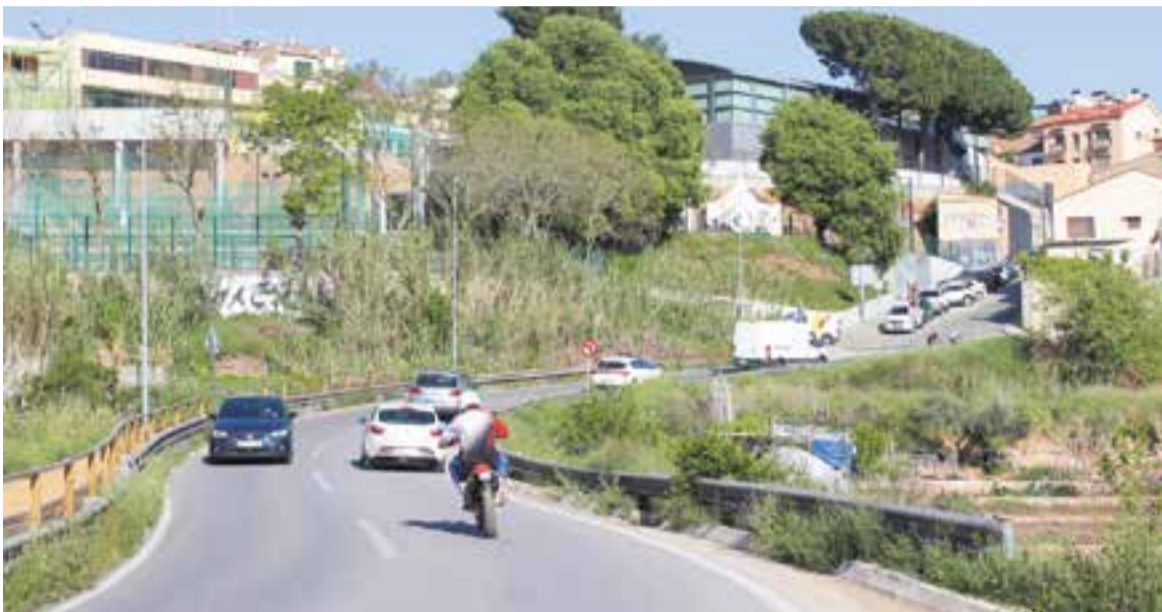
Un tram de la carretera B-124 que serà remodelat, al fons les pistes de tennis

L'actuació costarà 4 milions per a un tram de prop de 12 quilòmetres