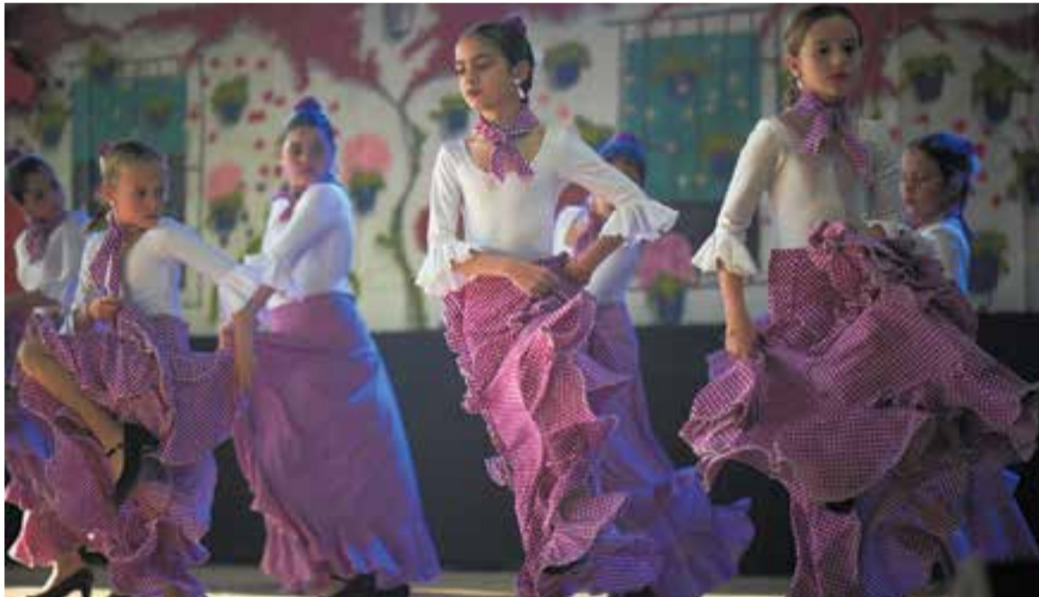
Actuació de les integrants d'un dels cossos de ball d'Aires Rocieros Castellarencs dissabte a la tarda.

Aires Rocieros culmina la seva Feria de Abril, 1a al calendari de les entitats andaluses federades