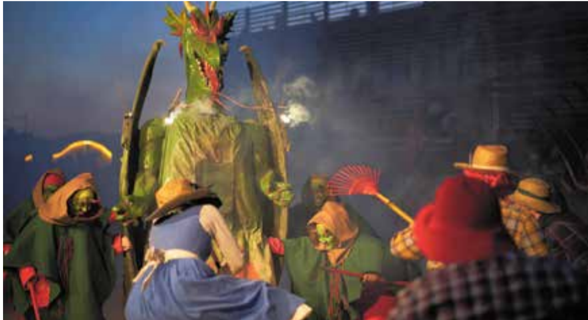
L'enfrontament entre la Víbria i els vilatans a la plaça d'El Mirador dissabte passat.

La festa va començar a l'Era d'en Petasques, on diversos actors i actrius feien de vilatans. Aquesta corrua de vilatans, acompanyats de la Víbria i els integrants de l'exèrcit de la creu i el de la mitja lluna, van anar baixant pels carrers del nucli antic. Un cop a la plaça, començava la narració de la història de la Víbria, estructurada en vuit actes. Pep Martí anava introduint cada passatge. La història començava narrant un enfrontament entre els