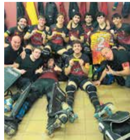
Nova golejada de l'HC Castellar.

L'HC Castellar va resoldre amb fluïdesa la seva visita al CP Monjos amb un contundent 0-4, que deixa tot com estava. El Bell-lloc no va fallar a Vilanova, on va guanyar 2-4, i el Barberà tampoc afluixa amb un 2-3 contra el Noia.