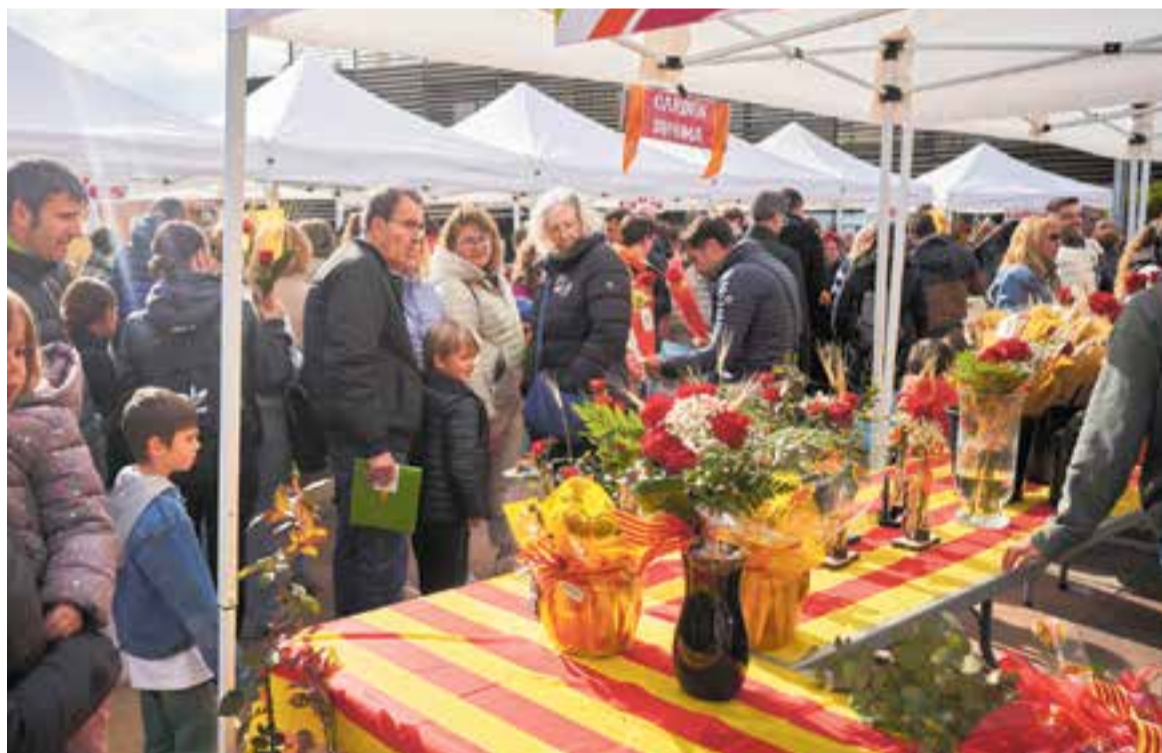
La rosa vermella continua sent la protagonista de la diada de Sant Jordi, i la més venuda a totes les parades de flors.

"Els castellarencs no només venen a la biblioteca, sinó que també compren llibres"