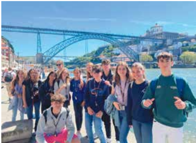
Els estudiants participants en l'intercanvi davant del pont de Luíís I, de Porto.

En tercer lloc el coneixement cultural, per l'exposició directa a la cultura d'acollida, la seva història, tradicions i entorn natural, i també per la interacció amb la família acollidora i altres persones locals, ampliant la perspectiva social i cultu-