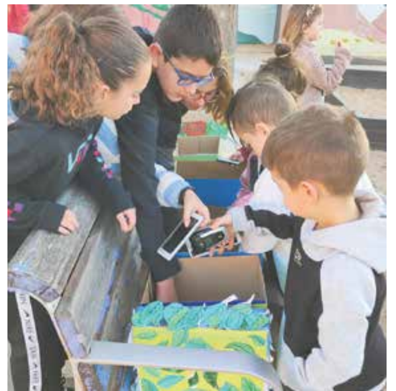
Els alumnes posen en capes els mòbils en desús recollits durant la campanya.

Gràcies al projecte global Mobilitza't per la selva , de l'Institut Jane Goodall, ja s'han recollit 160.000 mòbils en desús, i és que les xifres són aclaparadores. A Espanya avui dia es comptabilitzen més de 50 milions de telèfons mòbils. A aquest nombre de terminals han d'agregar-se aquells mòbils més antics que són reemplaçats i que els ciutadans guarden o llencen a les escombraries, de manera que la taxa de reciclatge de menys del 10%. A nivell global, hi ha més de 7.000 milions de mòbils en ús, la qual cosa provoca una gran demanda de minerals clau per fabricar-los. ✦