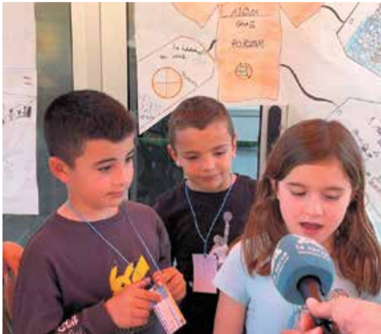
Els alumnes van muntar diverses parades al voltant de l'aigua. || A. T.

La tercera i última part de la fira va consistir en l'exposició per