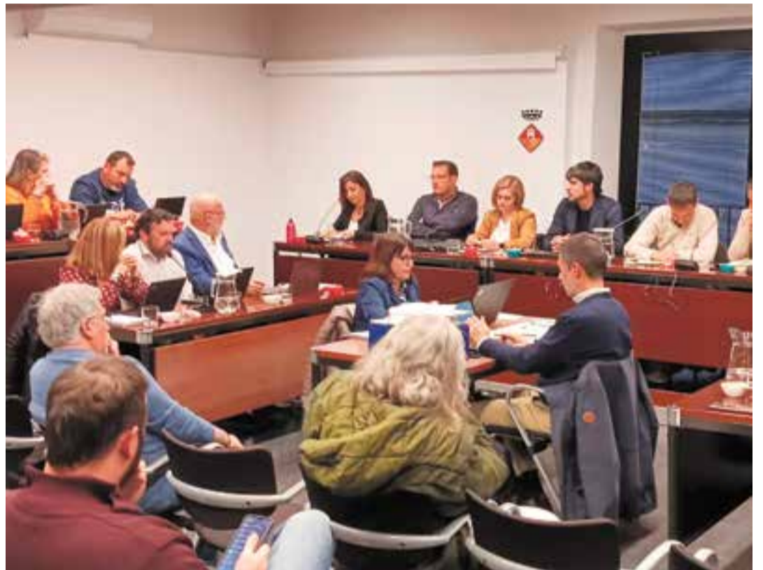
Un moment de la sessió plenària de març, celebrada dimarts passat, durant la discussió del Pla d'Igualtat.