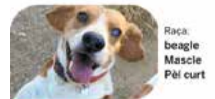
BOBBY En adopció des de febrer de 2024