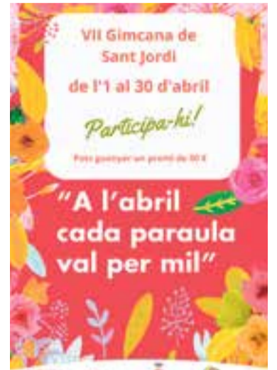
Imatge de la gimcana. || AJUNTAMENT

Aquest és el llistat dels comerços participants: Herois, 7 Stars, Andreví, Carnisseria Casé, Centre Auditiu Castellà del Vallès, Disscopi, Dtalle, Escola de Música Artcàdia, Farmàcia Europa, Floristeries Duran, Idiomes Castellà, Joguines Stop, La botiga del Castell, Luque & Luque Sabaters, Marcel Canudas, Mariana Bakery, Midudu, Mima't Vallès, Mixos and Quissos, My Natural Baby Box, Optimón Òptics Parafarmàcia Nut, Peluqueria