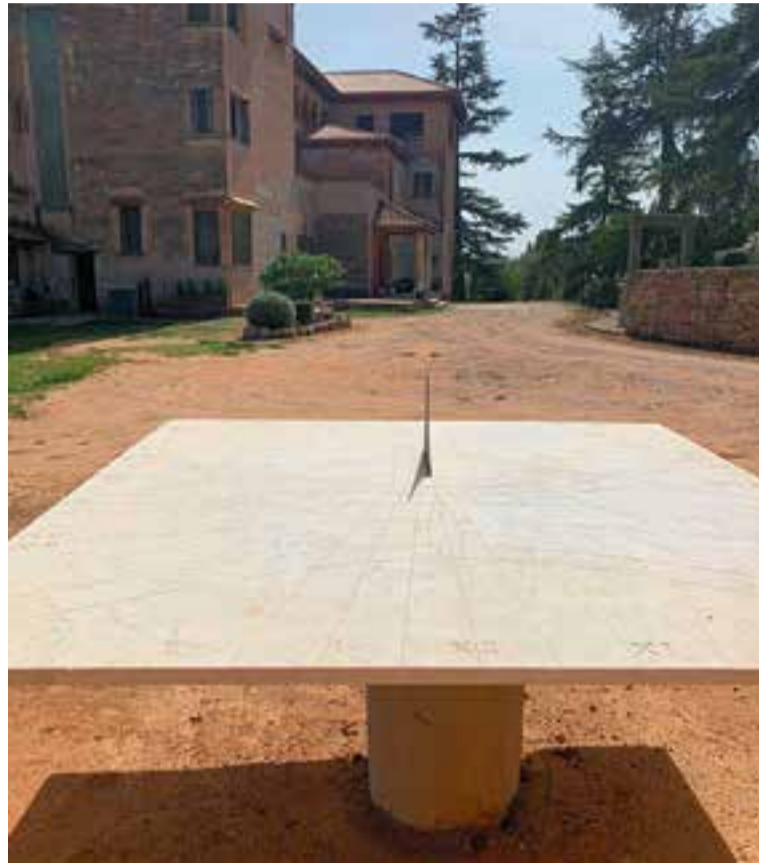
El rellotge de sol està situat davant de Can Pèlachs. Al fons, el Ranxo dels Tolrà.