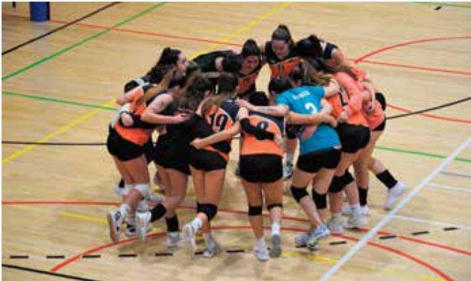
L'equip femení vol aconseguir una bona renda per lligar la permanència a 2a Catalana.

Immerses en la lluita per la salvació, el sènior femení rebrà aquest dissabte a la pista 3 del Puigverd (20.00 h) el CV Sant Fruitós, mentre que el masculí s'enfrontarà a l'SD Espanyol poc després (21.15 h) a la pista 2.