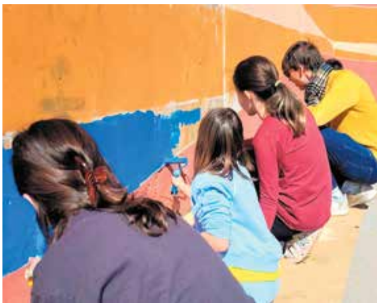
Alumnes i pares van col·laborar pintant el mural de la pista poliesportiva.