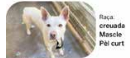
ALFIE En adopció des de desembre de 2023