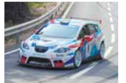
Xavi de la Vega retorna al català de muntanya amb una victòria en Classe 3.