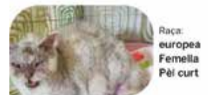
JOYCE En adopció des de febrer de 2024

Més animals per adoptar a: www.facebook.com/adoptamcastellar