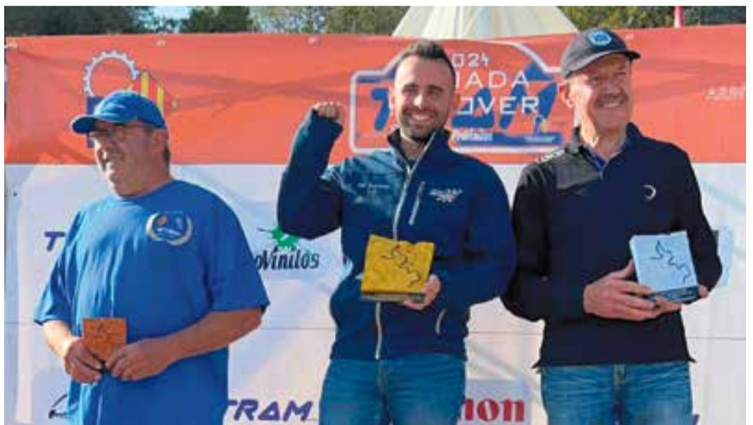
A dalt, el castellarenc sobre l'asfalt d'Alcover. A sota, al podi de la Classe 3.