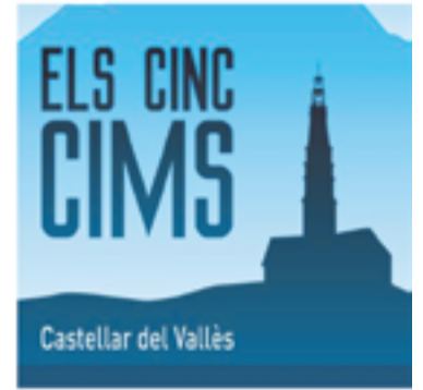
Centre Excursionista de Castellar

+ INFO: www.castellarvalles.cat/judiciainseductor