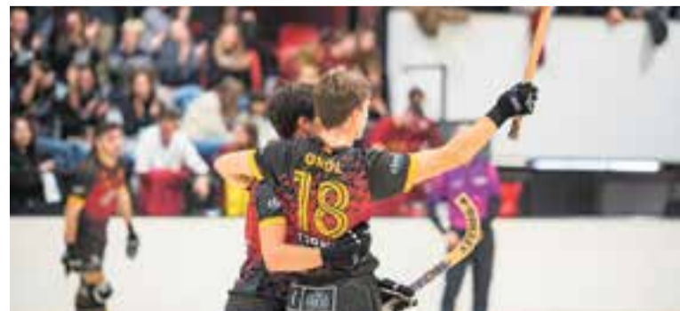
La victòria és obligatòria contra l'Horta (diumenge, 12.20 h). || A. SAN ANDRÉS

Amb una trajectòria pràcticament impecable, el Castellar continua sent el segon millor atac de la categoria, només dos gols per sota del Lloret del grup A, però amb l'assignatura pendent de la defensa, en què és el pitjor d'entre els cinc primers dels dos grups de Primera Catalana. † || A. S. A.