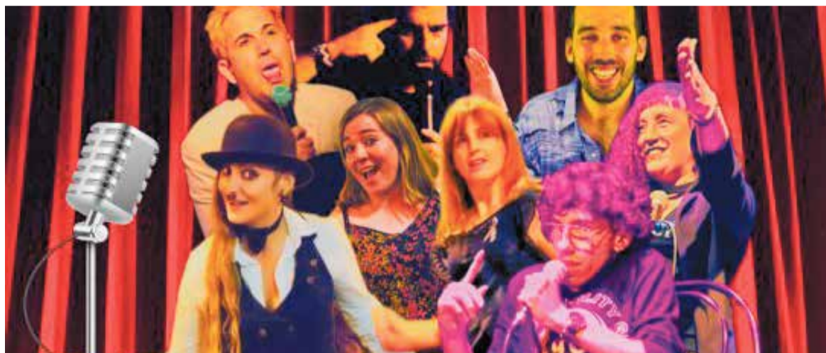
Fragment de la imatge promocional de 'Perfectamente im-perfectos'.

L'espectacle es farà el dia 9 amb motiu del Dia Mundial del Parkinson