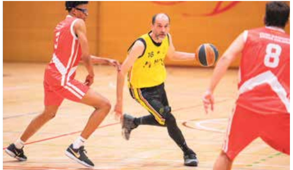
Partit vital per al CB Castellar per a la permanència (diumenge, 19.30 h al Puigverd). || A. SAN ANDRÉS

Aquest cap de setmana el CB Castellar s'enfronta a una jornada clau per poder assolir la permanència a Primera Catalana. El Sant Andreu Natzarret és un rival directe al qual poden igualar i superar en la classificació.