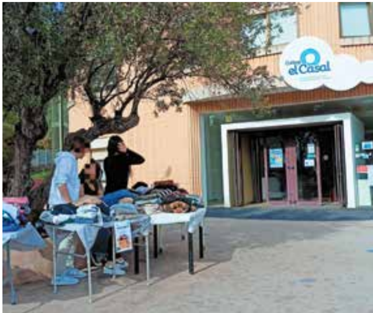
Acció d'intercanvi i reaprofitament de roba a l'escola El Casal.