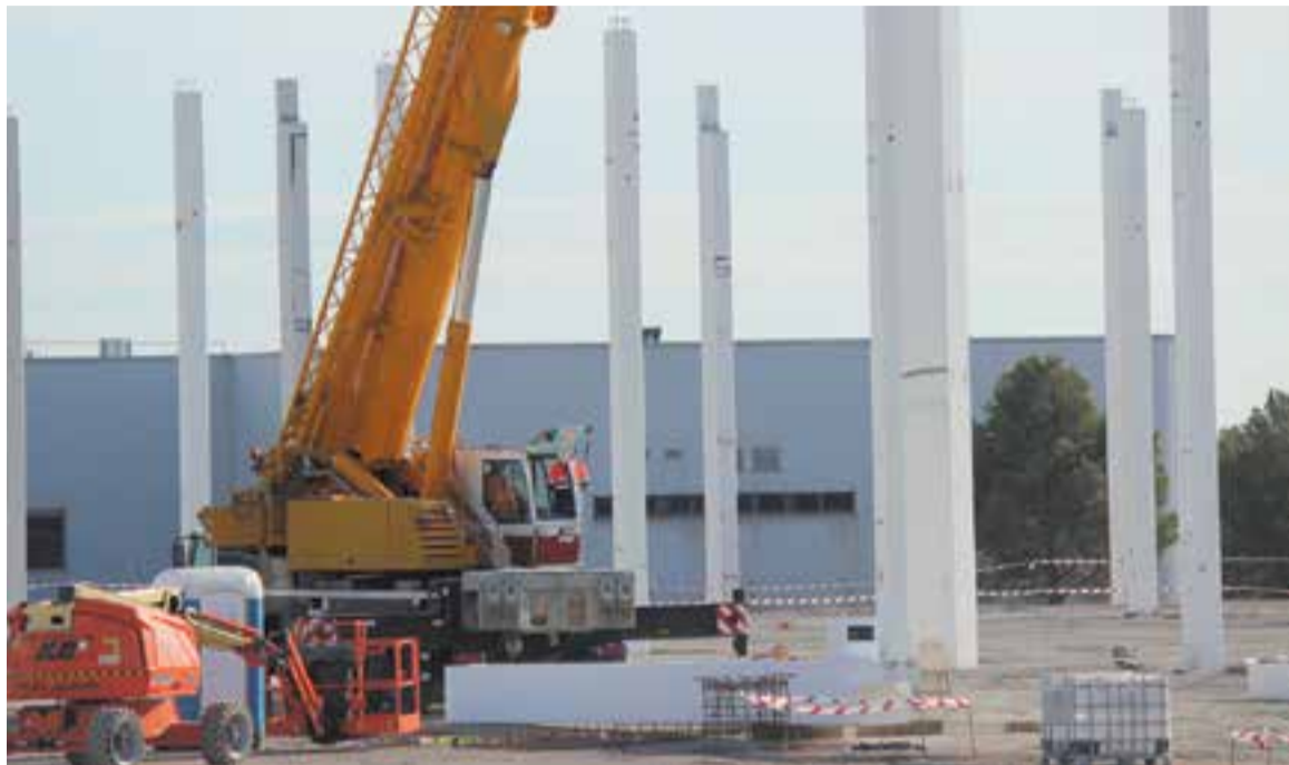
Operaris treballant en la construcció d'una nau al polígon del Pla de la Bruguera a principis del mes de març.

una població com Santa Perpètua de Mogoda, que té unes dimensions semblants a la nostra vila, al voltant d'uns 25.000 habitants, la taxa d'atur registral en aquella població valle-