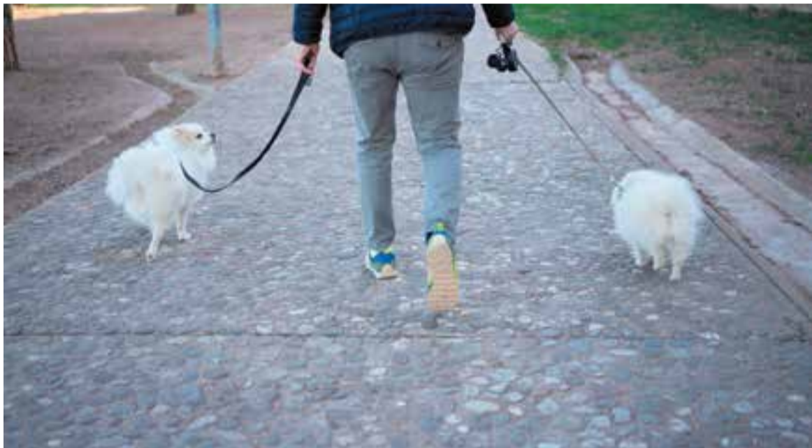
Un propietari passeja els seus dos gossos en un parc de Castellà del Vallès.

S'han aixecat 28 actes per gossos escapolits, no censats o sense xip