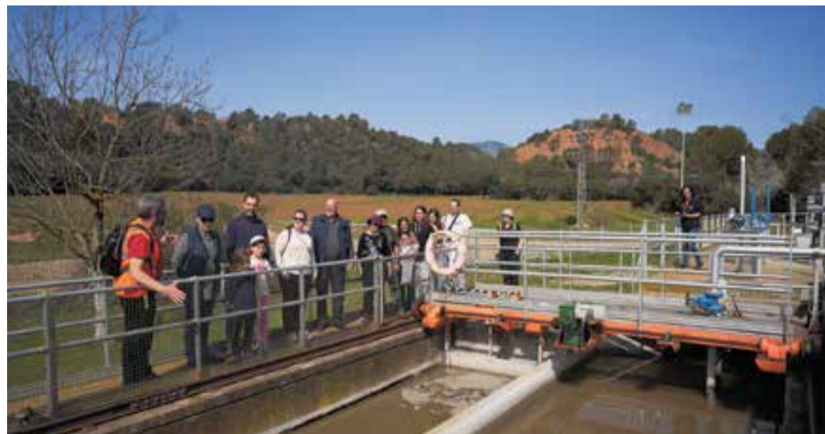
Els assistents van conèixer de primera mà quin és el procés que segueix l'aigua a l'Estació Depuradora d'Aigües Residuals.

L'estació depuradora d'aigües residuals de Castellar recull les aigües residuals urbanes i les industrials, només de Castellar, el que suposa uns 4 milions de litres de mitjana cada dia. "La funció de la depuradora és eliminar la matèria orgànica d'aquestes aigües residuals, eliminar nutrients com el nitrogen i el fòsfor, i gestionar, després, els residus generats a conseqüèn-