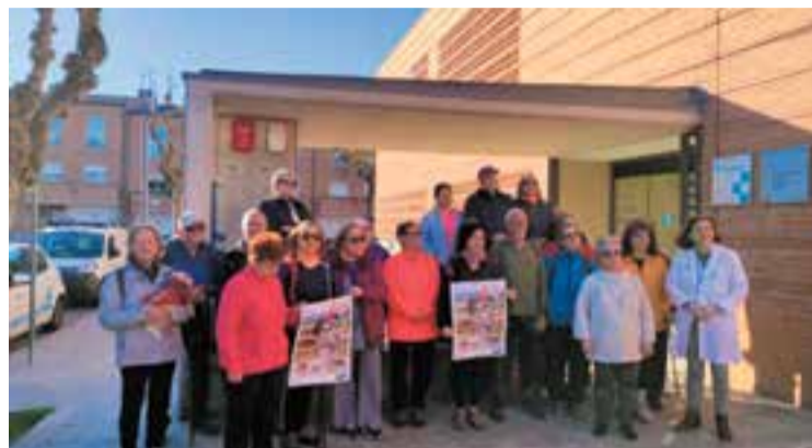
Participants a la caminada del cicle 'Camina i fes salut' a la porta del CAP.

Cada 6 d'abril se celebra el Dia Mundial de l'Activitat Física, que pretén promoure l'activitat física i reduir el sedentarisme com a elements fonamentals de salut i benestar. Dimecres, les persones que van participar a la sortida del cicle "Camina i fes salut", que es porta a terme cada dimecres, es van fer una fotografia de grup per donar visibilitat a aquesta data, que enguany té el lema "Mou-te, i viu feliç".