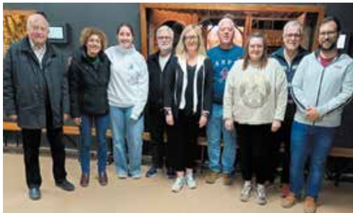
La nova junta del Grup Pessebrista, integrada per nou persones.

Més de 60 pessebristes donaran forma a les seves creacions, un total de 15 diorames i algunes vitrines, i també es recuperen les caixes per als alumnes del taller infantil de pessebres que s'inicia al setembre, ja que així també podran treballar la perspectiva. ➔ || REDACCIÓ