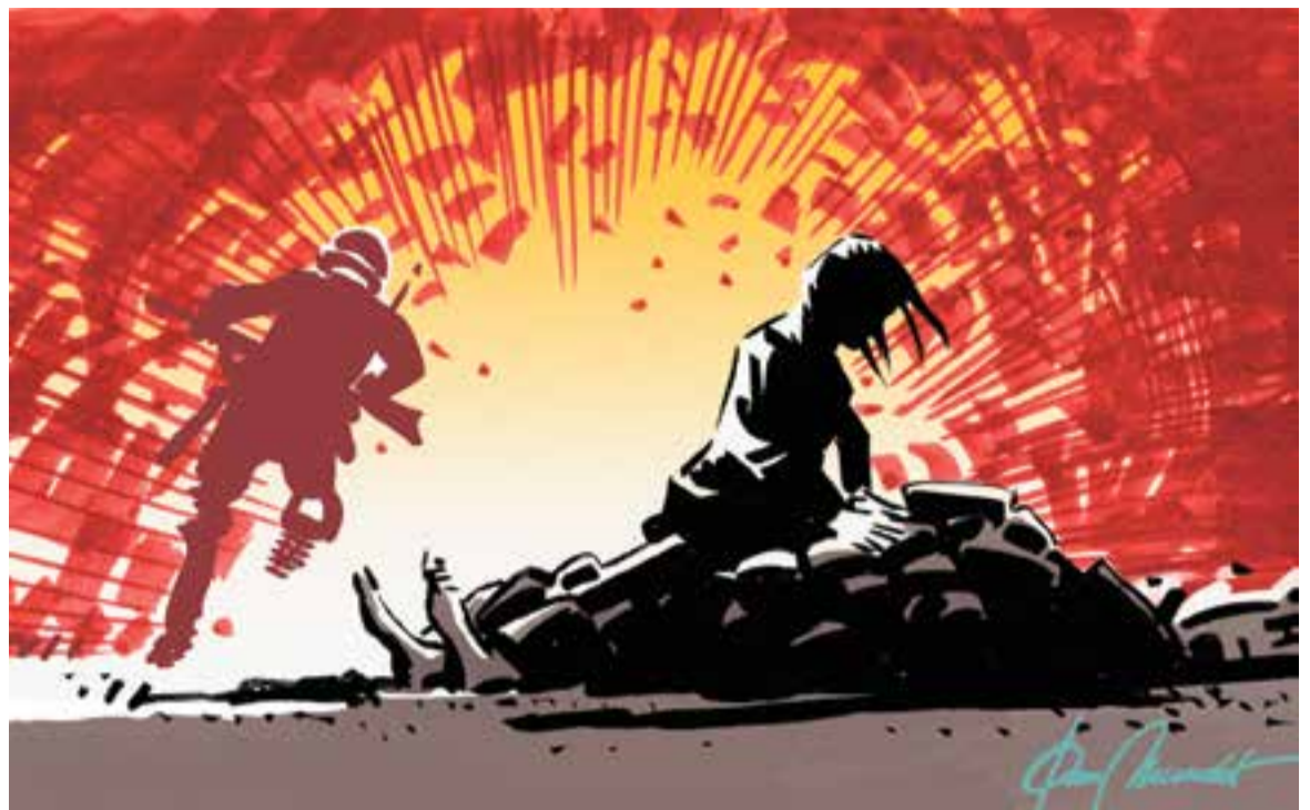
La vocació d'Antígona.

El bressol de la raó poètica és la pietat, sentiment arrelat en la profunditat del cor humà i que ens acostava a la realitat no des d'una idea reductora i distant, sinó des d'un sentir que ens fa prendre consciència de la participació amb cadascuna de les diverses formes en que es presenta l'univers. En el text "Para una historia de la Piedad", María Zambrano ens diu: "La realidad es previa a la idea [...]. Y si es previa a la idea ha de ser dada en un sentir", es tracta de