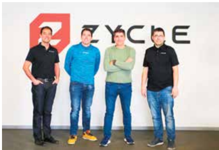
Els germans Moya, al centre, amb el director general i d'R+D de Versa Design.

A nivell de Catalunya, l'atur registrat ha baixat de 1.984 persones (-0,6%) el mes passat i deixa en 344.389 el nombre de persones en situació d'atur, 3.912 menys que fa un any (-1,1%). “És la xifra més baixa d'atur en un mes de març dels últims setze anys” , ha subratllat el secretari de Treball, que ha remarcat la reducció de 348 persones (-0,9%) en atur en el sector de la Indústria. Pel que fa a l'ocupació, s'ha produït un augment de 32.548 persones (+0,88%), fet que situa el nombre d'afiliacions a la Seguretat Social en 3.731.081, “la xifra més alta en un març de tota la sèrie històrica iniciada el 2004” , ha posat en relleu Vinaixa. En aquests moments, a Catalunya hi ha 93.977 persones ocupades més (+2,58%) respecte al març de l'any passat. +