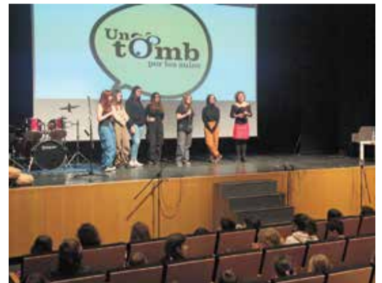
Un moment de l'edició del 'Tomb per les aules' de l'any passat.

Aquest divendres Ràdio Castellar i L'ACTUAL tornen a organitzar en col·laboració amb els Serveis Educatius Vallès Occidental VIII l'espectacle educatiu Un tomb per les aules . Nascut l'any 2015, l'objectiu de l'espectacle era generar un mostrari del que passa als centres educatius del municipi en una trobada en forma d'espectacle a l'Auditori Municipal. La proposta ha anat madurant i evolucionant amb els anys i continua amb força reflectint les inquietuds de la comunitat educativa. En concret, aquest divendres passen per l'escenari del Tomb per les aules alumnes de l'INS Castellar, de l'IE Sant Esteve, de l'escola El Casal (ESO i primària), i les escoles Mestre Pla i Bonavista. Entre les disciplines que es podran gaudir en escena hi haurà teatre musical, un projecte de Cambra Fosca, una acció solidària amb els ximpanzés en perill d'extinció a la República Democràtica del Congo o una passejada pels boscos, entre d'altres. En total, l'activitat mobilitzarà més de 300 alumnes d'aquests centres. + || REDACCIÓ