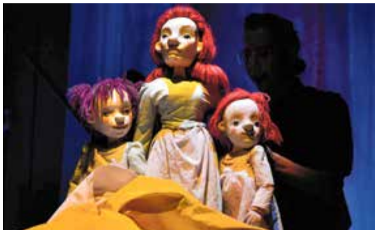
Imatge de l'espectacle de titelles 'Las Cotton', d'Anita Maravillas & Portal 71.