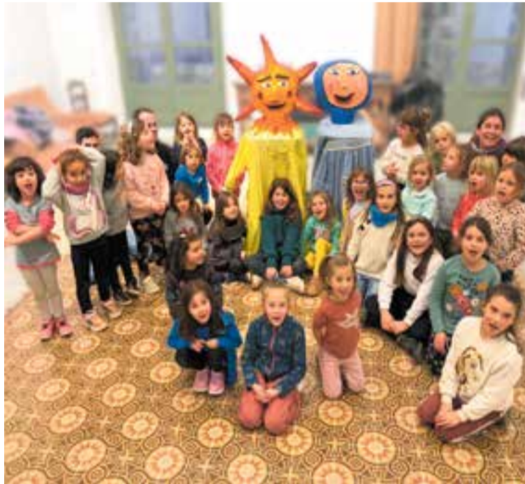
Cantaires del cor infantil del Cor Sant Esteve.