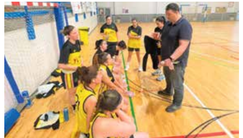
L'equip femení en un temps mort al pavelló municipal de Canet de Mar. || CEDIDA

pista, imposant el nostre ritme i dominant el rebot. Una victòria més per continuar endavant" , va explicar el tècnic d'un conjunt que continua en segon lloc amb un partit menys. Pel que fa al sènior masculí, els de Josep Bordas van caure per 59-65 contra un rival directe com era el CB Matadepera. Un mal inici en el primer quart (15-23) i un desenllaç pitjor en l'últim (7-14), van condemnar l'equip, que torna a caure fins a l'última posició de la taula i es complica la permanència, ja que és l'únic equip amb només quatre victòries en 19 jornades. + || A. SAN ANDRÉS