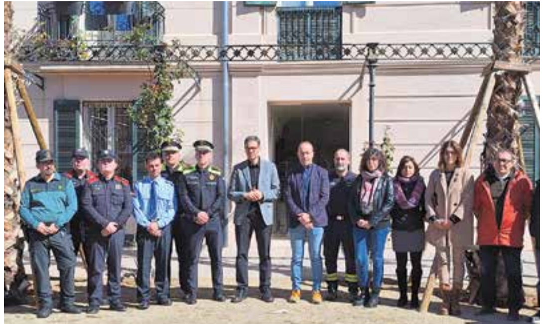
Membres de la Junta Local i del consistori castellarenc durant el minut de silenci per l'11M.