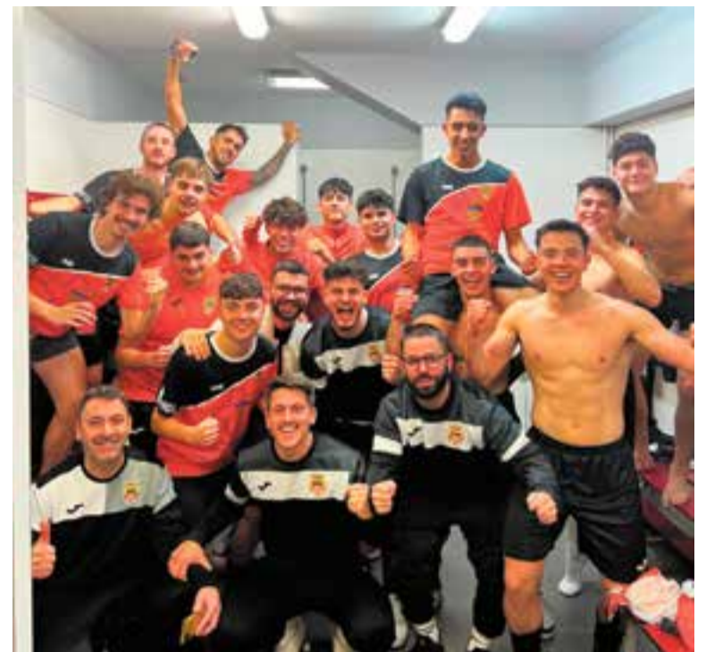
L'equip va tornar a celebrar una victòria al vestidor del Blume. || CEDIDA

En vòlei, l'equip femení d'Arnau Pérez va caure per 3-1 (25-14/15-25/25-22/25-20) a la pista de l'Alpicat, però continuen en el límit de la salvació, empatades a nou punts amb el Llars Mundet B, pròxim rival. El masculí va tornar a caure per 3-1 (25-15/20-25/25-20/25-17) amb el CV Olot i continuen últims. + || A. S. A.