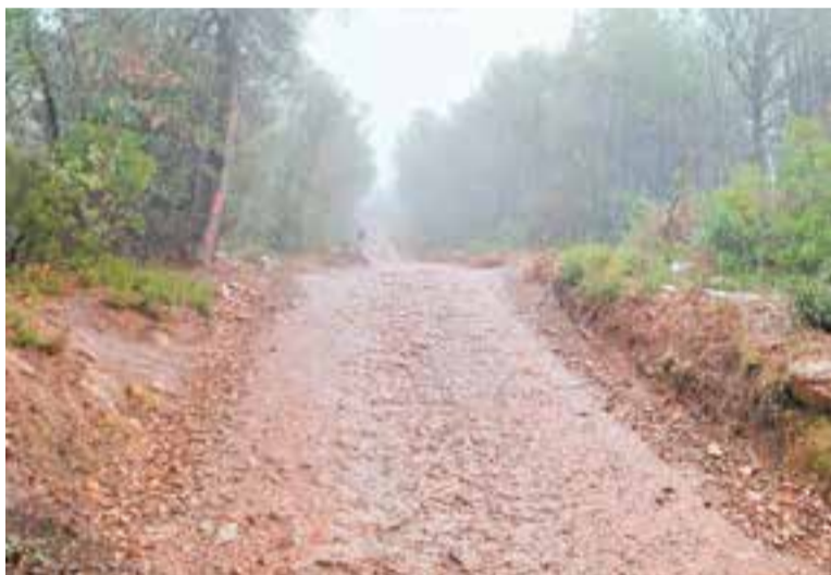
Pluja intensa al camí del Puig de la Creu, dissabte passat.

A més, cal recordar que el dissabte 2 de març també van ploure 9,8 litres per metre quadrat. Per tant, la pluja ha deixat al març 63,5 l/m 2 a Castellar. Tot i la bona dada, la Generalitat recorda que el país continua patint un episodi de sequera greu. + || REDACCIÓ