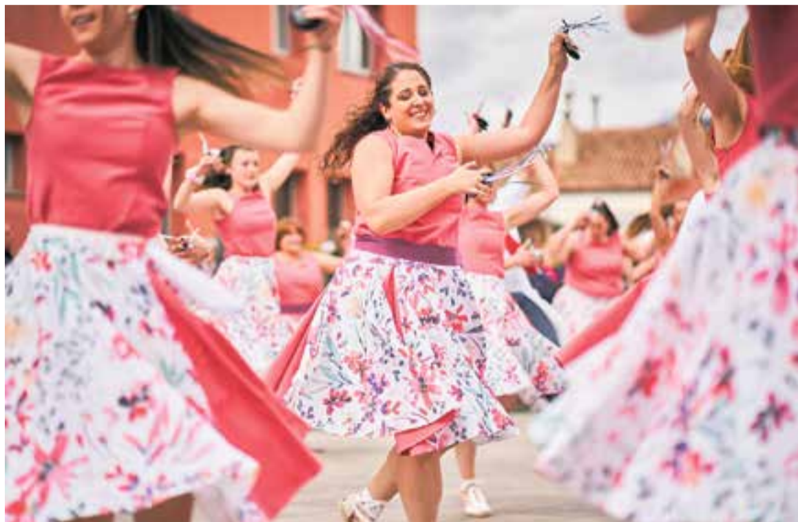
La plaça Major es va omplir de tradició i música diumenge passat de bracet del Ball de Gitanes.

L'entitat, acompanyada amb la música en directe de la cobla La Catxutxa de Lliçà d'Amunt, va interpretar 10 balls amb les tres colles que té actualment –petits, solters i arrelats– i una darrera, La Pavana, amb participació del públic que omplia un racó