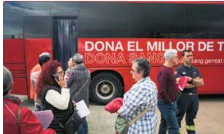
La jornada de donació de sang es va fer l'any passat durant la Fira de St. Josep. || Q. P.

Amb el mes de març arriba la 10a edició de la campanya "Els bombers i les bomberes t'acompanyen a donar sang" que suma esforços entre el col·lectiu de Bombers de la Generalitat i el Banc de Sang i Teixits per aconseguir donacions de sang els mesos de març i abril. Una de les parades d'aquesta ruta de campanyes arreu del territori és a Castellar del Vallès, on es podrà donar sang diumenge 17 de març, en horari de 10 a 14 hores. L'any passat es va fer en el marc de la Fira de Sant Josep. La donació de sang estarà acompanyada d'exhibicions de vehicles i activitats per als més menuts.