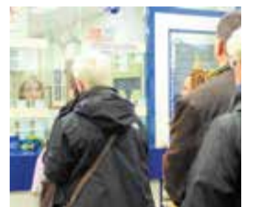
L'administració número 1.

A més del premi d'aquest dijous, des que va començar l'any la loteria del carrer Sant Pere Ullastre ha repartit un premi de 14 encerts de la quiniela del 7 de gener. +