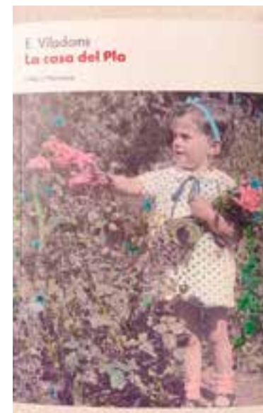
Portada de 'La casa del Pla', d'E. Viladoms

Hilari Sacalm, evoca la gent, els paisatges i l'oralitat d'un Vallès industrial encara fortament arrelat a la terra. Ella reconeix que escriure el llibre li ha suposat un procés de dol, un dol heretat, i que ha buscat respondre preguntes que ara ja no pot fer. ➔ || M. A.