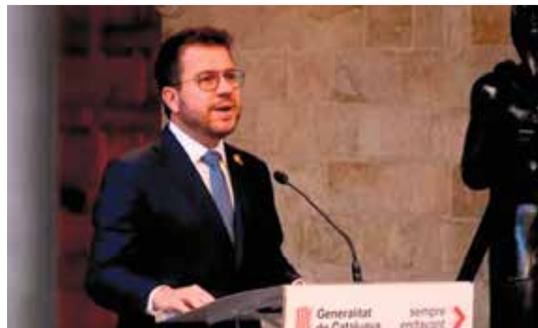
Compareixença de Pere Aragonès en què ha anunciat l'avançament electoral.

“Nosaltres desitgem que amb aquestes eleccions del 12 de maig hi hagi un canvi real que posi d'una vegada per totes el focus en la gent i deixi de trinxar el país perquè el govern d'ERC ho ha trinxat tot. Ha trinxat la independència, ha trinxat la pagesia, l'educació, la sanitat, el medi ambient amb el Quart Cinturó. Ha intentat vendre el territori als interessos neoliberals amb l'aeroport i el Hard Rock. És hora