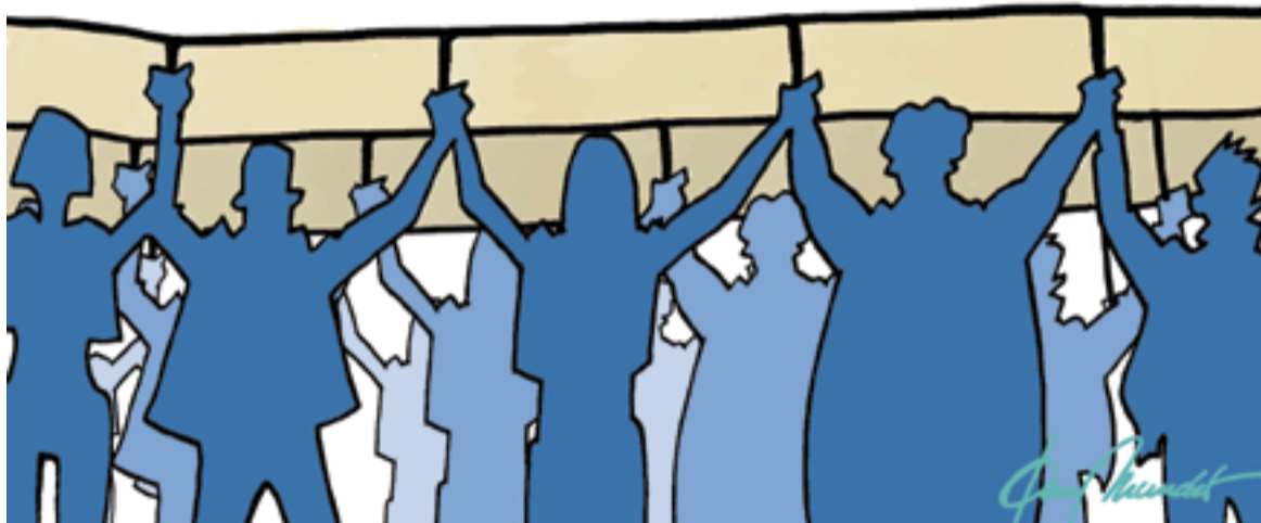
© Lluita de drets. | JOAN MUNDET

adequada. És evident que sempre hi ha gent que creu que qualsevol temps passat va ser millor, que si no es mouen res canviarà, que és millor mantenir-se en una vitrina sense pols que llançar-se al fang i veure què podem fer per canviar la nostra existència. Això és totalment fals, i ho veiem cada dia amb les noves tecnologies, amb les noves sexualitats, una veritat que no es pot obviar, és ja inabastable.