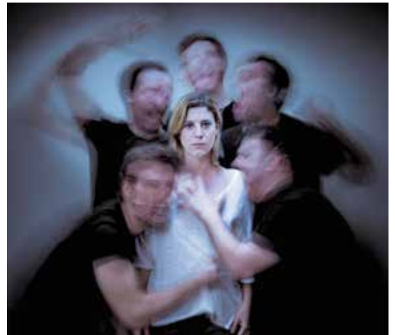
Imatge promocional de 'Jauría', de Velvet Events i Kamikaze Produccions. || V. RABADE

La fita és arribar a omplir totes les butaques dels teatres catalans el 16 de març, amb l'objectiu de convertir Catalunya en la capital mundial de les arts escèniques. D'aquesta manera, es vol posar en valor la capacitat que té la societat civil per mobilitzar-se davant una fita històrica que posa la cultura en primer pla. +