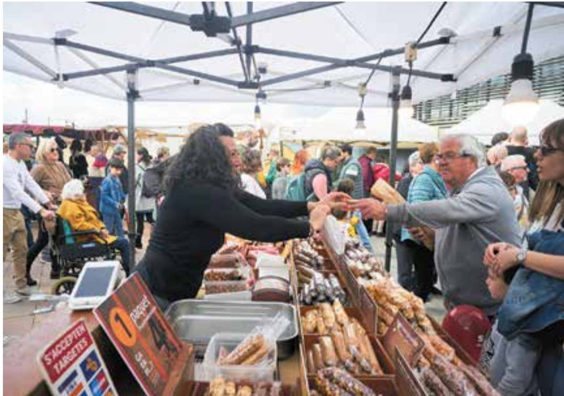
A la fira d'aliments artesanals de la plaça d'El Mirador s'instal·laran 38 parades.