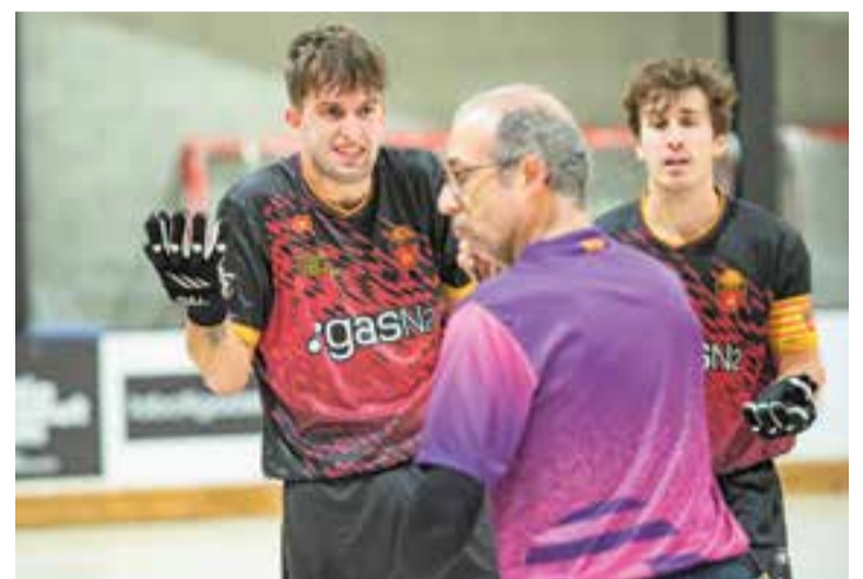
Es trenca la ratxa de sis victòries consecutives de l'equip grana. || A. S. A.

En el cas del femení, les de Quima Jimeno van caure per 9-4 contra el Mollet, que puja a la quarta plaça, amb gols d'Ana Teresa Cuervo, Rita Coma, Zoe Solé i Ariadna Pinar. Les grans són 12es en el grup A de Segona Catalana, abans de rebre aquest divendres al Dani Pedrosa (21.30 h) les líders del CP Vilafranca. + || A. SAN ANDRÉS