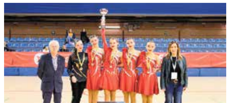
L'equip del CPA Castellbisbal amb la copa aconseguida a Reus.