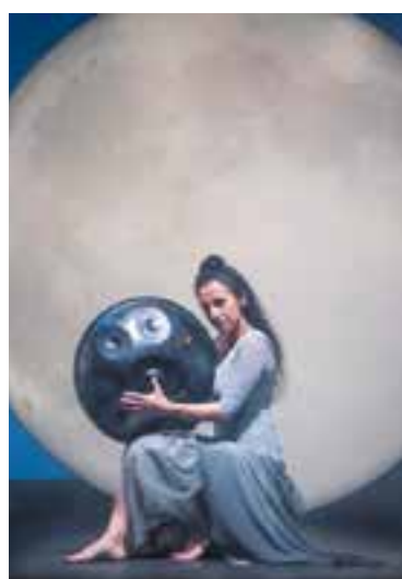
Imatge de 'Madame Lumière'.

Diumenge 4, a les 11 h i a les 12.30 h, La Menuda arriba a l'Auditori Municipal amb l'espectacle Madame Lumière . Es tracta d'un espectacle pluridisciplinar adreçat a la primera infància i dirigit per Faló Garcia i Pellejà. “La meva trajectòria en el món dels espectacles familiars, de 12 anys, és per a aquest públic”, diu Garcia. Es tracta d'un públic agraït i sensible i, “al mateix temps, no te'n deixa passar ni una”.