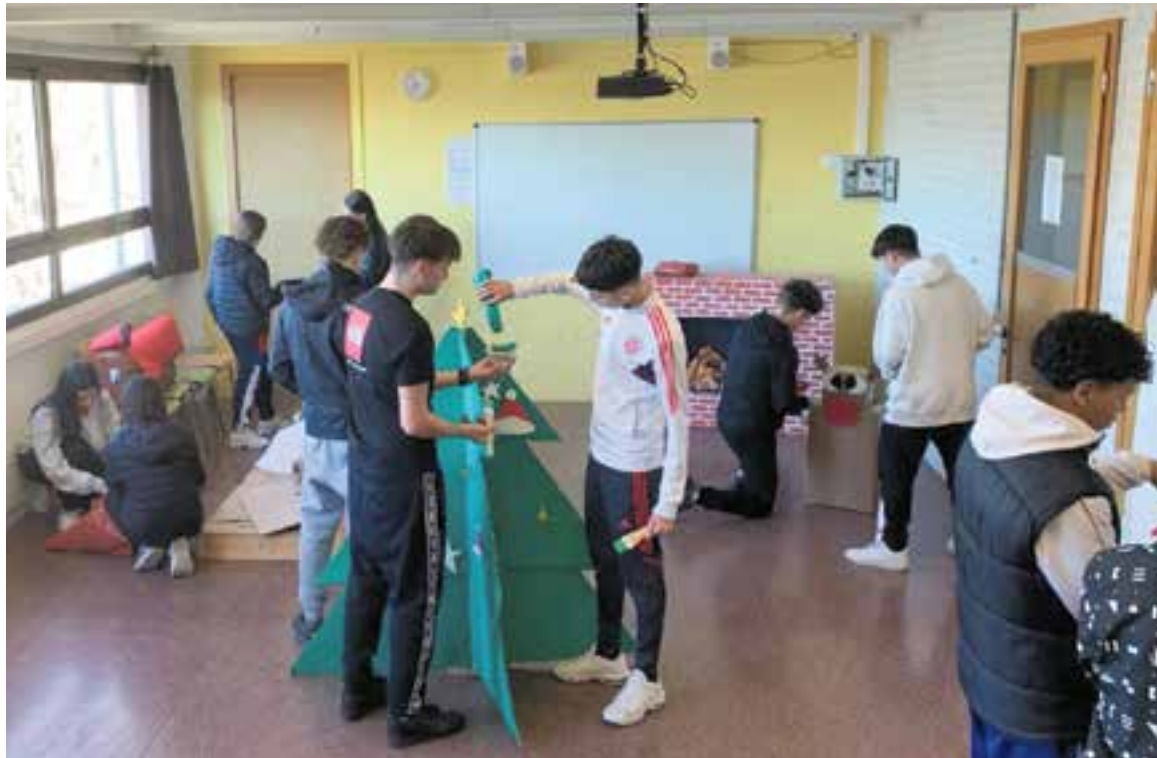
Entre les diverses assignatures del mòdul de comerç, màrqueting i logística s'aprèn aparadorisme. || INS CASTELLAR

A Castellar del Vallès hi ha dos centres que ofereixen estudis de formació professional: l'Institut Castellar, on es pot cursar gestió administrativa, i comerç i màrqueting, i l'Institut de Jardineria i Agricultura Les Garberes, on es poden cursar els cicles de jardineria i floristeria, producció agroeco-