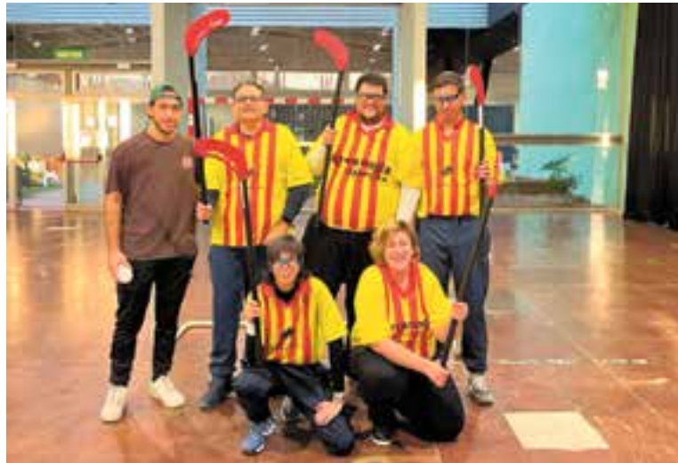
L'equip d'hoquei pista del TEB entrena els dimecres a l'Espai Tolrà.

Ara, però, l'equip té problemes amb el nombre de jugadors i jugadores. "Per jugar en necessitem cinc, més el porter, i en aquests moments som quatre o cinc entrenant. Abans venia una furgoneta de Barcelona amb altres esportistes, però ja no" , detalla Amat. Aquesta davallada s'ha traduït en problemes per disputar partits, ja que en moltes ocasions no arriben a formar l'equip necessari. "Fem una crida perquè l'equip