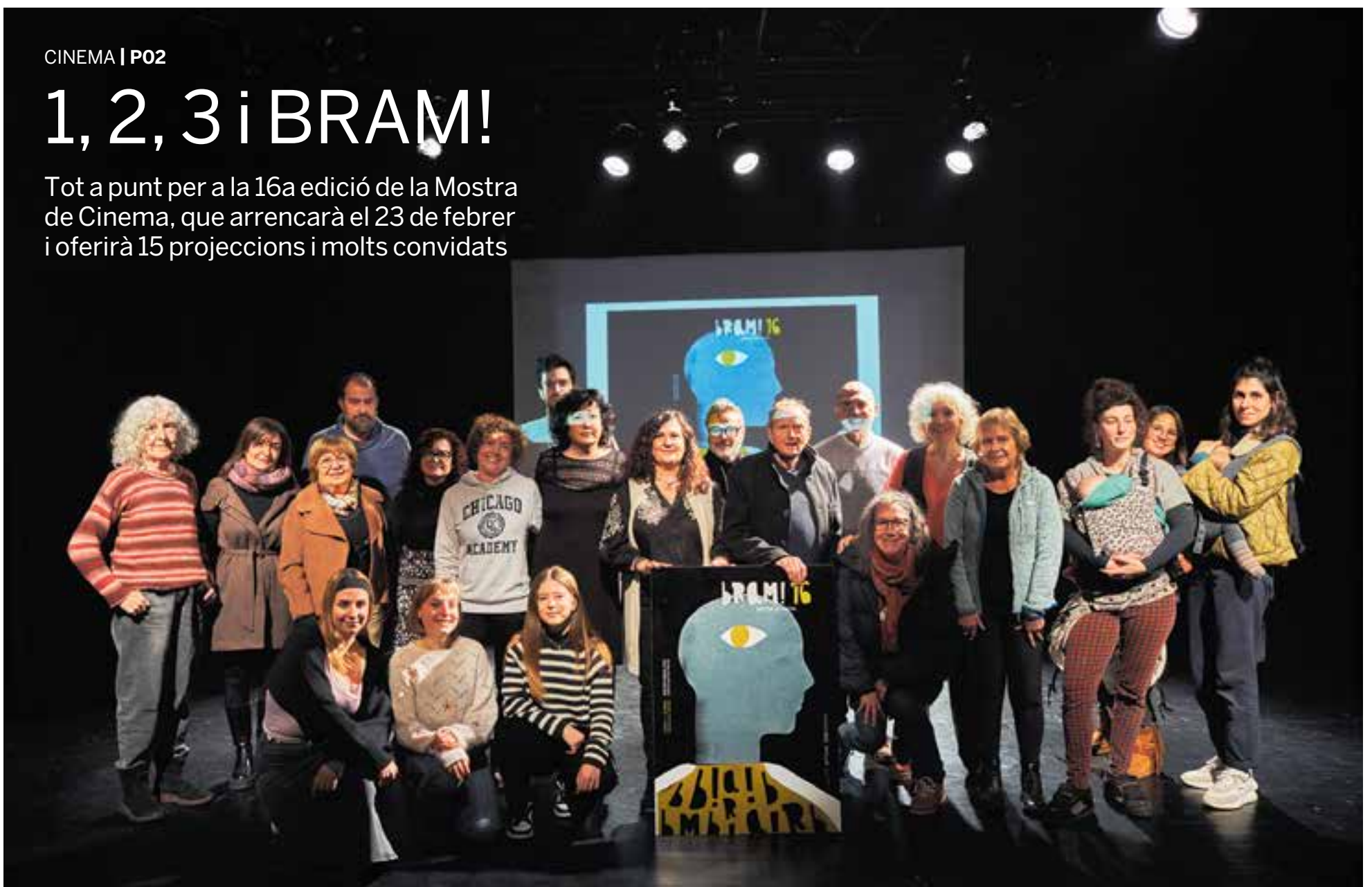
La 16a edició del BRAM es va presentar dimecres passat amb la presència de les persones i col·lectius que formen part de la programació d'aquest any.

Tot a punt per a la 16a edició de la Mostra de Cinema, que arrencarà el 23 de febrer i oferirà 15 projeccions i molts convidats