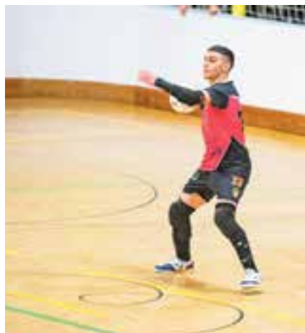
El futsal, a la zona perillosa.

L'FS Farmàcia Catalunya Castellar de futbol sala va caure per 5-3 al camp del líder, el CFS Arenys de Munt, i queda igualat a punts amb la zona de descens, tot i que una posició per sobre. El femení de vòlei va perdre al tie-break i queda amb opcions remotes de jugar per l'ascens.