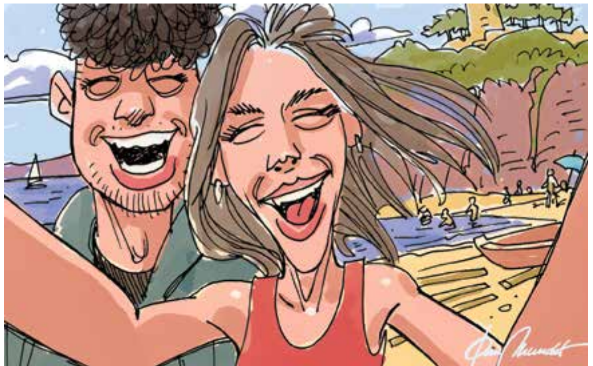
© Paradisos atapeïts. || JOAN MUNDET

“A les illes Balears ja són moltes les platges a les quals només es pot accedir a peu o per mar”