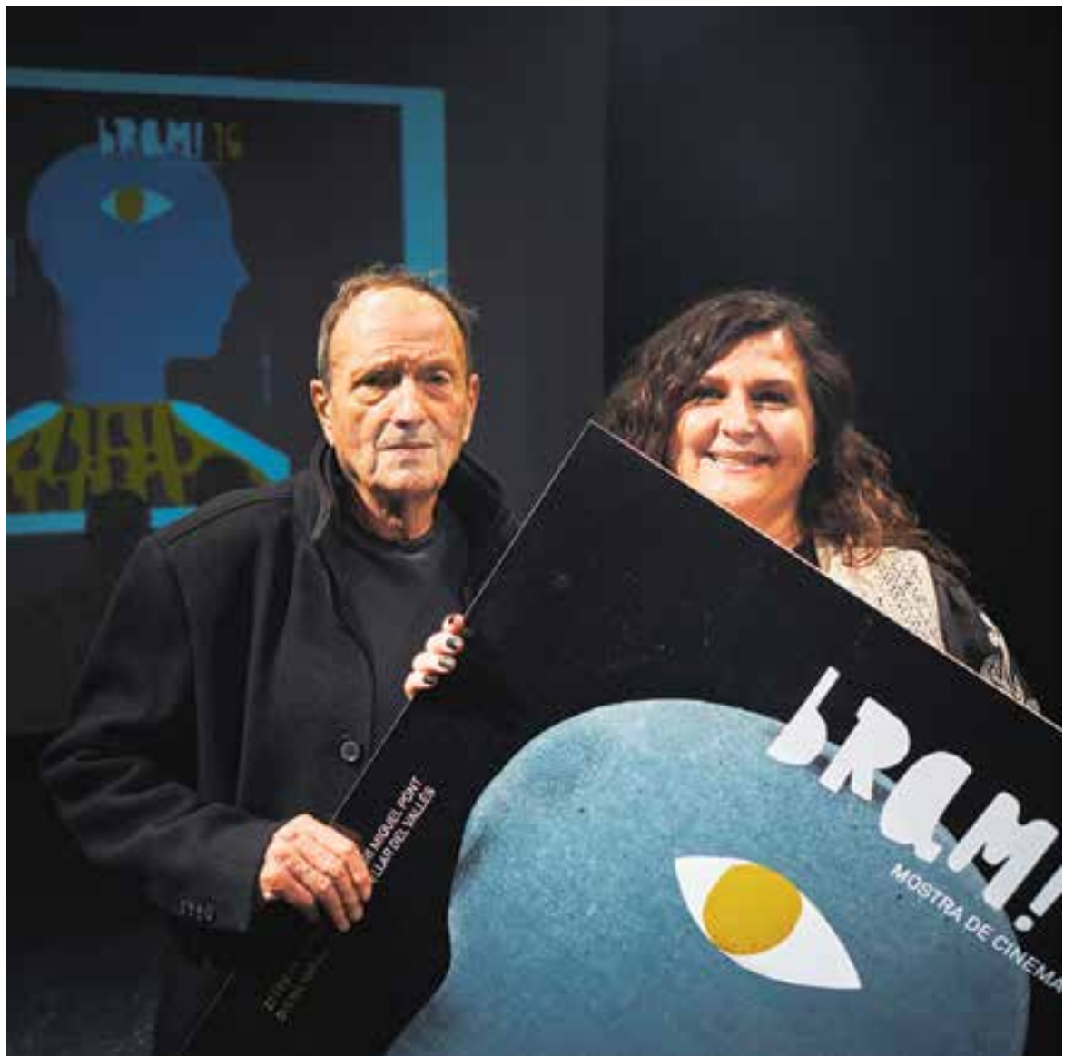
El president del Club Cinema Castellar i la regidora de Cultura amb el cartell que il·lustra l'edició d'aquest any, la 16a.