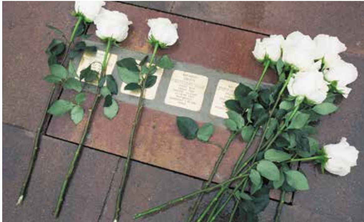
Les plaques 'Stolpersteine' el dia que van ser col·locades, el 26 de gener de 2017, a la plaça d'El Mirador.