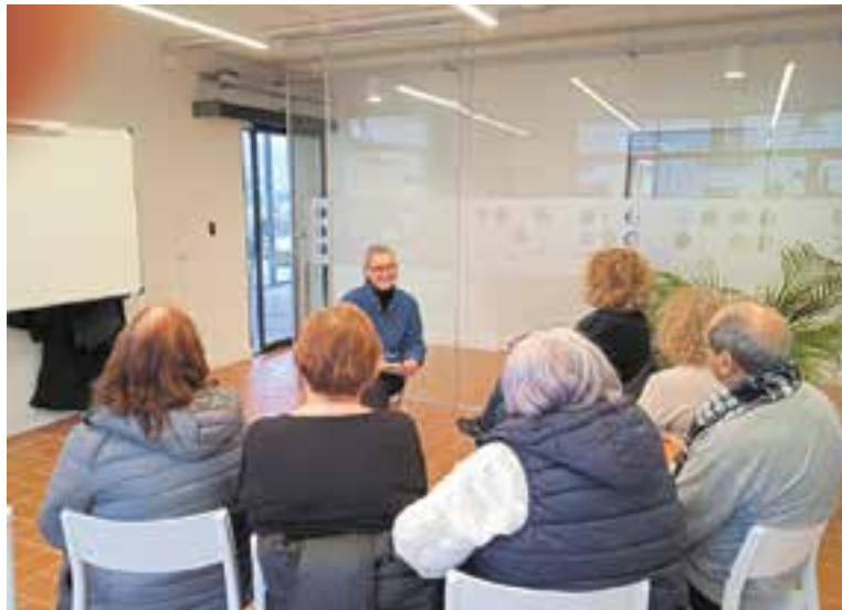
La primera sessió del grup de suport emocional i ajuda mútua.

Els objectius del Grup de Suport Emocional i Ajuda Mútua són diversos, entre d'altres, millorar la qualitat de vida de les persones cui-