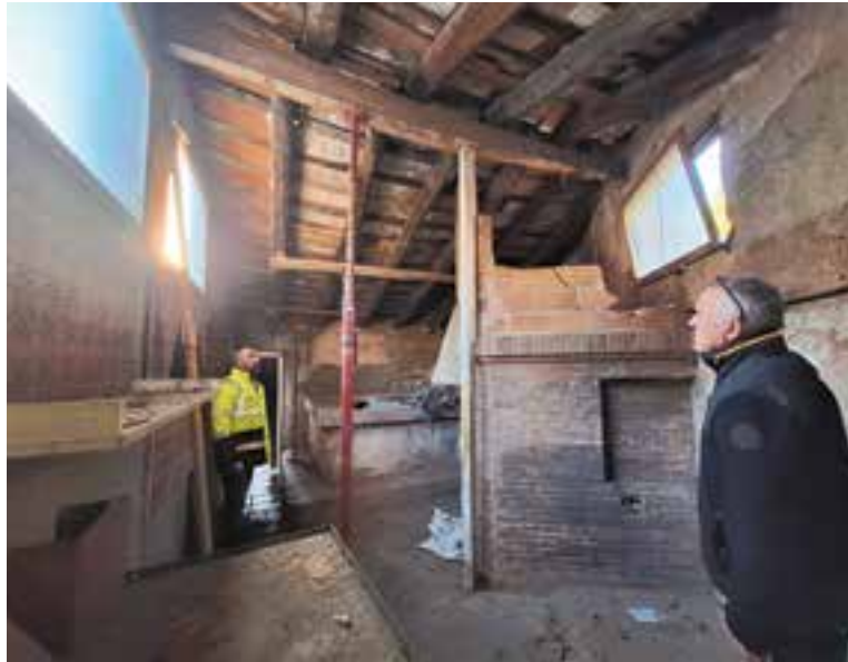
L'immoble haurà d'afrontar actuacions urgents de manteniment. || AJ. CASTELLAR

Els serveis tècnics municipals han engegat aquest mes de gener els treballs previs a la rehabilitació de Cal Gorina, unes actuacions necessàries per determinar quins treballs caldrà dur-hi a terme per garantir la seguretat de l'edifici. També s'ha encarregat un estudi arqueològic. L'Ajuntament va adquirir a finals de desembre aquest equipament situat en els números 6 i 8 del carrer del Centre, un edifici que té un alt valor patrimonial però que en l'actualitat presenta un estat de conservació molt precari. És per això que s'ha iniciat la valoració tècnica del seu estat, amb l'aixecament de plànols de l'estat actual, l'anàlisi de l'estructura i l'estat dels subministraments