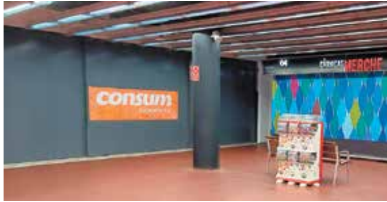
La pancarta de Consum a l'entrada del supermercat. || J.R.

L'empresa ja ha completat el procés de selecció per contractar 35 persones a jornada completa, tot i que també té la intenció d'oferir més contractacions amb jornades reduïdes. Al novembre va fer les entrevistes de selecció a través del Servei local d'Ocupació, un procés al qual es van presentar un centenar de persones. Abans de l'obertura de l'establiment, Consum ha fet formació en tasques com cobrament a caixa, reposar el producte als lineals, atendre el client