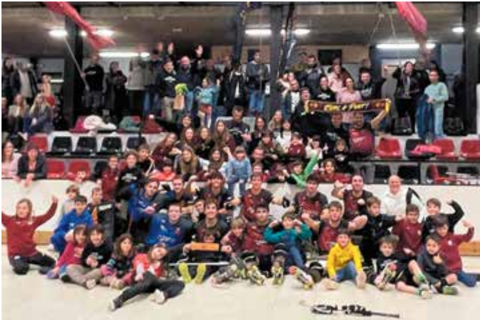
Els grans celebrant la victòria amb l'afició del Dani Pedrosa.

El primer equip de l'HC Castellar va aconseguir una golejada (6-2) que els torna a col·locar empatats a punts amb les posicions d'ascens a Nacional Catalana.