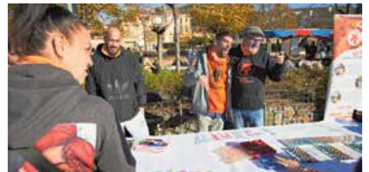
El 3 de desembre es va celebrar el Dia de les Persones amb Diversitat Funcional.