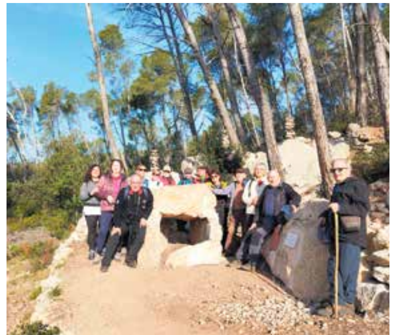
Una de les parades fetes a l'itinerari Un Tomb per la Història: “La pedra seca”.

La propera sortida d'Un Tomb per la Història és prevista pel dia 30 de març i és al monestir de la Mola. Comptarà amb una explicació a càrrec d'un historiador i d'una teatralització. La sortida es farà a Castellar, on es podrà utilitzar el servei de la Vallesana fins al Cim de Sant Feliu, des d'on es començarà l'itinerari a peu fins a la Mola. †