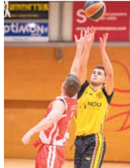
El masculí continua buscant la victòria. || A. S. A.

Com ja comença a ser habitual en les últimes jornades, els equips sèniors del CB Castellar s'han convertit en la cara i la creu. La cara per a l'equip femení de 2a Regional, que novament aconseguix la victòria i la creu per al masculí, que suma la sisena jornada sense guanyar.