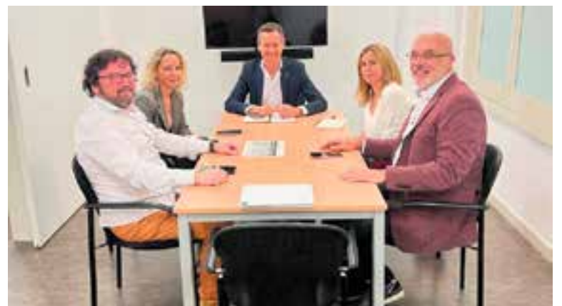
Els tres regidors de Junts de Castellar amb els seus homòlegs de Sabadell.