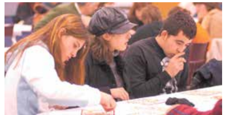
Castellar acull diverses propostes del tradicional quinto de Nadal.

Els Castellars de Castellar-Capgirats també han programat el Quinto Capgirat, obert a tothom, el dia 26 de desembre, a les 18.30 hores i a la Sala Blava de l'Espai Tolrà. L'esplai Sargantana també organitza un quinto el dia 5 de gener, al matí. +