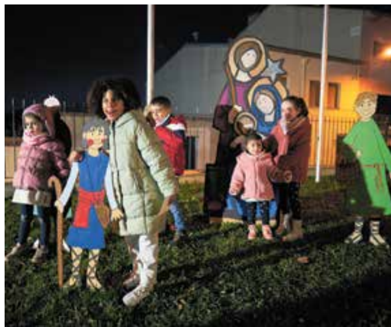
Plantada del pessebre de l'Esplai Xiribec en una edició anterior.

Aquesta plantada arriba enguany a la 30a edició. El pessebre es podrà visitar fins al 8 de gener. +