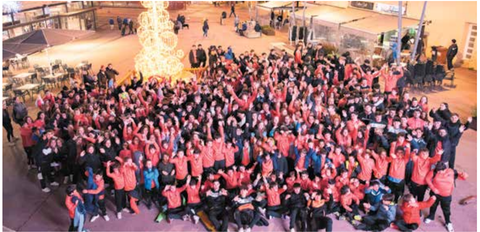
Els i les esportistes de l'FS Castellar van fer la foto de rigor a la zona de la plaça del Mercat, al costat de l'arbre de Nadal.

També volen “saber quins criteris fa servir l'Ajuntament per