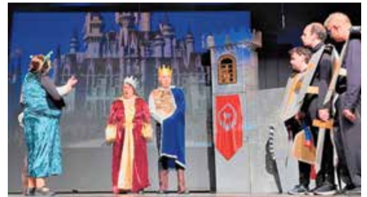
Un moment de la representació de dissabte a la tarda.