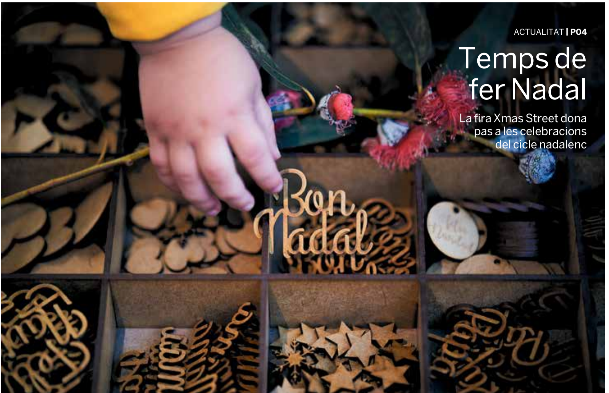
Durant la fira Xmas Street, organitzada per Comerç Castellar amb col·laboració de l'Ajuntament, els visitants podien escollir diferents elements per decorar l'arbre de Nadal i casa seva.

La fira Xmas Street dona pas a les celebracions del cicle nadalenc