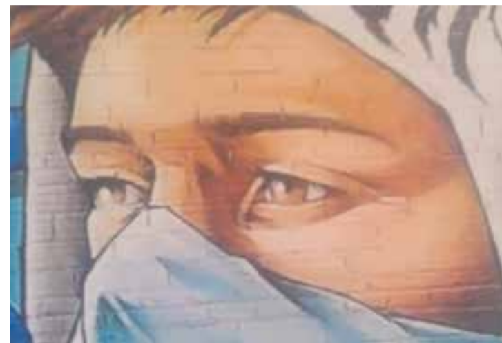
Una de les obres que es pot veure a l'exposició del Calissó, fins al 4 de gener. || C.

Dijous 14 de desembre es va inaugurar l'exposició Les parets de Castellar ens parlen al Calissó Espai Cultural. És una mostra d'ARGA, l'Associació de Recerca Grafològica Aplicada de Barcelona, que presenta un tomb pel món del grafit. Aquesta associació es dedica a la recerca grafològica i també està molt compromesa amb la divulgació gràfica, que ja ha exposat en més d'una ocasió a la nostra vila.