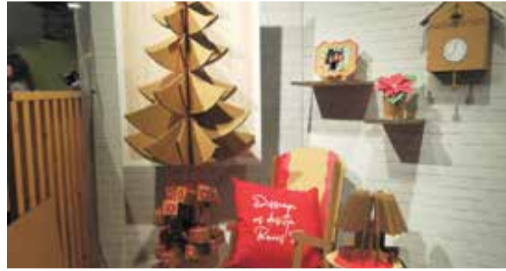
Un detall de l'aparador de Disscopi, guanyador l'any passat.