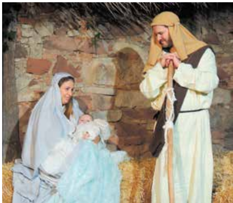
Escena del Naixement, al Pessebre Vivent de Sant Feliu del Racó. || PESSEBRE VIVENT

No hi faltaran els dimonis, “que també arriben amb alguna sorpresa”, i el Naixement, les bugaderes, els Reis de l'Orient, els pastors i el caganer, “que ensenyarà el cul de debò”. A més, a l'altura de la Masia del Racó, membres de Suport Castellar han preparat un repertori per oferir una bona cantada de Nadales. A l'entrada, se servirà brou Aneto i, a la sortida, es podran adquirir productes a les parades que s'instal·laran a la plaça: Formatges Montbrú, artesanía feta a Sant Feliu, sabons i llaminadures. “I també una parada de nens i nenes que han fet coses per a aquell dia”. A la plaça també hi haurà l'Ambaixador perquè els infants li puguin entregar les seves cartes. + || MARINA ANTÚNEZ