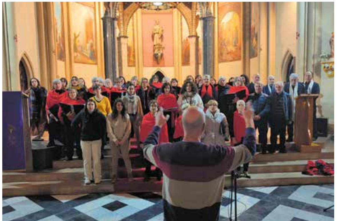
Moment del concert de Nadal a l'església de Sant Esteve.

L'última coral a cantar va ser la Xiribec. Va oferir un repertori de cançons tradicionals i va unir-se, a la part final, als altres cors del Cor Sant Esteve per cloure el concert amb Joia en el món i Adeste Fidele , dues clàssiques del concert de Nadal a l'església. +