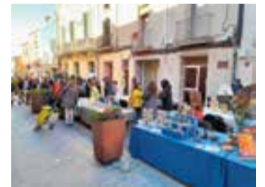
Subhasta del Mercat d'Art.