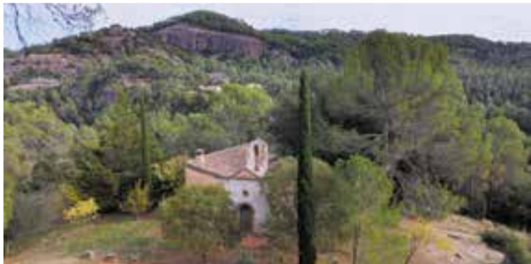
Una imatge del calendari de l'Ajuntament del 2024.