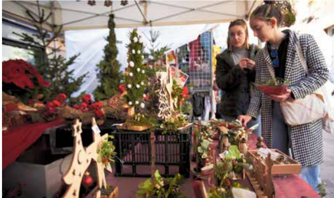
Unes noies comprant productes nadalencs en una de les paradetes de Xmas Street d'aquest any.

La valoració de la fira de Comerç Castellar és molt positiva, tant pels organitzadors com pels castellarencs que hi passejaven. A més l'oferta no es va limitar a les paradetes comercials, ja que es van orga-