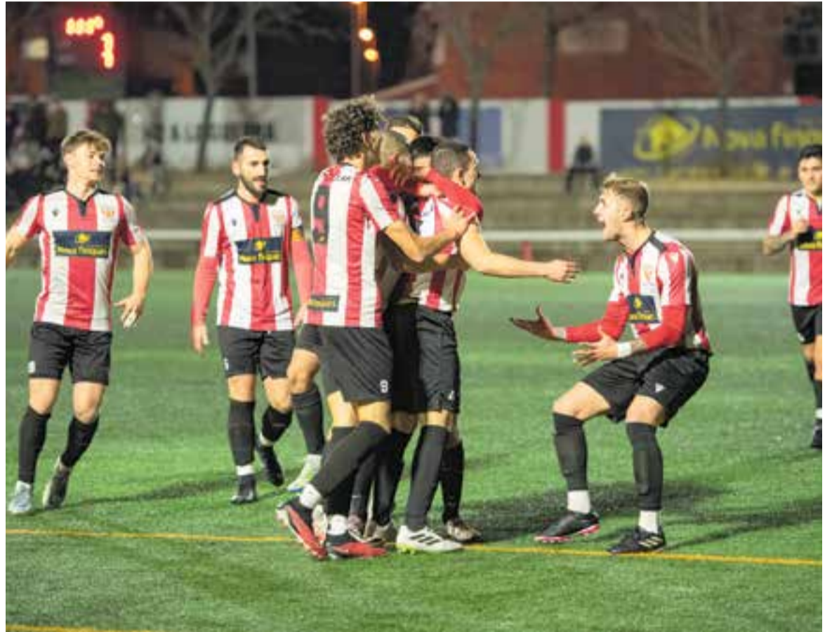
L'equip blanc-i-vermell va dominar el partit contra el Júpiter, però els 13 minuts d'afegit els van fer patir.

L'equip no tornarà fins al 14 de gener al camp de la Pirinaica, motiu pel qual s'han programat un total de tres partits amistosos al Cortiella: el disputat aquest dimecres amb el CE Mercantil de Divisió d'Honor (X-X), el 3 de gener contra el FC Cardedeu (20.30 h) i el 10, amb el FC Terrassa (20 h), de Segona RFEF. +