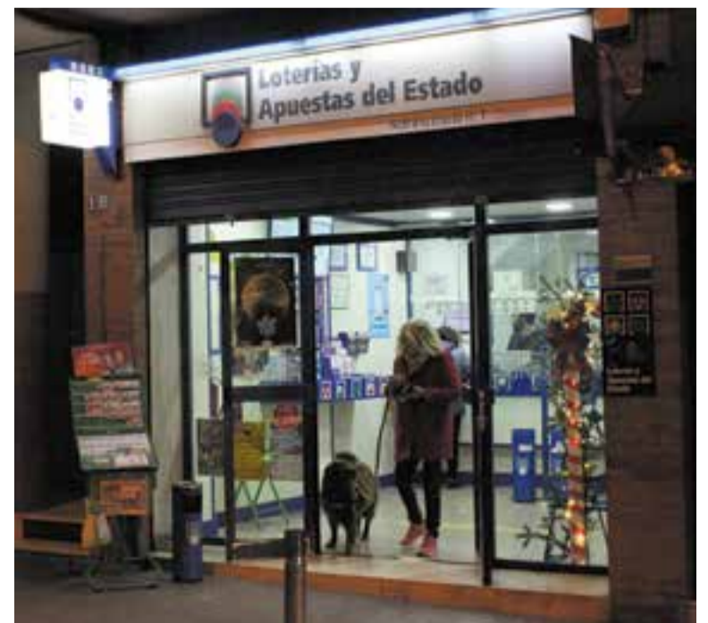
L'administració núm. 1 de Castellar, L'Estaca. || J. CLAPÉS

A banda de la loteria nacional, Catalunya té el seu propi sorteig que any rere any guanya adeptes, gràcies també, en part, al personatge que la representa, la Grossa. En aquest cas els premis es reparteixen en el sorteig que se celebra el 31 de desembre. †