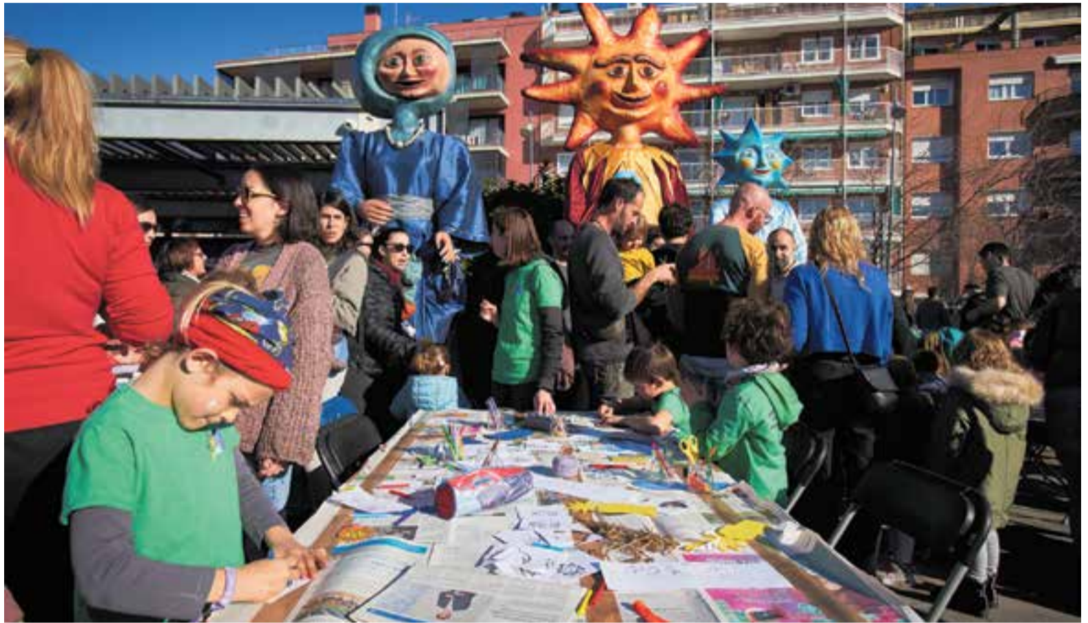
El taller de manualitats organitzat pels de la colla de gegants de l'ETC va ser una de les nombroses activitats que es van fer a la plaça d'El Mirador.