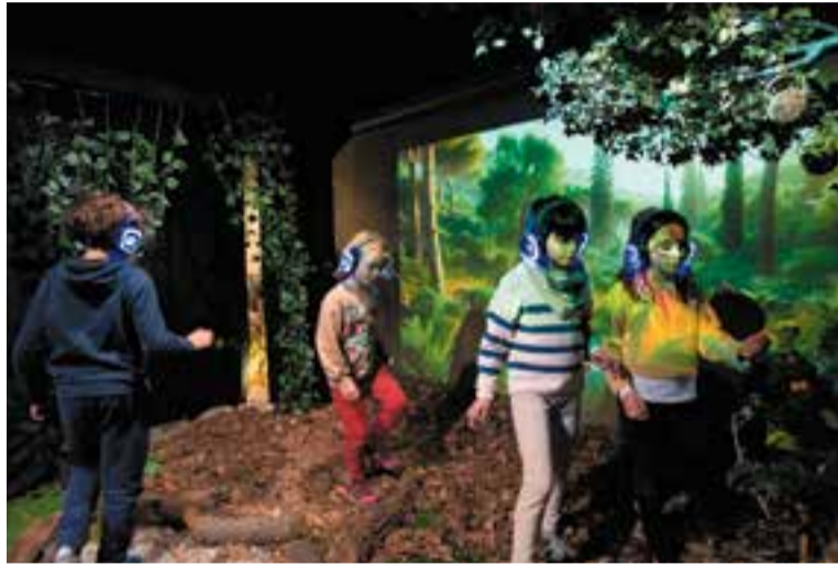
Diferents infants passant pel passatge dels sentits diumenge passat.

Han passat pel passatge totes les escoles des d'I3 fins a cinquè de primària de totes les escoles del municipi, i divendres i dissabte "vam obrir per aquells nens i nenes que han estat malalts quan els tocava a la seva escola o venien de fora del municipi amb la família" , assegura el voluntari, que afegeix que amb el passatge dels sentits "hem aconseguit una mica una clau de volta: normalment els pares