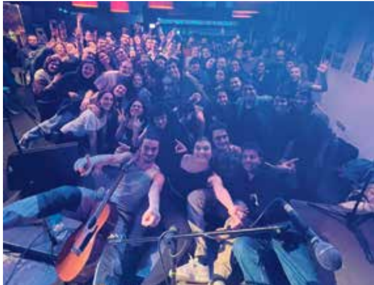
Lòxias va actuar davant d'un nombrós públic dissabte, al Calissó Cultural.

Campàs ve del món clàssic. Va cursar els quatre anys del grau superior de guitarra clàssica al Liceu. El juny d'aquest mateix any, li van atorgar el premi extraordinari en inter-