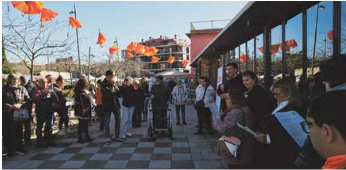
Lectura del manifest del Dia de la Diversitat davant del Casal de la plaça Major dissabte passat. || Q. PASCUAL

Durant el matí, diverses entitats van contribuir en la jornada. Per