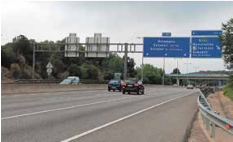
Un tram de la C-58C, on connectaria la Ronda Nord.