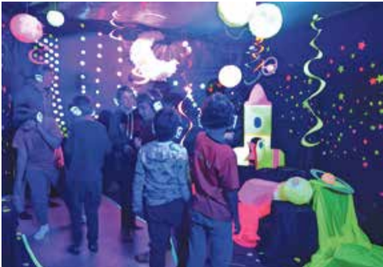
Alumnes de 3r de l'Emili Carles-Tolrà al passatge divendres passat.

El passatge dels sentits proposa als alumnes una experiència immersiva