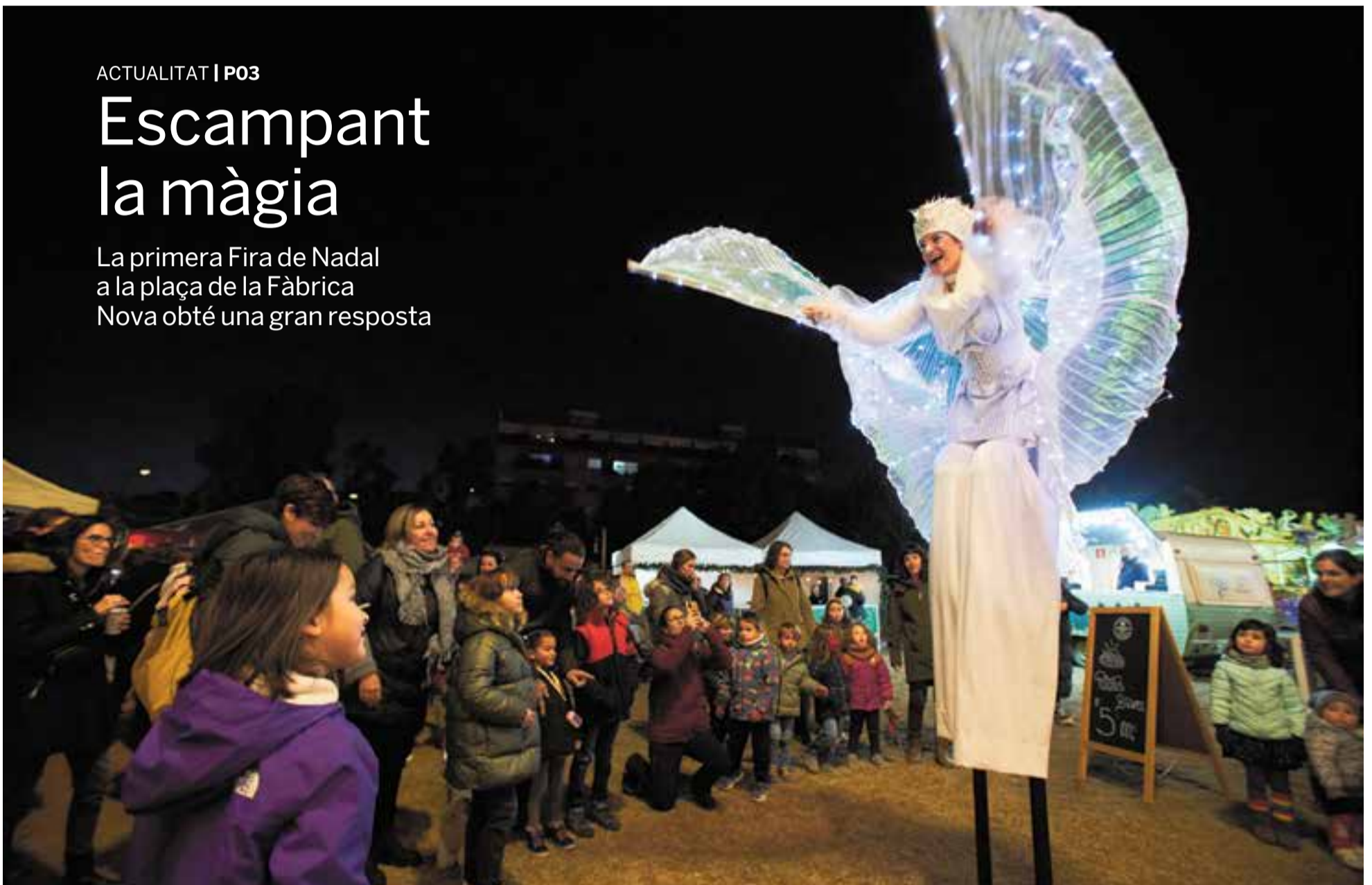
L'espectacle 'Fades de llum' va recórrer la Fira de Nadal dissabte a la tarda. Molts pares, nens i nenes no es van voler perdre el seu passeig i les van seguir per tot l'espai.

La primera Fira de Nadal a la plaça de la Fàbrica Nova obté una gran resposta