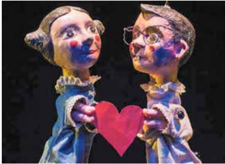
Titelles de La Maquiné per a 'Estación Paraíso'.

Ella ha perdut i ha guanyat. Perquè ja no té el seu "viejito", però