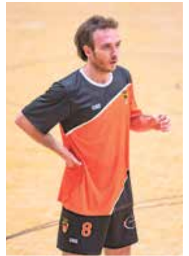
Setmana per reflexionar. || A. S. A.

barri barceloní del Guinardó va er qualificat pel tècnic local Darío Martínez com a "el pitjor de tota la temporada". Amb aquesta derrota, l'equip cau a la novena posició, tot i que només el separen dos punts amb el quart lloc. L'Olimpic Floresta, cinquè classificat, serà el pròxim rival d'un equip que descansarà pel pont. + || ALBERT SAN ANDRÉS