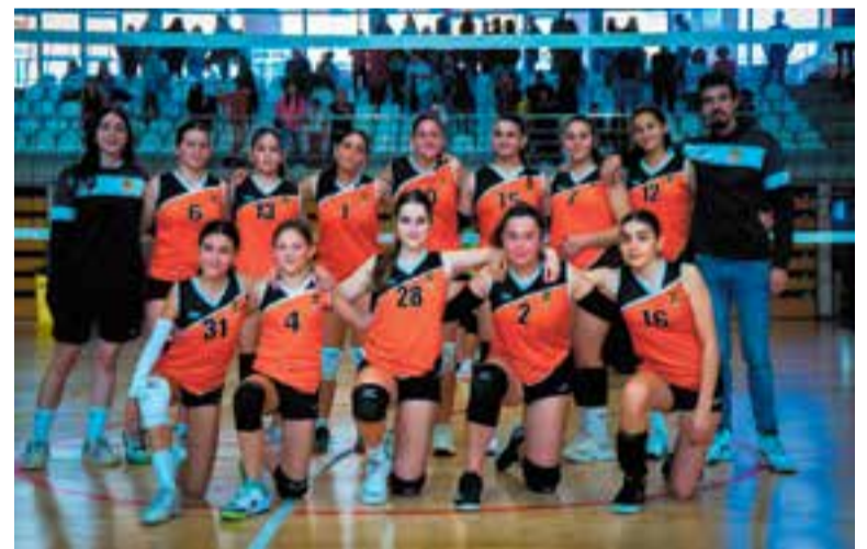
L'equip infantil A Taronja continua amb la bona ratxa en Lliga. || ANDRÉS ESCOBAR

Qui continua amb una marxa imparable és l'Infantil A Taronja, un conjunt que no sap què és perdre cap punt aquesta temporada, ja que ha aconseguit nou victòries en nou partits. Les de Llamas van superar el Vallbona per 0-3 (18-25/9-25/11-25) i a cinc jornades per acabar la primera fase ja estan classificades per al play-off d'ascens. + || A. SAN ANDRÉS