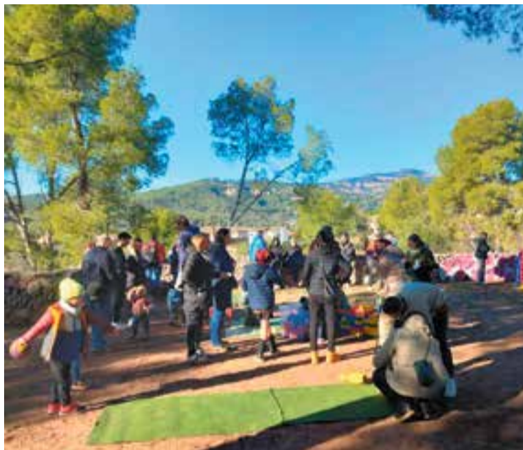
Activitats de Nadal i tió organitzades per l'Associació de Veïns de la Mitja Galta.

Els nens van trobar els tions esglaonadament i els posaven junts. “Quan van pujar al terrat jugaven molt amb el tió, fins i tot li donaven vermut!” . Aquest cap de setmana, encara queden algunes places. ➔