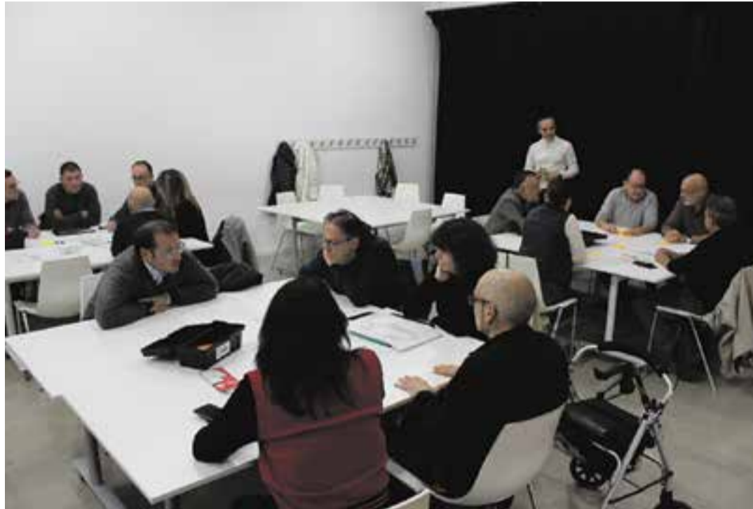
La Taula de Mobilitat, reunida a la sala Lluís Vallsarenys, per valorar la diagnosi sobre la mobilitat actual.

Un dels grans reptes d'aquest pla és millorar la mobilitat interna del municipi, tant a peu com en transport públic. "Hem fet molta feina millorant les condicions de la via pública, però encara en queda molta", va admetre Canals, que va recordar la necessitat de millorar el transport públic amb les ur-