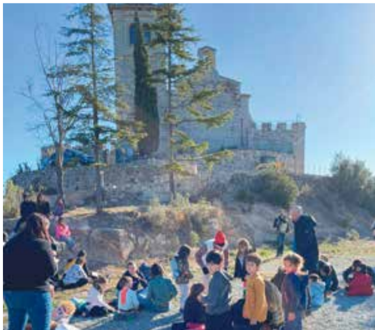
Famílies buscant el tió al Puig de la Creu, activitat organitzada per Arima Experiències.