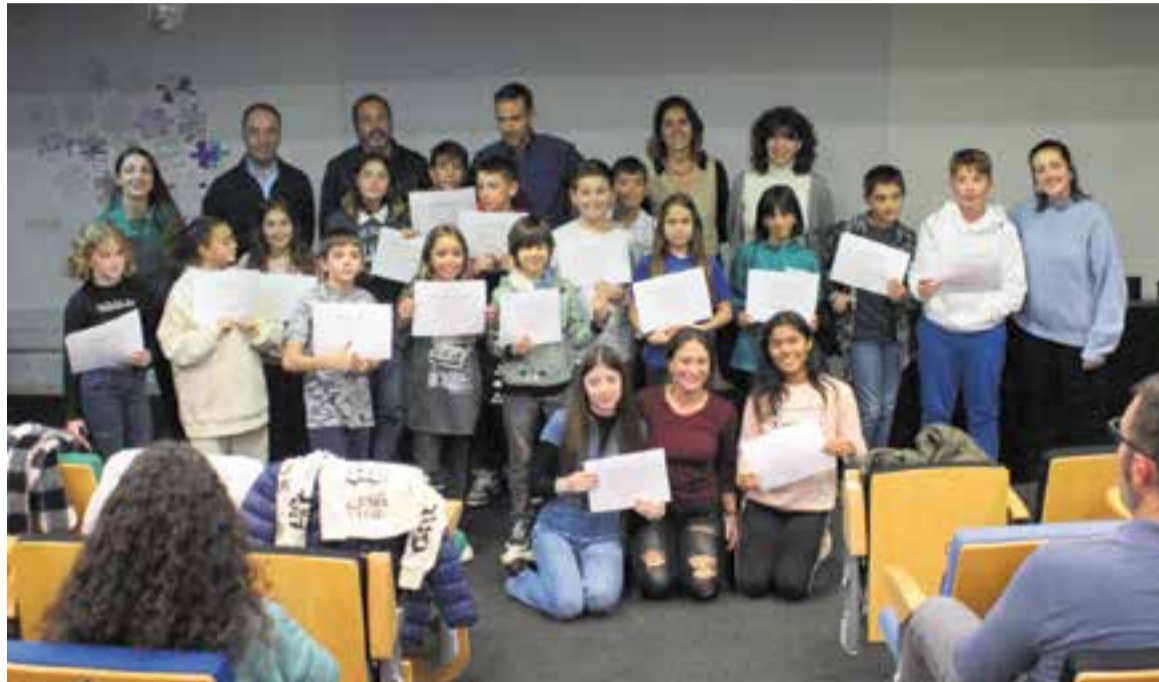
Foto de grup dels integrants dels consells d'Infància i Adolescència amb les autoritats presents a l'acte.

Enguany, pel que fa al Consell d'Infants, els representants dels vuit centres escolars han començat fent un repàs de les temàtiques que es van treballar l'any passat: neteja, extra-escolars, infraestructures i trànsit. També van precisar com van abordar aquestes tasques: "Vam sortir a analitzar el poble, i així poder observar millor quines necessitats hi havia, després vam demanar ajuda a professionals de les diferents te-