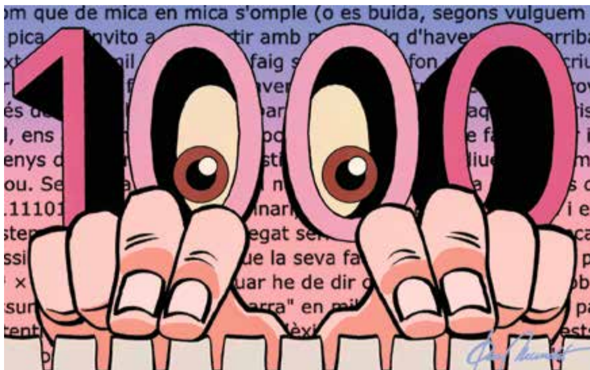
© Mil i un escrits. || JOAN MUNDET

"Aquest és el text que fa mil d'ençà que fa uns anys vaig decidir escriure'ls a esgarrapades"