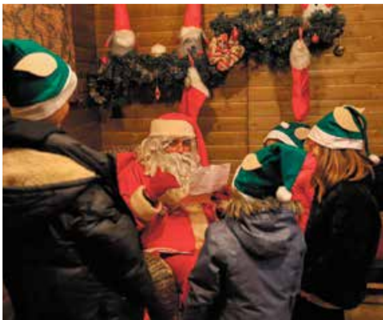
El Pare Noel llegint les cartes dels nens i nenes a Can Juliana.

Aquest parc d'activitats nadalenc s'allargarà fins al 23 de desembre