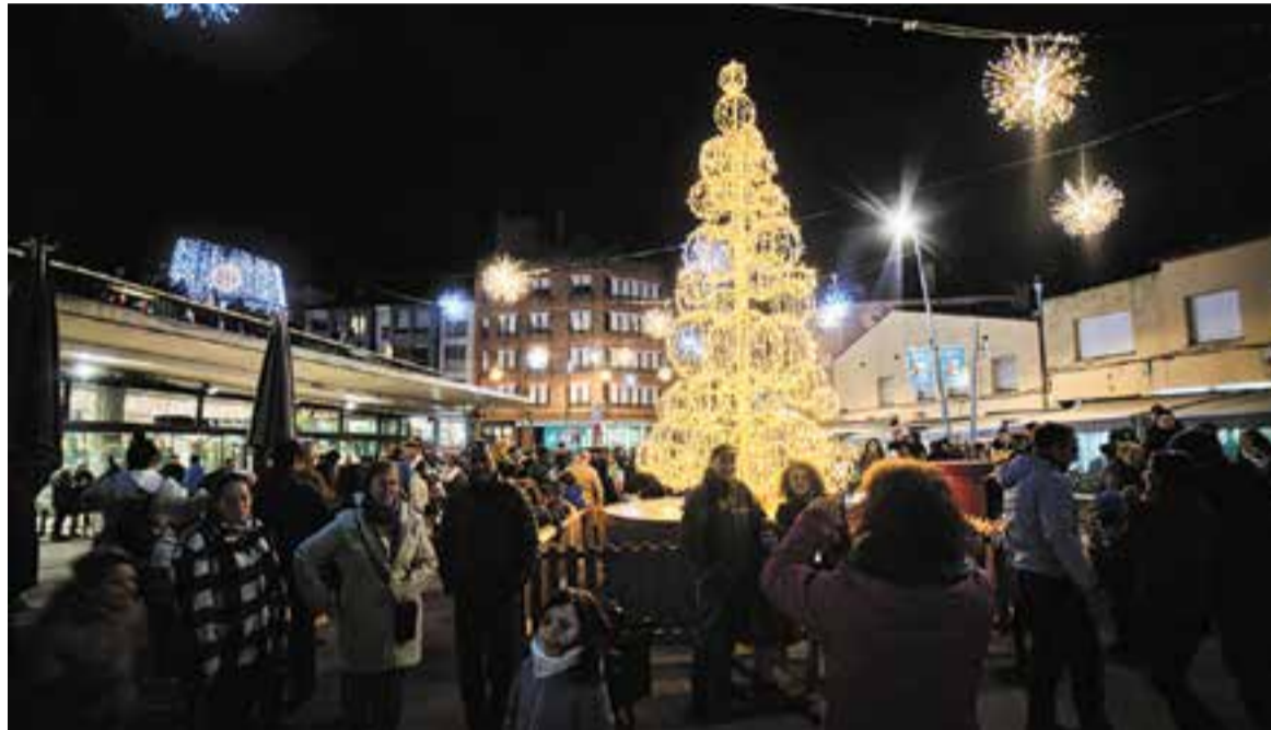
Una vegada es va encendre els llums de Nadal, moltes persones es van voler fer fotos amb l'arbre de la plaça del Mercat.

A l'altre extrem de la plaça es-calfava motors la gran plataforma de Le Piano , una mena de vehicle futurista a l'estil de la pel·lícula Mad Max . Tres músics de la companyia Efimer van pujar dalt del vehicle i van començar a tocar un seguit de temes actuals fent l'efecte de flautista d'Hamelín i arrossegant el públic fins a la plaça d'El Mirador. El que passa és que durant el recorregut es van trobar amb algun obstacle, cosa que va fer retardar l'inici de les llums de Nadal.