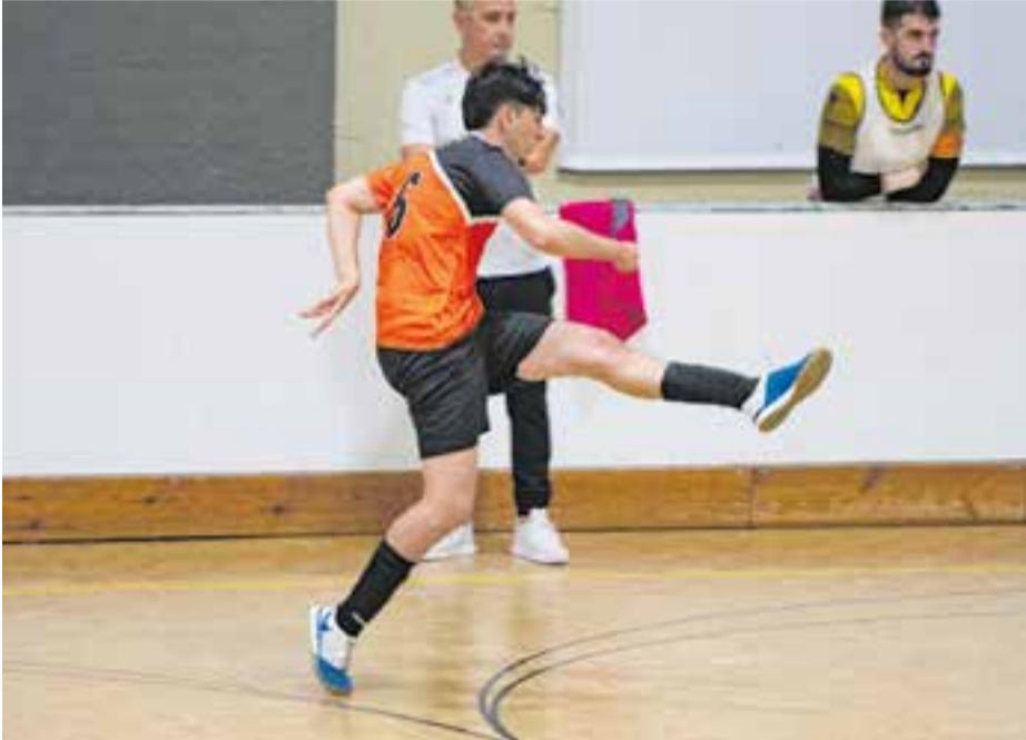
L'FS Castellar és especialista a superar equips de la part alta i perdre amb els de la baixa. || A. S. A.

Derrota inesperada de l'FS Farmàcia Catalunya Castellar contra el cuer, el Mataró B, per 1-6, en el segon entrebanc d'aquesta mena en menys d'un mes. Als taronges no se'ls resisteixen els equips de la part alta – han guanyat tres dels cinc primers – però perden els punts amb els de la part baixa.