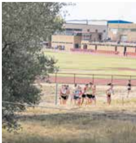
El cros torna amb un nou traçat.