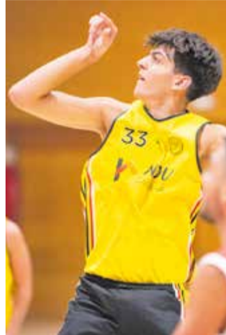
Gámez va fer 10 punts contra el Círcol B. || A. S. A.

Decepció en la segona part per al CB Castellar, que va caure per dos punts al Puigverd contra el Círcol B (54-56), després d'un partit completament dominat en la primera part.