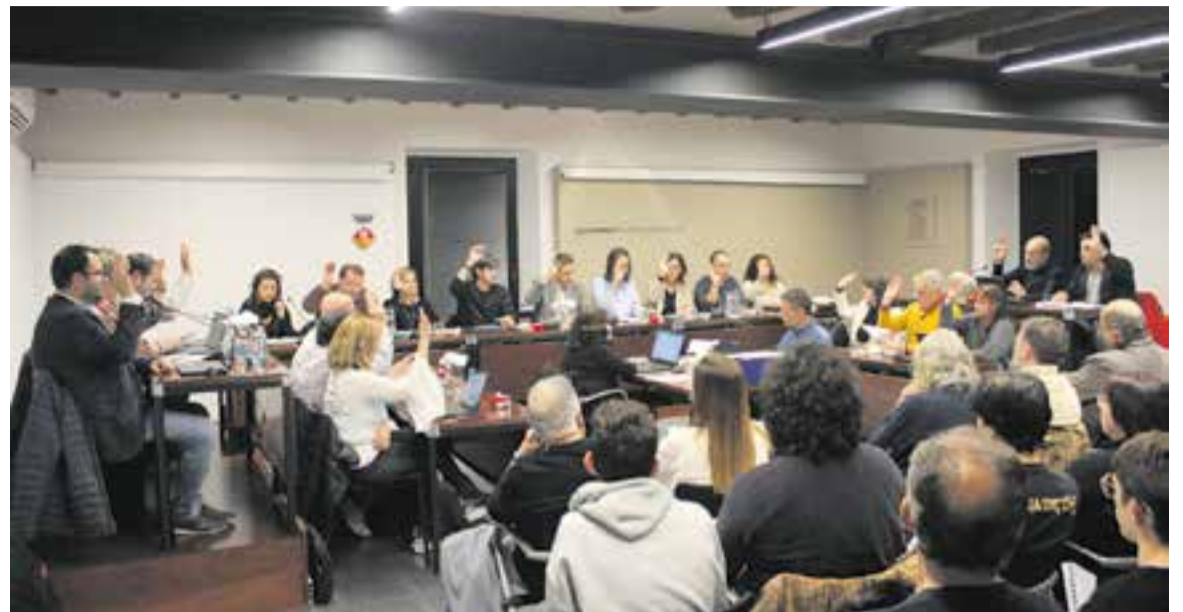
Una votació del ple del novembre passat.

Les negociacions prèvies amb l'equip de govern –que té majoria absoluta– també van aplanar el camí a