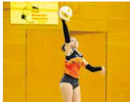
Segona victòria del sènior femení en Lliga.