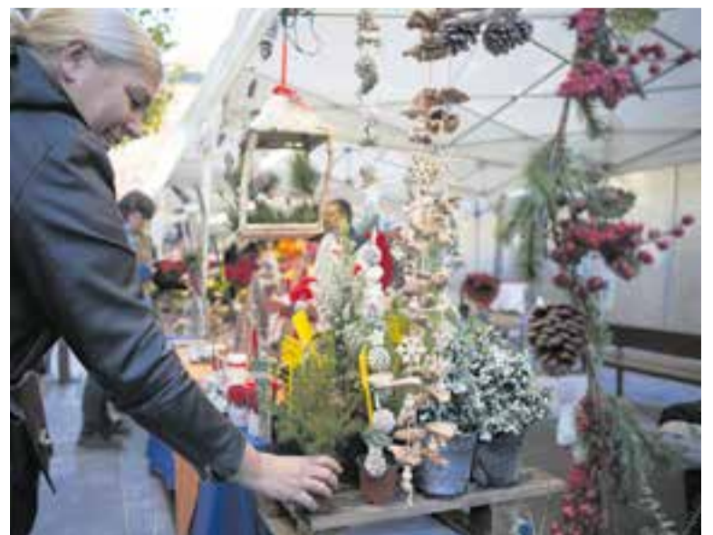
La Fira de Nadal es trasllada dels carrers de l'Illa del Centre a la plaça de la Fàbrica Nova. || Q.P.

Comerç Castellar ha programat el 17 de desembre la Xmas Street, entre els carrers Hospital, Montcada i Sala Boadella, amb tot un seguit d'activitats, abarcant així tot el cicle nadalenc. Aquest dia, després d'alimentar el tió de Nadal durant la fira, serà moment de fer-lo cagar. Al matí, es podrà fer entre les 10 i les 13 h o entre les 18 i les 19.30 h. El cor de gòspel Di-versions farà una actuació a partir de les 12.30 h; a les 13 h, Espai Art oferirà un concert de pop-rock, i els nens podran lliurar la carta al patge Geroni entre les 17 i les 19 h, mentre poden prendre una xocolata. Aquest dia també se celebrarà el sorteig de la macropanera de Comerç Castellar, amb productes i serveis dels establiments associats a l'entitat, i que s'haurà exposat durant la fira, aquest cap de setmana. +