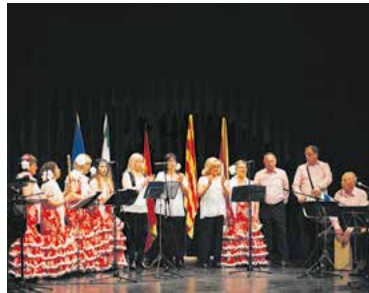
A la imatge, una de les actuacions passades del Coro Rociero Castellarenc.