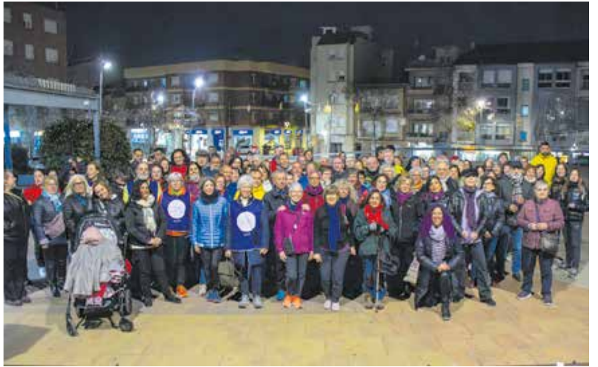
Un centenar de persones van participar en la ruta nocturna 'Petjades contra la violència masclista'.

Una vegada finalitzada la lectura del manifest, es va iniciar la caminada nocturna Petjades contra la violència masclista . Un centenar de persones van recórrer, amb la col-