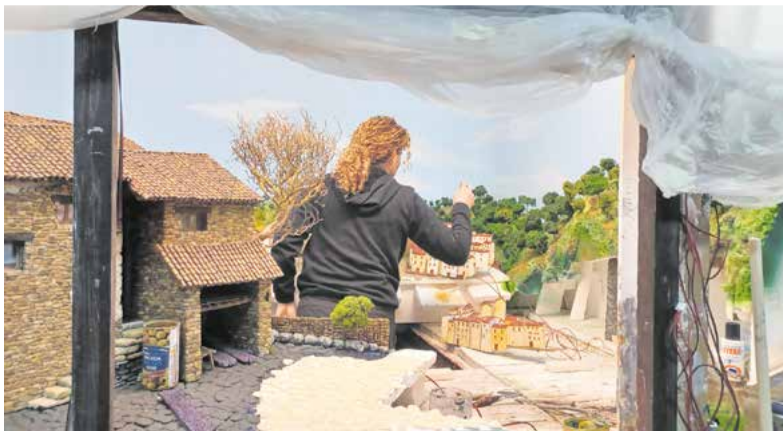
A la imatge, recta final d'un dels diorames que es podran veure a l'Exposició de Pessebres, enguany de mites i llegendes, del Grup Pessebrista de Castellar. || M. ANTÚNEZ

Enguany, s'han creat 15 diorames –un d'ells elaborat pel Taller de Pessebres– i cinc vitrines. “Una d'aquestes vitrines tindrà unes dimensions més grans que la resta, d'1x1 m” . Al pessebre 15, s'ha comptat amb la donació de figures de Pere Costa, de grans