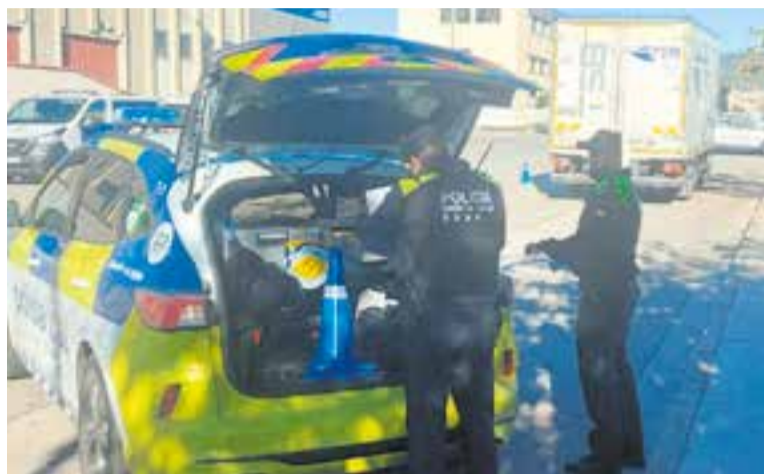
Control de la policia local efectuat la setmana passada.

Entre el 20 i el 26 de novembre el cos local va inspeccionar un total de 18 vehicles, 9 de transport lleuger (inferior a 3,5 tones de pes) i 9 de transport pesat de mercaderies (superior a 3,5 tones de pes). De resultes d'aquests controls s'han tramitat un total de vuit denúncies: tres per realitzar transport públic sense autorització, dues per conduir sense el certificat d'aptitud per a conductors professionals, dues més per ir-