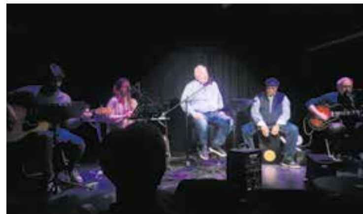
Actuació de l'Ànima de Bolero a L'Alcavot, en una edició passada.

Dissabte, 2 de desembre a les 20.30 hores, L'Alcavot Espai Cultural acull de nou un concert de la formació Ànima de Bolero, amb participació castellanenca.