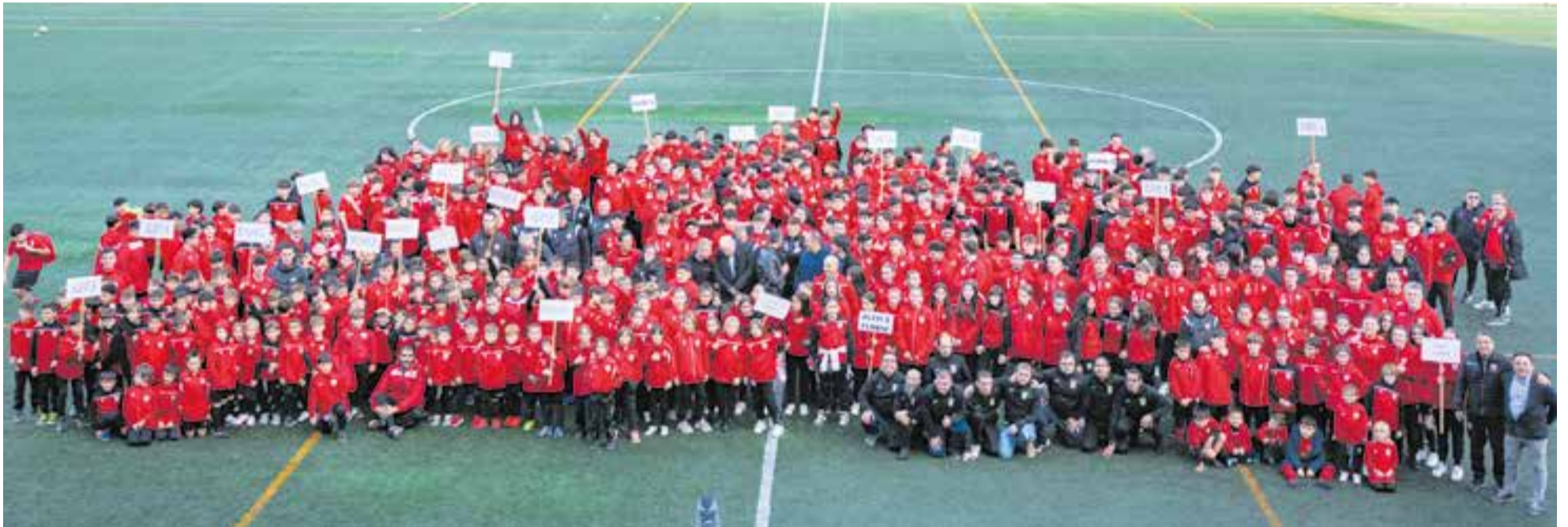
Més de 500 esportistes van passar per la gespa del Joan Cortiella-Can Serrador en la jornada de presentació dels equips de la temporada 2023-24. || A. SAN ANDRÉS

El club presenta els 37 equips de la temporada 2023-24 i amb 495 esportistes consolida el futbol com l'esport rei a Castellar