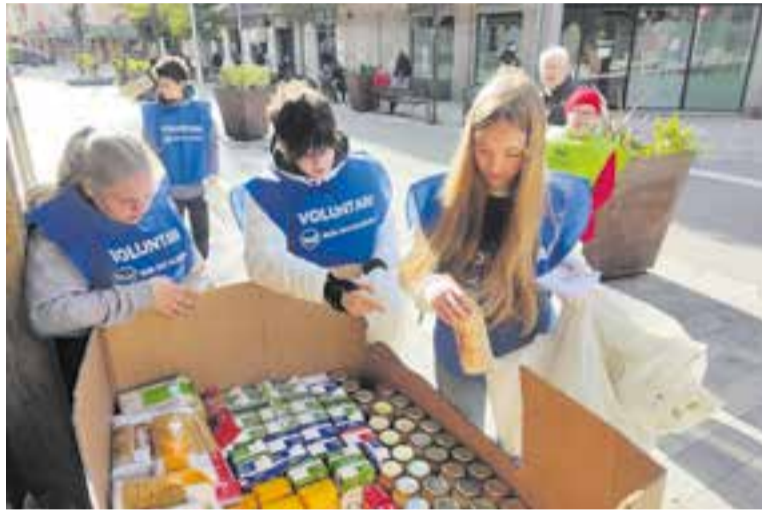
Alumnes del Casal fent de voluntaris durant la campanya del Gran Recapte.