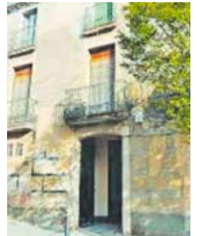
Entrada a Cal Gorina.

La notícia ha trascendit arran d'un comunicat fet per l'entitat Cal Gorina, associació que havia llogat durant 10 anys aquest espai ubicat al carrer Centre, 8, per a diverses activitats, en què valora positivament la seva compra per part de l'Ajuntament. D'aquesta manera, segons apunten en el comunicat, es podria donar continuïtat "a les entitats que promouen els valors democràtics, ecologistes i feministes al poble". També aprofiten per convidar altres associacions sorgides al nucli antic així com aquelles que estiguin interessades a afegir-se al projecte. El març del 2021 van tancar portes perquè no era possible mantenir econòmicament un immoble que es feia servir de forma comunitària per diverses entitats i col·lectius com les cooperatives de consum i Revaixe-