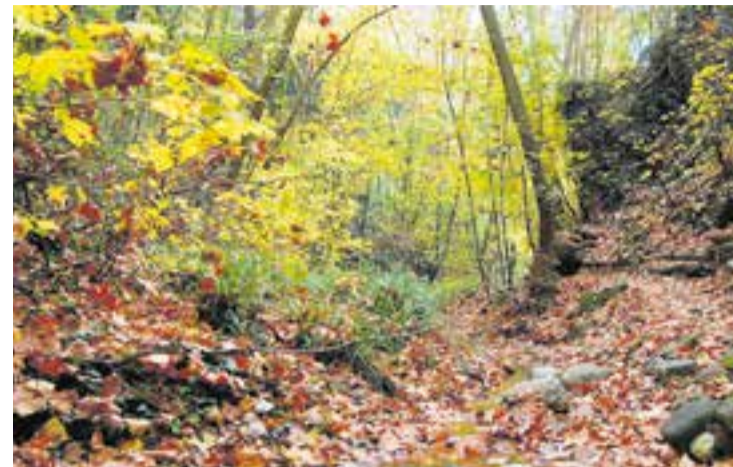
El torrent de Colobrers en una imatge d'arxiu.