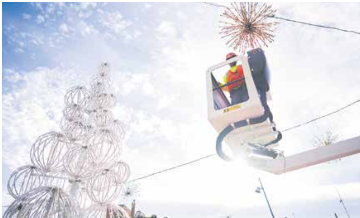
Un operari amb una grua col·locant l'arbre de Nadal i les diferents ornamentacions de la plaça del Mercat.

Els membres de la companyia faran un recorregut molt visual que passarà pels carrers de Tarragona, Suïssa i Barcelona, l'avinguda de Sant Esteve, el carrer de Sala Boadella, la carretera de Sentmenat, el passeig de Tolrà, la plaça Major i, finalment, la plaça d'El Mirador, que per segon any consecutiu acollirà l'acte final d'encesa de llums. Aproximadament a les 19.45 hores hi haurà els parlaments i l'encesa.