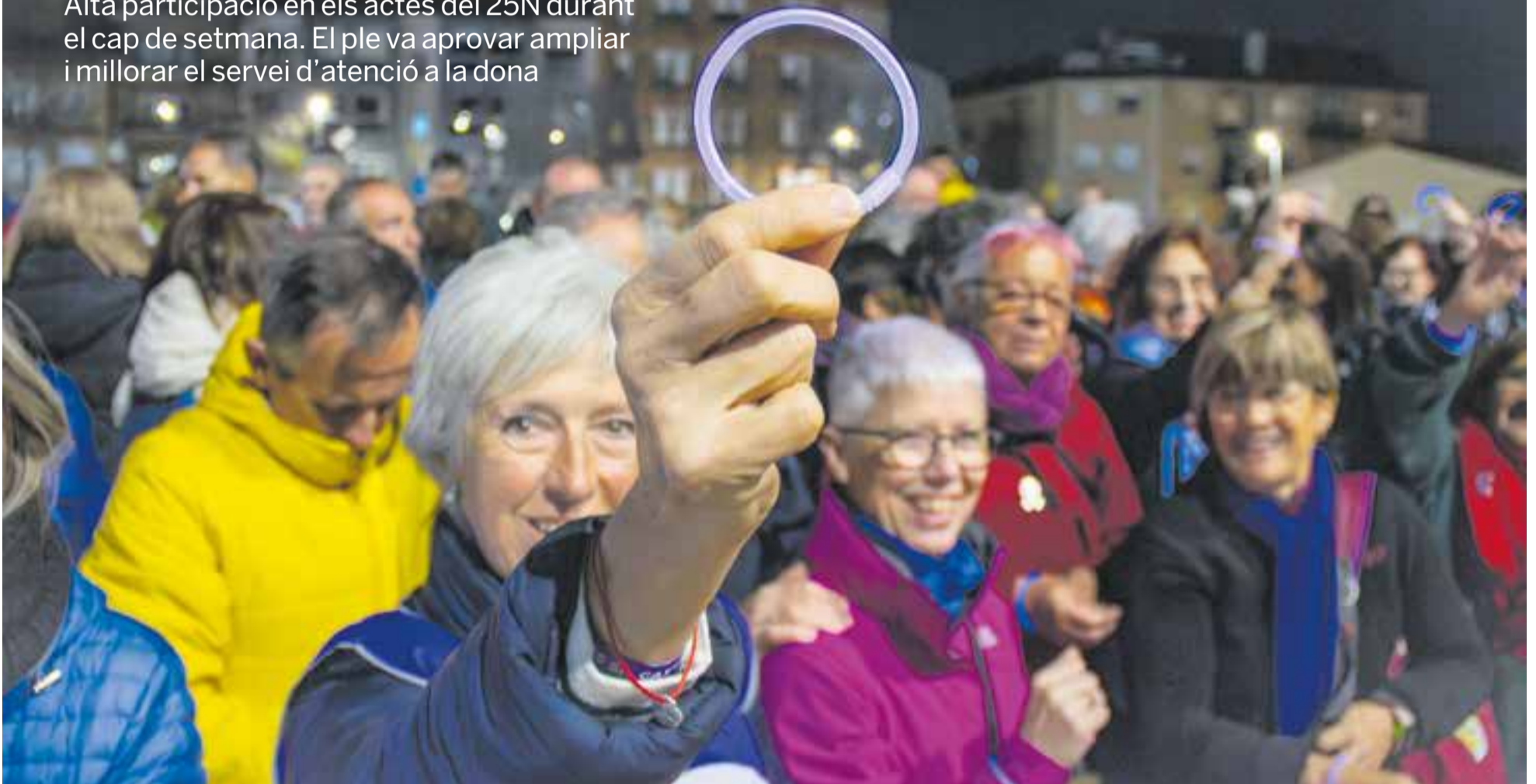
Una castellarenca mostra una de les polseres liles repartides per l'Ajuntament en la concentració a la plaça d'El Mirador per escoltar el manifest del Dia per l'Erradicació de la Violència vers les Dones.

Alta participació en els actes del 25N durant el cap de setmana. El ple va aprovar ampliar i millorar el servei d'atenció a la dona