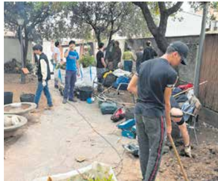
Alumnat de l'Institut Les Garberes fent treballs al pati del Grup Pessebrista. || J. J.