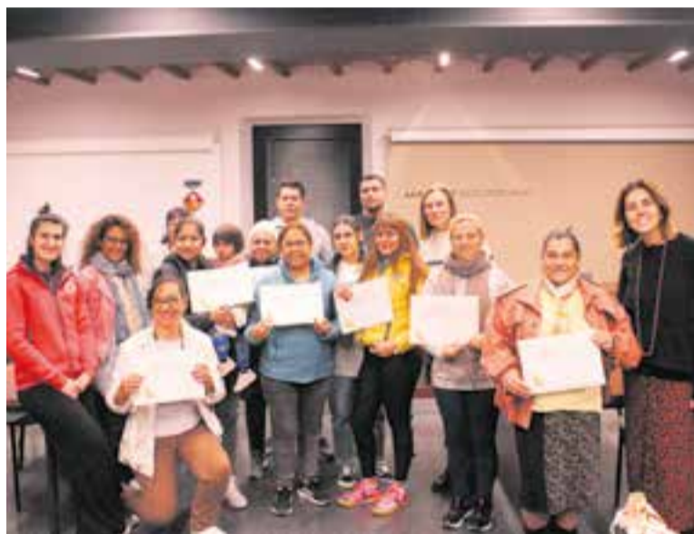
Els usuaris del Servei de Primera Acollida amb el certificat.

El Servei de Primera Acollida és totalment gratuït i facilita a les persones usuàries informació dels serveis i recursos de què disposen les persones nouvingudes. ➔