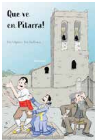
Proposta del grup Onze al Teatre.

El grup santquirzenc Onze al Teatre porta la proposta a la Sala de Petit Format