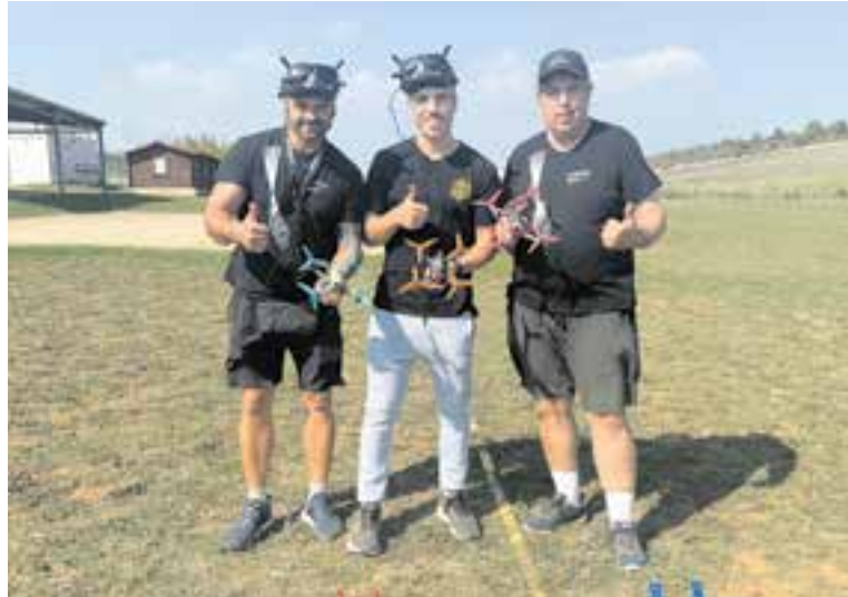
Tres participants de la Lligueta de vol de drons.

La jornada començarà a les 9 h amb entrenaments lliures i a la tarda començarà la competició. En torns de 4, els 24 pilots faran fins a 4 rondes en el circuit dissenyat on aniran acumulant punts segons la posició