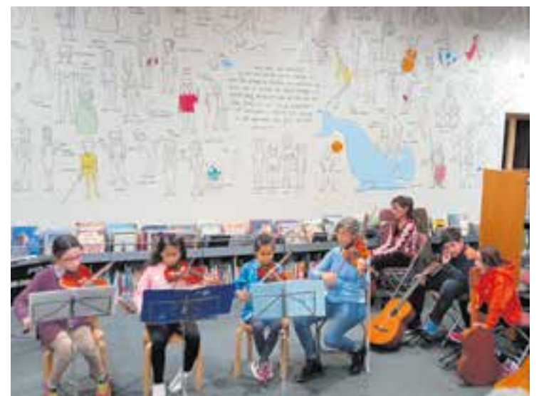
Moment del concert de Santa Cecília amb alumnes de Torre Balada.