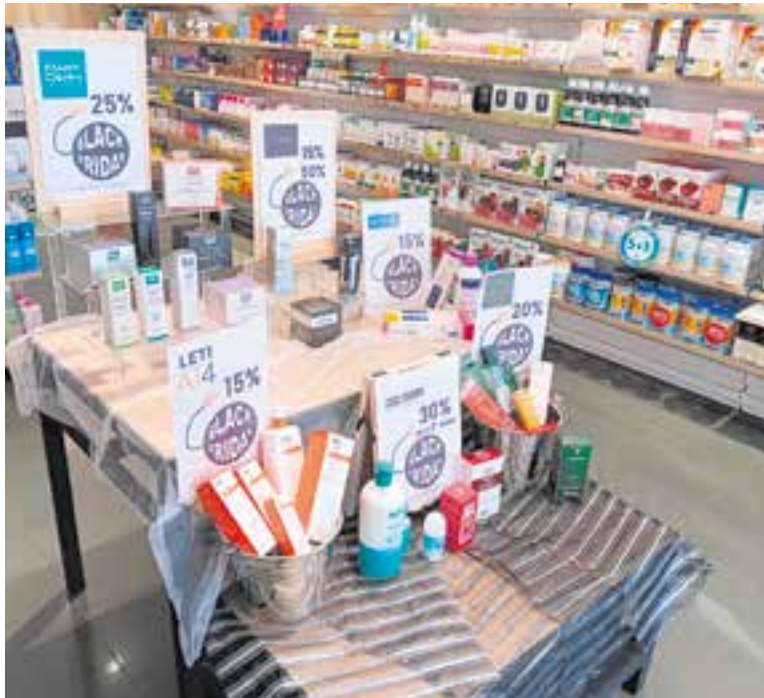
Interior de la Farmàcia Lluç amb diferents descomptes.

Les botigues castellenques fa setmanes que fan promocions pensant ja en Nadal