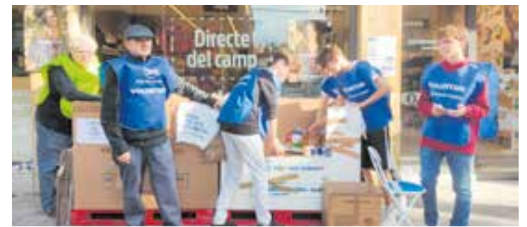
Voluntaris de Càritas i de l'escola El Casal recollint aliments l'any passat. || C. D.

També estan activats els canals per fer donacions econòmiques: a la web de gran recapte o a través del número de Bizum 33596. + || C. D.