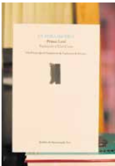
Portada d'En hora incerta'. || E. GUERRA

El castellarenc ha traduït les poesies d'En hora incerta