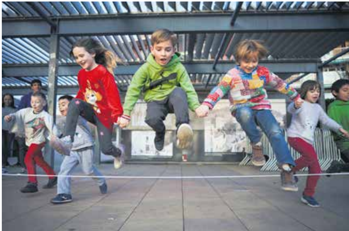
Infants participants a la celebració del DUDI salten la corda en una de les activitats organitzades pels esplais de la vila

Els esplais van treballar el dret a l'ajuda, el dret al joc, el dret a ser un mateix, el dret a ser escoltat, el dret a la participació, el dret a la pau i el dret a l'educació. "Podien anar passant lliurement per les proves i n'hi havia algunes que es feien en moments puntuals