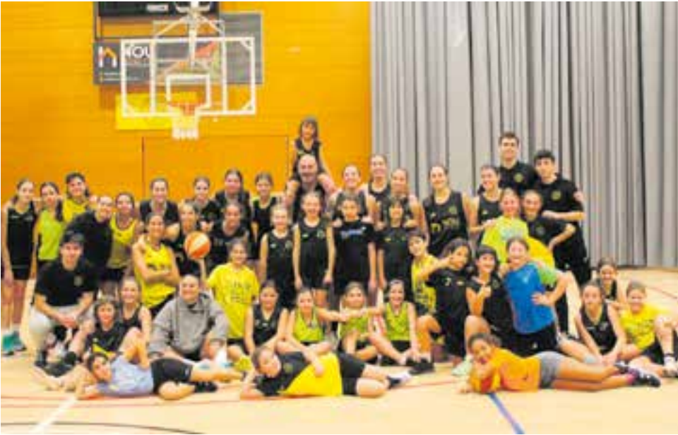
Els equips femenins van fer un entrenament conjunt que va agrupar una cinquantena de jugadores. || A. S. A.