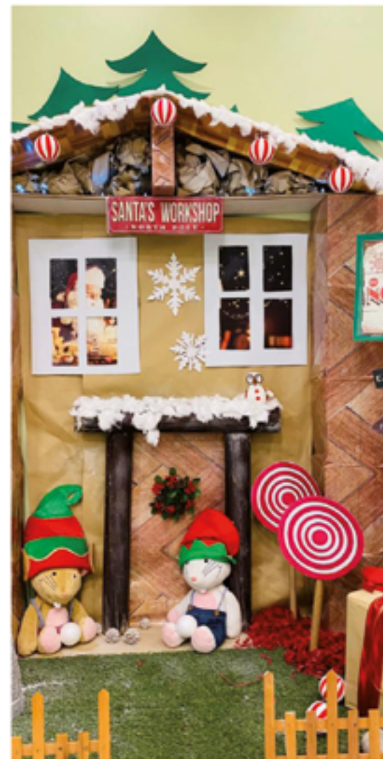
L'acadèmia d'anglès, Kids&Us, ofereix un aprenentatge divertit.

manera lúdica, l'has d'apuntar a les Fun Weeks de Nadal que ofereix Kids&Us Castellar.