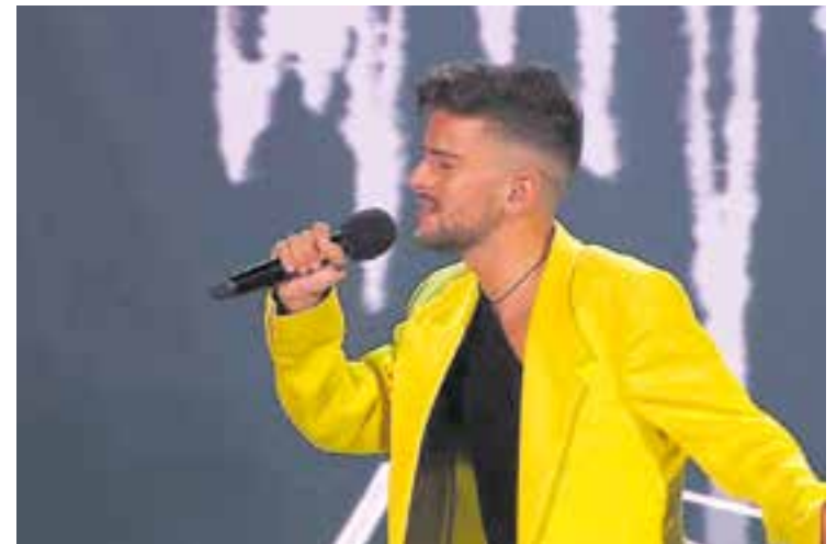
Imatge de Triquell, que actuarà el dia 22 al Recinte Firal de l'Espai Tolrà.

Les entrades es podran reservar al web de l'Auditori a partir d'avui a les 10 h