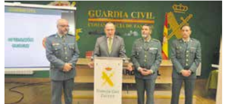
Responsables de la Guàrdia Civil de Zamora informant de l'operació.

La Guàrdia Civil de Zamora ha desarticulat un grup criminal amb ramificacions a nou províncies que es dedicava a cometre estafes bancàries mitjançant l'enviament de missatges SMS i comunicacions telefòniques amb les víctimes. S'han detingut dues persones a Castellar del Vallès per la seva presumpta pertinença a organització criminal i estafa, mentre que se n'han investigat dues més pels mateixos delictes i 54 més per estafa, tots joves d'entre 18 i 23 anys, segons ha informat la Guàrdia Civil de Zamora. Durant la investigació, que s'ha fet durant més d'un any i mig, es van registrar dos registres domiciliaris a Castellar, on es va confiscar material informàtic per valor de milers d'euros.