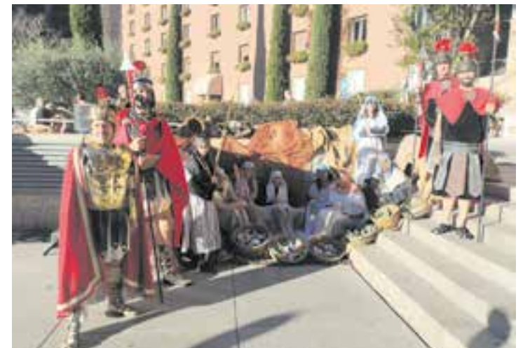
Figurants de Sant Feliu del Racó al Pessebre Vivent a Montserrat.

El macropessebre ha servit de punt d'inflexió als de Sant Feliu, "que potser oferirem una sorpresa al públic que ens vingui a veure enguany!". ✦