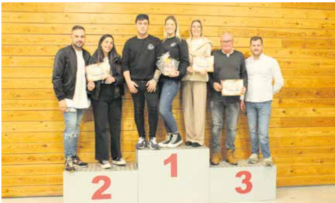
Els representants de Come y Caña, La Taverna del Gall i la Gallina i Bruna Burger Grill en el podi de guanyadors.